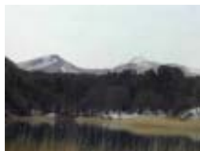
弁天沼から磐梯山