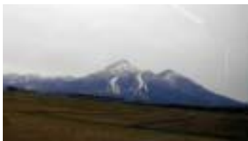
会津磐梯山 猪苗代側から