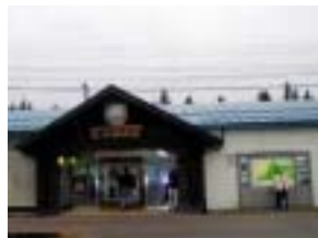
磐越西線猪苗代駅