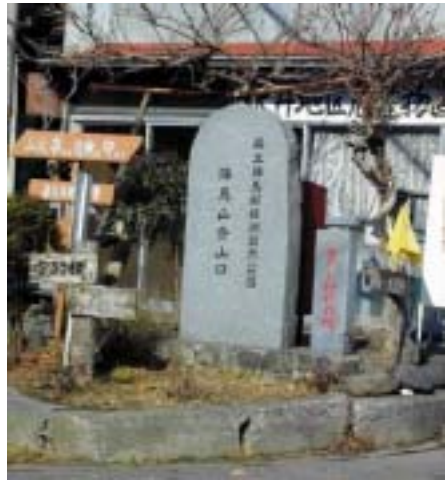
藤野町 沢井 登山口