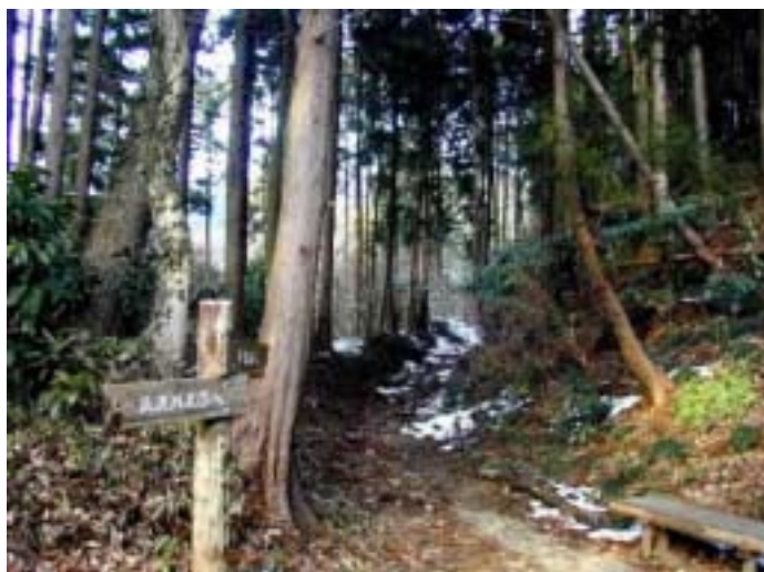
小仏峠から底沢への下り 旧甲州街道

の間から見え出し、程無く谷の入口底沢の河原に飛び出し下山完。 振り返ると遙か上方に小仏峠の尾根筋が見える。昔の旅人はこの見上げる峠への山道に難渋した事だろう。今甲州街道は 見あげる小仏峠の下の山腹を中央自動車道と中央線がトンネルで通過している。甲斐・武蔵国境の壁となって、陣馬山から小仏峠を通過して高尾山の尾根筋を直角に山越へするの小仏峠の大変さを今更ながら実感。