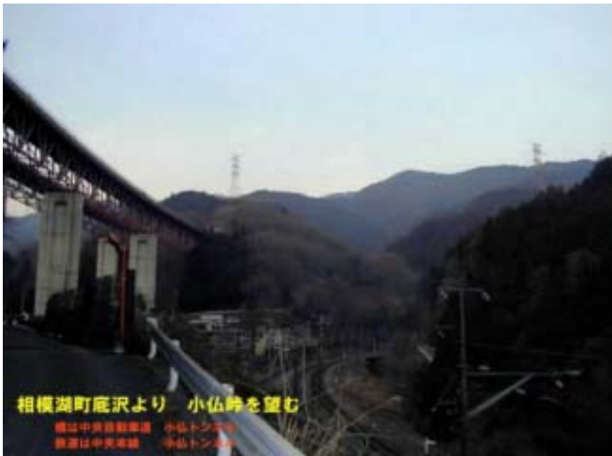
底沢から小仏峠を望む 中央自動車道・中央線トンネル

下山後 藤野町の姪に聞くとこの高尾・小仏峠・陣場山の尾根筋を走る山岳マラソンがあるという。そういえば 一人雪の尾根道を走っている人に出会いましたが、その練習かも。こんな雪道走って・・・物好きなと思いましたが・・・