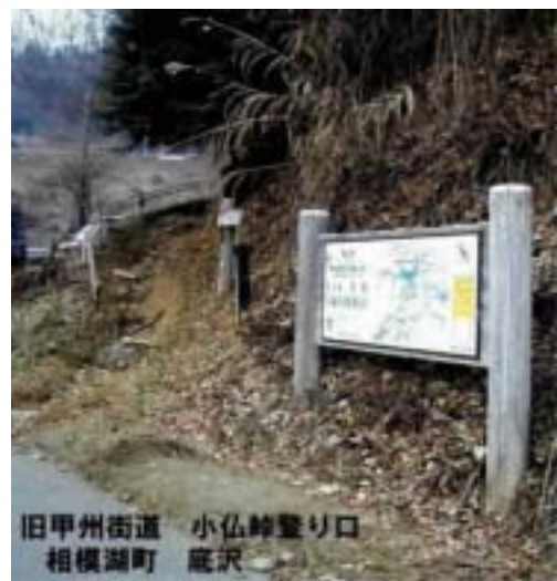
底沢 小仏峠への登り口