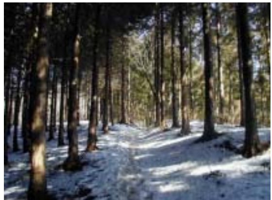
残雪が一杯の一の尾 尾根 登山道