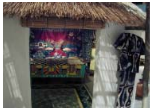
この「西アフリカ おはなし村」 村]