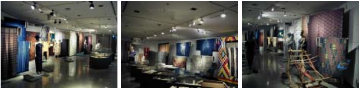
2F 展示場に展示された西アフリカの染めと織

日本の着物と同じく その紋様や色・染め・織りに歴史があり、意味が村の人達によって代々受け継がれて、今見てもその斬新さに目を奪われます。