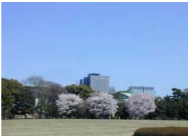
皇居 北の丸公園より 丸の内ビル群