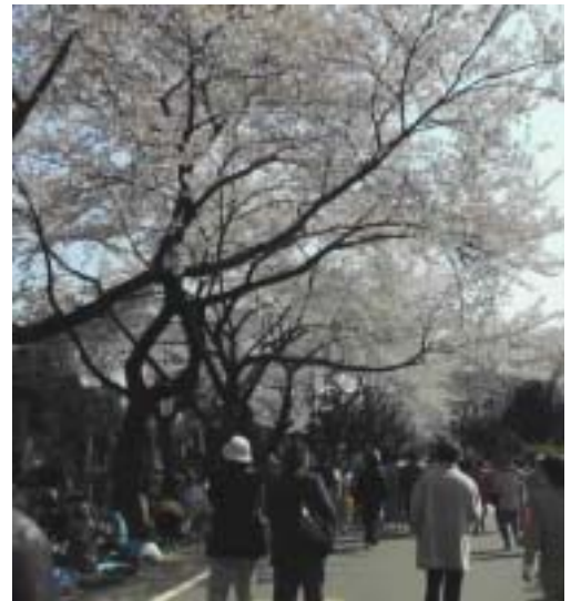
谷中墓地の花見散策 2003.4.6.

谷中から根津まで谷中の霊園の桜を見て根津の「笹乃雪」で江戸の豆富(豆腐)料理を味わって鶯谷でカラオケで盛り上がりました。