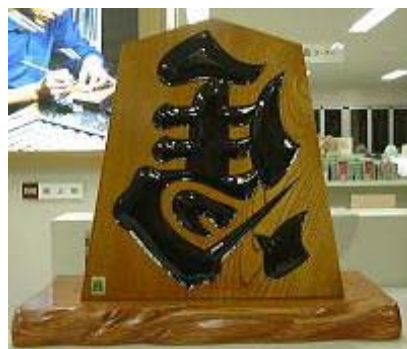
左馬介湖上渡りの図