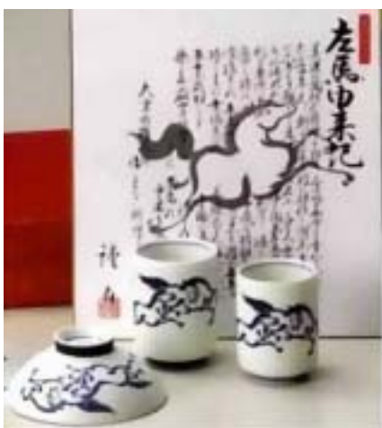
右向に描かれた馬の絵

「左馬の茶碗」の由来は色々あるようですが、縁起もので陶芸の世界では新しく窯を開いた時に馬の絵や漢字「馬」を右向きに茶碗に描き、その初窯で焼いて世話になった人やお客さん等関係者に配るならわしが在るのだそうです。そして、この茶碗を使うと脳梗塞や脳血栓などの病気にかかりにくいとの言い伝えがあり、縁起の良いものとされています。