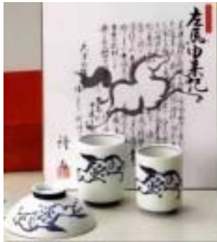
右向に描かれた馬の絵

この様な「左馬が縁起が良い」説と、「家を新改築した際の初風呂に入れば中風にならない」とか「初物を食べれば75日長生きをする」などという素朴な初物信仰が一緒になって、初窯で左馬飯茶碗を焼いて配るという風習が出来たのであろうと推測されます。