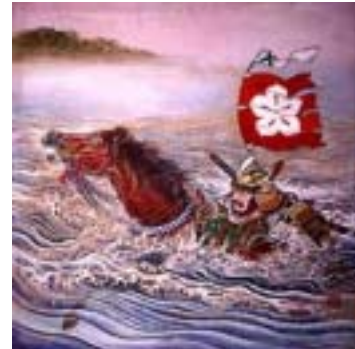
左馬の駒 (矢先稲荷神社天井絵より)