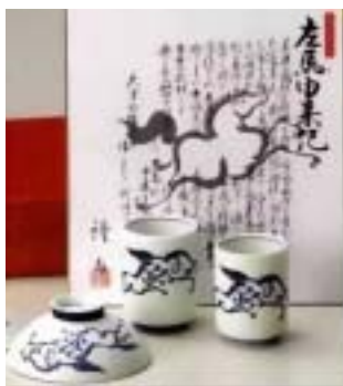
右向に描かれた馬の絵

備前に限らず他の窯業地でも新しく作られた窯に火を入れる時、右向の馬の絵、又は漢字「馬」を逆字でかいた飯茶碗を焼いて関係者に配る習わしが有ります。左馬茶碗と 言い、これを使うと「中風」にならないと言われ縁起の良い物とされています。