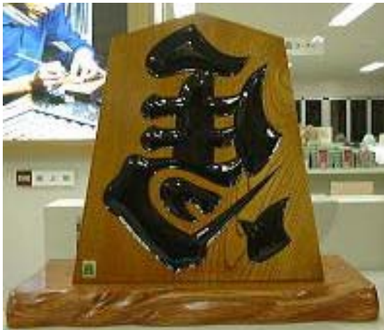
左馬の駒 (天童市パンフレットより)