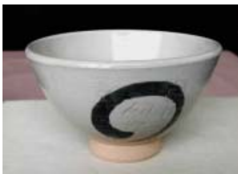
裏「陶房葉月、初窯、平成十三年十月」の彫り 藍色の丸は円で、縁があります様にとの願い がこめられている。