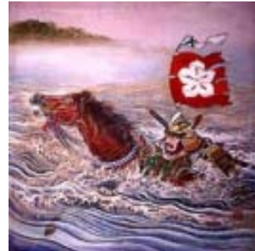
左馬の駒 (矢先稲荷神社天井絵より)