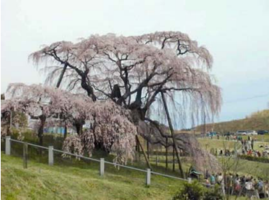
福島県 三春町 天然記念物 『滝桜』 2002.4.6.

周りが山でさえぎるものは何も無し。山の斜面をバックに 堂々と手を広げ花を咲かしているのが実に良い。