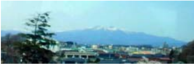
福島県 郡山から 会津磐梯山 2002.4.6.