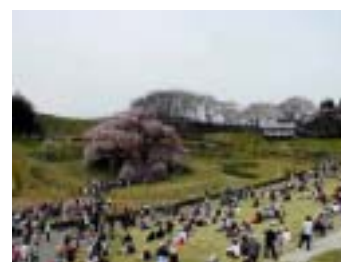
座り込んで「滝桜」を見あげる人達

小1時間ばかりこの『滝桜』の周りで桜をながめて帰りました。誰に話すでもなかったですが、ちょっと興奮気味。桜の名所は沢山ありますが、一本の桜の木の周りに座って その大きさというか 老木の風格に圧倒されながら あっけに取られて見た桜は初めて。本当に一度は見る価値があります。この感動は写真では味わえないと思います。