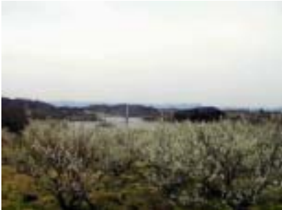
梅と桜がイッセイに咲く三春ダム