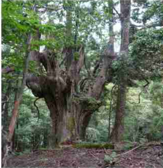
大櫓杉 根元周り 約10m

伏桑台杉は日本海側に分布するウラスギの一種の芦生杉。枝を長く伸ばしたものが毎年雪に押さえられているうちに地面に着き根を出して枝が幹となり、新しい株に成長する伏桑更新により繁殖。森全体が根で繋がっているかも???