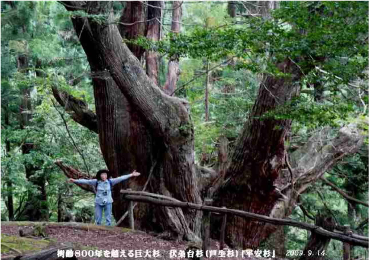
樹齢800年を超える巨大杉 伏糸台杉(芦生杉)「平安杉」 2009. 9. 14.