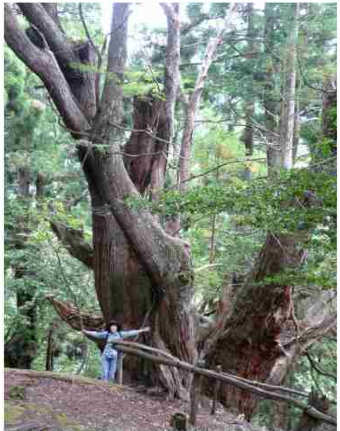
根元周り15.1mの平安杉〔参考 縄文杉は胴回り16m〕