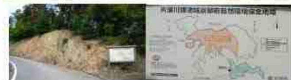
伏条台杉〔芦条台杉〕群生保護地域入口周辺 片波林道 2009.9.14.