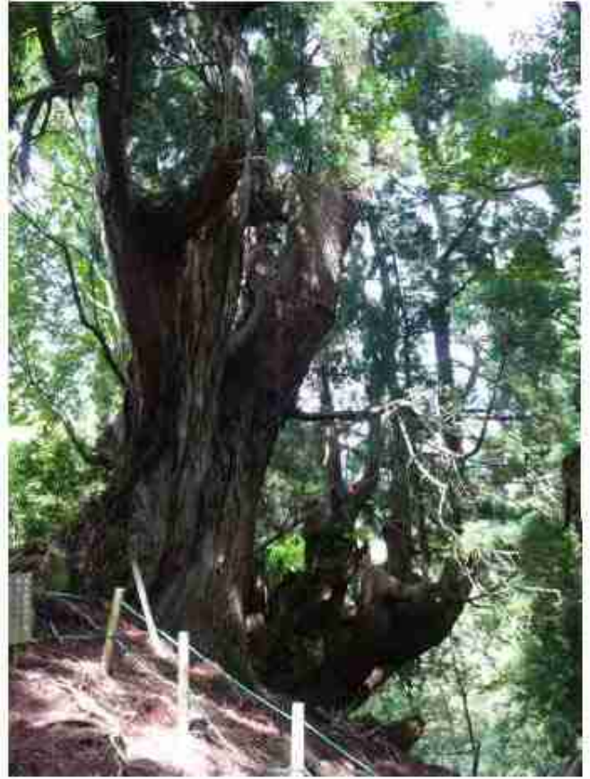
片波川源流 伏奈台杉〔芦生杉〕群生保護地域で 2009.9.14.