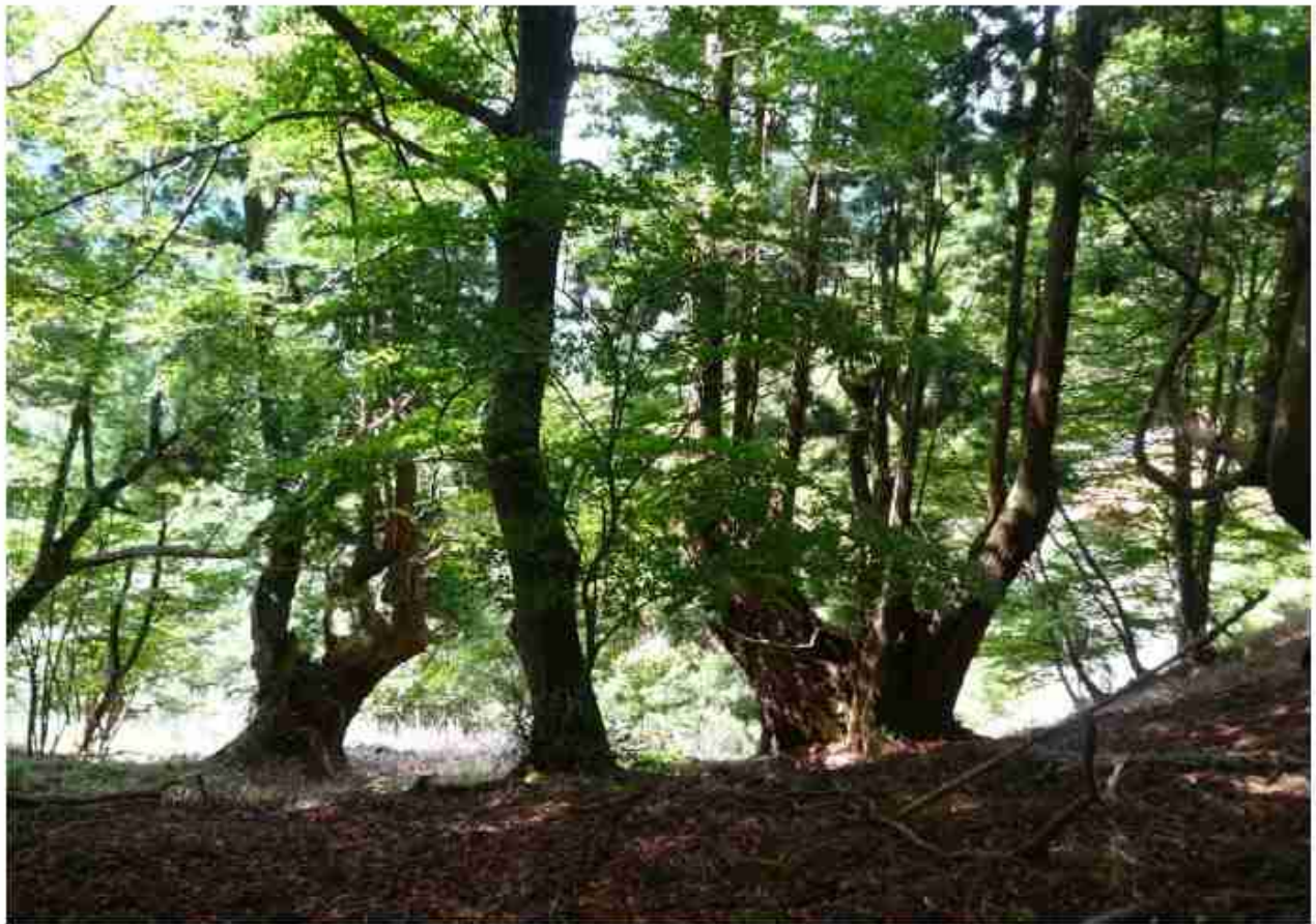
片波川源流 伏条台杉〔芦生杉〕群生保護地域で 2009.9.14.