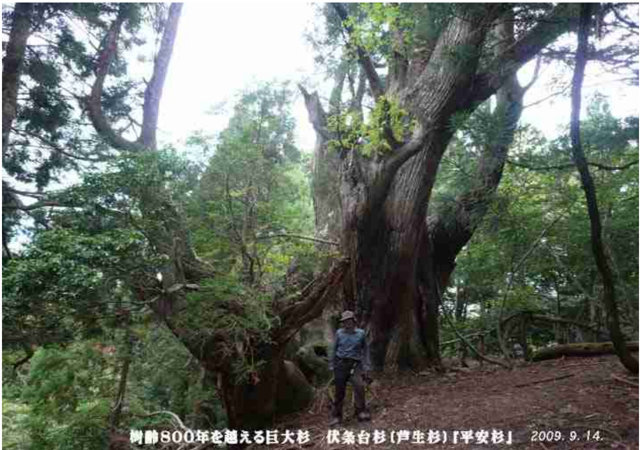
樹齢800年を超える巨大杉 伏糸台杉(芦生杉)「平安杉」 2009. 9. 14.