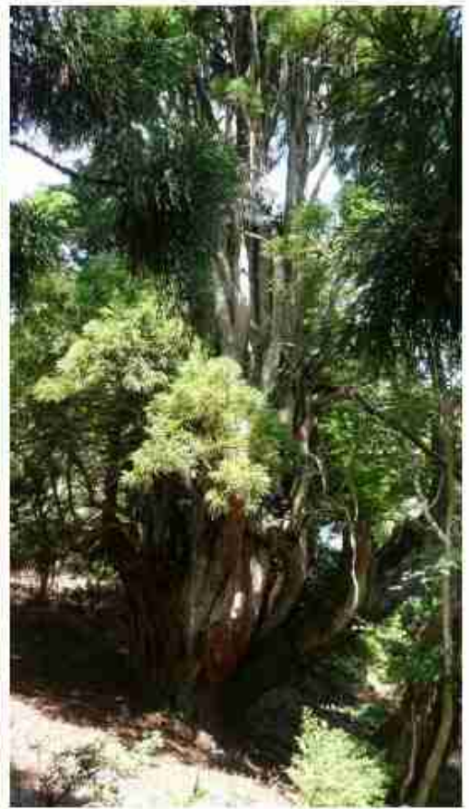
大榎杉 根元周り 約13m 片波川源流 伏糸台杉〔芦生杉〕群生保護地域で 2009.9.14.