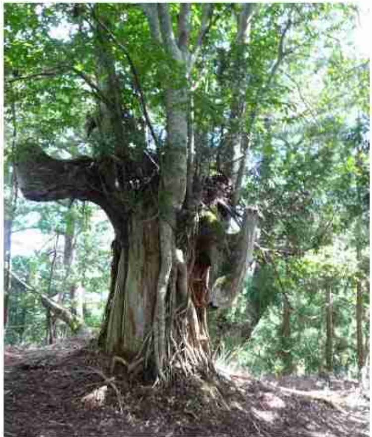
6種の木が宿る宿杉