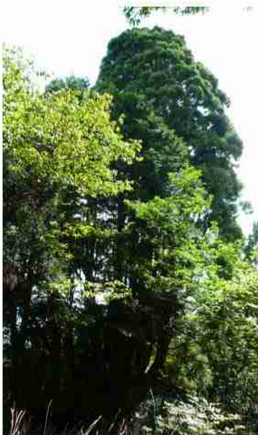
高さ最大32mの谷守杉