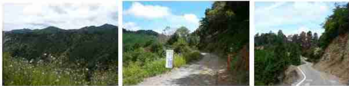
片波林道 伏条台杉〔芦生杉〕群生保護地域 入口周辺 2009.9.14.

谷筋から入って、斜面に沿って尾根筋を登ってゆく片波林道の頂上部近く、林道脇に群生保護地域の案内板があり、これが目印でした。