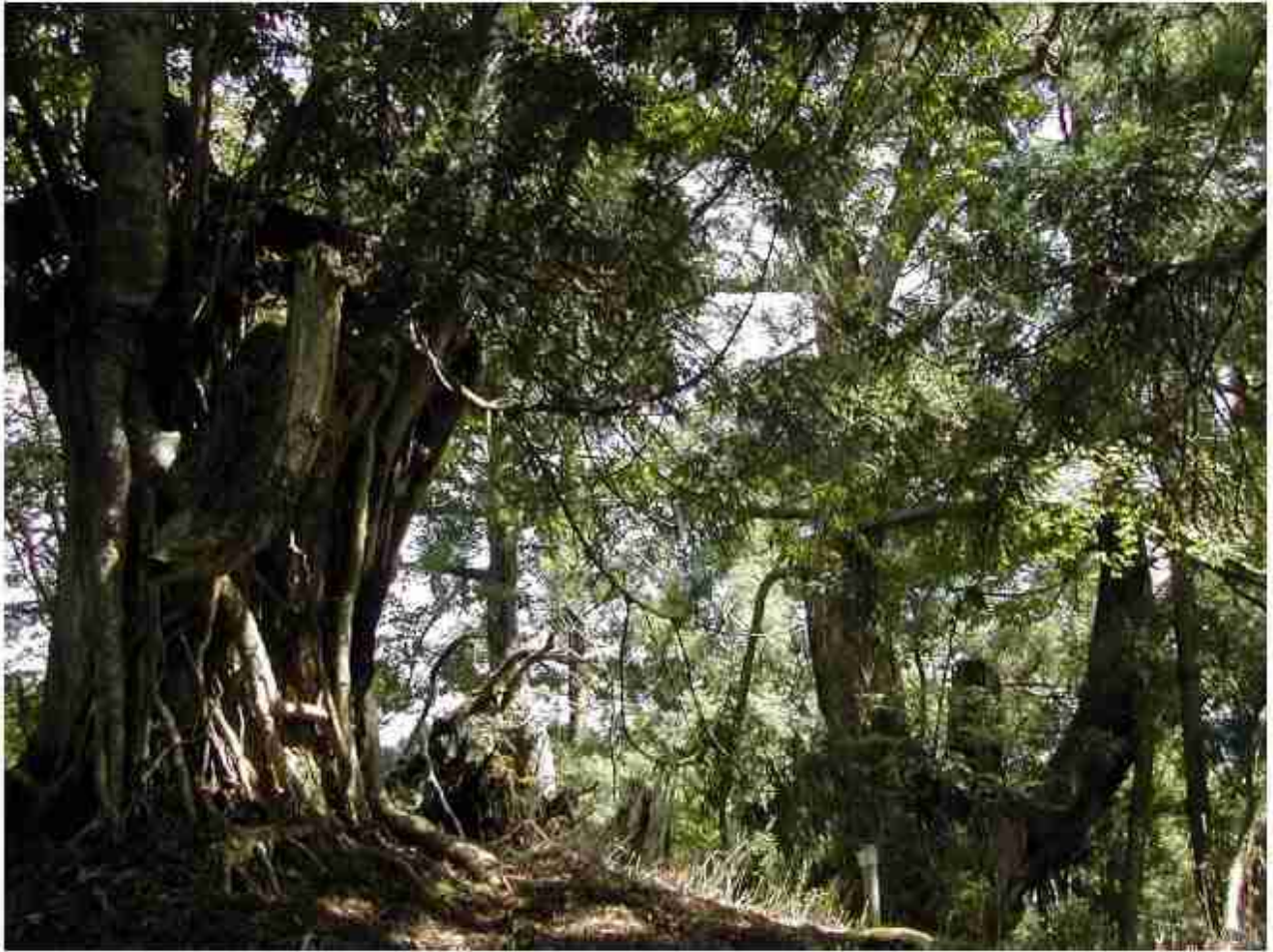
片波川源流 伏条台杉〔芦生杉〕群生保護地域で 2009.9.14.