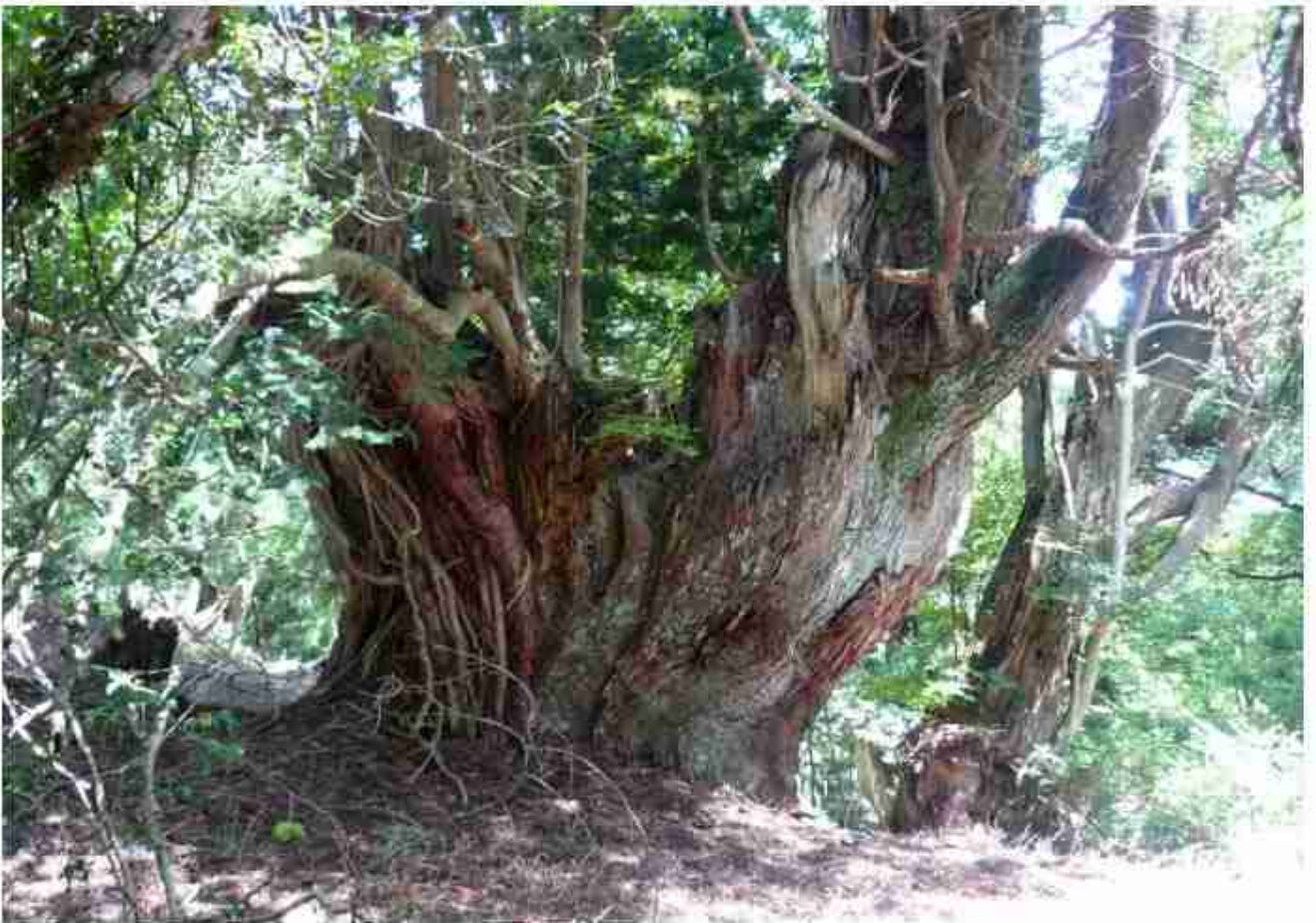
大檜杉 根元周り 約13m 片波川源流 伏奈台杉〔芦生杉〕群生保護地域で 2009.9.14.