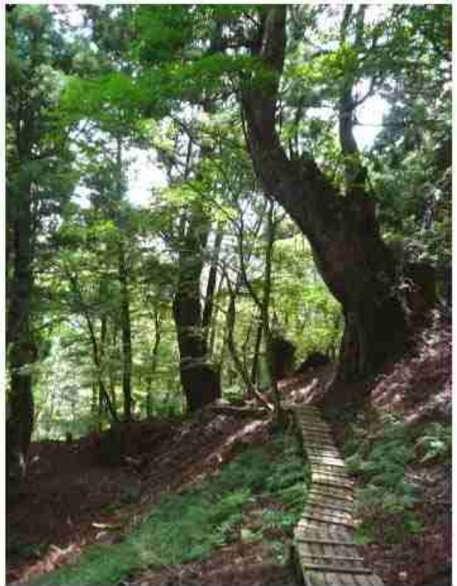
片波川源流 伏糸台杉〔芦生杉〕群生保護地域で 2009.9.14.