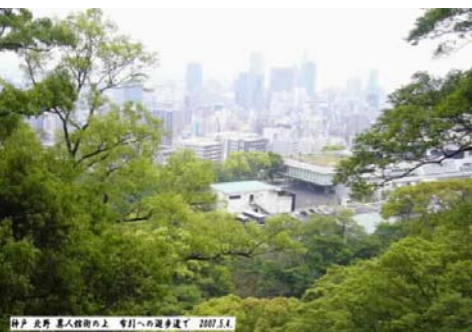
神戸 北野 異人館の上 布引への散歩道で 2007.5.4