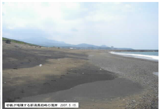
砂鉄が堆積する新潟県柏崎の海岸 2007. 5. 15.