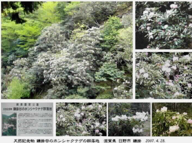
天然記念物 鎌掛谷のホンシャクナゲの群落地 滋賀県 日野市 鎌掛 2007.4.28.

今年は花の少ない裏の年 でも鎌掛谷の群落の崖には 石楠花が清楚な花を一杯つけていました