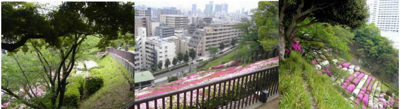
神戸北野 旧水源地のツツジ 2007.5.4.