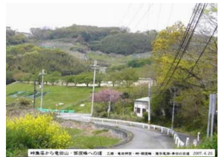
神楽谷から龍田山・笠置峠への道 上級 竜田川・神楽谷・神楽谷 龍田川・神楽谷の古道 2007.4.20.