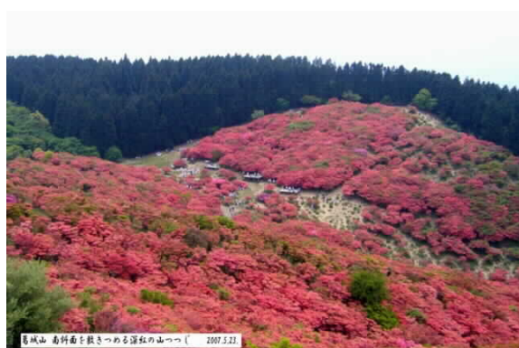
葛城山 南斜面を敷きつめる深紅の山つつじ 2007.5.23.