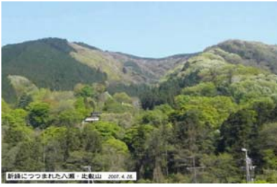
八瀬からみた比叡山・蛇が池の峰