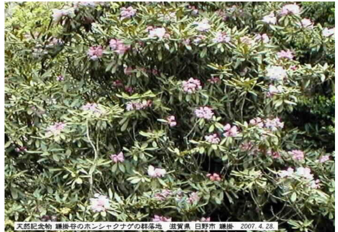
天然記念物 鎌掛谷のホンシャクナゲの群落地 滋賀県 日野市 鎌掛 2007.4.28.