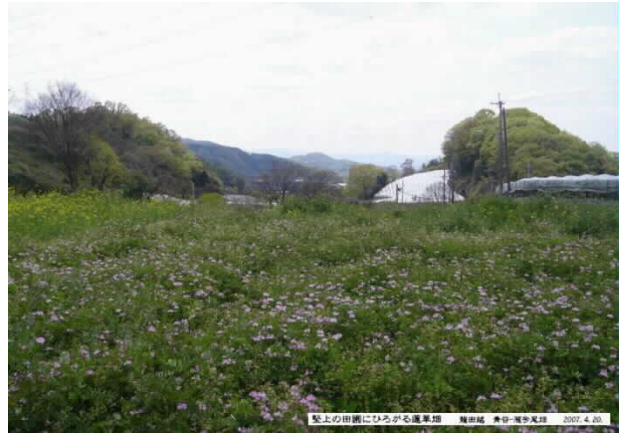
聖上の田圃にひろがる蓬菜畑 龍田越 奥谷-滝歩足跡 2007.4.20