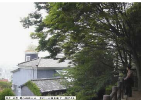
神戸 北野 異人館の上 布引への散歩道で 2007.5.4