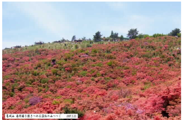
葛城山 南斜面を敷きつめる深紅の山つつじ 2007.5.23.