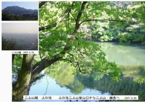
二上山登山口 二上山 上の池

現代はここを近鉄南大阪線と国道165号線が越え、山の南側を竹之内街道 南阪奈道路が越えてゆく