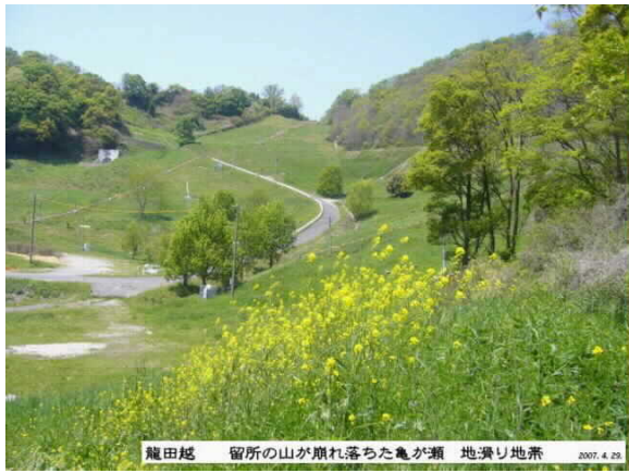
龍田越 留所の山が崩れ落ちた亀が瀬 地滑り地帯 2007.4.20