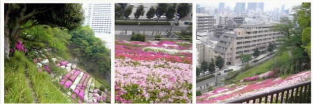
神戸 北野界隈 旧水源地のつつじ 2007.5.4.