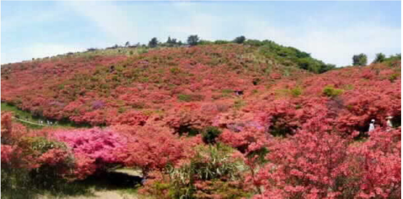
葛城山の南斜面 深紅の花を敷きつめる山ツツジ 2007. 5. 23.