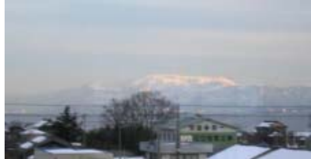
伊吹山の南に連なる鈴鹿の峰

こんな伊吹 意識したことはなく、ぼくの感覚からすると、伊吹は大津からづつと東の方の山で、大津から北近江へやってきて、伊吹が真近に見られるなんて頭になし。また、僕の頭にある伊吹山と随分イメージが違う。