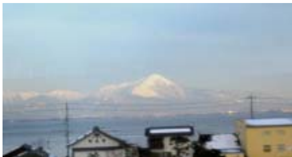
琵琶湖の対岸にそびえる伊吹山

うそやと思っていましたが、マキノからの帰り、近江今津から安曇川への車窓からは本当にピラミダルのすばらしい形をした伊吹山 そして 南のほうには鈴鹿の山々が 琵琶湖の向こうに雪をいただいてそびえていました。