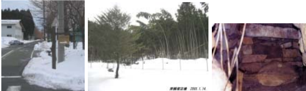
西牧野にある斉頼塚古墳と其の内部にある石棚

再度 メタセコイアの並木道にでて 雲からの光が雪原に映えるのを楽しみながら下る。