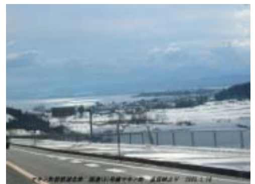
追坂峠から琵琶湖北岸を望む

追坂峠周辺は古代近江の鉄精錬を支えた鉄鉱石が産出されたところ。そこからおそらく産出された鉄鉱石は海津から船で琵琶湖を渡り、瀬田丘陵にあった源内峠など大和政権が管理する湖南の古代製鉄遺跡群に送られたと考えられている。