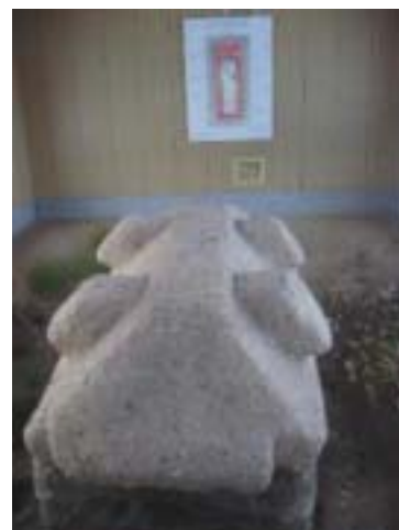
鴨稻荷山古墳概要展示 高島町歴史民俗資料館 & 鴨稻荷山遺跡出土 石棺