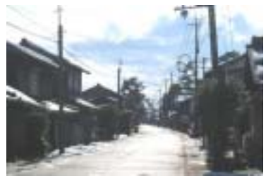
近江今津 湖岸の旧街道

駅から出て直ぐのところに「琵琶湖周航の歌」記念館。琵琶湖周航の歌が館内に流れていました。長いこと歌わぬ「琵琶湖周航の歌」そして同じ節で歌う「琵琶湖哀歌」両方の歌詞と楽譜が印刷物になっていて、貰ってきました。琵琶湖周航の歌の新旧6番までの歌詞 そして 琵琶湖哀歌。もう忘れかけていた歌詞ひとつひとつに学生時代 比良の山小屋に通った時を思い出していました。館のお嬢さんとひとしきり話して このマキノ・高島地区の地図をもらう。また、港に琵琶湖周航の歌の歌碑があというので館をとびだす。