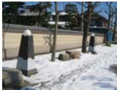
琵琶湖周航の歌が一番づつはめ込まれた道標と港にある歌碑