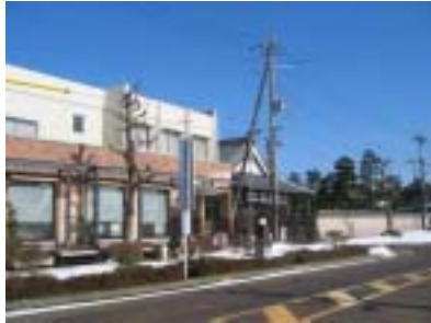
琵琶湖周航の歌記念館

駅から出て直ぐのところに「琵琶湖周航の歌」記念館。琵琶湖周航の歌が館内に流れていました。長いこと歌わぬ「琵琶湖周航の歌」そして同じ節で歌う「琵琶湖哀歌」両方の歌詞と楽譜が印刷物になっていて、貰ってきました。琵琶湖周航の歌の新旧6番までの歌詞 そして 琵琶湖哀歌。もう忘れかけていた歌詞ひとつひとつに学生時代 比良の山小屋に通った時を思い出していました。館のお嬢さんとひとしきり話して このマキノ・高島地区の地図をもらう。また、港に琵琶湖周航の歌の歌碑があというので館をとびだす。