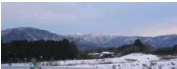
鴨稻荷山遺跡のある高島町 鴨郷