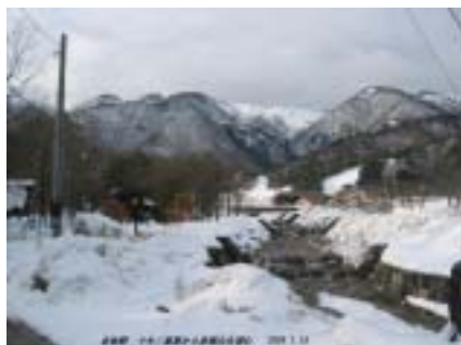
マキノ高原 赤坂山