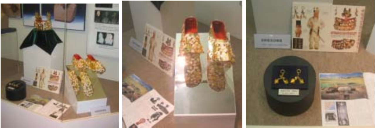
鴨稻荷山古墳 石棺からの出土副葬品展示 歴史民俗資料館にて 2005.1.14.

夕闇迫る 4 時過ぎに鴨稻荷山古墳の直ぐそばに建つ高島町立歴史民俗資料館に飛び込む。 ここには鴨稻荷山遺跡で出土した副葬品が複製展示されている。 昨年夏奈良国立博物館「黄金の国・新羅 王陵の至宝」展でみたのとそっくり同じ黄金の「王冠・耳飾・靴」 が展示されている。これは本当に新羅の王陵そのものでないか・・・ もつとも この頃の新羅の王陵は円墳 この鴨稻荷山遺跡は前方後円墳である。