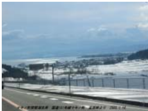
追坂峠からみたマキノ・琵琶湖北岸

今津からまた電車で 湖岸を北へ二駅でマキノ。行方には滋賀と若狭を分ける赤坂・三国山山塊が壁のようにそびえ、そこから湖岸まで、雪原がひろがる。その山裾にへばりつくように古代製鉄の里マキノの集落が見えている。 すっばりと雪の中である。