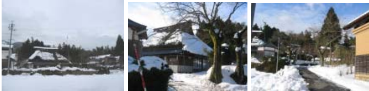
古代 和鉄の先進地 古墳・製鉄遺跡が山裾に散在するマキノ高原 白谷集落

この道をさらに北に遡ってゆくと、三国山の肩を越えて若狭敦賀へとつながる黒川越の道である。