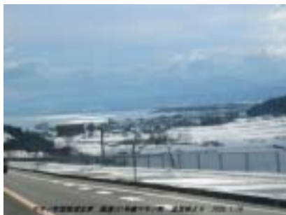
追坂峠より琵琶湖・マキノ遠望