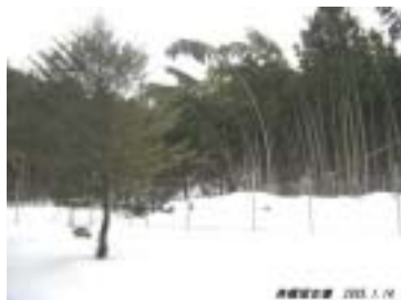
牧野 赤坂山山麓の斎瀬古墳