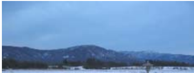
継体天皇ゆかりの 安曇川町 三尾里

近江今津へ送っていただいたおかげで、もうひとつどうしても行きたかった場所 近江高島町の鴨稻荷山古墳そしてそれに隣接した三尾の里に行く時間ができた。