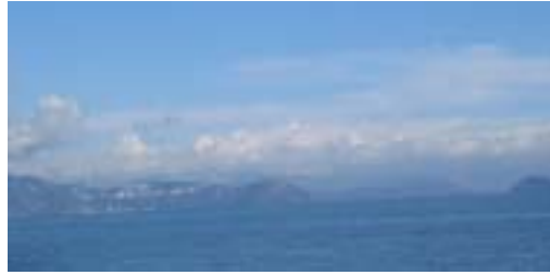
近江今津港から 琵琶湖