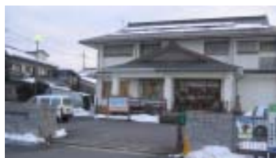
高島町鴨郷 鴨稻荷山古墳と歴史民俗資料館 2005.1.14.

鴨稻荷山古墳は安曇川町と高島町の境を流れる鴨川の右岸に位置する鴨郷にあり、古墳時代後期 6 世紀前半の前方後円墳で横穴式石室の石棺内からは数々の副葬品が出土した。