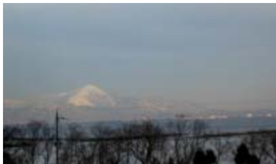
近江今津周辺からの琵琶湖

東海道線は大津から東へ米原・関が原に抜けてゆくとイメージしているが、実際は琵琶湖東岸を北上 琵琶湖をはさんで、今津からは伊吹山・長浜は対岸である。