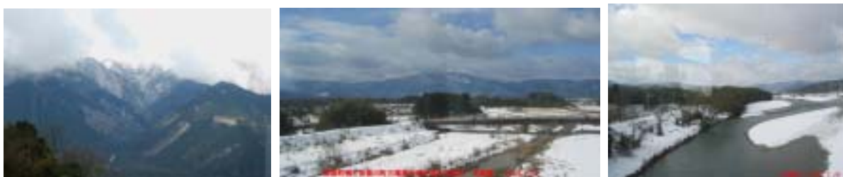
雲の中の蓬萊・打見山頂上部 古代 鴨・三尾里を分ける鴨川 安曇川

ここから北は極端に電車が少なくなって、一時間に一本。電車を待っている間 琵琶湖へ。