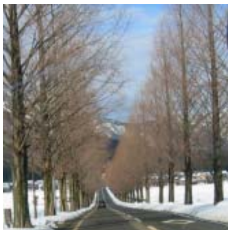
メタセコイアの並木道