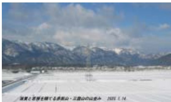
近江と若狭を隔てる赤坂・三国山山塊 その山裾に広がるマキノ