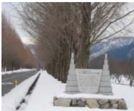
マキノ高原へ続くメタセコイアの並木道