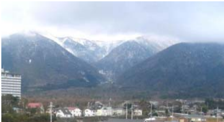
近江舞子近傍より 比良正面谷 2005.1.14.

蓬萊駅を過ぎて滋賀。琵琶湖バレイ ゴンドラの直線路がくっきり打見の頂上へついている。この駅からは天狗杉を通過してクロトノハゲ・木戸峠と山小屋へ通った道。今は一人でのほれるやろか・・・松の浦も浜でよく夜を明かしました。