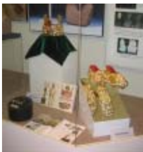
高島町 鴨稻荷山古墳からの出土品 密接な朝鮮半島との関係

しかし、この地で実際に鉄精錬が行われたという製鉄炉の出土などの直接証拠は8世紀以降であり、確認はとれていない。