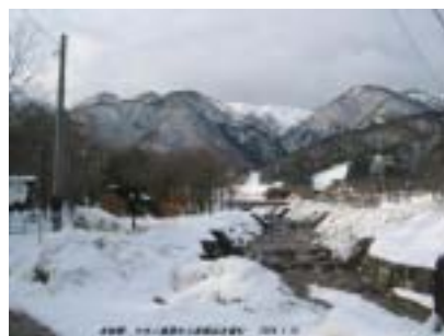
マキノ高原から赤坂山