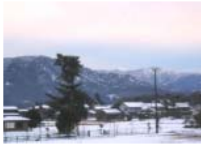
高島町 鴨 郷