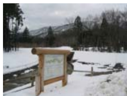
古代の製鉄遺跡 古墳が散在する北牧野・西牧野の赤坂山 山裾 2005.1.14.