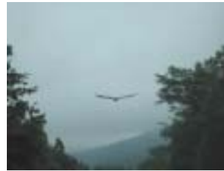
by M. Nakanishi 2004.8.5.