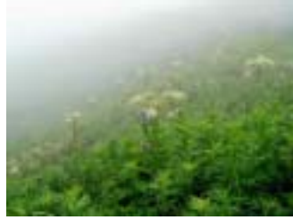
礼文島北海岸より花の浮島