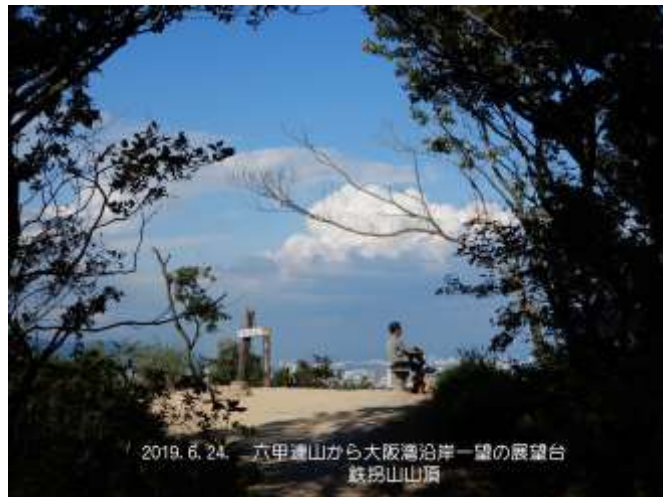
2019. 6. 24. 六甲連山から大阪湾沿岸一帯の展望台 鉄拐山山頂