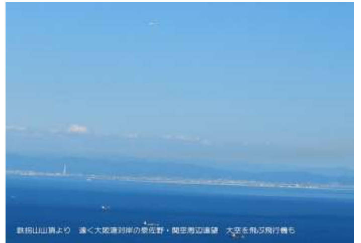
鉄揚山山頂より 遠く大阪湾沿岸の泉佐野・関西周辺道望 大空を飛び飛行機も