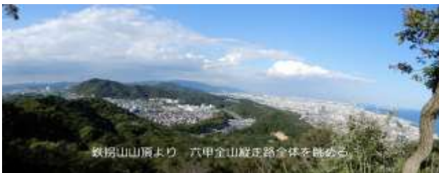
鉄揚山山頂より 六甲全山縦走路全体を眺める