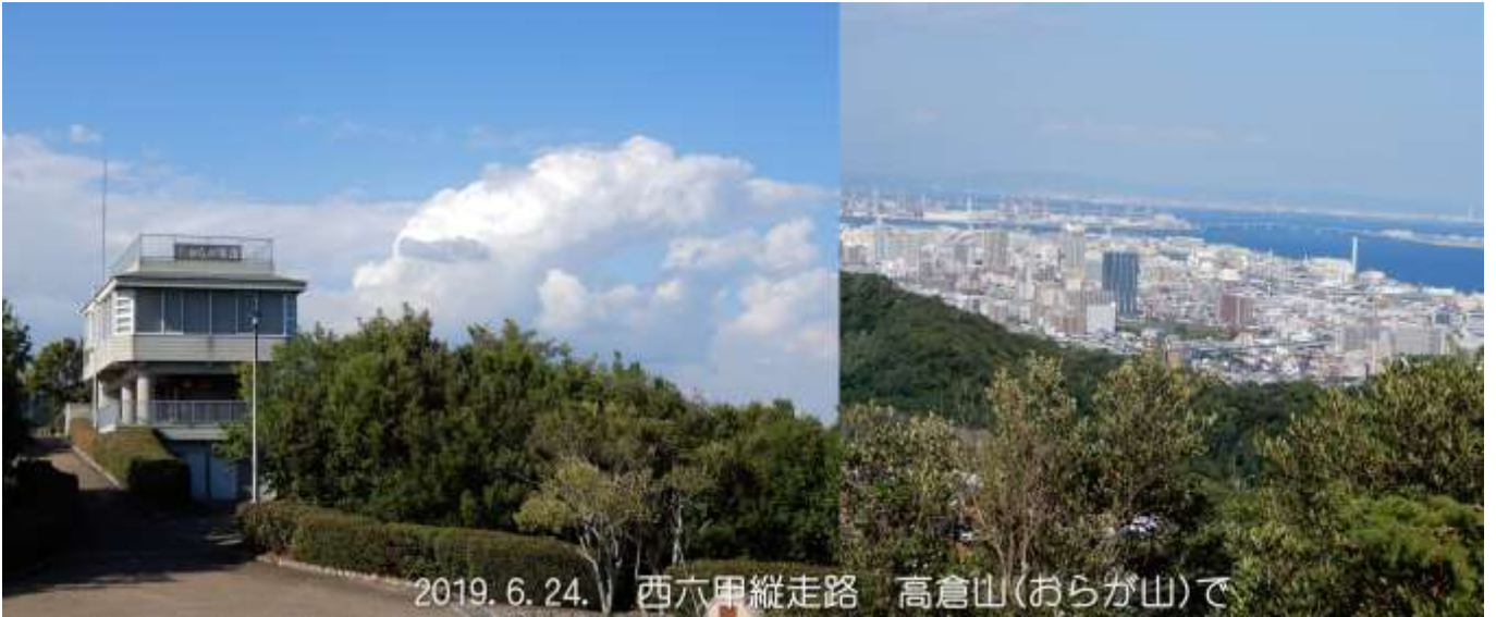
2019. 6. 24. 西六甲縦走路 高倉山(おらが山)で