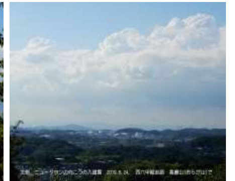
文島、二上・三上山のふたつも見渡す 2019. 6. 24. 西六甲縦走路 高倉山(おらが山)より