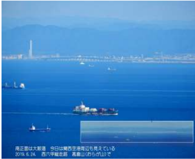
南正面は大坂湾 今日には関西空港周辺も見えている 2019. 6. 24. 西六甲縦走路 高倉山(つららが山)で