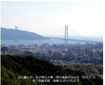
少し霞んでいるが明石大橋・明石海峡が見える 2019. 6. 24. 西六甲縦走路 高倉山(おらが山)で