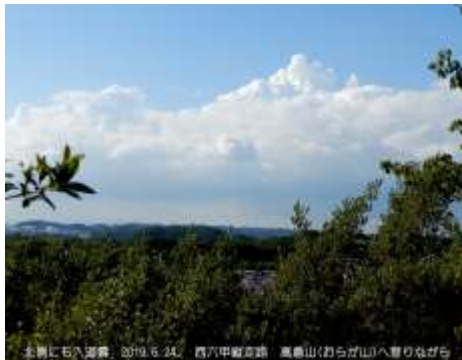
土割にも入浴音 2019. 6. 24. 西六甲縦走路 高倉山(おらが山)へ登りながら