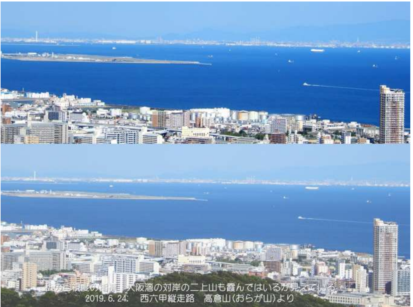
この目視度の指馬で大阪湾の対岸の二上山も霞んではいるが見えている 2019. 6. 24. 西六甲縦走路 高倉山(おらが山)より