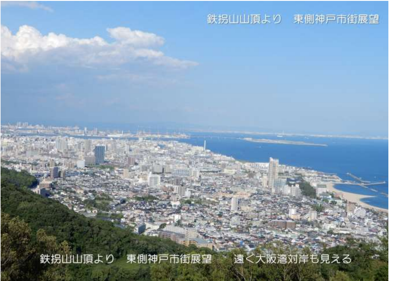
鉄拐山山頂より 東側神戸市街展望 遠く大阪湾対岸も見える