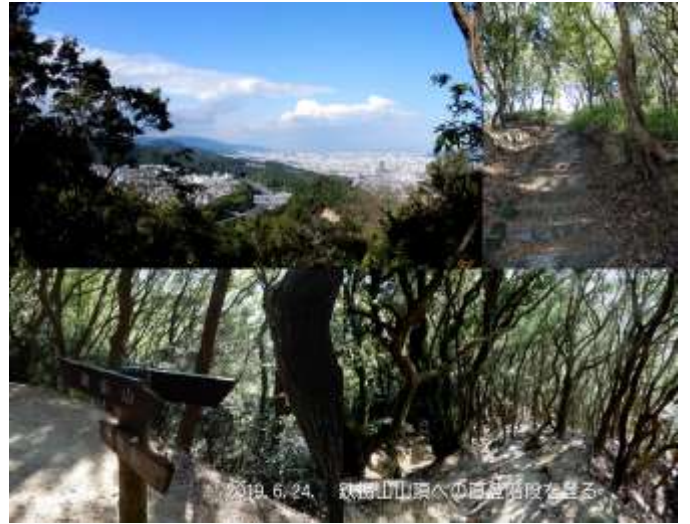
2019. 6. 24. 鉄拐山山頂への道沿 樹陰をきる