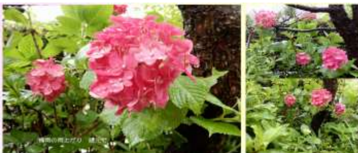
梅雨の晴上がり 緑と花

久しぶり 素晴らしい西六甲の山海と空と雲 梅雨空をふっとはした初夏の爽快さに すっきりと 2019. 6. 24. 午後