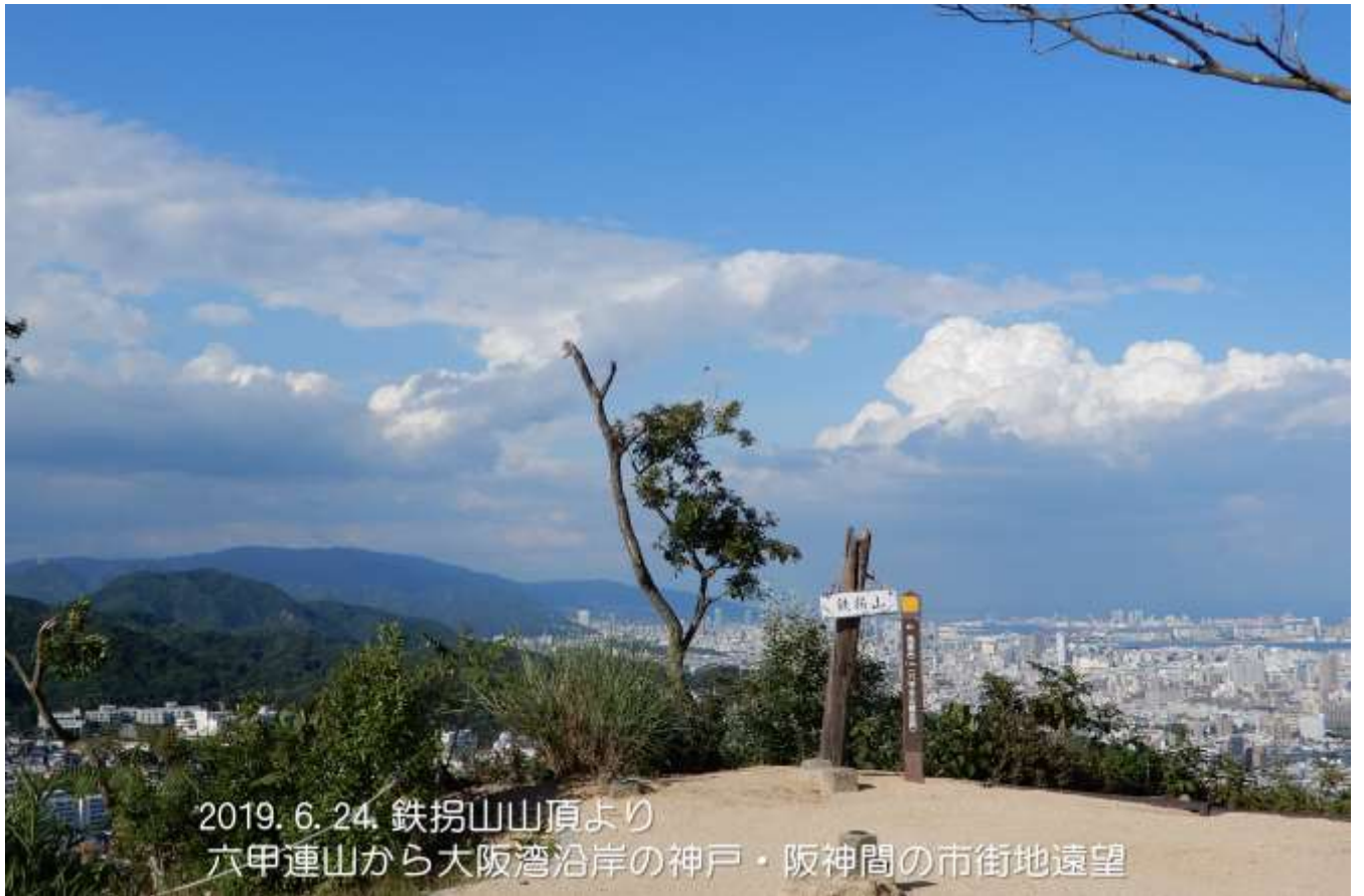
2019. 6. 24. 鉄拐山山頂より 六甲連山から大阪湾沿岸の神戸・阪神間の市街地遠望