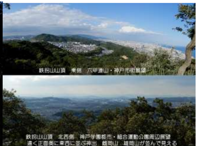
鉄拐山山頂 東側 六甲連山・神戸市街展望