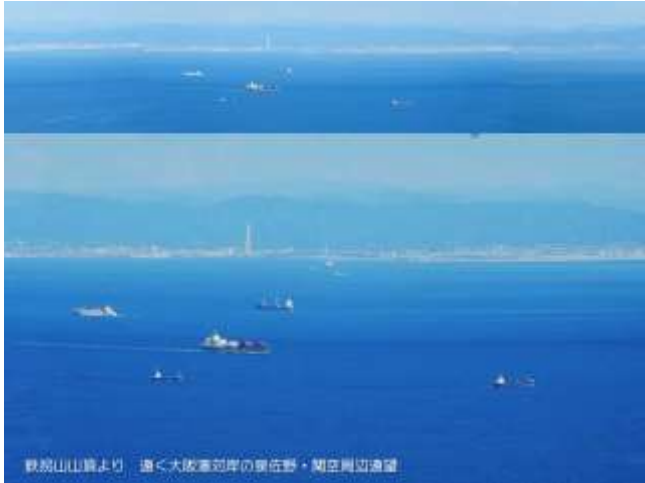
鉄揚山山頂より 遠く大阪湾沿岸の泉佐野・関西周辺道望