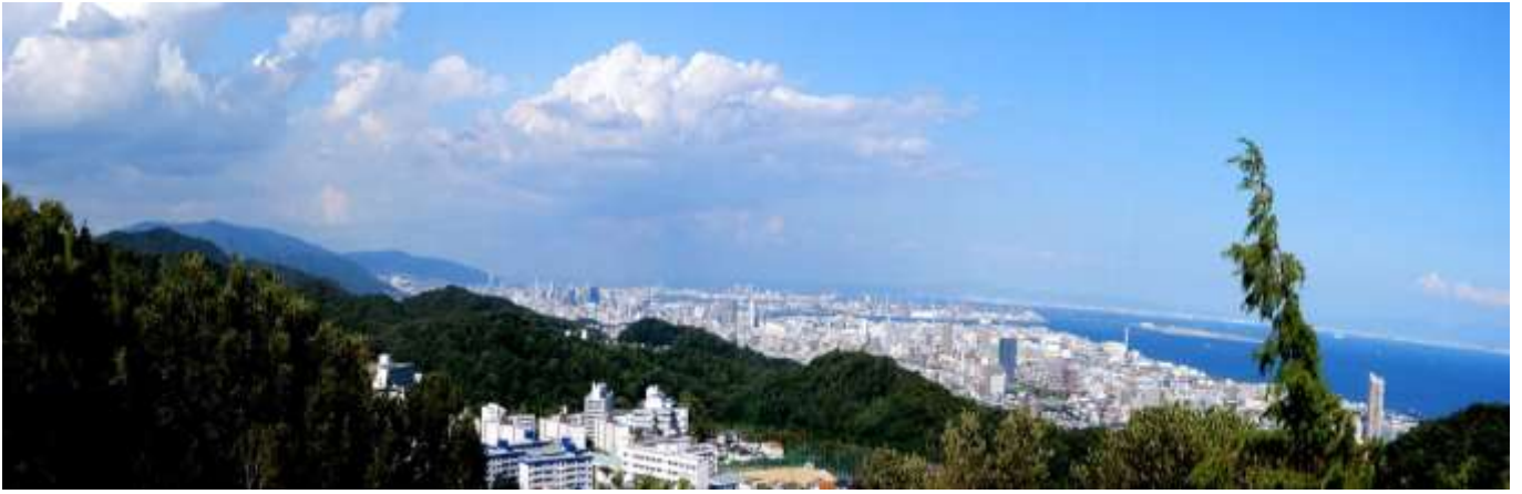
鉄拐山山頂より 東側神戸市街展望