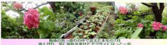
梅雨の晴上がりの中で迎えた本年の7月 晴上がり、雲に雨筋を乗せたアササイにほっと一息