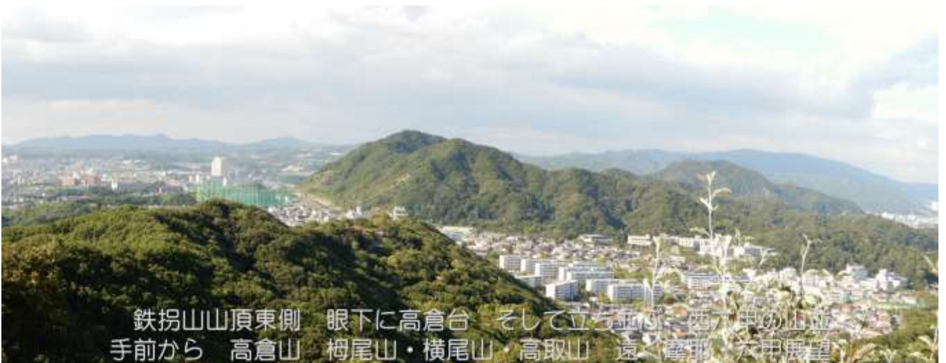
鉄拐山山頂東側 眼下に高倉台 そして立ち並ぶ 西六甲の山並み 手前から 高倉山 榎尾山・横尾山・高取山 遠く 摩耶 六甲展望