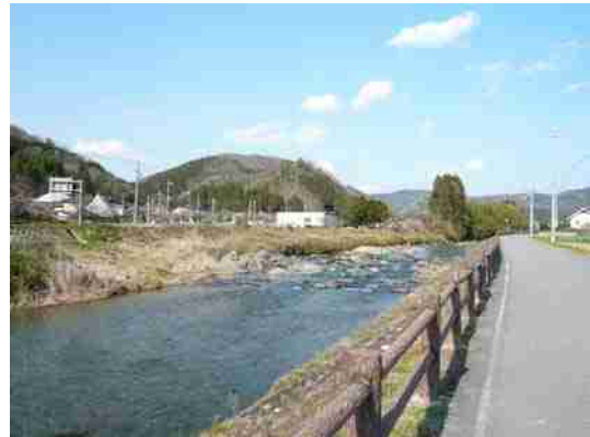
千種川が山合いを流れ下る佐用町旧南光町下野・旧三日月町東徳久殿崎 2010.4.8.