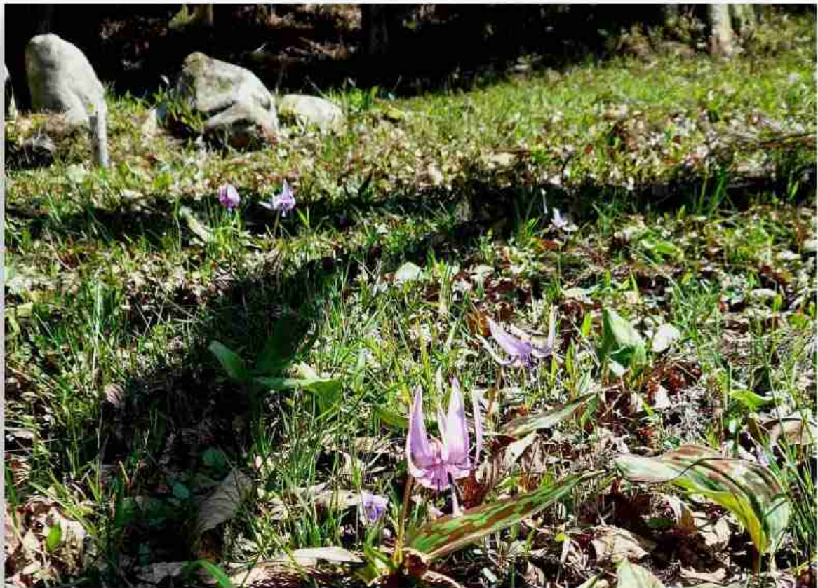
「片栗の花」 佐用町三日月 殿崎カタクリの里で 2010.4.8