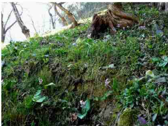
三日月地区 弦谷 カタクリの群生地