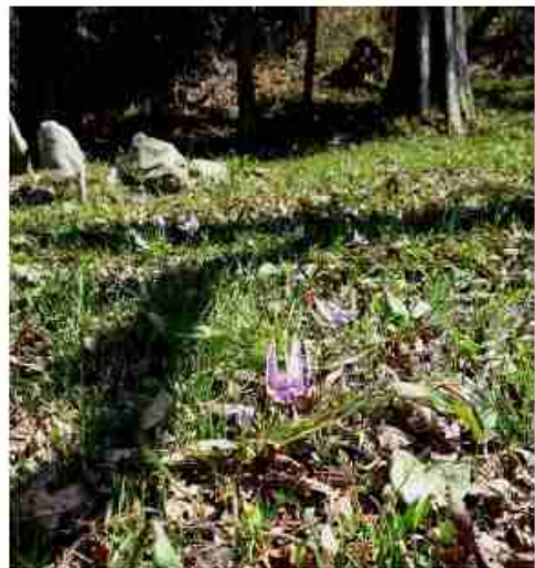
南犬地区東徳久 殿崎カタクリの里