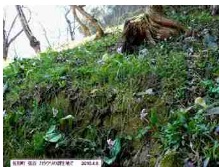
佐用町 道の 197号沿道に於て 2010.4.8