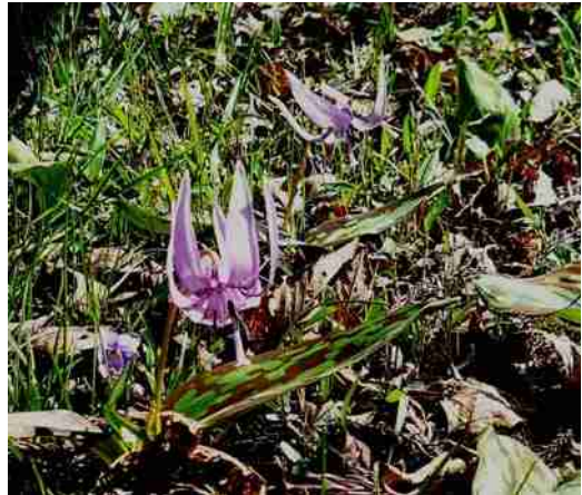
もう盛りは過ぎていましたが 愛らしいカタクリの花に出会えました 2010.4.8.

山腹の北斜面に すっと立ち上がり、まだ春浅い冷たい風に身を震わせて立ち向うピンクの花 カタクリ この可憐な姿に魅せられて 何度も通った佐用町のカタクリである。