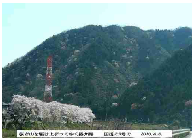
桜が山を駆け上がりてゆく播州路 国道29号で 2010.4.8.