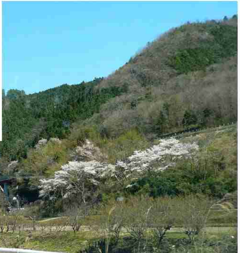
古代たたらの里 千種川が流れ下る佐用町 南光・三日月地区は 四季折々の花の里 2010. 4. 8.

昨夏の集中豪雨で被災した佐用町 群落がどうなっているか 心配していた「カタクリの花」を訪ねました