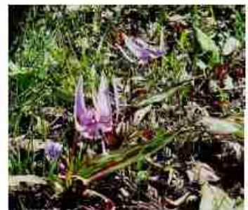
「片栗の花」 花言葉は「初恋」・「寂しさに耐える」