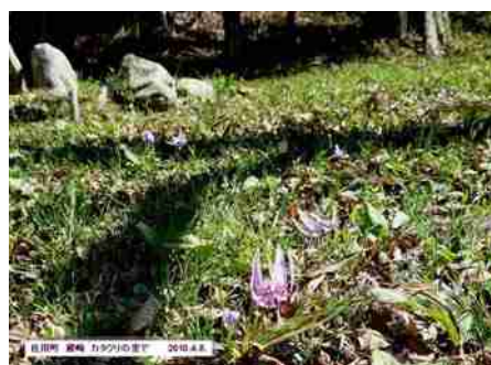
佐用町 道の 197号沿道に於て 2010.4.8