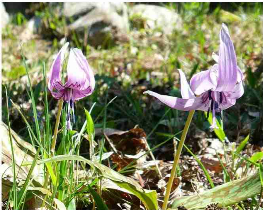
可憐な「片栗の花」 佐用町三日月 殿崎カタクリの里で 2010. 4. 8

昨夏の集中豪雨で被災した佐用町 群落がどうなっているか 心配していた「カタクリの花」を訪ねました