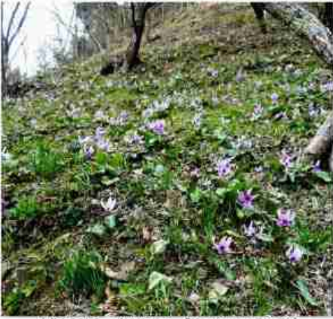
昨年3月31日 佐用町孫谷「カタクリ」群生地