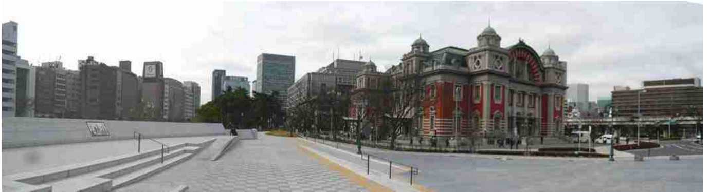
大阪の中心地 中ノ島公園 中ノ島東部 中央公会堂界限 2010. 3. 2.

近代建築の重要文化財 中央公会堂と中之島図書館 2010. 3. 2.