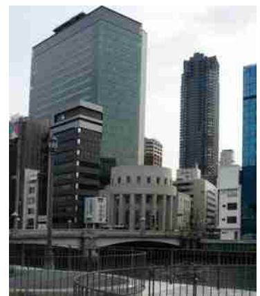
難波橋の向こうに北浜のビル街