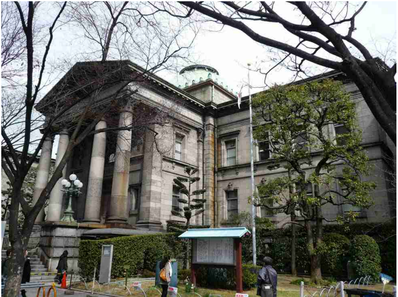
重要文化財 中之島図書館の本館 現在も現役の図書館である 2010. 3. 2.