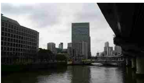
中ノ島公園から西の淀屋橋