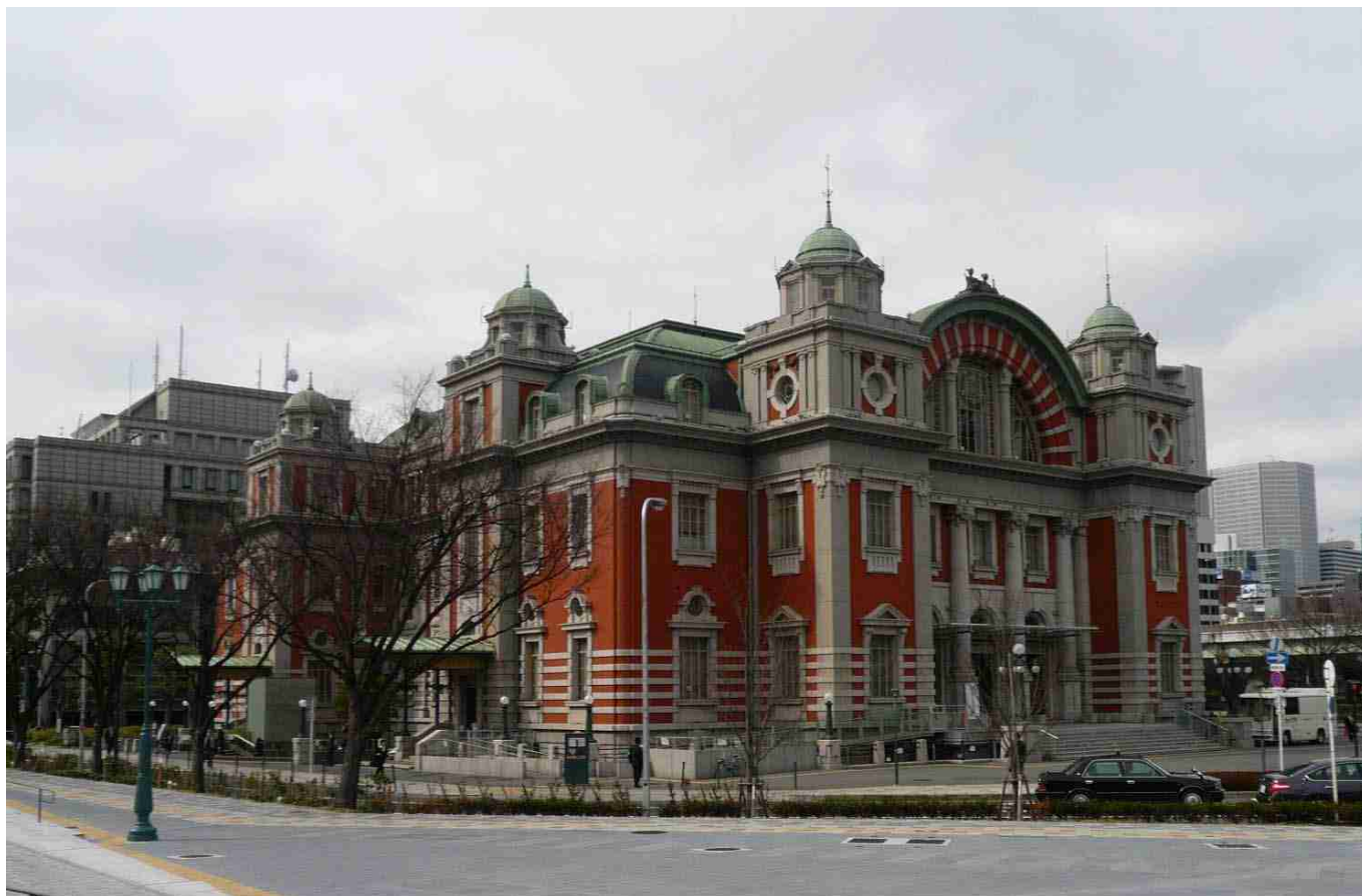
重要文化財 中央公会堂 2010. 3. 2.