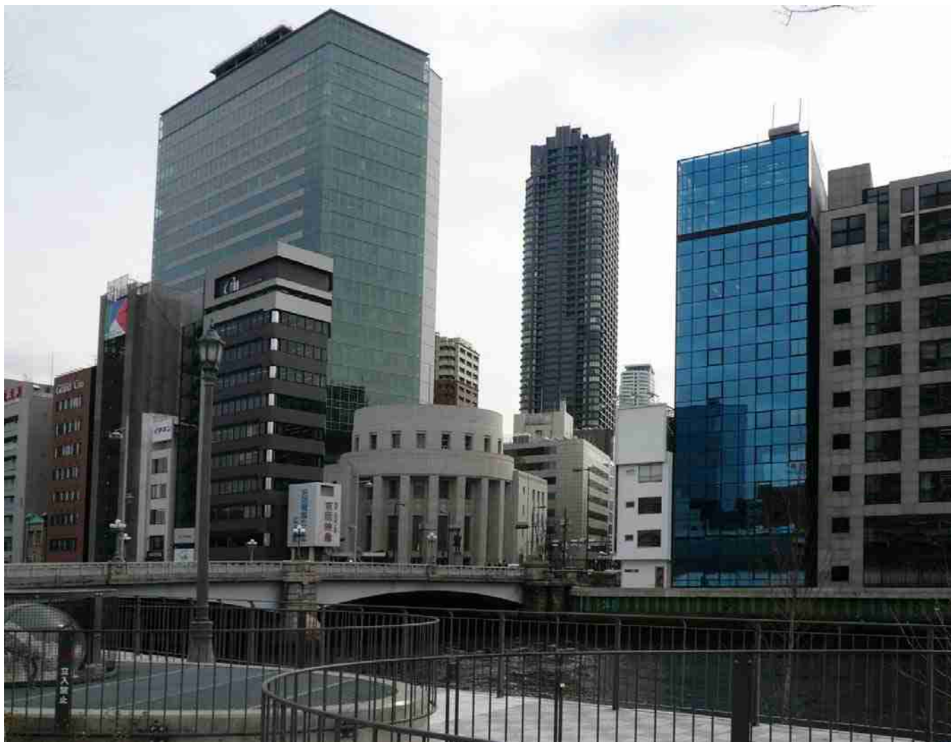
中之島公園から土佐堀川越しに 難波橋 その向こうに証券取引所など北浜のビル街 2010. 3. 2.