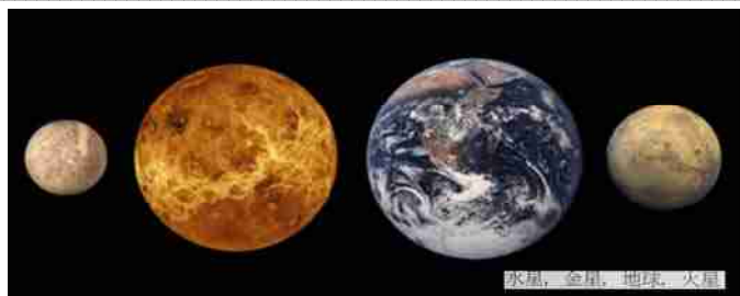
地球の誕生は約45億年前誕生した大気・水・大地がある惑星