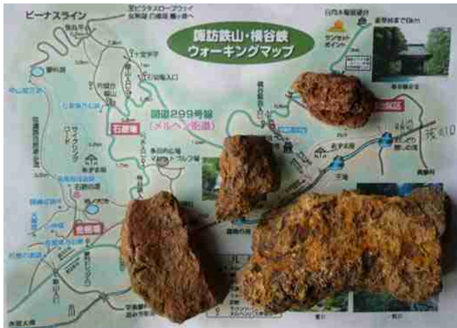
蓼科で拾った褐鉄鉱状の鉱石