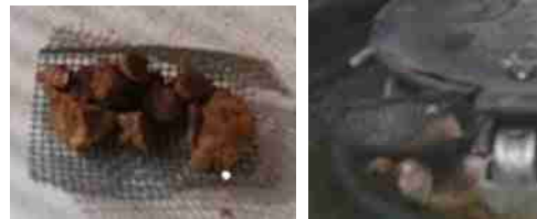
ガスバーナーの青い火のところでも焼いてみる(2)