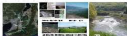
古代大塚への鉄の道 富山・高松市 大塚山 富山県