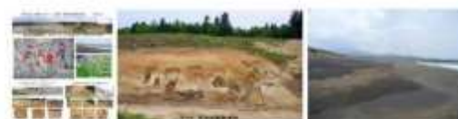
古代 船場の大塚鉄コンビナート 岐阜 岐阜の歴史博物館