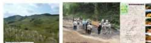
和鉄の道 鉄の道が走る岩崎高原 高松市 和鉄の道建設工事でのたたら製鉄炉と