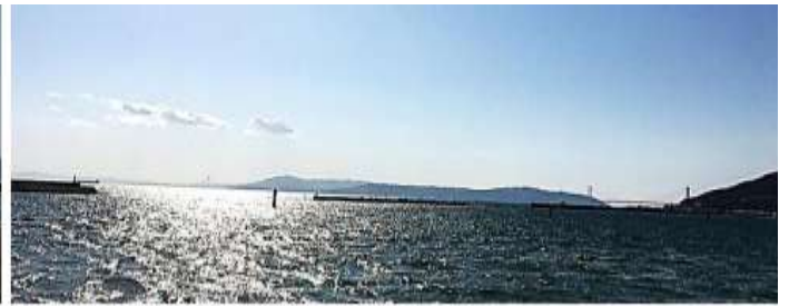
春の訪れ 陽光にキラキラ光る須磨の海 2021.2.16.