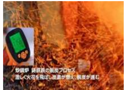
炒鋼炉 鑄鉄鉄の脱炭プロセス 激しく火花を飛ばし炭素が燃え、温度が上がる