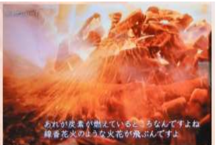
あれが炭素が燃えているところなんですよ 線香花火のような火花が飛ぶんですよ