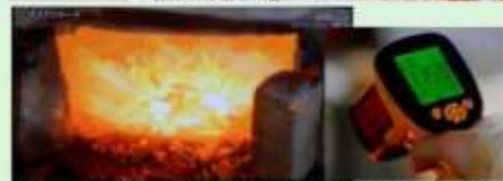
約1200℃の炒鋼炉で小割した脆い鑄鉄塊を酸素を吹き込みつつ加熱処理