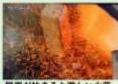
脱炭が始まると激しい火花