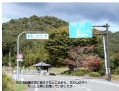
2019 秋桜 加古川市志方 広尾のコスモス畑で 2019. 10. 23.