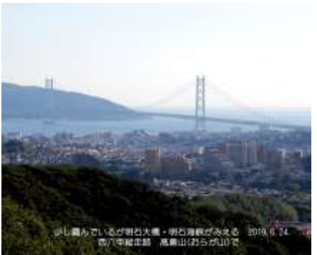
少し霞んでいるが明石大橋・明石海峡がみえる 2019. 6. 24. 西六甲縦走路 高倉山(おらが山)で