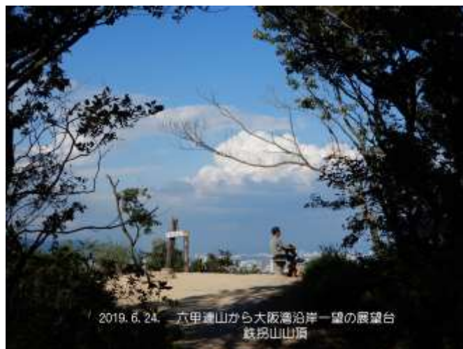
2019. 6. 24. 六甲連山から大阪湾沿岸一望の展望台 鉄拐山山頂