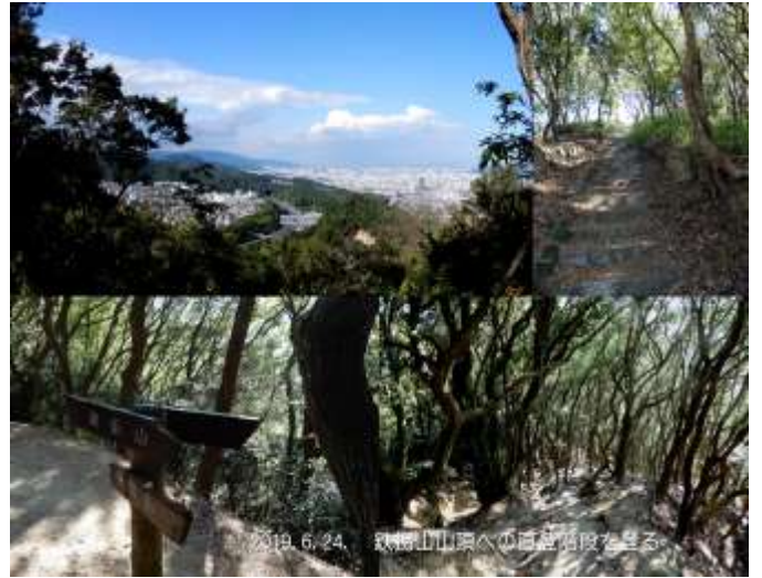
2019. 6. 24. 鉄拐山山頂への道沿 階段を上る