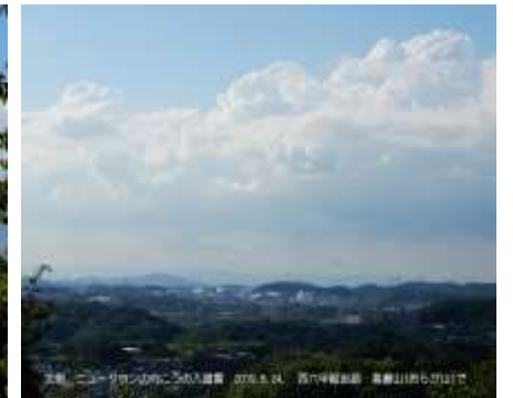
文庫、二上・三上山のふもとへ入浴露 2019. 6. 24. 西六甲縦走路 高倉山(おらが山)より