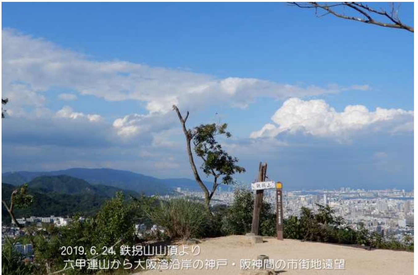
2019. 6. 24. 鉄拐山山頂より 六甲連山から大阪湾沿岸の神戸・阪神間の市街地遠望