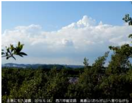
土割にも入浴露 2019. 6. 24. 西六甲縦走路 高倉山(おらが山)へ登りながら