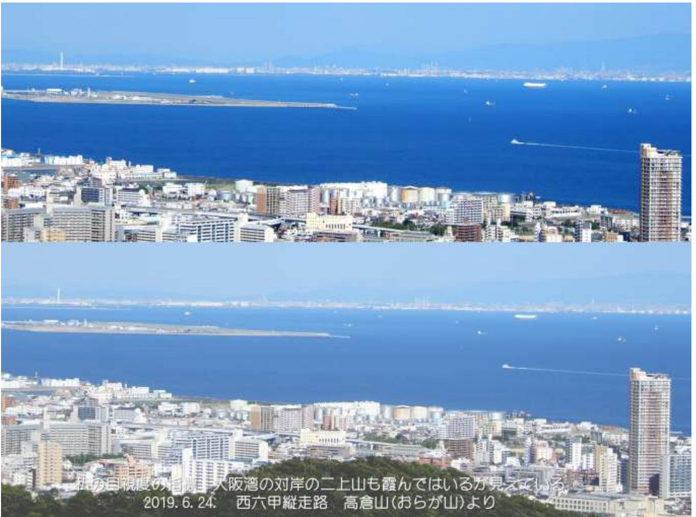
その目視度の指馬、大阪湾の対岸の二上山も霞んではいるが見えている