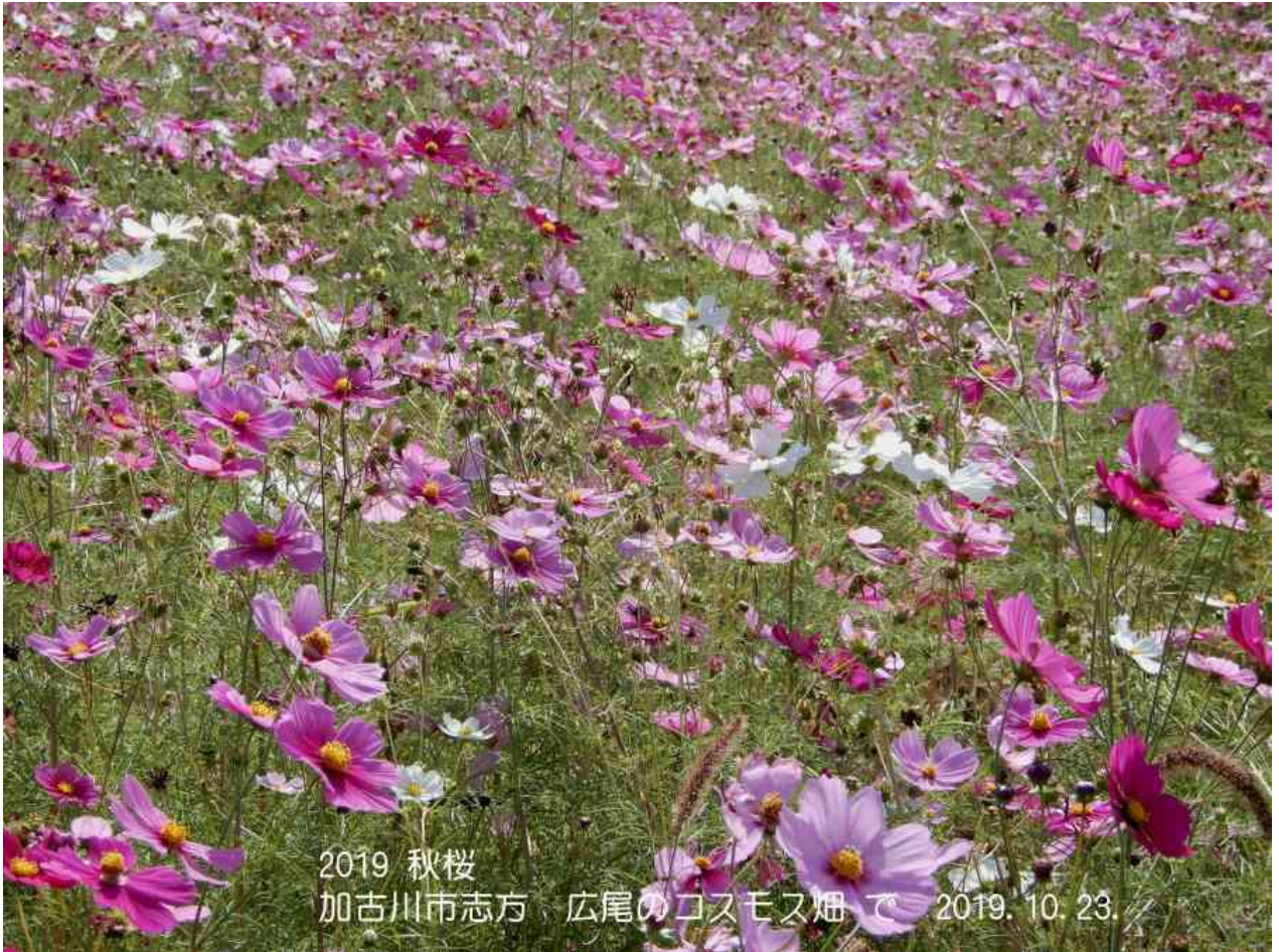
2019 秋桜 加古川市志方 広尾のコスモス畑で 2019. 10. 23.

また、この志方の田園に綿花畑を作り、加古川の地場特産加古川コットンの復活を目指す人たちがいる。かつて 阪神・播磨地方では綿花の栽培が盛んで、それが関西に紡績を起こし、そしてさらに現在の科学産業のベースになった。そんな話を教科書で習ったが、まだ小さいですが、そんな綿花畑が志方のコスモス畑の一角に今黄色い花と綿花(綿のみ)を付けている。綿花畑を見るのは初めて。昔は一面に綿花畑が広がり、綿花を積む人たちがこの光景の中にあっただのらう。 成功するといいなあ…と。