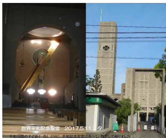
世界平和記念聖堂 2017.5.11 夕 平和公園のすぐ近く 久しぶりに 平和記念聖堂に入って、黙想して帰りました