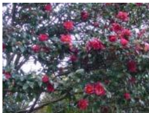
大日堂入り口周辺の椿