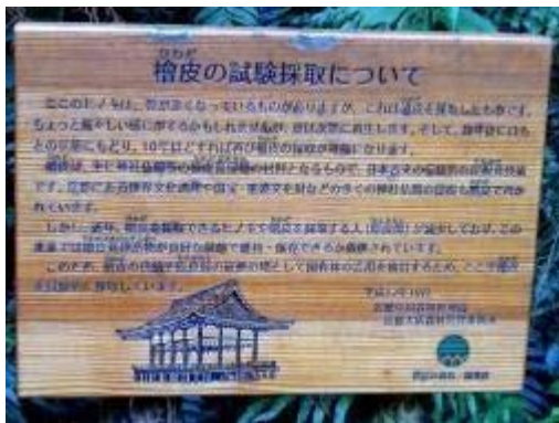
桧皮採取試験地を示す案内板

東山將軍塚へは五条とおりから北へ東山ドライブウェイが通じているので、山道などもう荒れていると思っていましたが、ハイキング道としてよく整備されているのにビックリ。