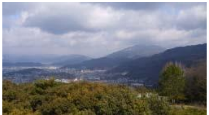
銀閣寺・修学院・比叡山遠望