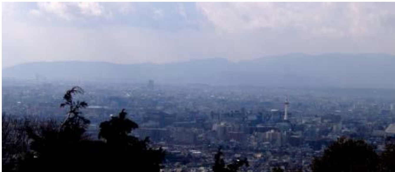
京都駅周辺から北攝の山並み遠望

聞いてはいましたが、今見る京都全体の展望 特に加茂川を中心軸として町全体が見渡せる場所はこの將軍塚しかなく、正面の御所 そして左右に広がる京都の街、自分か街の中心の高台に立ち街を指揮しているような錯覚に陥る。