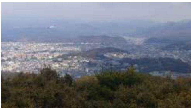
京大・・・神楽が丘から松ヶ崎遠望