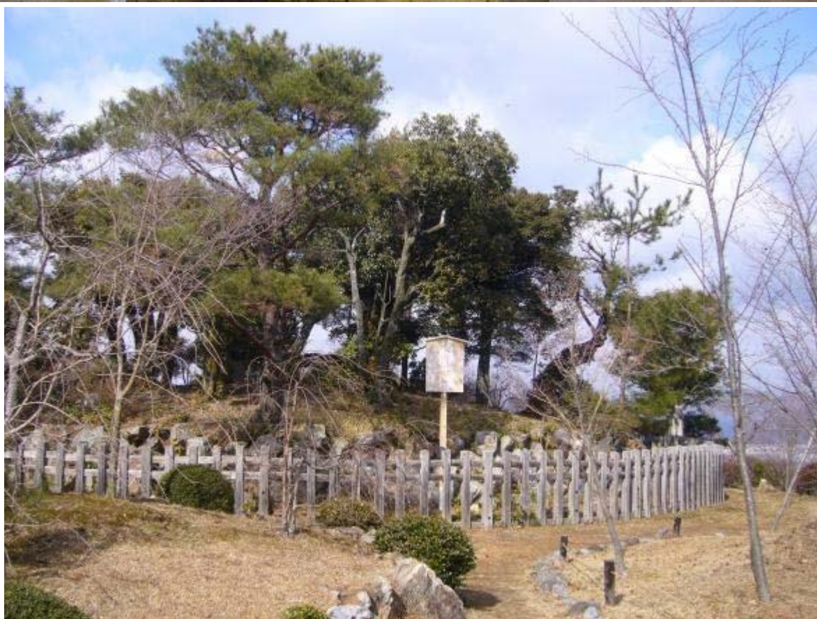
大日堂とその寺域の中にある将軍塚