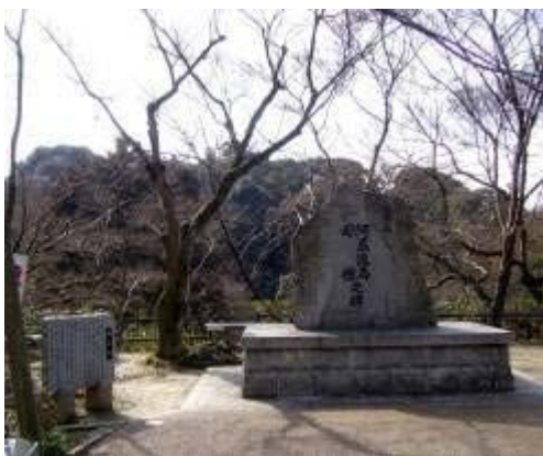
清水寺にあるアテルイ・モレの顕彰碑

蝦夷たちが手にした蕨手刀は弧状にそり、切る刀への日本刀のルーツ。戦いに敗れた蝦夷の技術集団は俘囚となって、日本各地に散らばって、たたら製鉄・刀鍛冶の技術を日本全国に広めた。出羽鍛冶・舞草鍛冶などの名が広く日本各地に残る