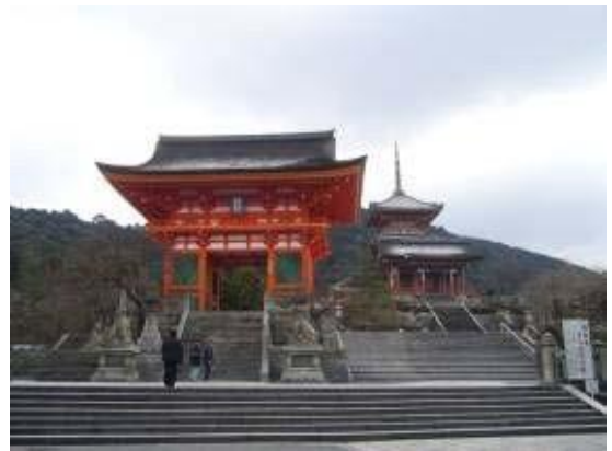
清水寺の参詣道 清水道 清水寺近く