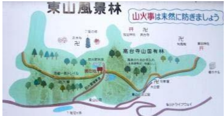
東山を貫く京都一周トレイル 東山コースの案内板

今回 東山を歩くまで良く知らなかったのですが、京都市街地を取り巻く東山・北山・西山をぐるりと巡る京都一周トレイルがハイキングコースとして整備され、京都の市街地のどこからでもこのトレイルを出入りして歩けるようになっている。清水寺から約 15 分ほどで東山の縦走路 京都一周トレイル東山コースに出た。この道は五条通渋谷街道から將軍塚を通過、蹴上げ・鹿ヶ谷・大文字山から比叡山へと続いていて、ここからは將軍塚までこのトレイルを歩く。15 分ほどで將軍塚の頂上部の広い頂上公園 東山ドライブウェイの終点の駐車場に飛び出た。駐車場の北の山並みの奥に雪をかぶった比叡山が見える。將軍塚は東山ドライブウェイからしか簡単には行けず、しかも路線バスがないので 車でないと行きにくい所と思っていましたが、京都市街地から 30 分ちょっとで將軍塚の頂上。本当に以外でした。