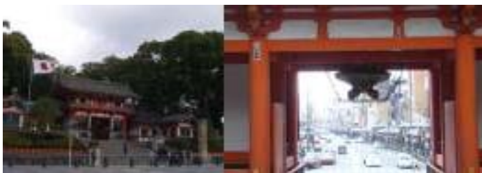
栗田口から知恩院・祇園石段下へ 上段: 神宮道 栗田神社 白川小 校門 青蓮院 中絶: 円山公園から東山 知恩院山門 下段: 八坂神社石段下 祇園・四条通

昼食後 今度は 平安神宮の東 東山若王子山の山麓 永観堂の見返りあみだ様に会いに行く。