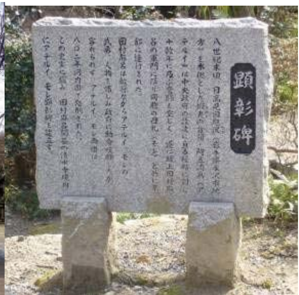
清水寺 南の谷に面する清水の舞台下の丘にある アテルイ・モレの顕彰碑

顕彰碑の横に置かれた銘文には アテルイ・モレを愛した東北人の熱い思いがそのまま刻まれていて、以前東北を歩いて感じた「アテルイ」「モレ」の人物像を重ねていました。