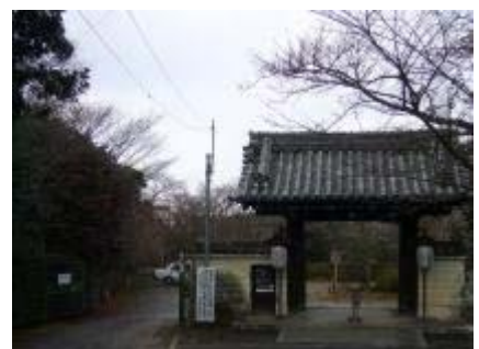
將軍塚の案内板と大日堂の門 2006. 2. 9.