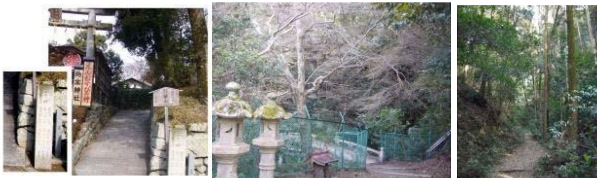
清水寺から将軍塚・大日堂への登り口 2006. 23. 9.

地主神社の上り口には道標があり、将軍塚まで 10 町 知恩院まで 17 町など東山山麓への道のりが記されている。直ぐに清水寺寺域を出る橋を渡ったところで、そのまま真っ直ぐ山麓沿いを円山公園の方へ行く道から分かれて東へ山へ登ってゆく。清水寺の喧騒がうそのようなまったく人影のない静かな林の中。山道であるが、足元は落ち葉のじゅうたんでサクサクサクと心地良く、良く手入れされた林が美しい。