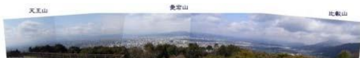
京都 東山 将軍塚より 京都市街地全景 2006. 2. 9.

将軍塚の背後には眼下にはなにもさえぎるものもなく、京都市街は全体がパノラマのように広がり、本当に素晴らしい位置にある。