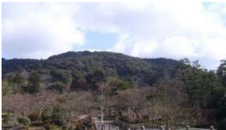
円山公園から見た東山 華頂山周辺

清水寺から約3時間弱 あっという間に また市街地に戻ってこんなに簡単に東山を歩けるなんて思いもよらなかったと振り返りながら遅い昼食。