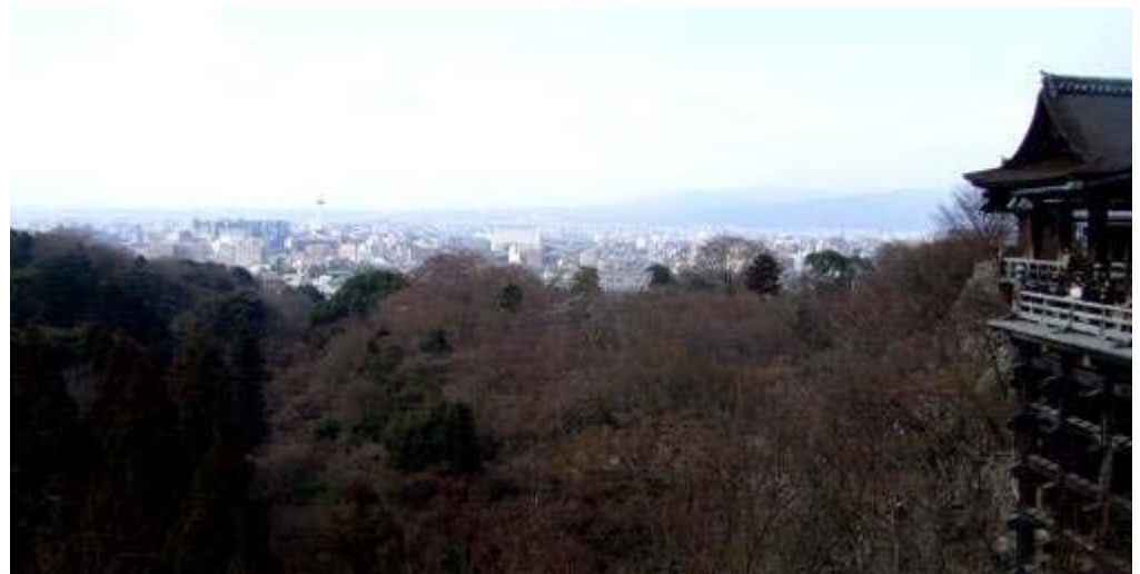
清水寺の舞台から 京都市街地遠望 中央左に京都タワー 2006. 2. 9.

清水寺の舞台からひとしきり京都の市街地を見て舞台の裏手に回りこむと北側に地主神社の鳥居が見え、鳥居の横に拝観口で聞いた東山への上り口の標識とよく整備された道が見える。清水寺から東山へ登る道がどうなっているか心配でしたがまったく心配なし。