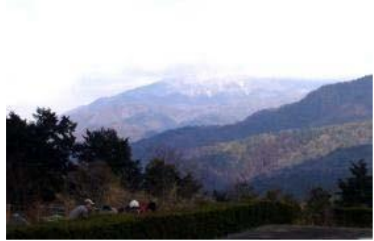
京都トレイル 東山コース 將軍塚への道で