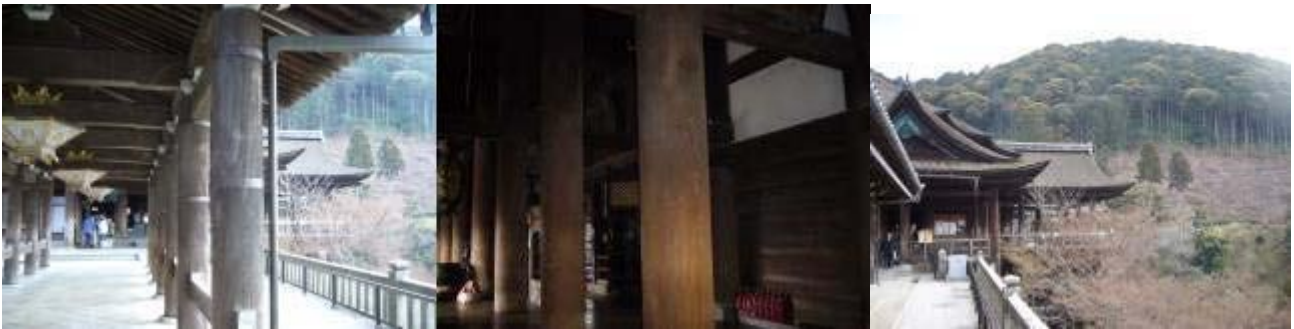
清水寺の舞台 2006. 2. 9.

清水寺の舞台からひとしきり京都の市街地を見て舞台の裏手に回りこむと北側に地主神社の鳥居が見え、鳥居の横に拝観口で聞いた東山への上り口の標識とよく整備された道が見える。清水寺から東山へ登る道がどうなっているか心配でしたがまったく心配なし。