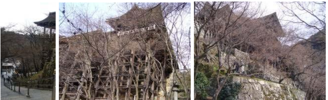
音羽の滝から 清水の舞台の下の遊歩道を舞台木組みを眺めながら 西へ 2006. 2. 9.