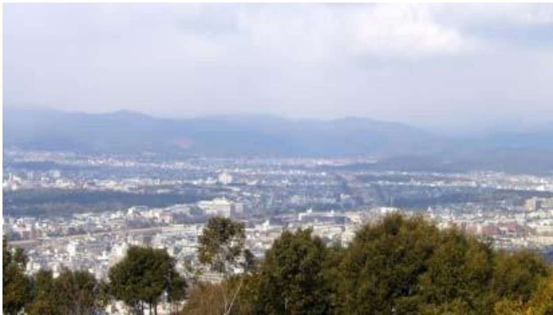
京都市街地を貫く加茂川 右手中央出町で鴨川 高野川に分かれる 中央左 御所 中央奥 舟形・右松ヶ崎妙法五山の火床が見える