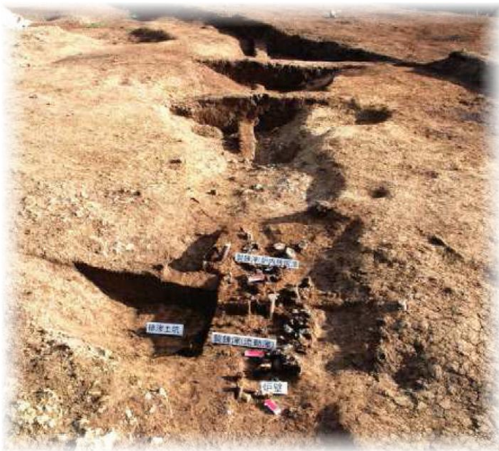
南西諸島で最初に確認された12世紀の崩り遺跡の製鉄炉跡。