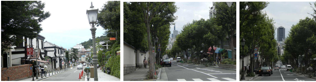
神戸北野 異人館通り & 北野坂 過ぎゆく夏のひるさがり 2014.8.25.