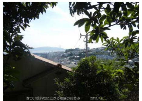
旗振山から 森の中を塩屋へ下ってゆくと 不意に明石海峡の海が見え、山の傾斜地に広がる塩屋の街に出る