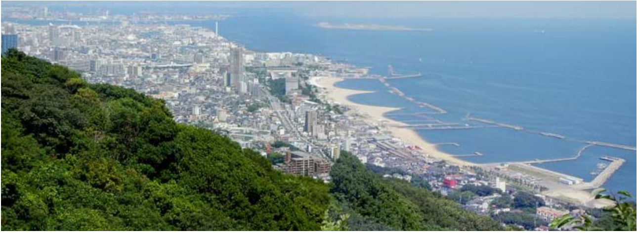
旗振山頂から眺める須磨海岸から神戸市街地 2012. 7. 9.