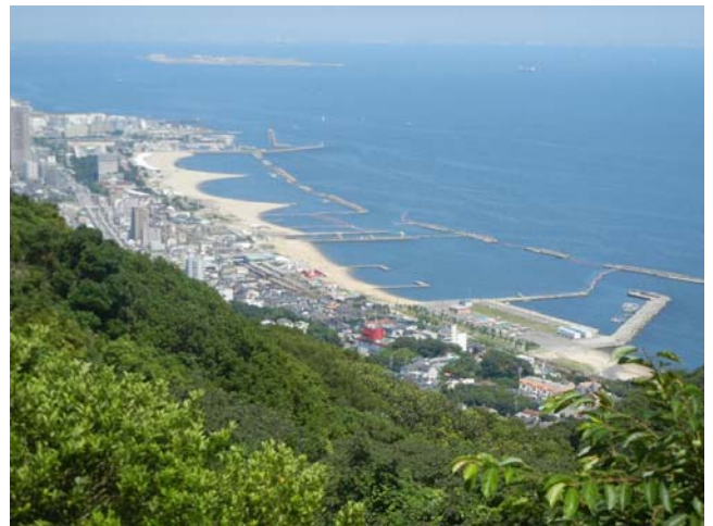
旗振山頂眺める須磨海岸・海水浴場