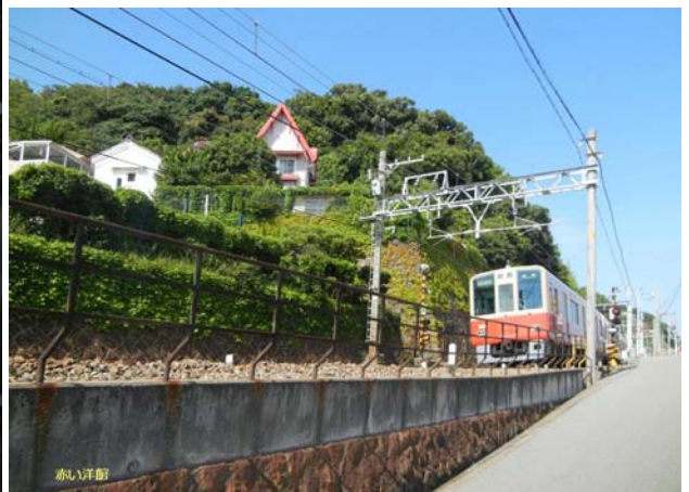
須磨 旗振山を下った南西山麓の斜面に建ち並ぶ美しい洋館群 2012. 7. 9.