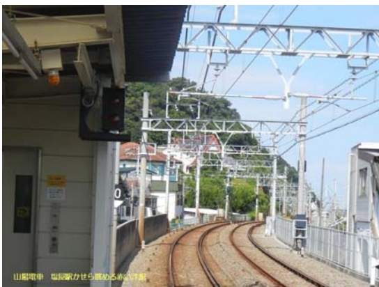
山陽電車 塩屋駅から見上げる赤い洋館