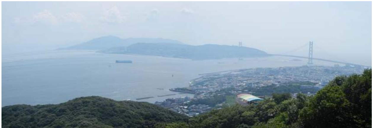
旗振山頂から眺める明石海峡 2012. 7. 9.