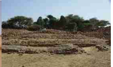
メロエ遺跡 メロエ=クシュ王国の時代(紀元前6世紀から紀元後4世紀)の王都 ロイヤル シティー