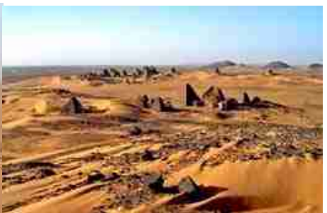
メロエ遺跡 独特の形をしたピラミッド群