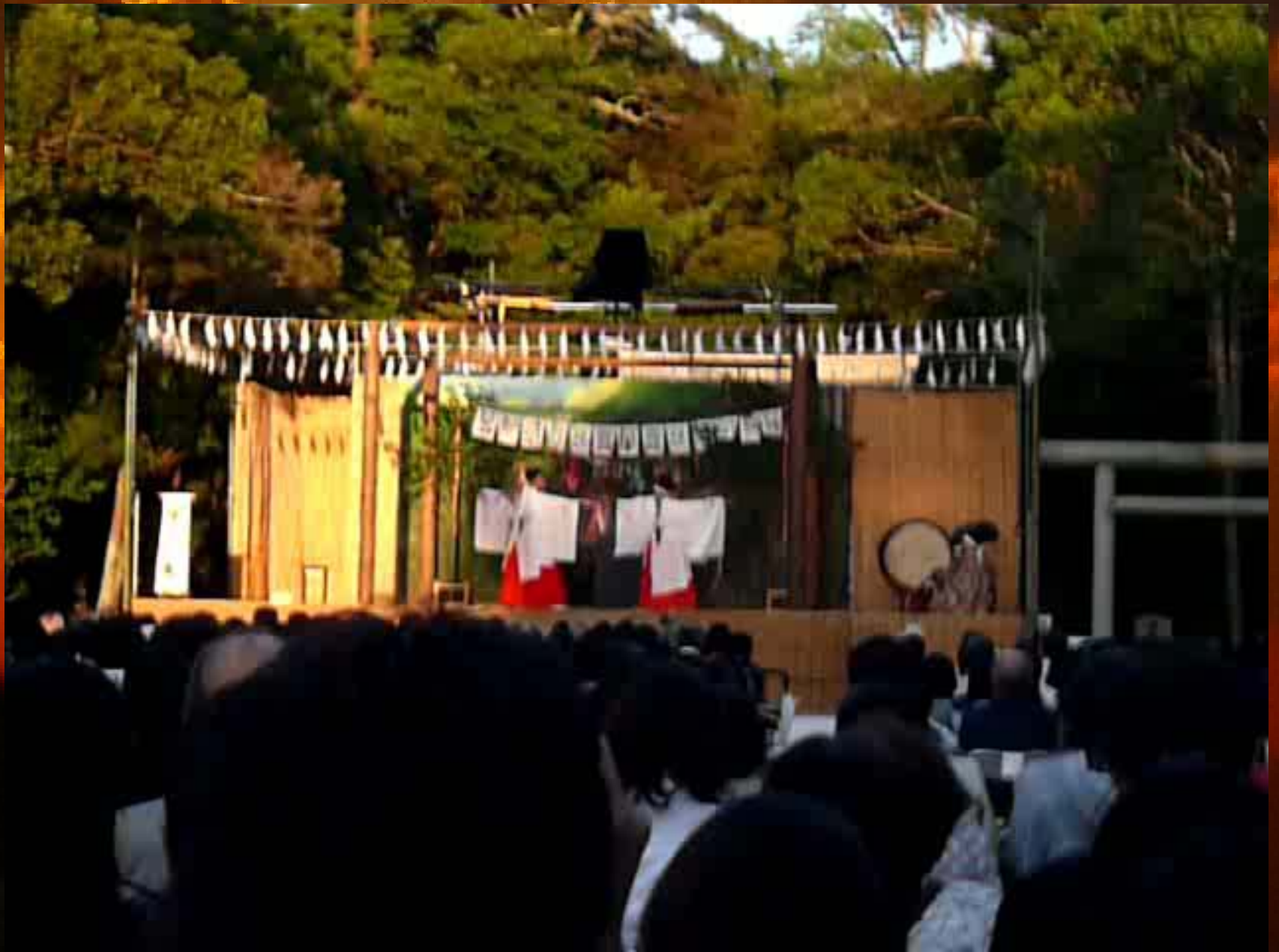
淡路神楽 銚の舞 (部分) 30s