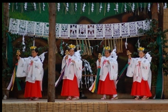
子供巫女 扇鈴の舞

舞は舞台に田の字を描くように歩を進め 同じ所作を繰り返して演じます。曲によっては、平拍子と速拍子が併用され、曲の中間で徐々に速拍子に移行し、再び平拍子に戻るものもあります。旋律が近畿地方の各地に傳わる浪速神楽に類似しているのは、後世の改補によるものと考えられます。幕末から明治にかけての頃、奈良の春日大社の巫女神楽を習得した者による影響ともいわれていますが、舞自体は浪速神楽の所作とは異なり、古い淡路神楽の素朴な形式を傳えています。