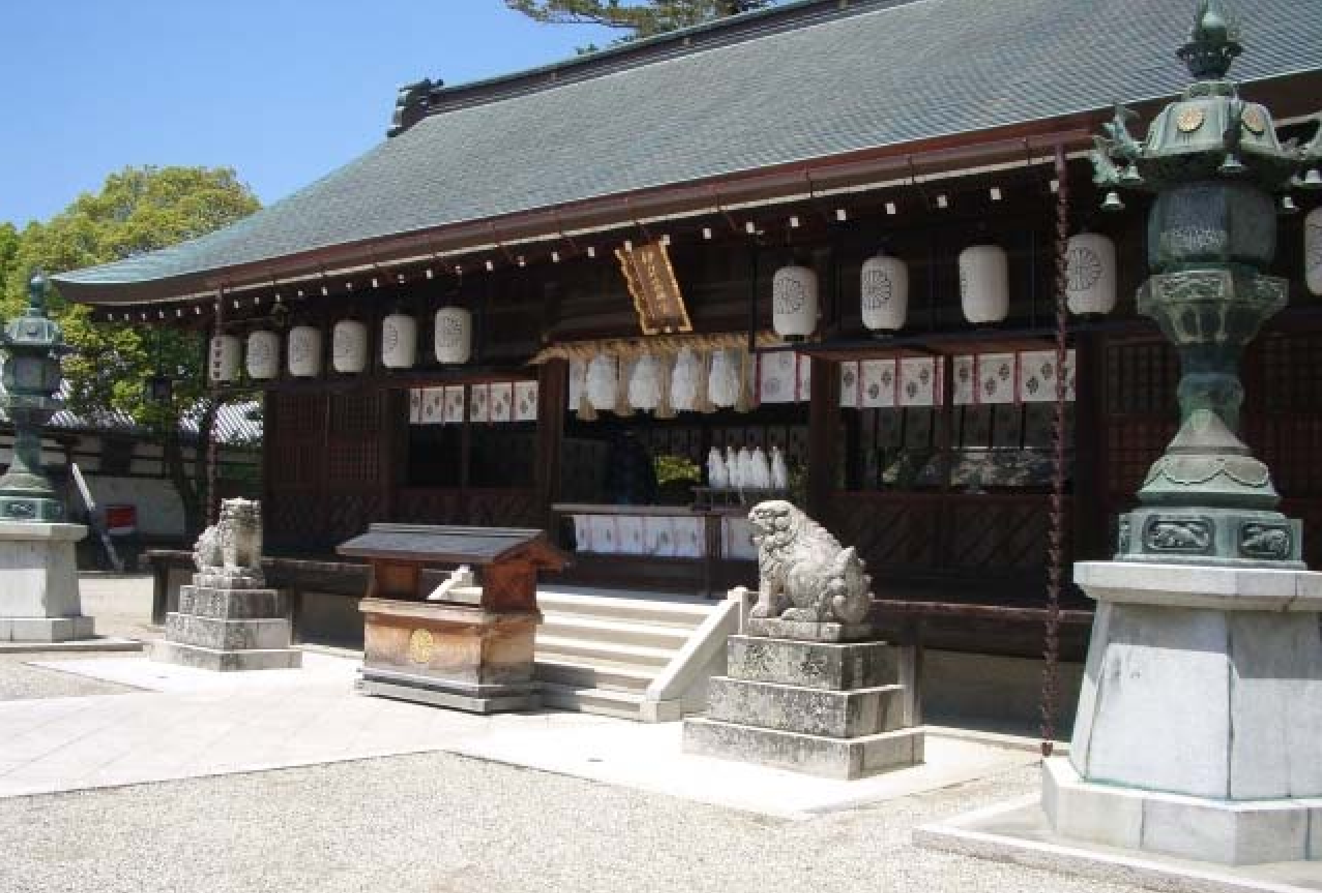
国生み神話の淡路島 伊弉諾神宮