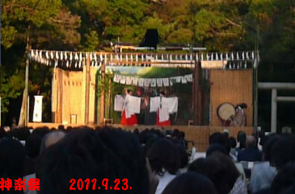
淡路島 伊弉諾神宮 神樂祭 2017.9.23.