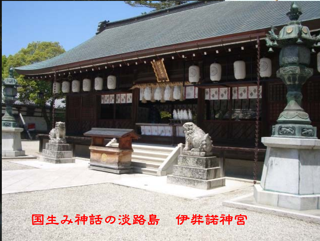
国生み神話の淡路島 伊弉諾神宮