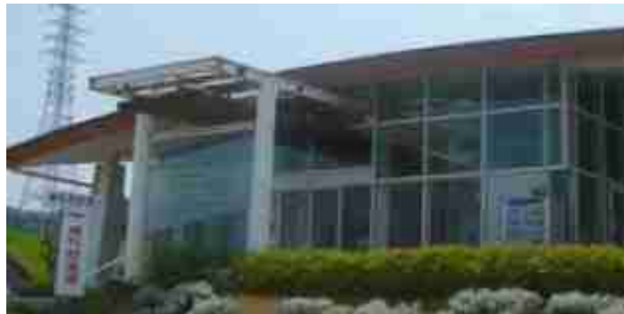
「弥生の鍛冶工房・五斗長垣内遺跡への道」展が開催されている淡路島 北淡震災記念公園セミナーハウス