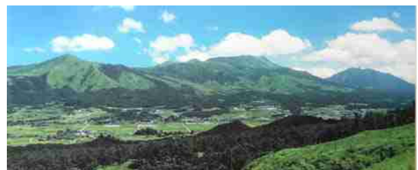
弥生後期 大量の鉄を集積した集落群があった阿蘇谷

鉄器は弥生時代を通じて圧倒的に北部九州に集中する。3世紀初めにヤマト王権が誕生してもいぜんこの傾向は変わらないが、東日本にも普及しはじめる。この直後、3世紀後半以降の定型化した前方後円墳からの大量の鉄器埋納によって九州と近畿の鉄器量は逆転する(寺沢薫氏による説明)。地図1は、川越哲志編「弥生時代鉄器録」(2000年刊)を一部時期補正して寺沢薫氏が作成