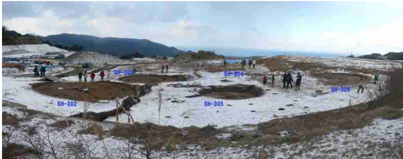
2008年発掘調査 (4)-3地区 主要部 2008.1.25.