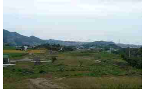
弥生後期 大量の鉄を集積した集落群があった阿蘇谷