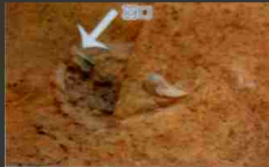
羽口の残る鍛冶炉

吉備古代文化財センターに展示されていた鬼ノ城 鍛冶工房跡で発掘された遺物 2010.1.15.