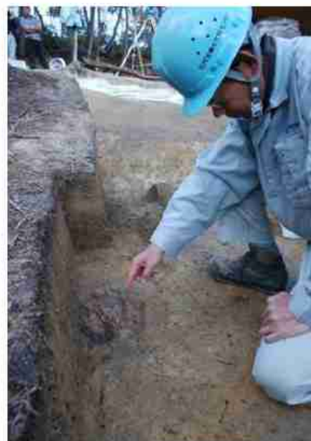
鬼ノ城で新たに見つかった鍛冶炉跡

鍛冶炉跡は、3カ所の調査区（計1350平方メートル）すべてから出土。地面に穴を掘り、内側に粘土を張った構造で、最大で直径30センチ、深さ8センチ。高温を受けて炉壁は赤く焼け締まり、一部には鉄滓が付着していた。伴った須恵器（すえき）からいずれも7世紀後半とみられる。