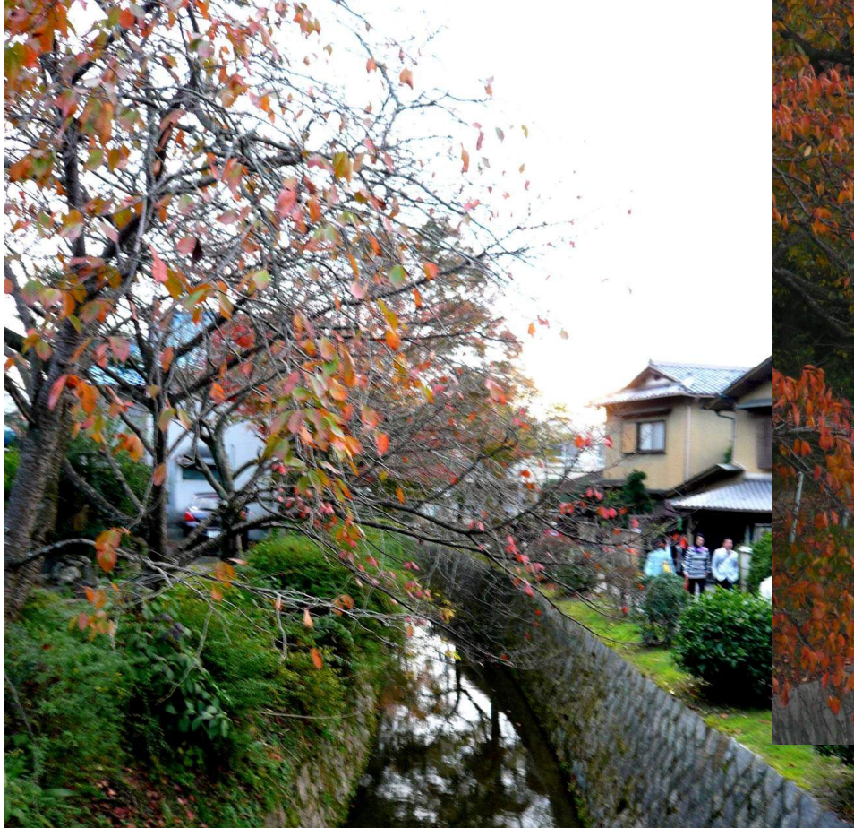
哲学の小道・疎水