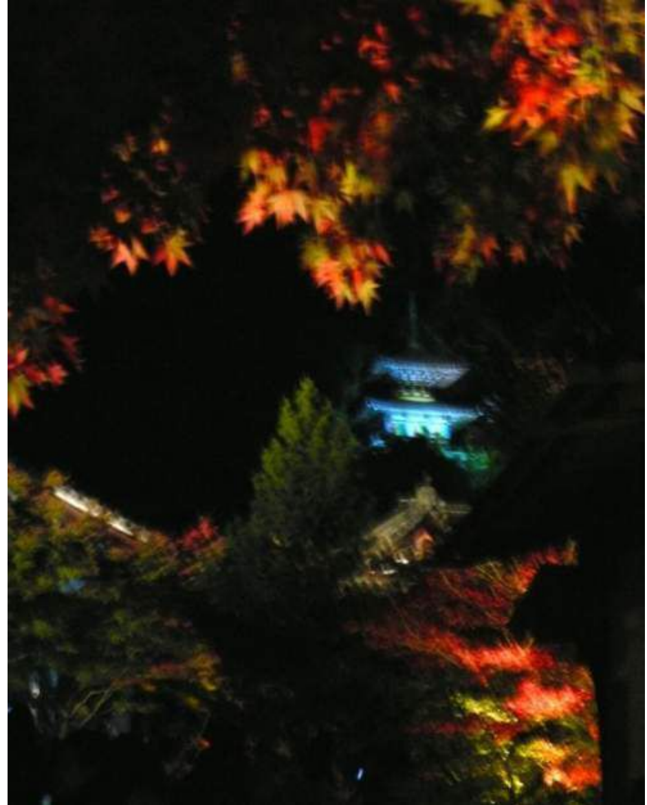
東山 紅葉の永観堂 ライトアップ 2009.11.15.