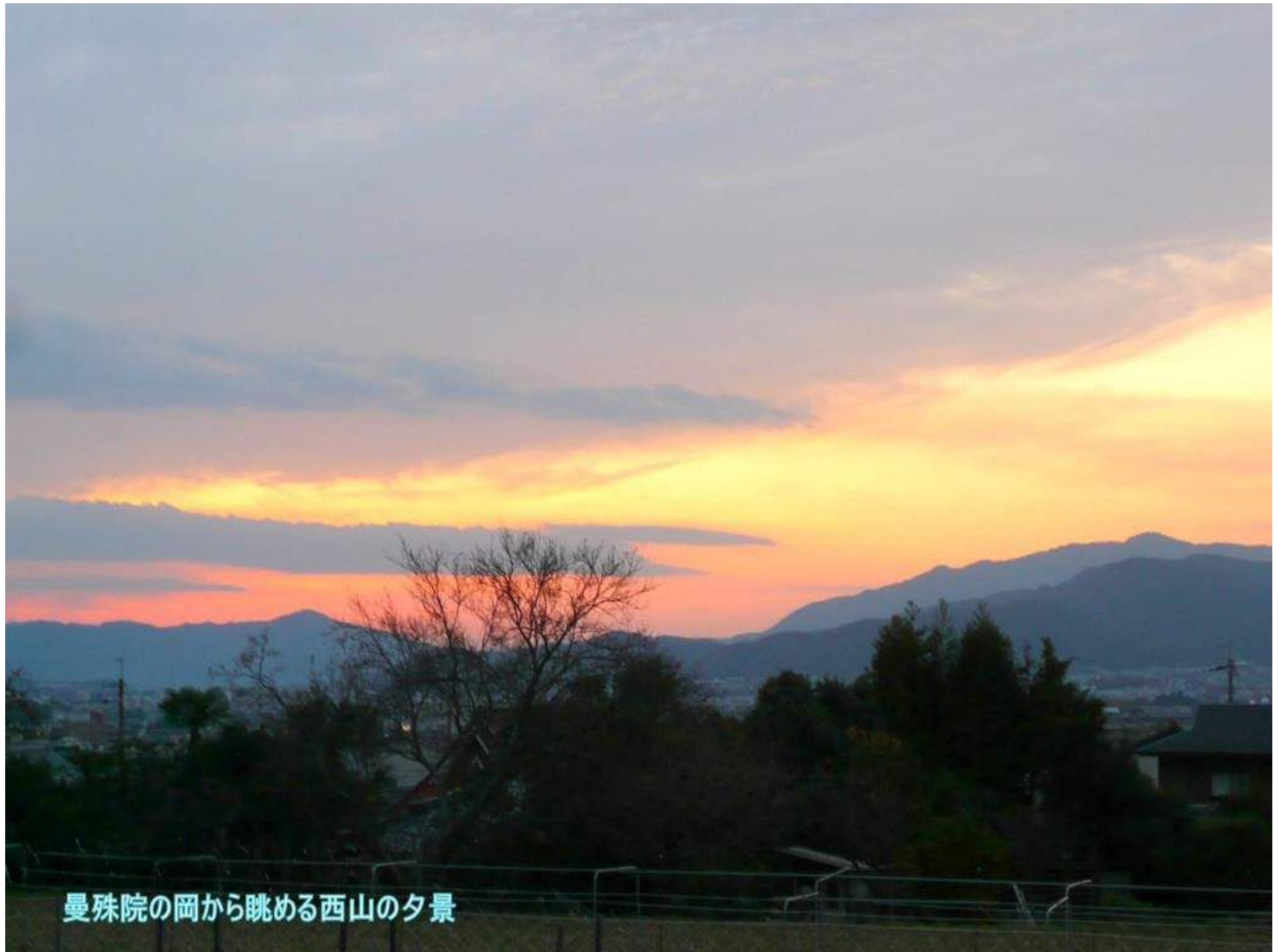
曼殊院の岡から眺める西山の夕景