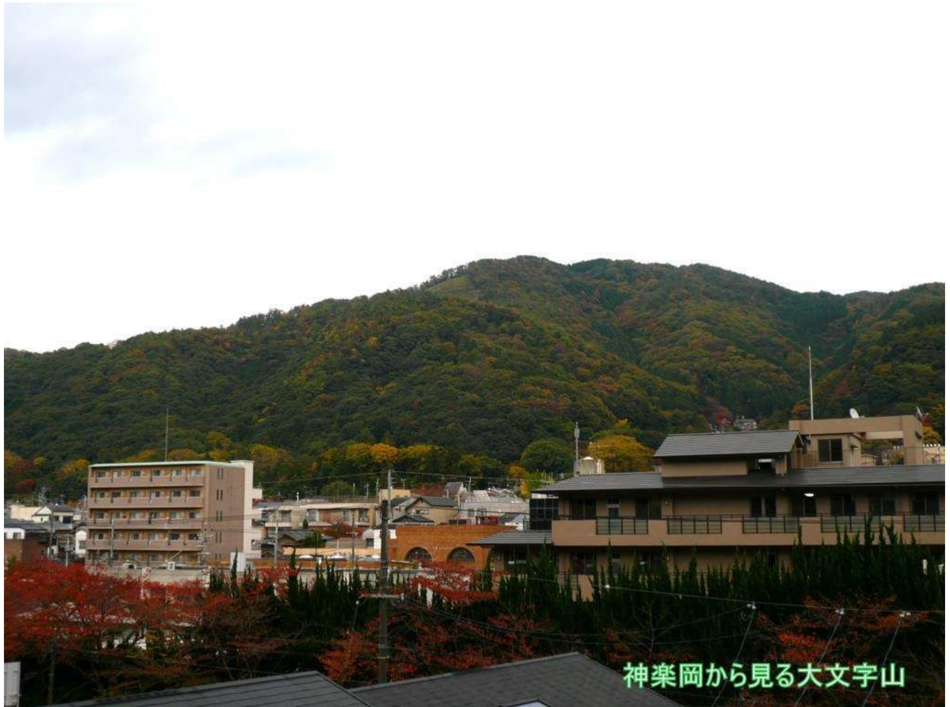
神楽岡から見る大文字山