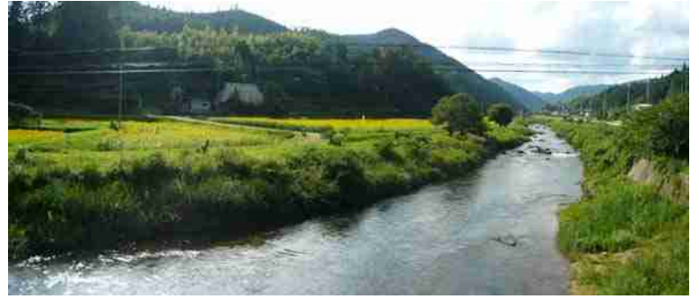
西下野 ひまわり畑 2009.7.31.

数多くのひまわりが一齐に太陽に顔を向けている「ひまわり畑」を見たいと、見られるかどうか判らぬままに、一度新聞か何かで見た「西播磨 旧南光町のひまわり畑」へ。山崎から 山崎断層地帯の中 中国自動車道と並行しながら、千種・佐用へ向かう県道53号線を西へ山越えする。何度もたたら遺跡を訪ねた所である。千種から流れ下る千種川とぶつかる下三河の三叉路の流れに沿って少し下ったところで、川沿いの田が真っ黄色になっているのが見えた。何度も出かけたことのある「西下野」の集落で、このすぐ先は今年の春 大きな一本桜「光福寺の糸桜」を見た佐用町「漆畑」である。