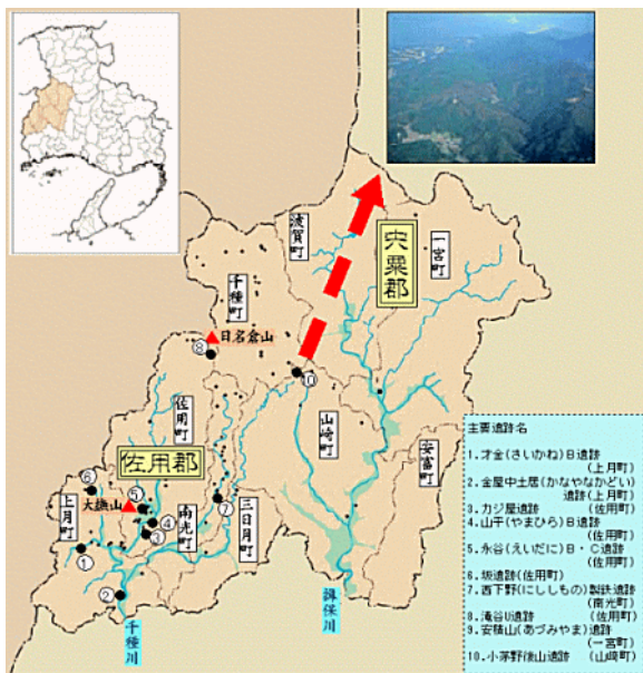
播磨北部(佐用郡・安芸郡)の製鉄遺跡分布と西播磨 佐用町(旧南光町)西下野の位置