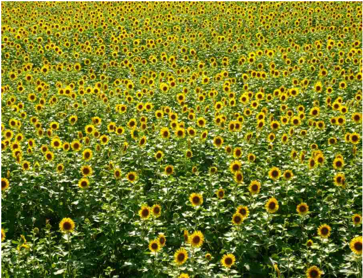
西下野 ひまわり畑 2009.7.31.

このひまわり畑周辺など佐用町で8月10日 台風9号の集中豪雨による大きな被害がでたことを知りました。 千種川・佐用川の氾濫で被災された佐用町の皆様には 心からお見舞い申し上げます。 一日も早く立ち直られることをお祈りしています