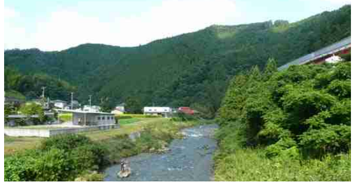
補強工事中の中国縦貫道に沿って 流れ下る千種川 この山裾に 奈良時代のたたら跡 西下野遺跡があった