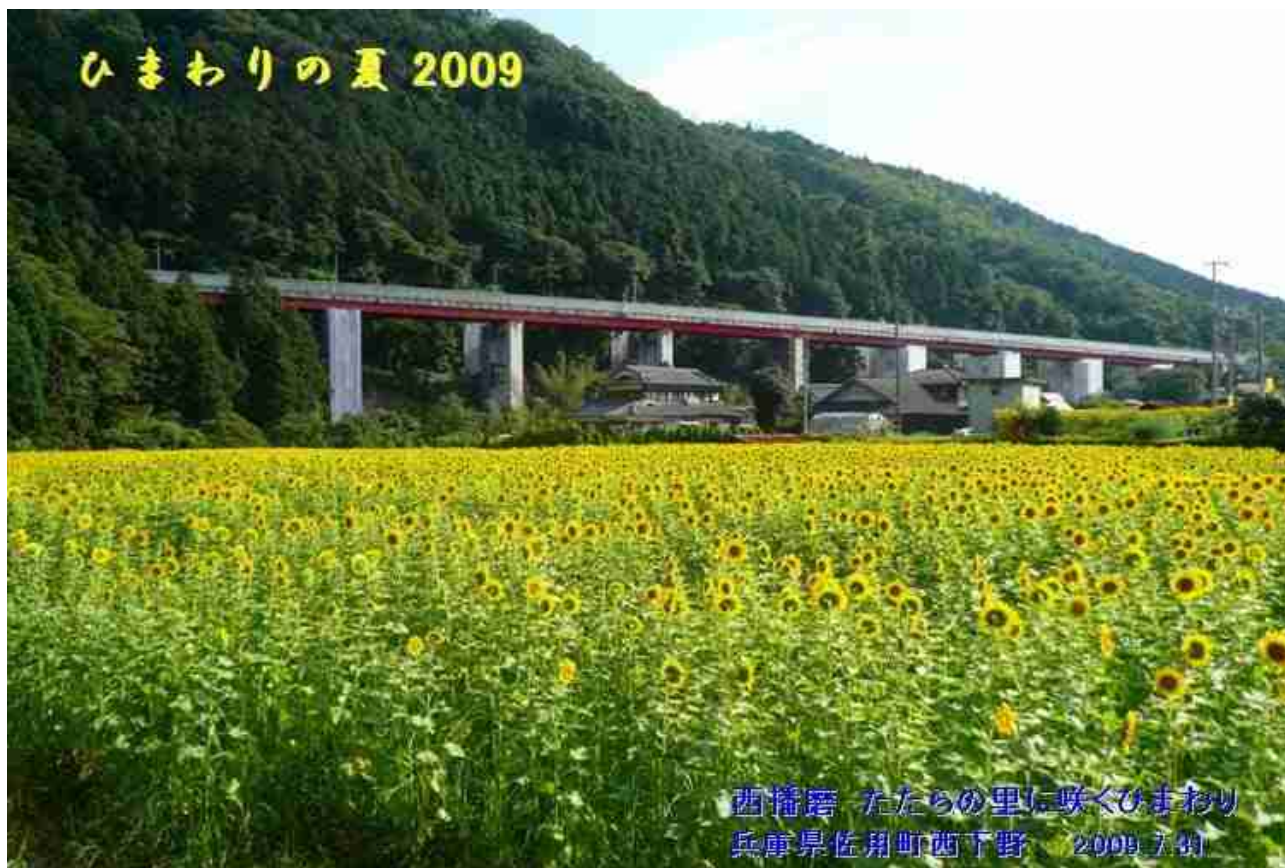
西播磨 佐用町(旧南光町)西下野のひまわり畑 2009.7.31.