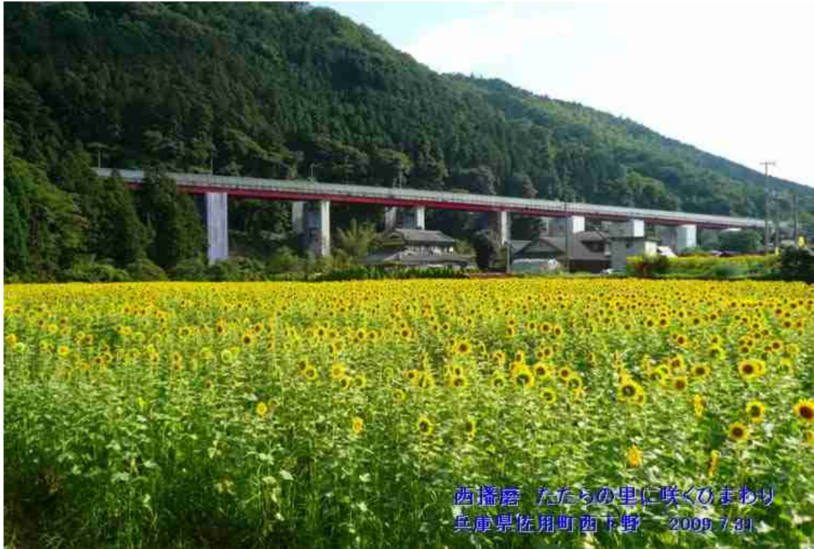
西播磨 たたらの里に咲くひまわり 兵庫県佐用町西下野 2009.7.31