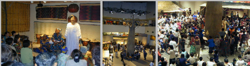
2003年4月 民博 特別展「西アフリカおはなし村」より