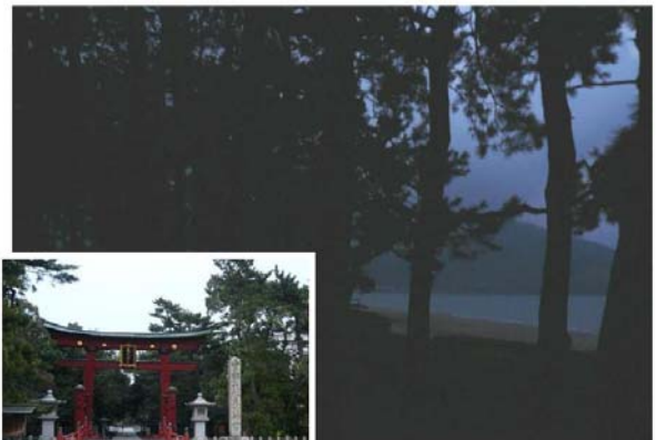
敦賀 夜の気比の松原 & 北陸道総鎮守 気比神宮 2008.3.25.