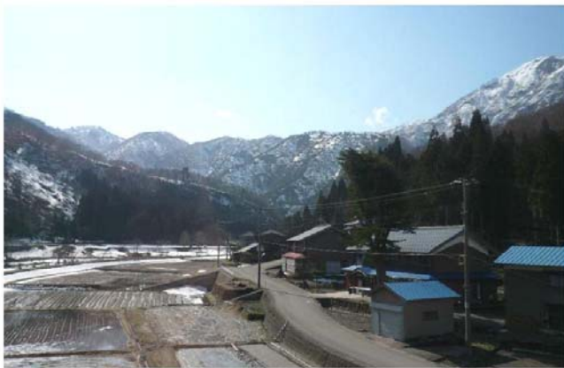
荒島岳をぶち抜いたトンネルをぬけると その街道すじはまだ残雪の残る冬の装い 荒島岳の登山口 勝原周辺 2008.3.25.