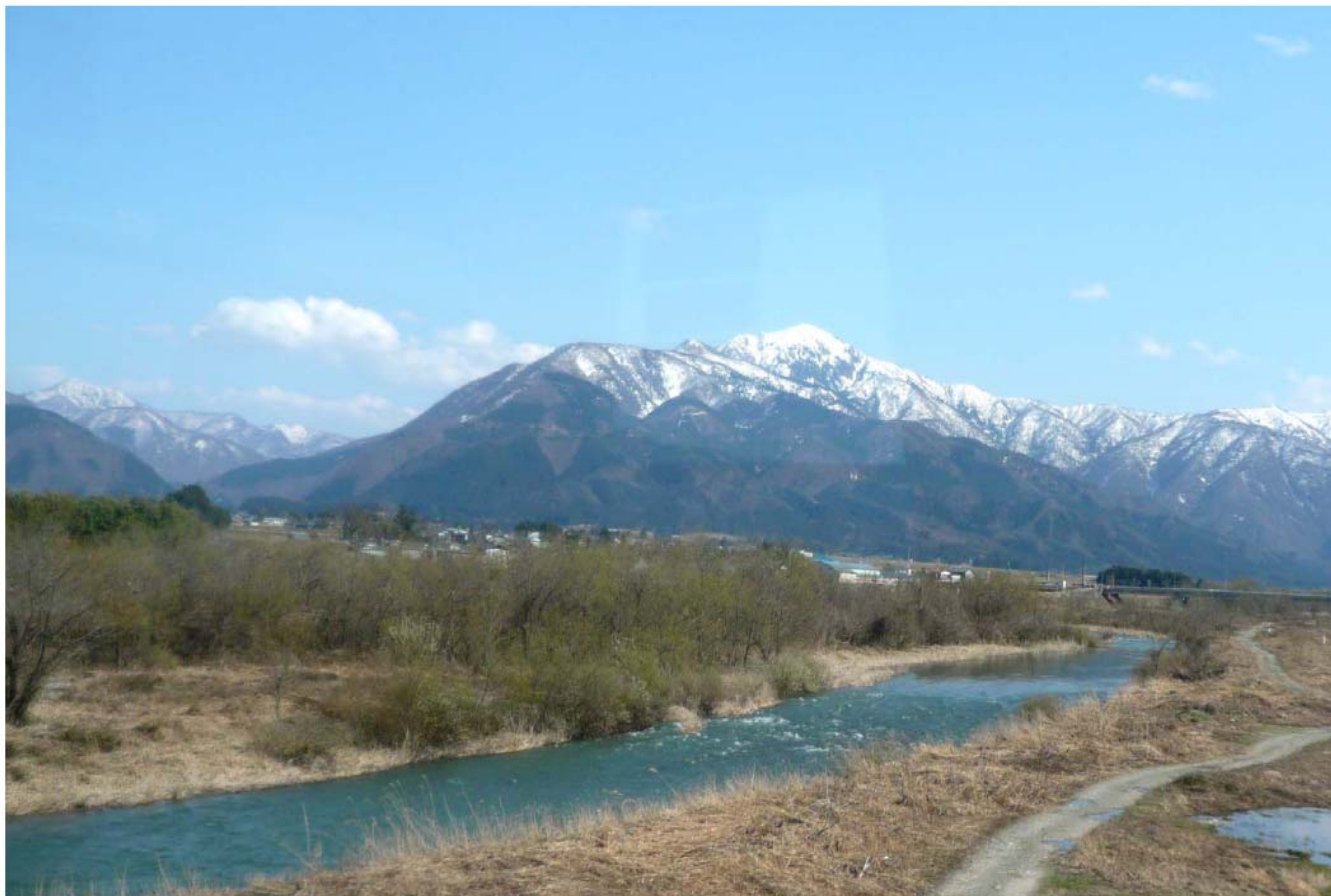
福井県の名峰 日本百名山 越前大野盆地の南にそびえる荒島岳 2008. 3. 25.