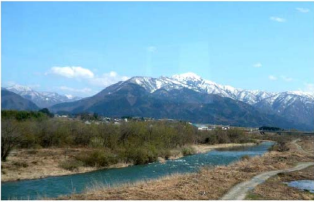
福井県の名峰 日本百名山 越前大野盆地の南にそびえる荒島岳 2008.3.25.