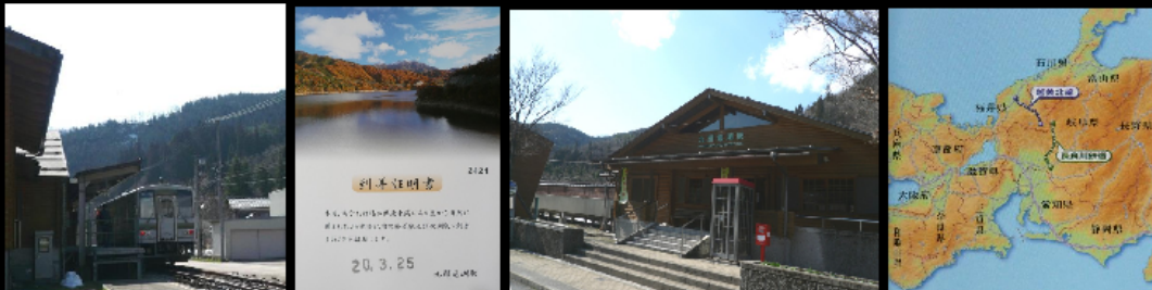
JR 越美北線 終着駅 九頭竜湖駅 到着証明書

etsumi00.htm 2008.3.25. by Mutsu Nakanishi