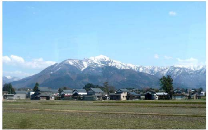
福井県の名峰 日本百名山 越前大野盆地の南にそびえる荒島岳 2008.3.25.