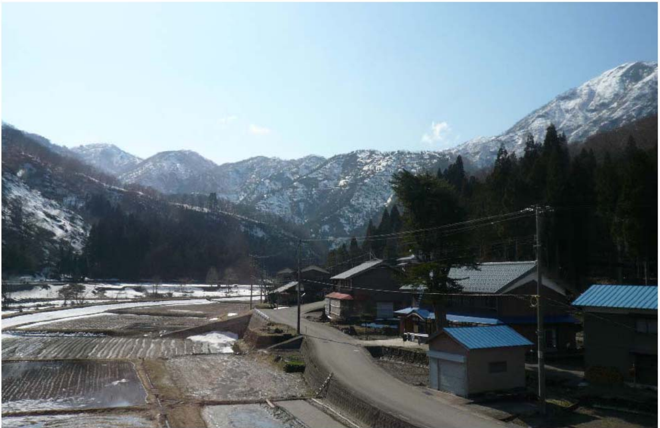
荒島岳をぶち抜いたトンネルをぬけると その街道すじはまだ残雪の残る冬の装い