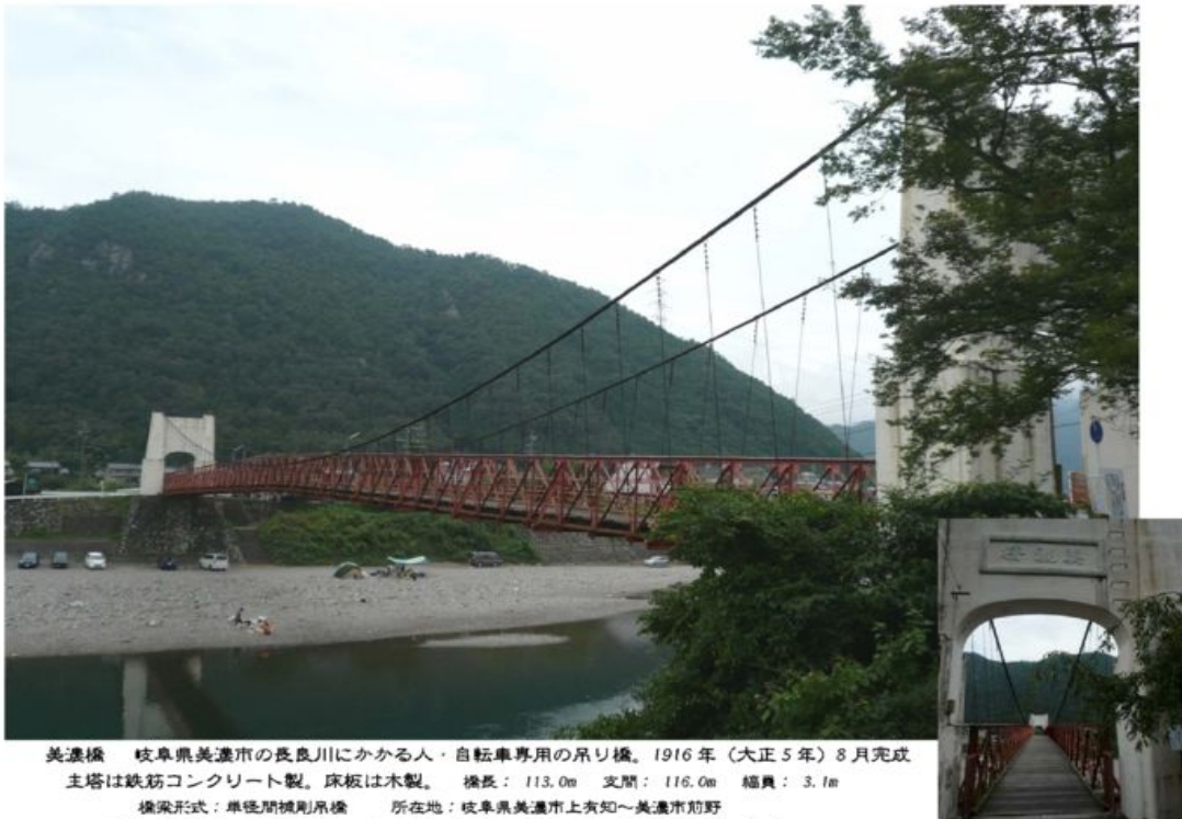
美濃橋 岐阜県美濃市の長良川にかかる人・自転車専用の吊り橋。1916年(大正5年)8月完成 主塔は鉄筋コンクリート製。床板は木製。橋長：113.0m 支間：116.0m 幅員：3.1m 橋梁形式：単径間補剛吊橋 所在地：岐阜県美濃市上有知～美濃市前野 現存する最古の近代吊橋で、2003年(平成15年)に国の重要文化財に指定

minobg00.htm 2007.9.10. by Mutsu Nakanishi