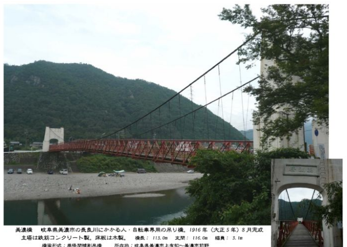
美濃橋 岐阜県美濃市の長良川にかかる人・自転車専用の吊り橋。1916年(大正5年)8月完成 主塔は鉄筋コンクリート製。床板は木製。 橋長：113.0m 支間：116.0m 幅員：3.1m 橋梁形式：単塔間橋式吊橋 所在地：岐阜県美濃市上矢知～美濃市河野 現存する最古の近代吊橋で、2003年(平成15年)に国の重要文化財に指定