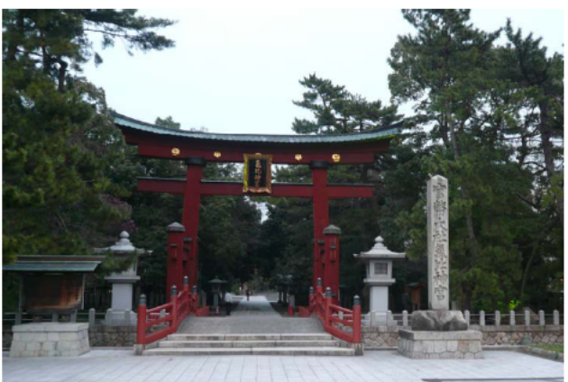
敦賀 夜の氣比の松原 & 北陸道総鎮守 氣比神宮 2008. 3. 25.