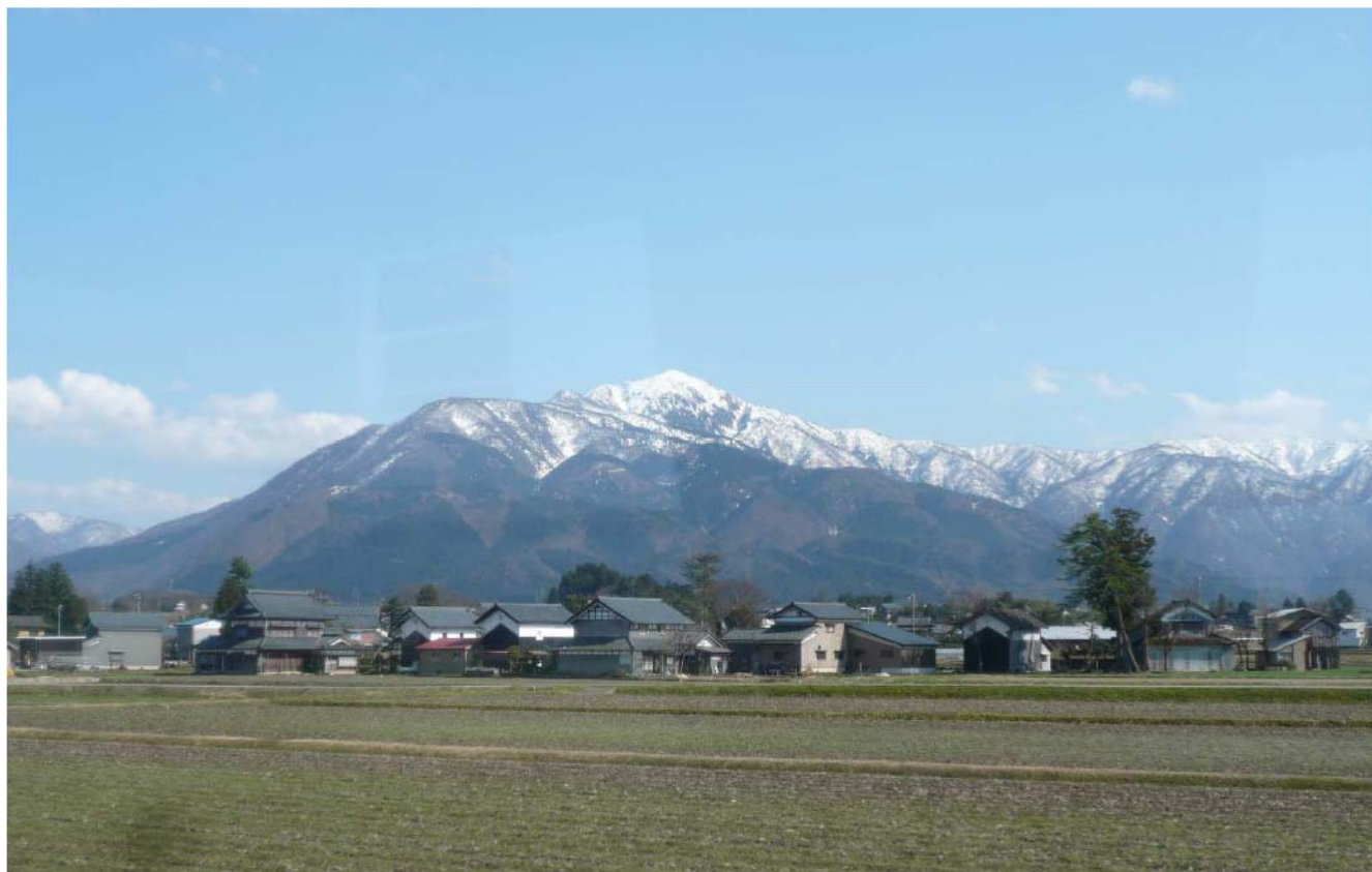
福井県の名峰 日本百名山 越前大野盆地の南にそびえる荒島岳 2008. 3. 25.