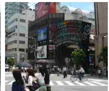
神戸の中心地 三宮・元町で 2009.5.29、午後