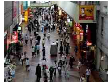
今週はマスク姿も消え 賑わいが戻ってきました 神戸元町で