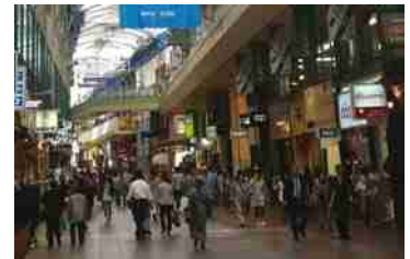
神戸の中心街で (元町 南京町 三宮センター街など) やっと人も増えつつ 活気が出てきました