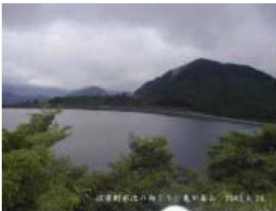
沼原(めまっぱら)揚水発電所 上池貯水池