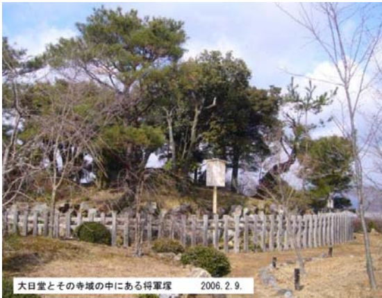
大日堂とその寺域の中にある将軍塚 2006.2.9.

「アテルイは親、兄弟を愛し、美しい自然を愛すために生きた。 21世紀の人間がどう生きるかという大切なメッセージがある」と東北の人達はメッセージを送る。