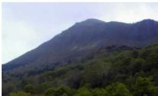
安達太良連峰 鬼面山 新野地温泉より