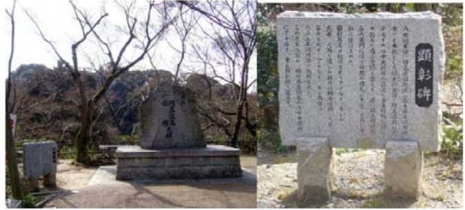
清水寺 南の谷に面する清水の舞台下の丘にある アテルイ・モレの顕彰碑