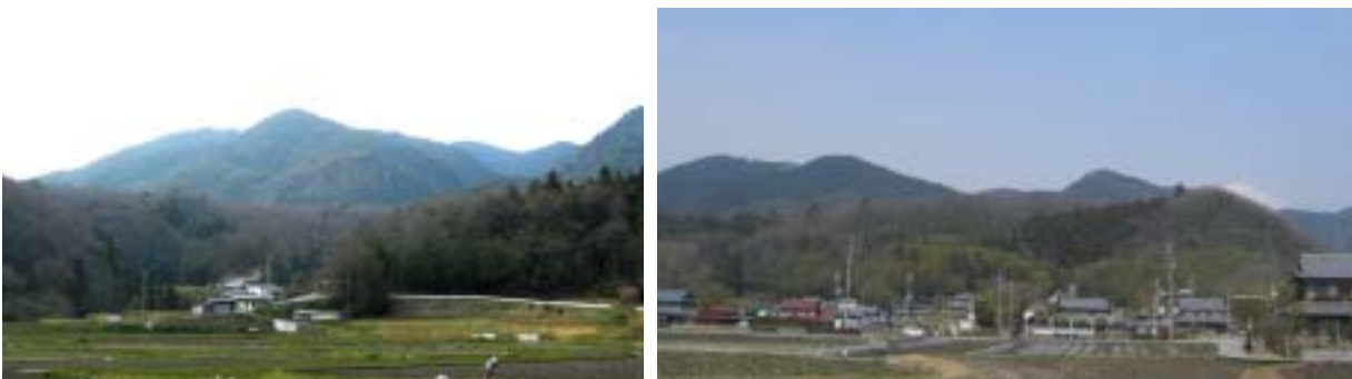
丹生山の南側 坂本集落からみた丹生山 2005.4.13.