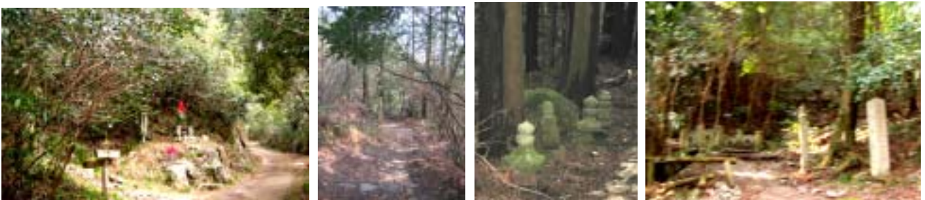
信仰の山 登山道の脇には道標など古い石仏が並んでいます