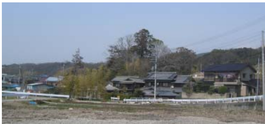
志染・押部谷の豪族忍海部細目の豪邸・顕宗・仁賢神社のある 木津周辺

「自分の住む神戸周辺に「たたら」遺跡がないのか?」と気になりながら、神戸の「たたら」製鉄遺跡については 聞いたことがなく、「あるとすれば この丹生山周辺」と思われ、何度となく 「辰砂や鉄鉱石の痕跡がないか? 」とこの山の周辺を歩いているが、いまだ 良くわからない。