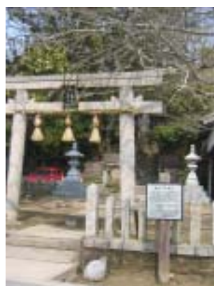
志染・押部谷の豪族忍海部細目にかくまわれた後の顕宗・仁賢天皇を祭る顕宗・仁賢神社