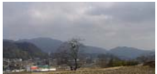
古代から開けた丹生山・山田の集落

丹生山へは丹生神社前のバス停から鳥居をくぐって 集落を真っ直ぐ北に登っていったところが登山口で ここからは 明るい林の中や尾根すじの昔の参詣道を登って、視界は開けないが約1時間ほどで丹生山山頂に出る。