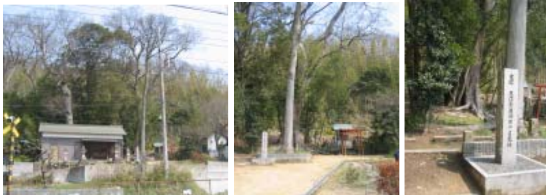
志染・押部谷を治める豪族忍海部細目の館跡 神戸市西区押部谷 木津