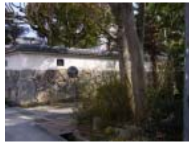
南僧尾から淡河・丹生山を望む