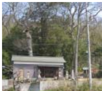
古代韓鍛冶 忍海部一族の館跡