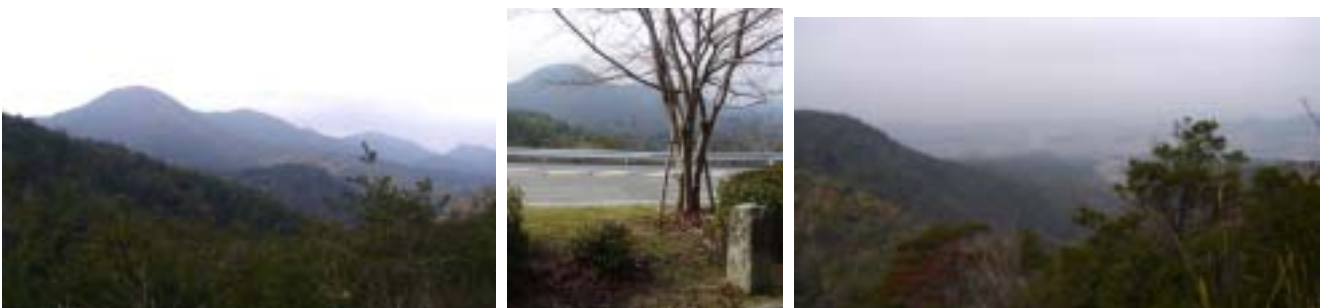
山を越えて 環境センターのところから左手に深い谷が北へ広がる この谷の先 眼下に淡河の街

環境センターの入り口のところに古い大きな道標と淡河への旧道が見え、「左 淡河 吉川 右 木津」の字が読み取れる。