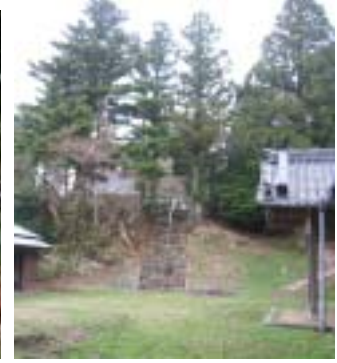
丹生山 山頂 丹生神社 結局頂上まで林の中で 視界が開けず