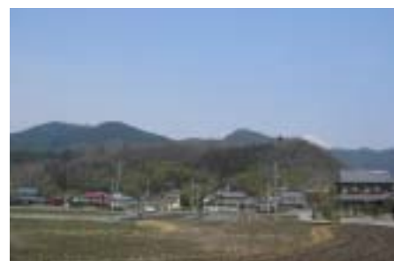
丹生山とその山麓 坂本集落