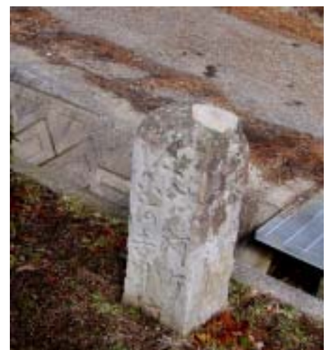
環境センター横から淡河に伸びる静かな旧道とのかたらにある道標