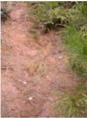
朱土が露頭する崖

崖の上の道へよじ登るが、道際 の 崖の断面ほど赤くない。想像していた赤よりも酸化鉄系のベンガラ色に近い。今まで山で赤色の土をみるとベンガラと思ってきましたが、朱土が混じていたかもしれない。