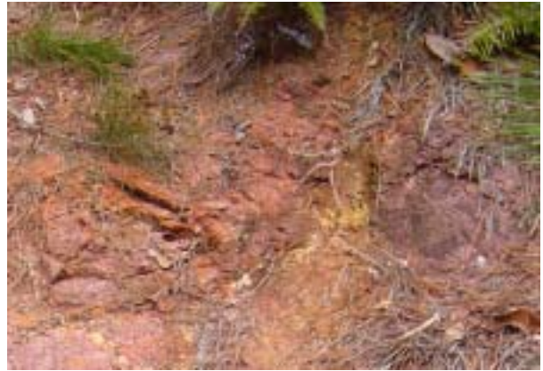
朱土の露頭の拡大

目を近づけてみると 本 当 に赤い。また 黄色味を帯びた土も周辺に見えるので、間違いなく朱土である。火山活動の熱水が岩の割れ目を伝って上昇し、その中に含まれる水銀が硫黄と反応して硫化水銀・辰砂となり、それが 土と混ざって赤土となっている。