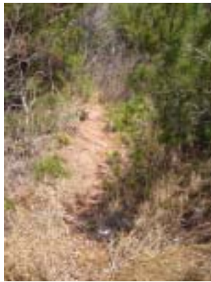
崖の上に乗ったところ