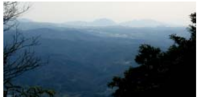
丹生山頂上南側の展望 六甲山系・遠く高取山・須磨の横尾山が浮いていました