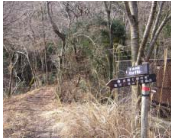
稚児墓山と帝釈山の鞍部周辺 このルートの最高点近傍

ここから道はこの谷に沿って尾根を淡河へ下ってゆく。インターネットで調べた情報によるとここを少し下った右手山肌が「朱土」の露頭が見える場所という。