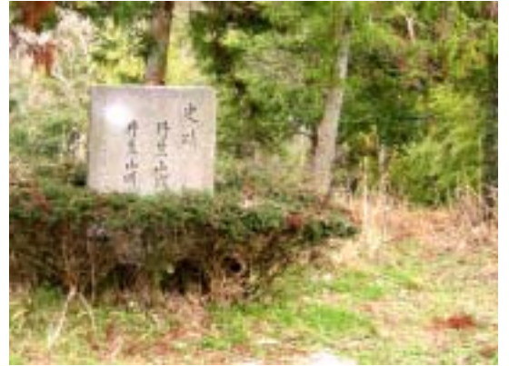
丹生山山頂近傍 古代の明要寺跡

「丹生山」の名前が示すとおり、この地は「辰砂」・鉄・銅など鉱物資源を産する山で 特に辰砂・水銀の産出がこの地を古代の重要地としたと考えられている。