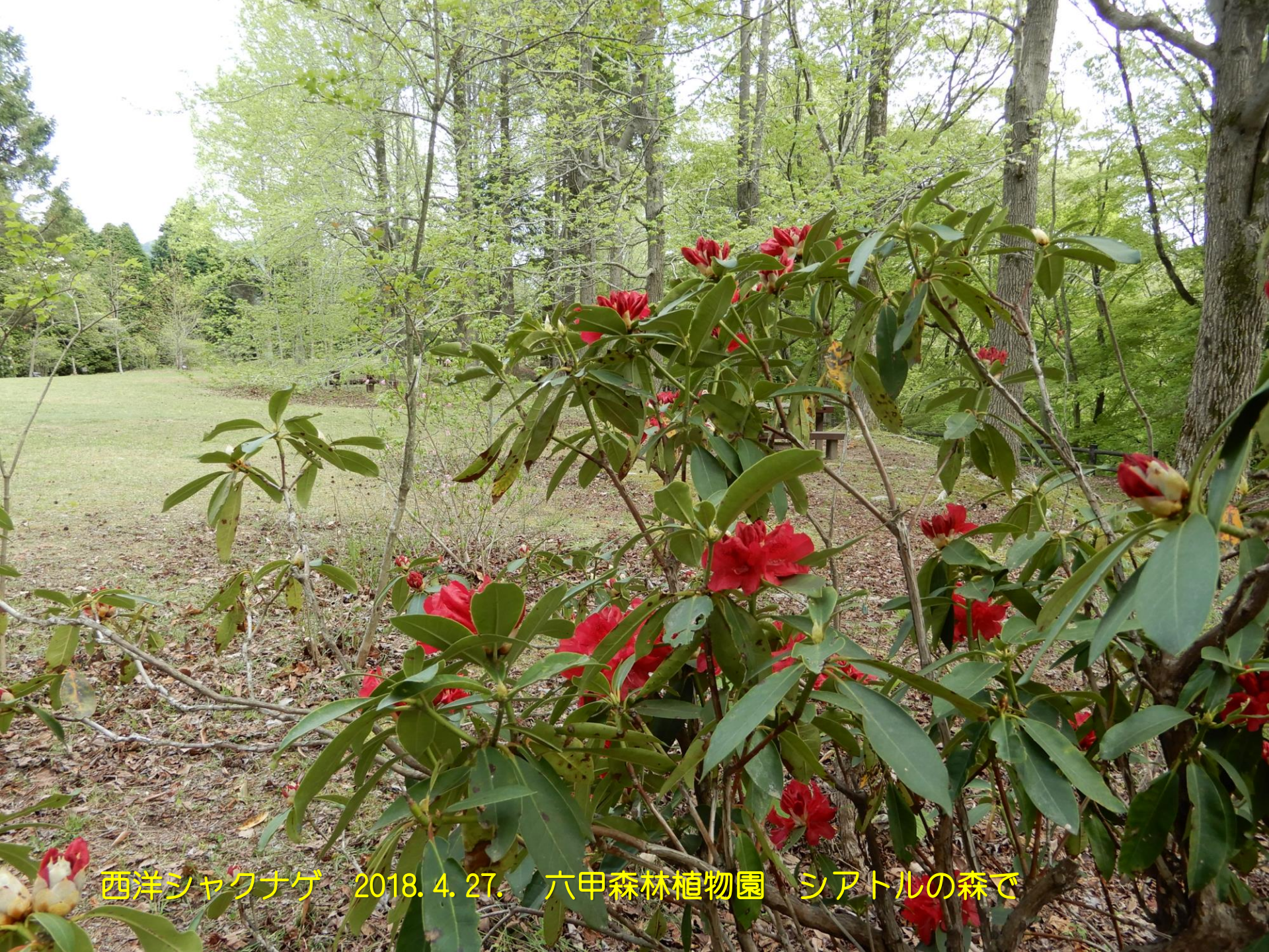
西洋シャクナゲ 2018. 4. 27. 六甲森林植物園 シアトルの森で