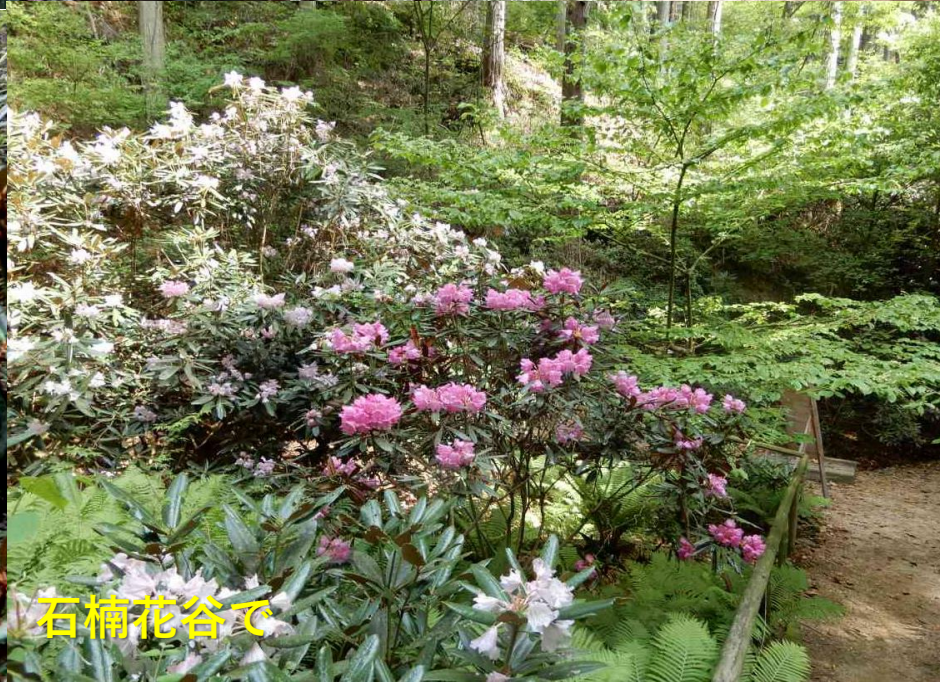
2018.4.27. 六甲森林植物園 石楠花谷で