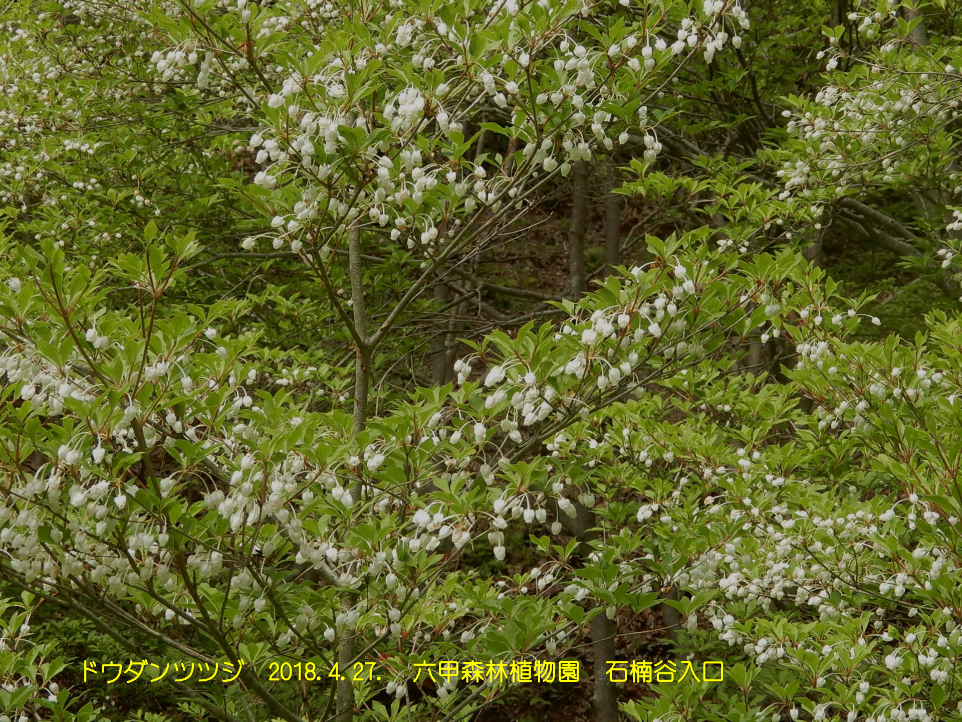
ドウダンツツジ 2018. 4. 27. 六甲森林植物園 石楠谷入口