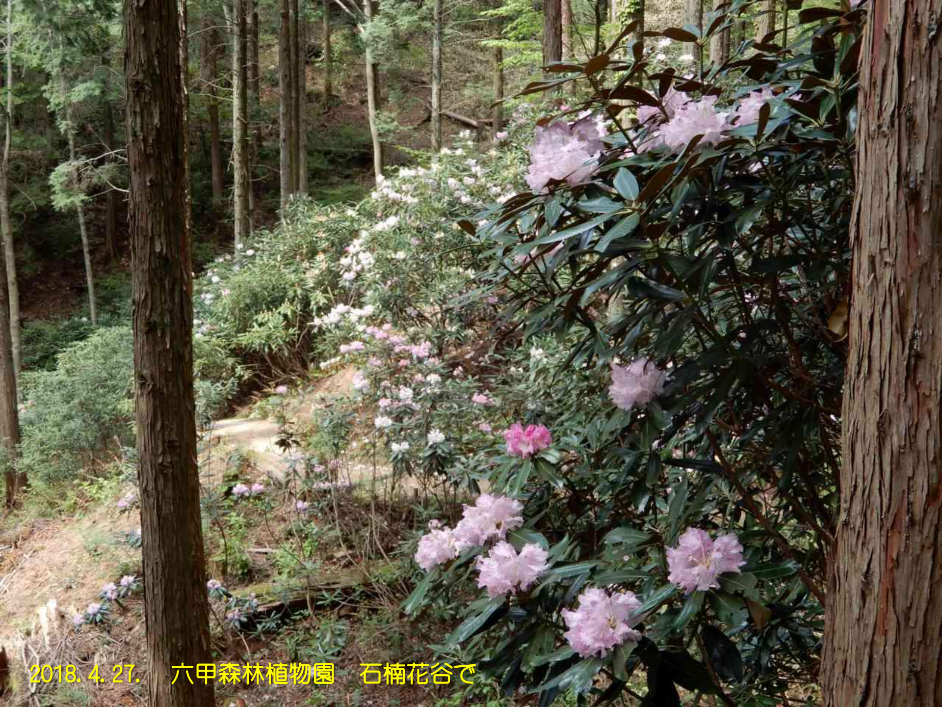
2018. 4. 27. 六甲森林植物園 石楠花谷で