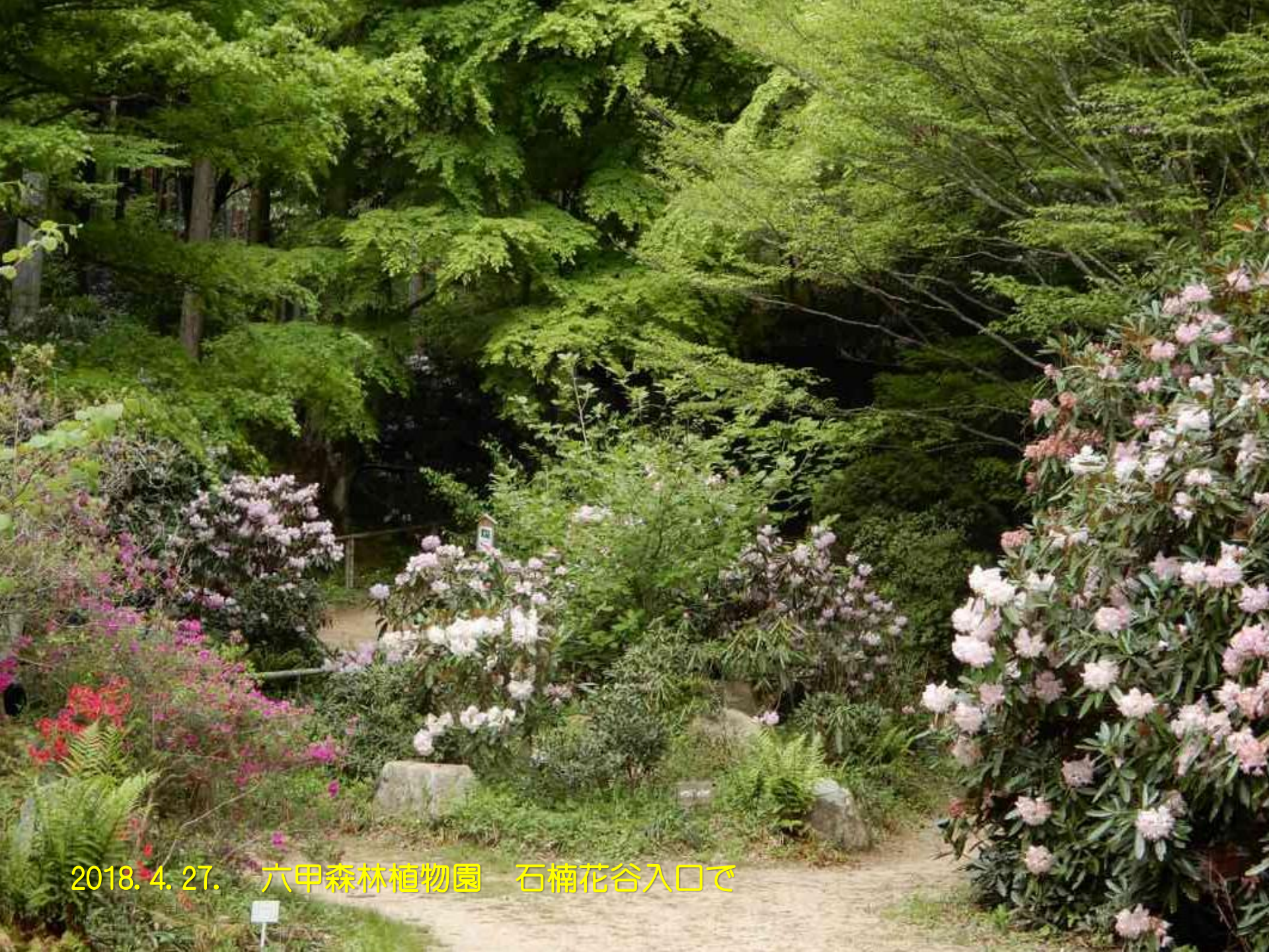
2018. 4. 27. 六甲森林植物園 石楠花谷入口で