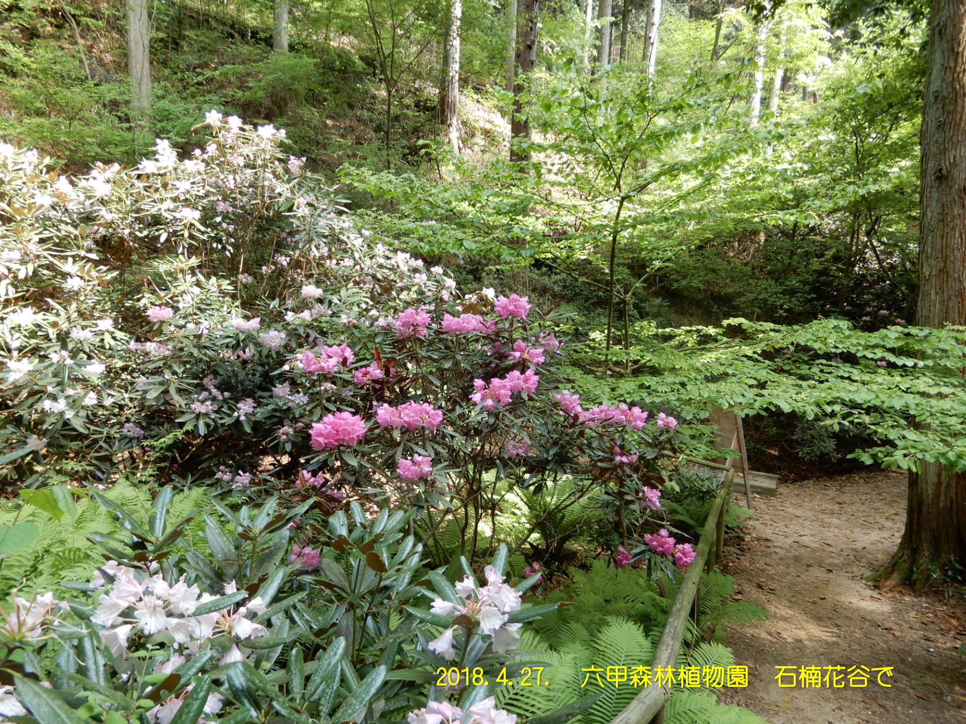
2018. 4. 27. 六甲森林植物園 石楠花谷で