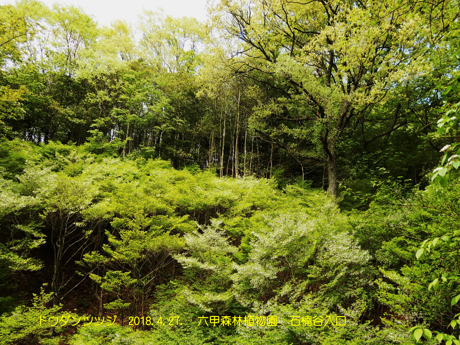
ドウダンツツジ 2018. 4. 27. 六甲森林植物園 石楠谷入口