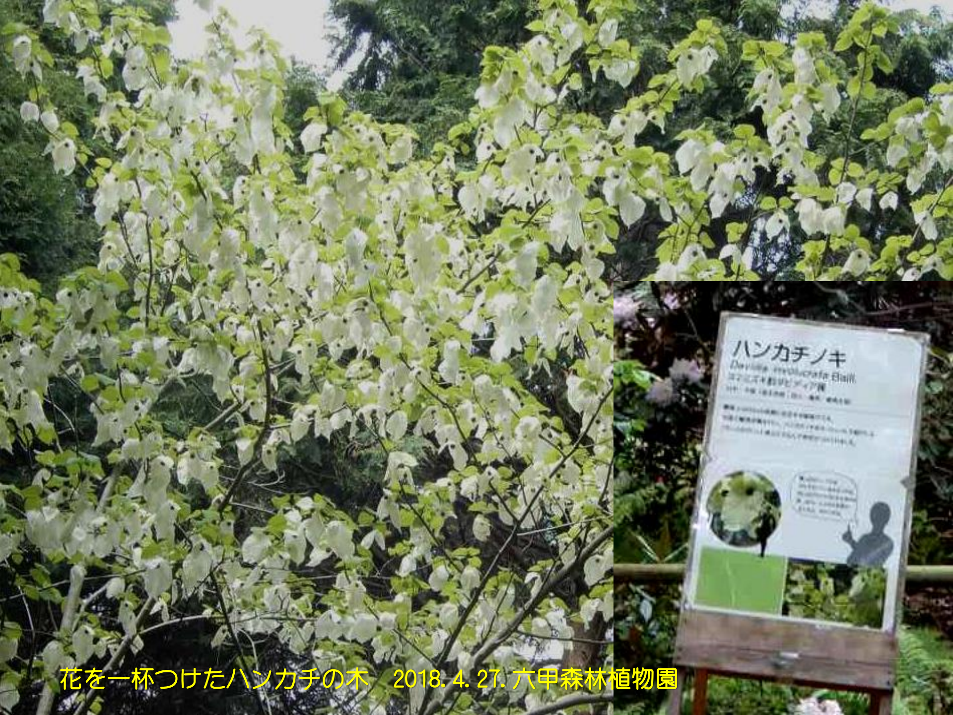
花を一杯つけたハンカチの木 2018. 4. 27. 六甲森林植物園