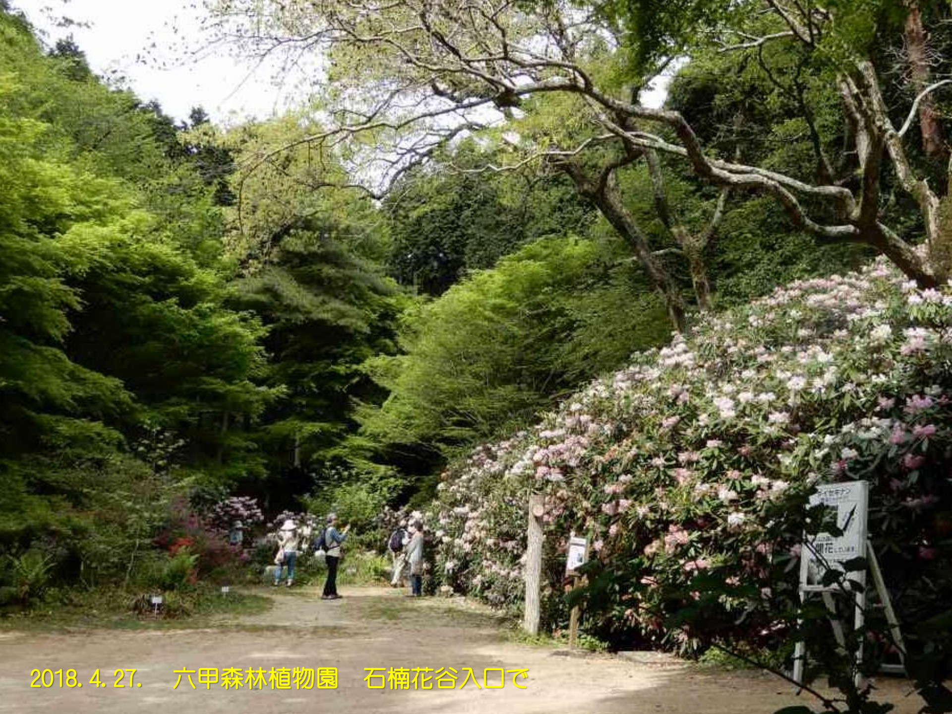
2018. 4. 27. 六甲森林植物園 石楠花谷入口で