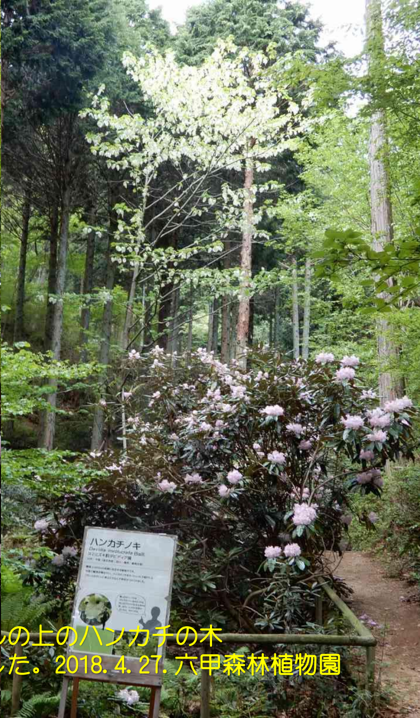
石楠花谷に入っすぐ、石楠花のトンネルの上のハンカチの木 今年も枝一杯に花をつけた姿が見られました。2018. 4. 27. 六甲森林植物園