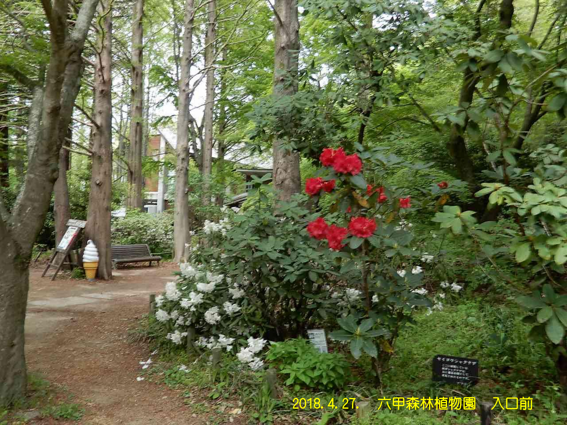
2018. 4. 27. 六甲森林植物園 入口前