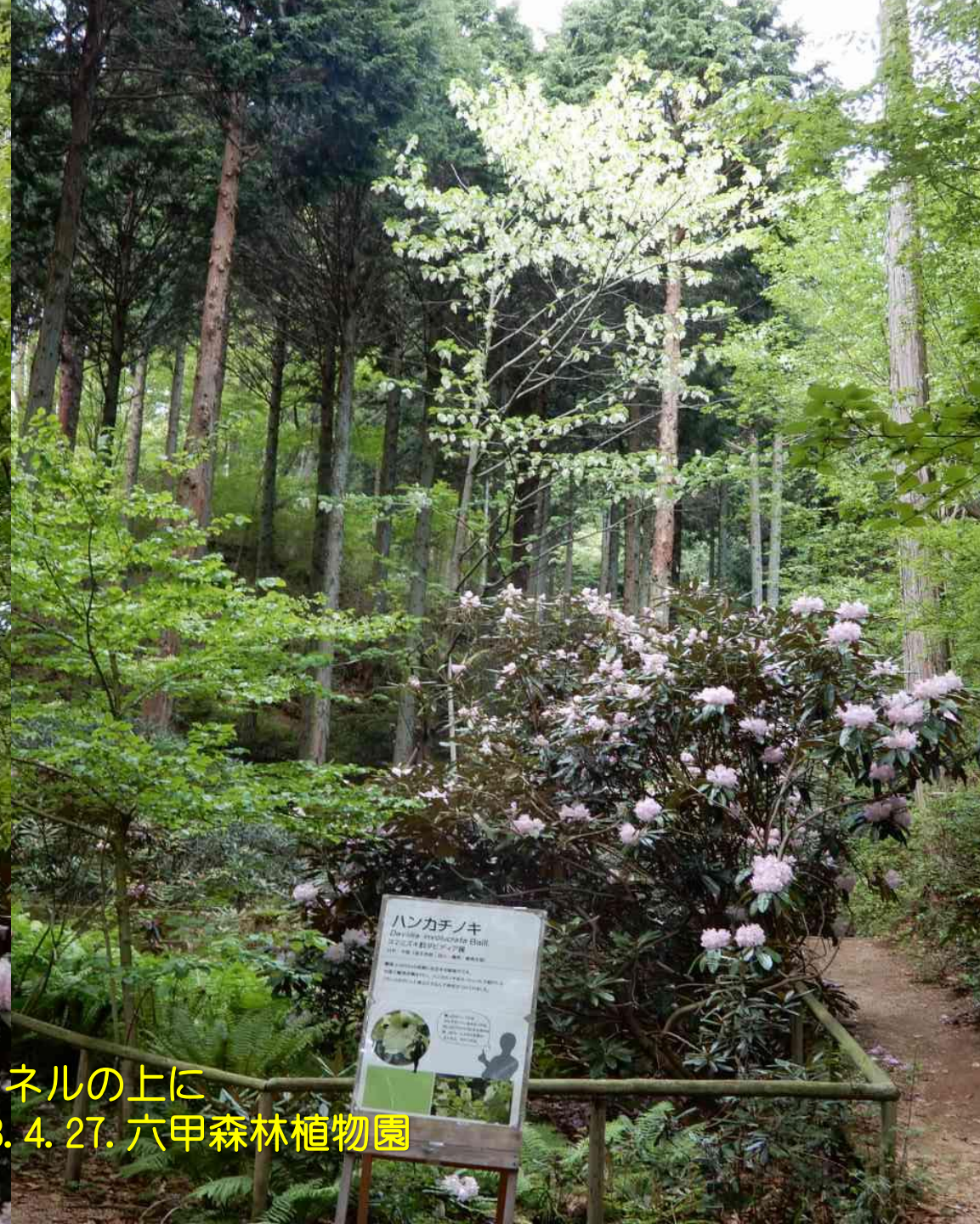
石楠花谷に入っすぐ、石楠花の花のトンネルの上に ハンカチの木が花をつけていました。2018. 4. 27. 六甲森林植物園