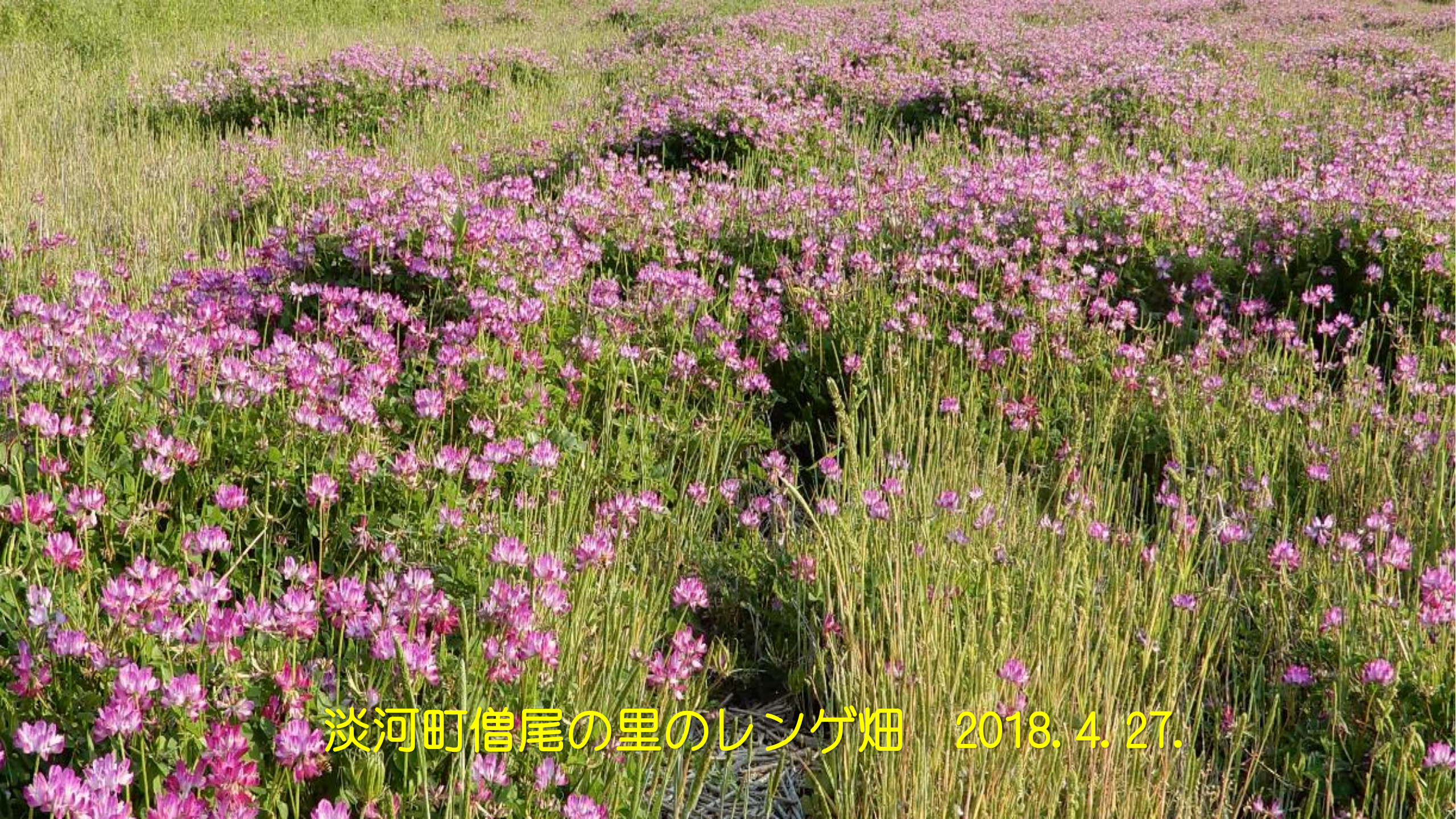
淡河町僧尾の里のレンゲ畑 2018. 4. 27.