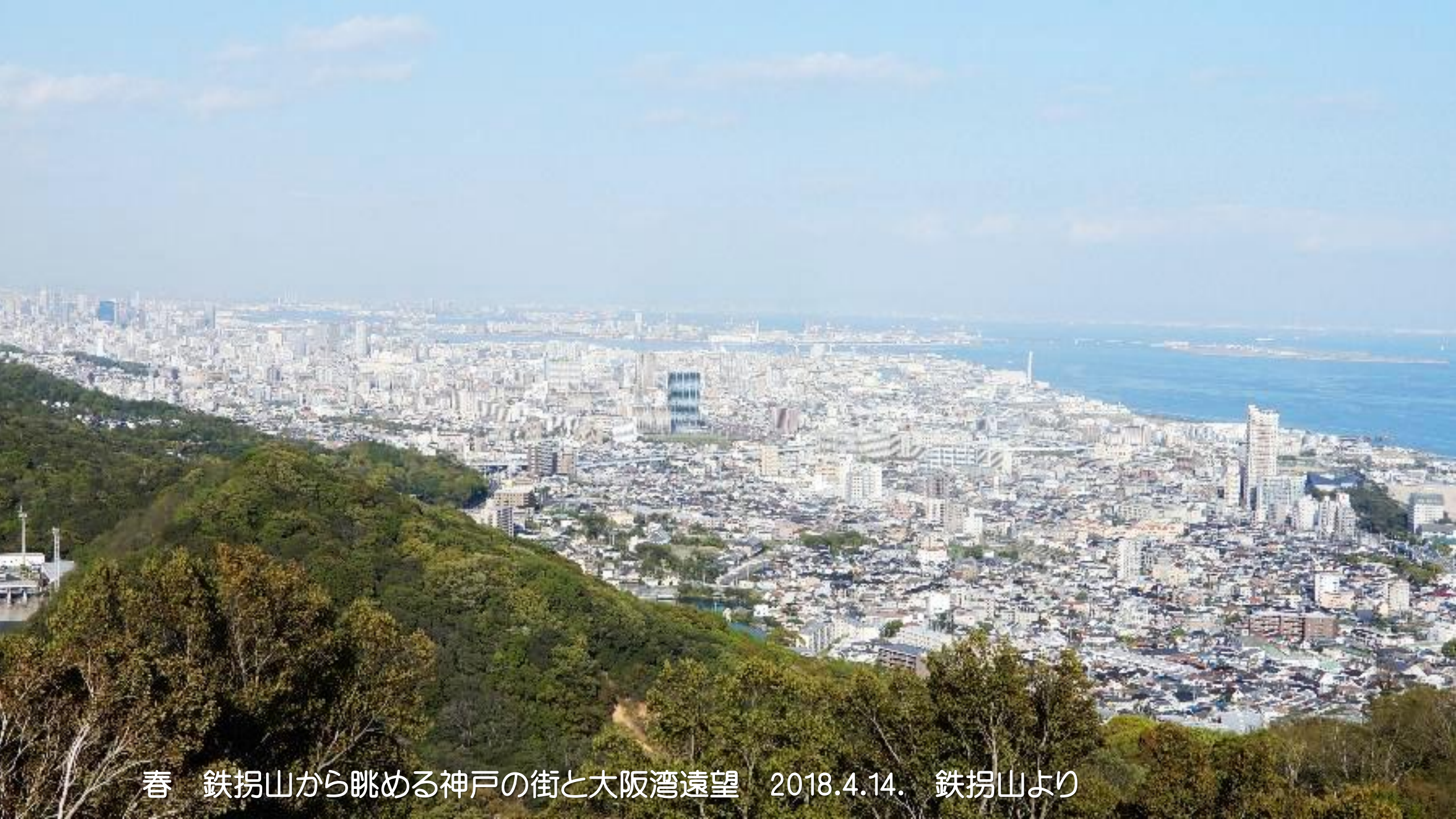
春 鉄拐山から眺める神戸の街と大阪湾遠望 2018.4.14. 鉄拐山より