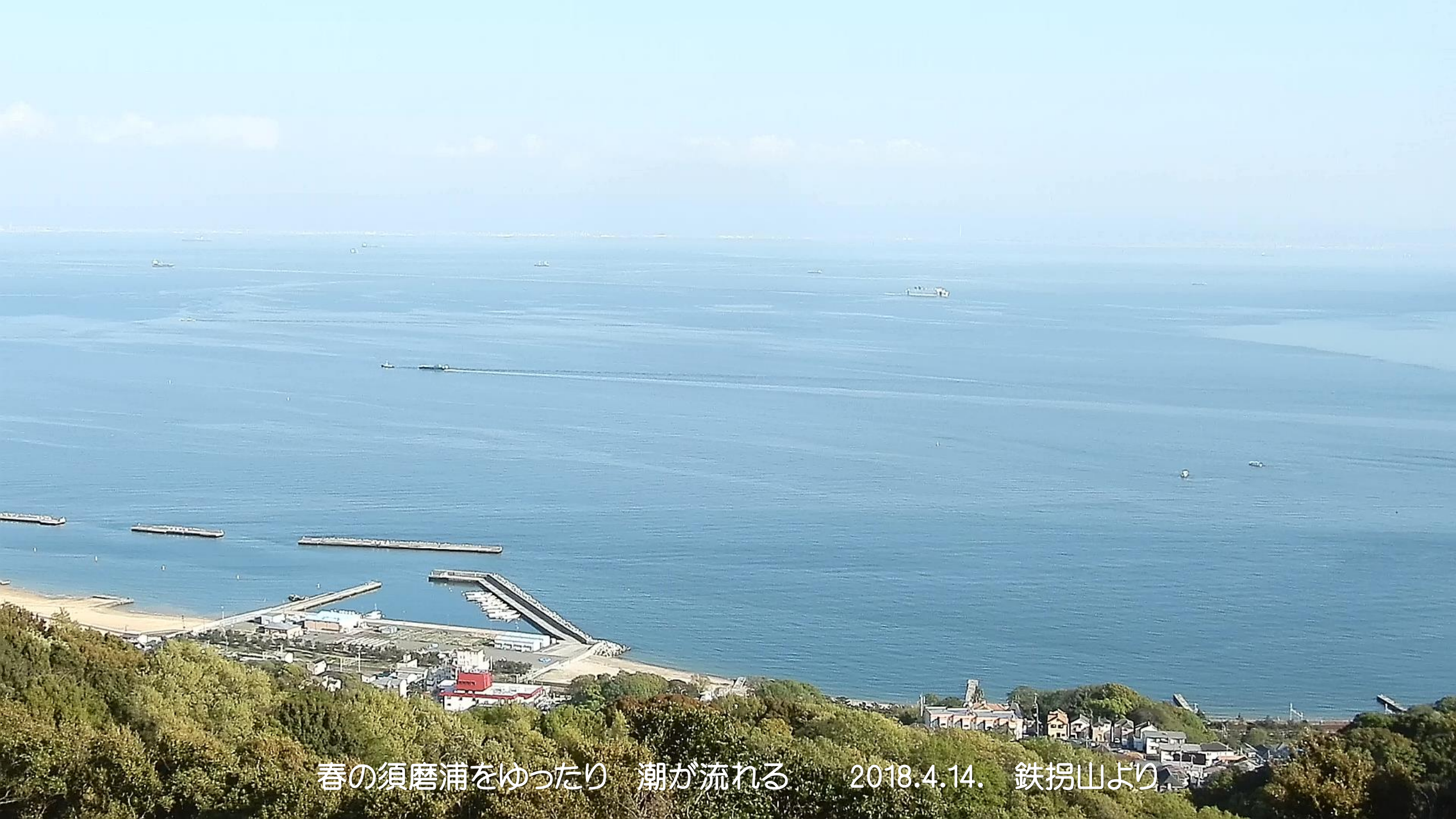
春の須磨浦をゆったり 潮が流れる 2018.4.14. 鉄拐山より