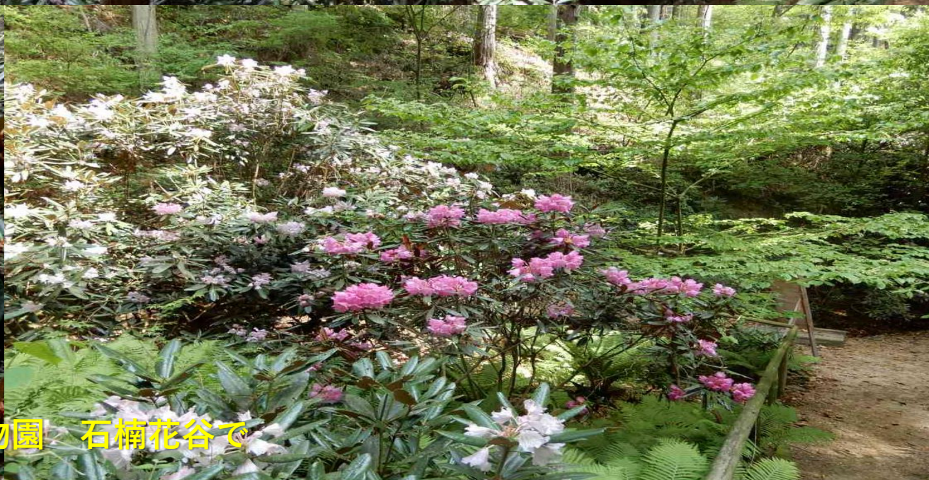
2018.4.27. 六甲森林植物園 石楠花谷で