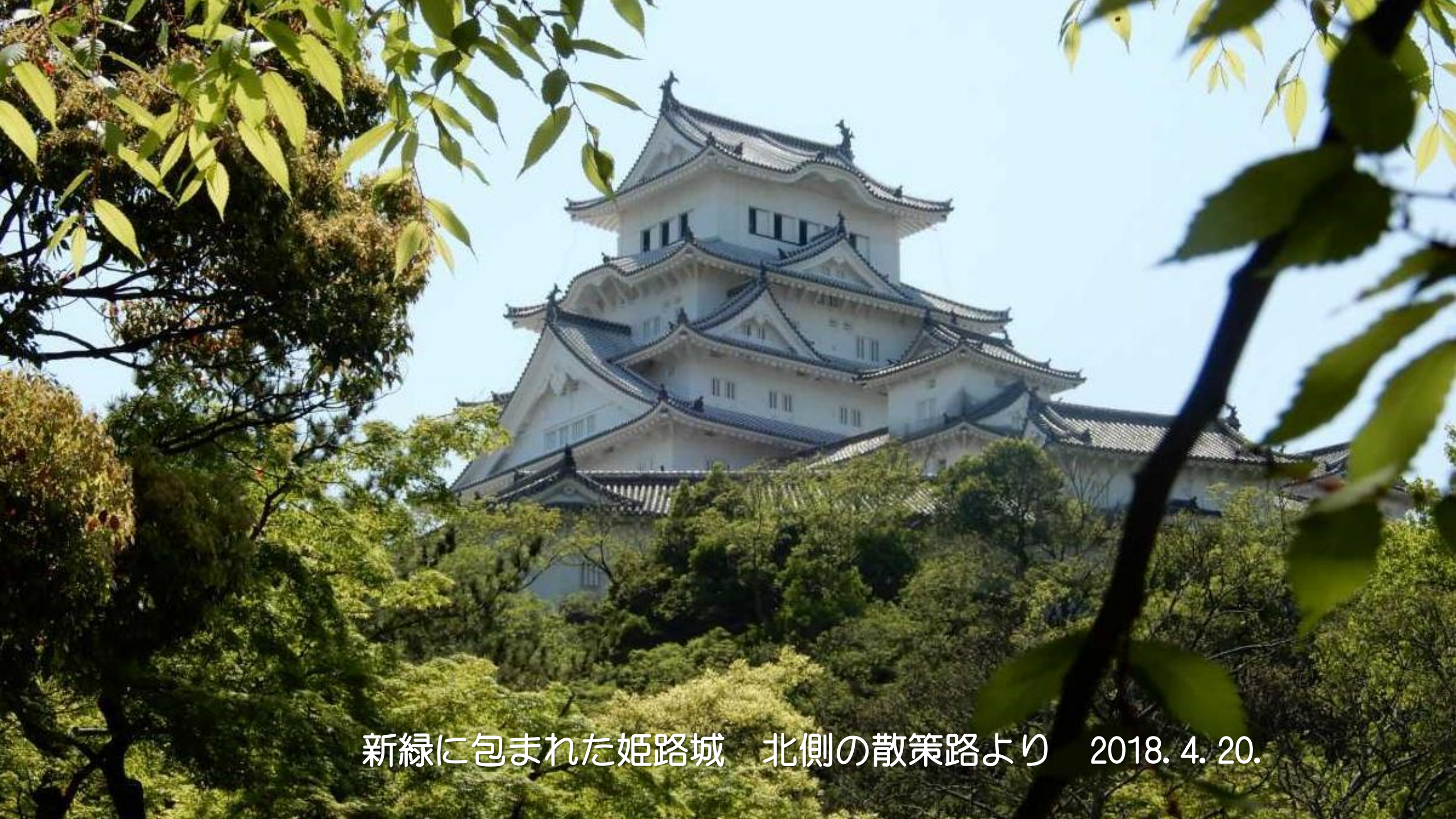
新緑に包まれた姫路城 北側の散策路より 2018. 4. 20.