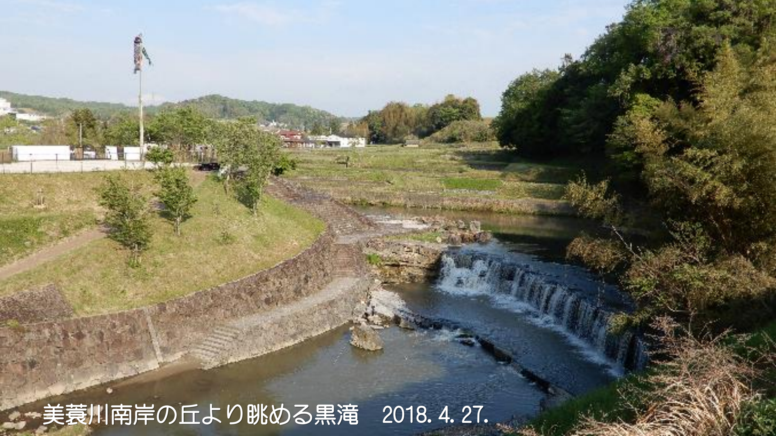
美蓑川南岸の丘より眺める黒滝 2018. 4. 27.