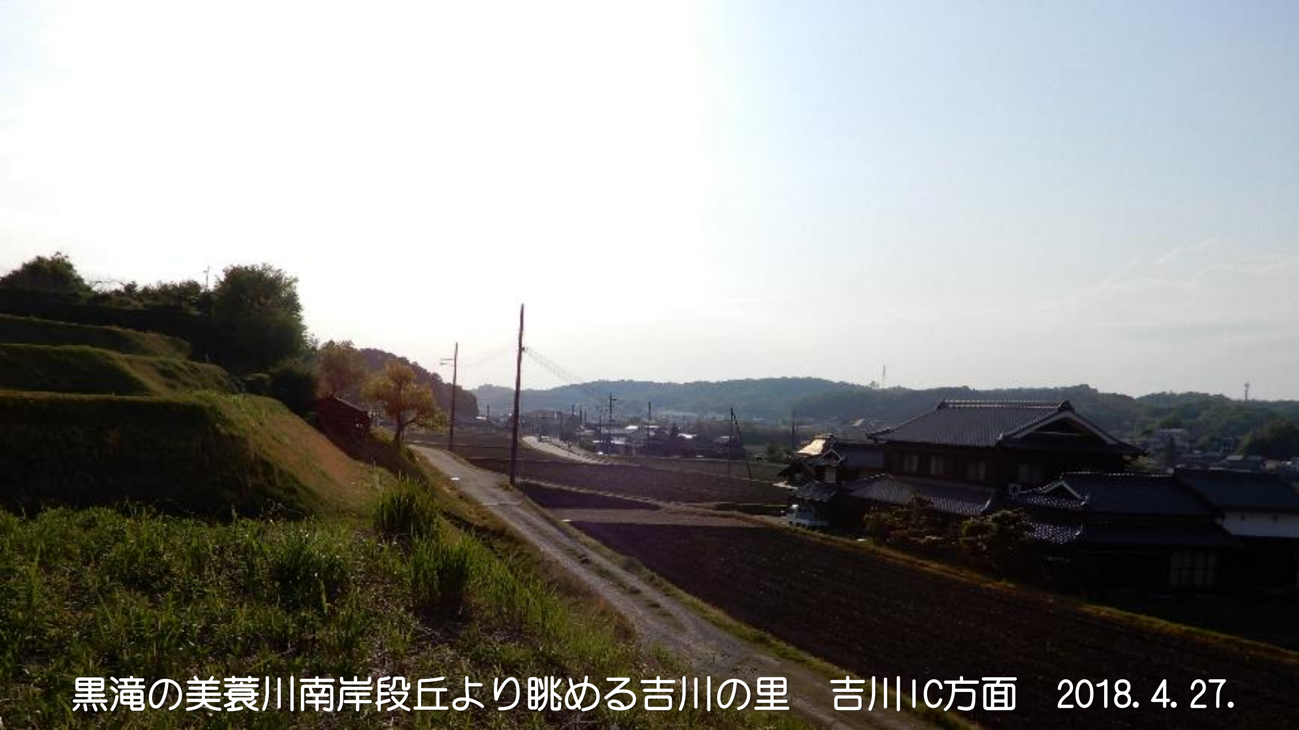
黒滝の美蓑川南岸段丘より眺める吉川の里 吉川IC方面 2018.4.27.