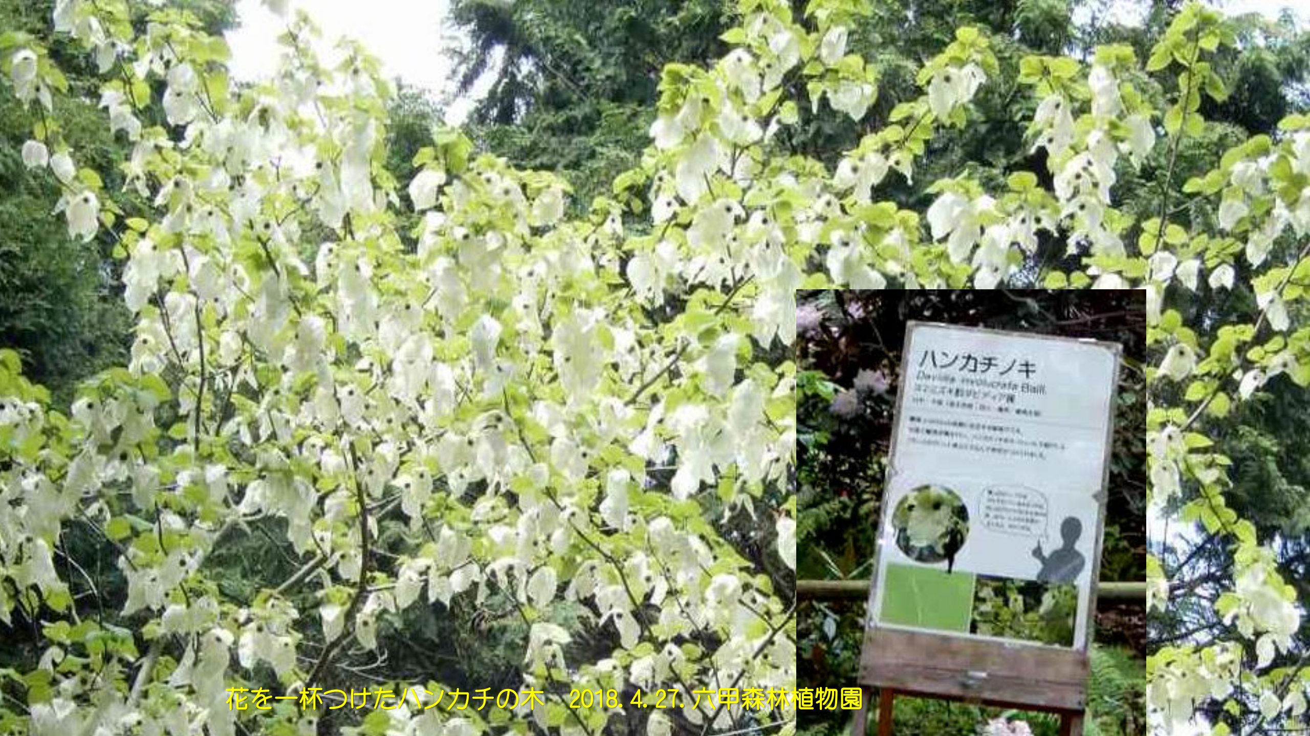
花を一杯つけたハンカチの木 2018. 4. 27. 六甲森林植物園