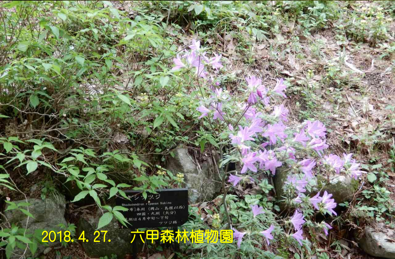
2018. 4. 27. 六甲森林植物園