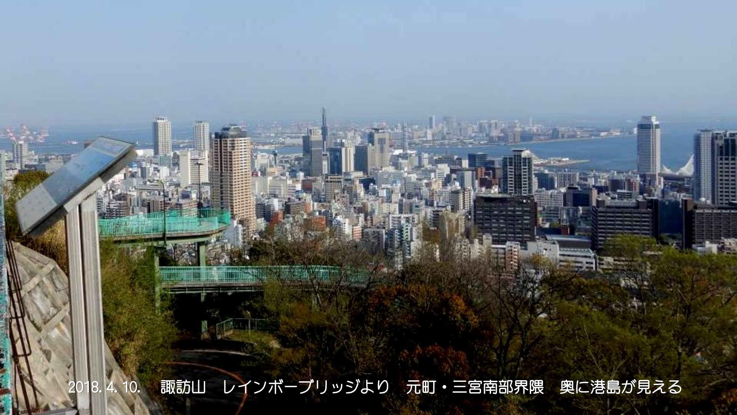
2018. 4. 10. 諏訪山 レインボーブリッジより 元町・三宮南部界限 奥に港島が見える