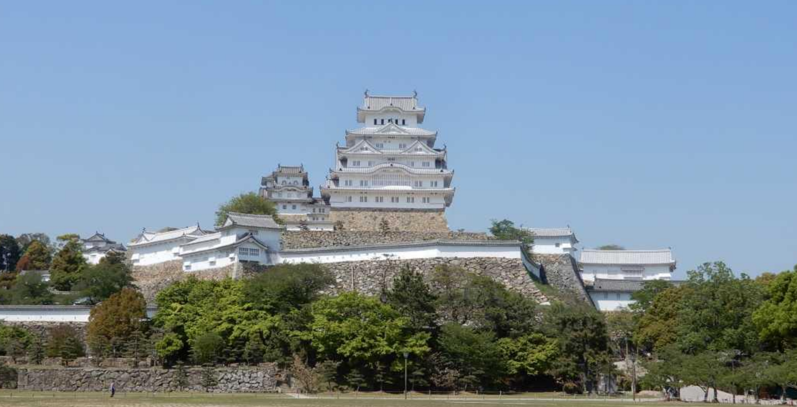
国宝 姫路城 2018. 4. 20. 南側正面より