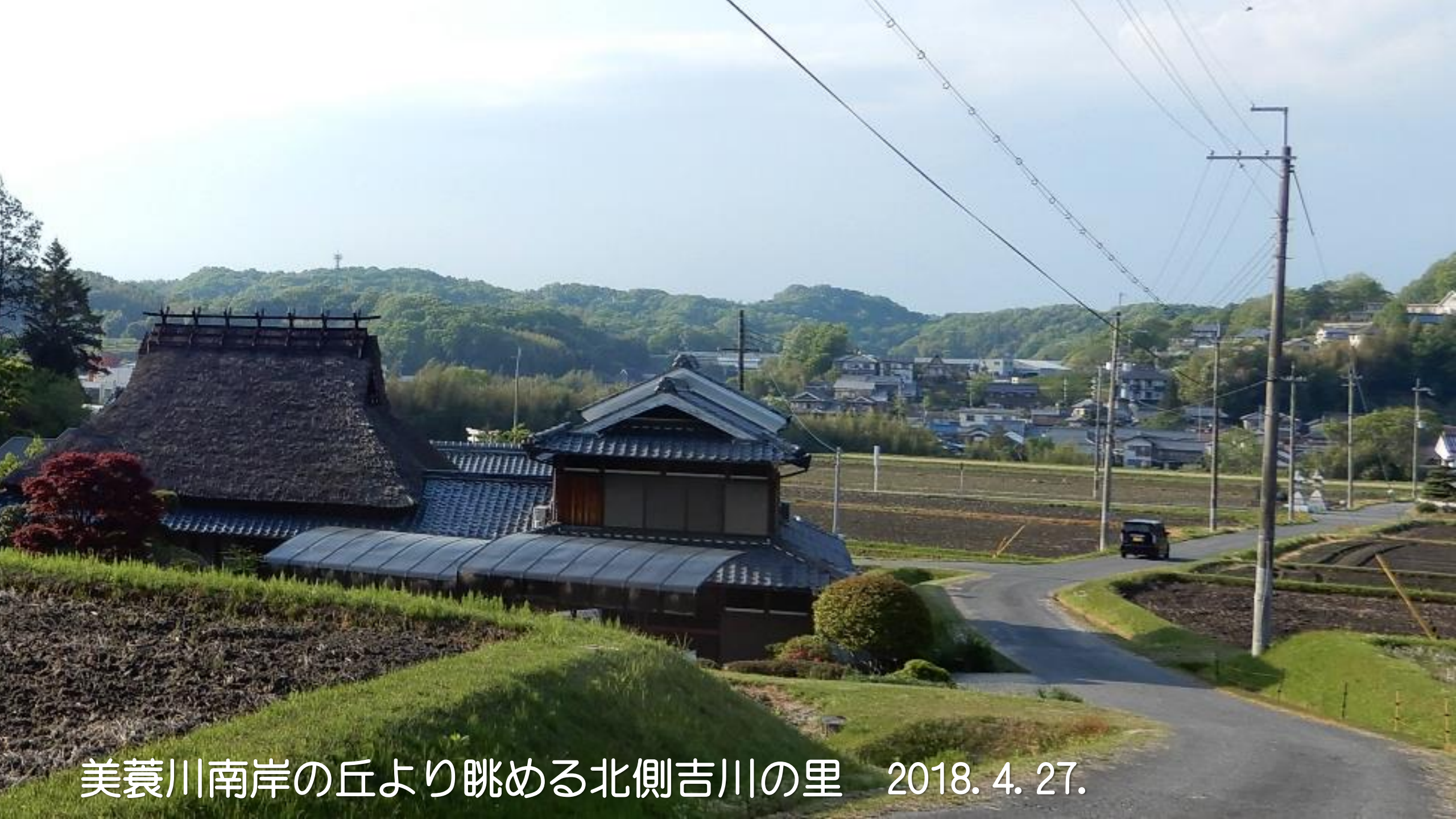
美蓑川南岸の丘より眺める北側吉川の里 2018. 4. 27.