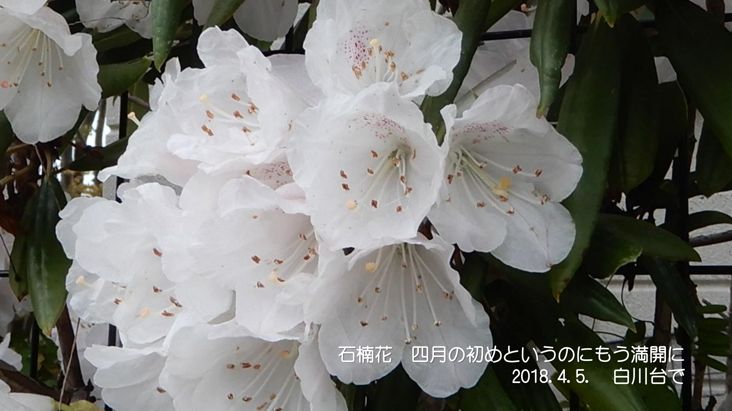
石楠花 四月の初めというのにもう満開に 2018. 4. 5. 白川台で