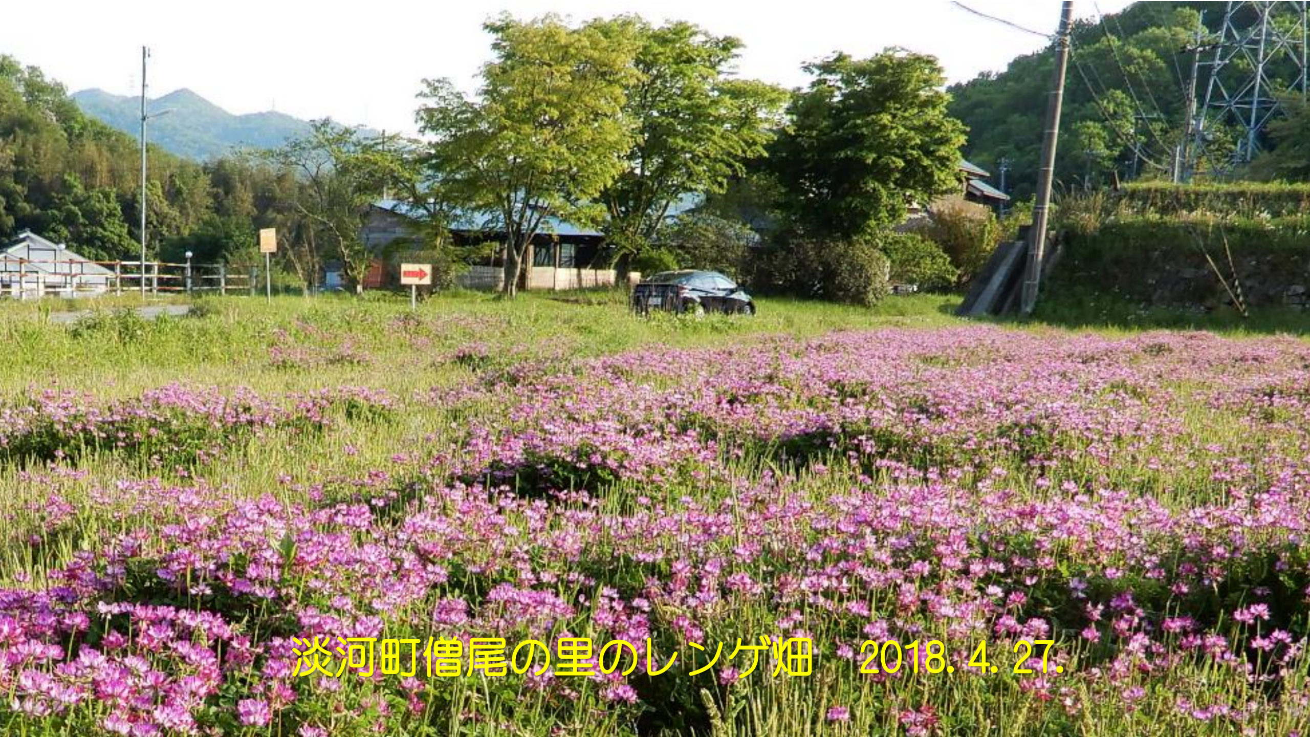
淡河町僧尾の里のレンゲ畑 2018. 4. 27.