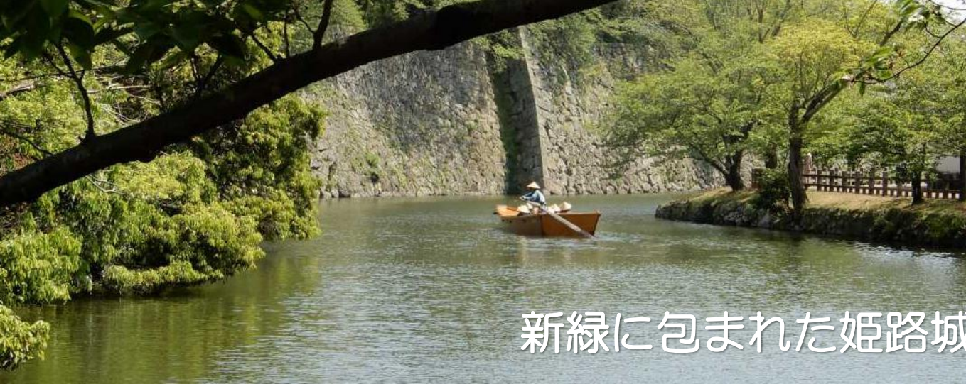
新緑に包まれた姫路城の北側 散策路2018. 4. 20.