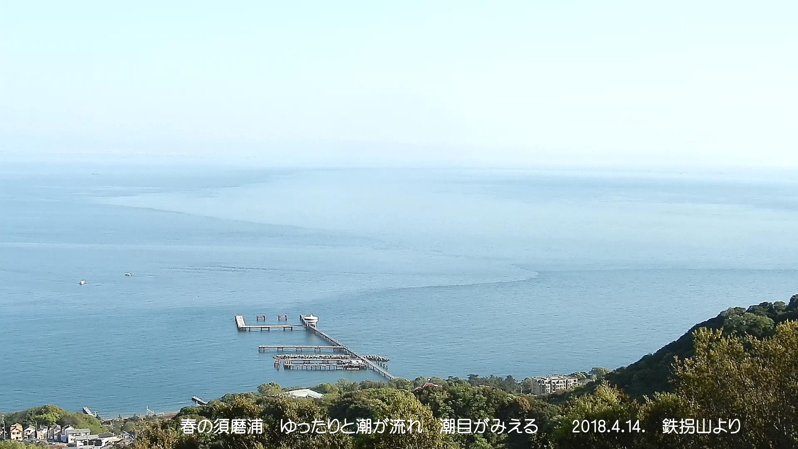
春の須磨浦 ゆったりと潮が流れ 潮目がみえる 2018.4.14. 鉄拐山より