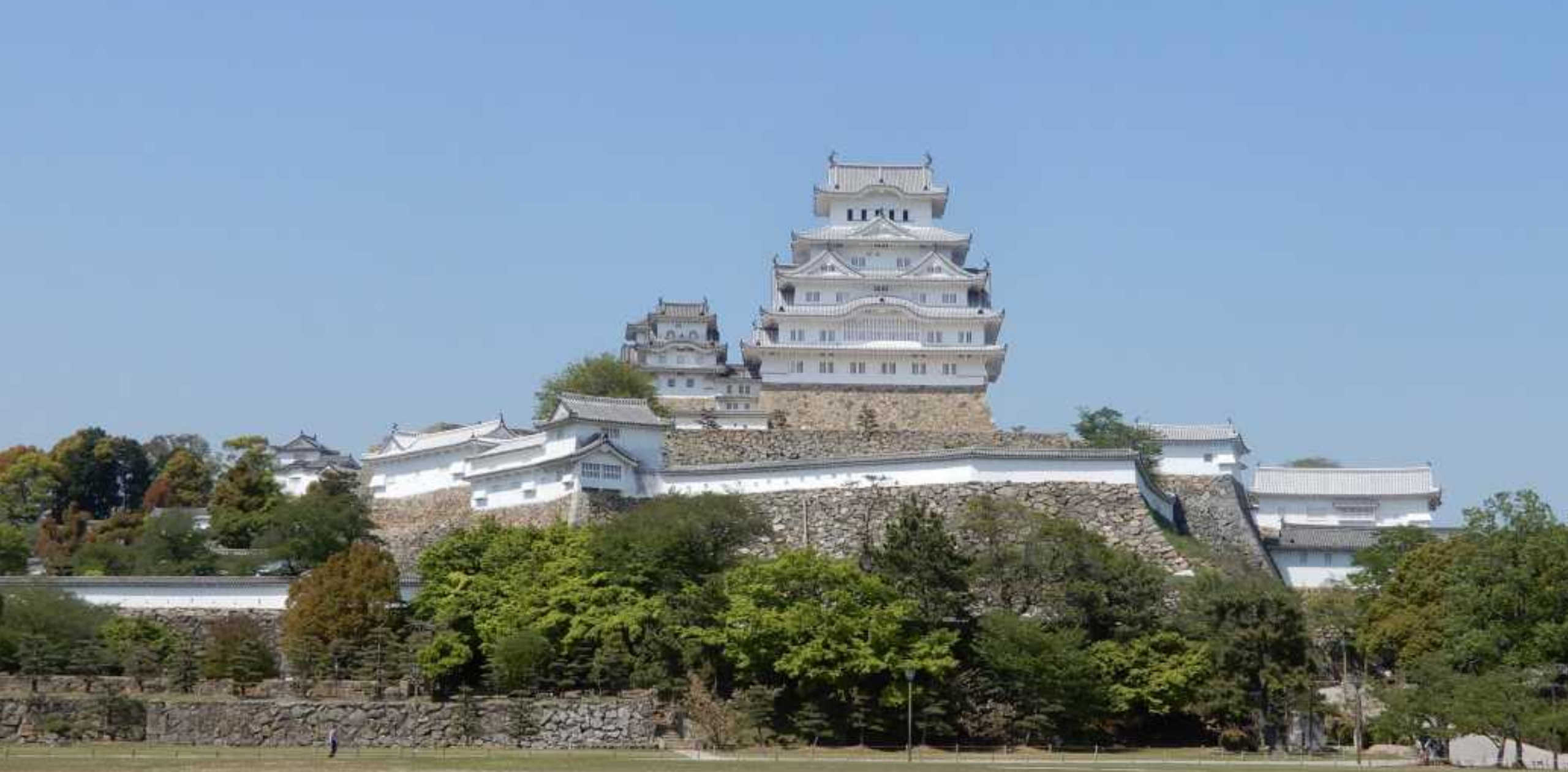
南側正面から眺める国宝姫路城 2018. 4. 20. 青空をバックにそびえ立つ姿は本当に美しい