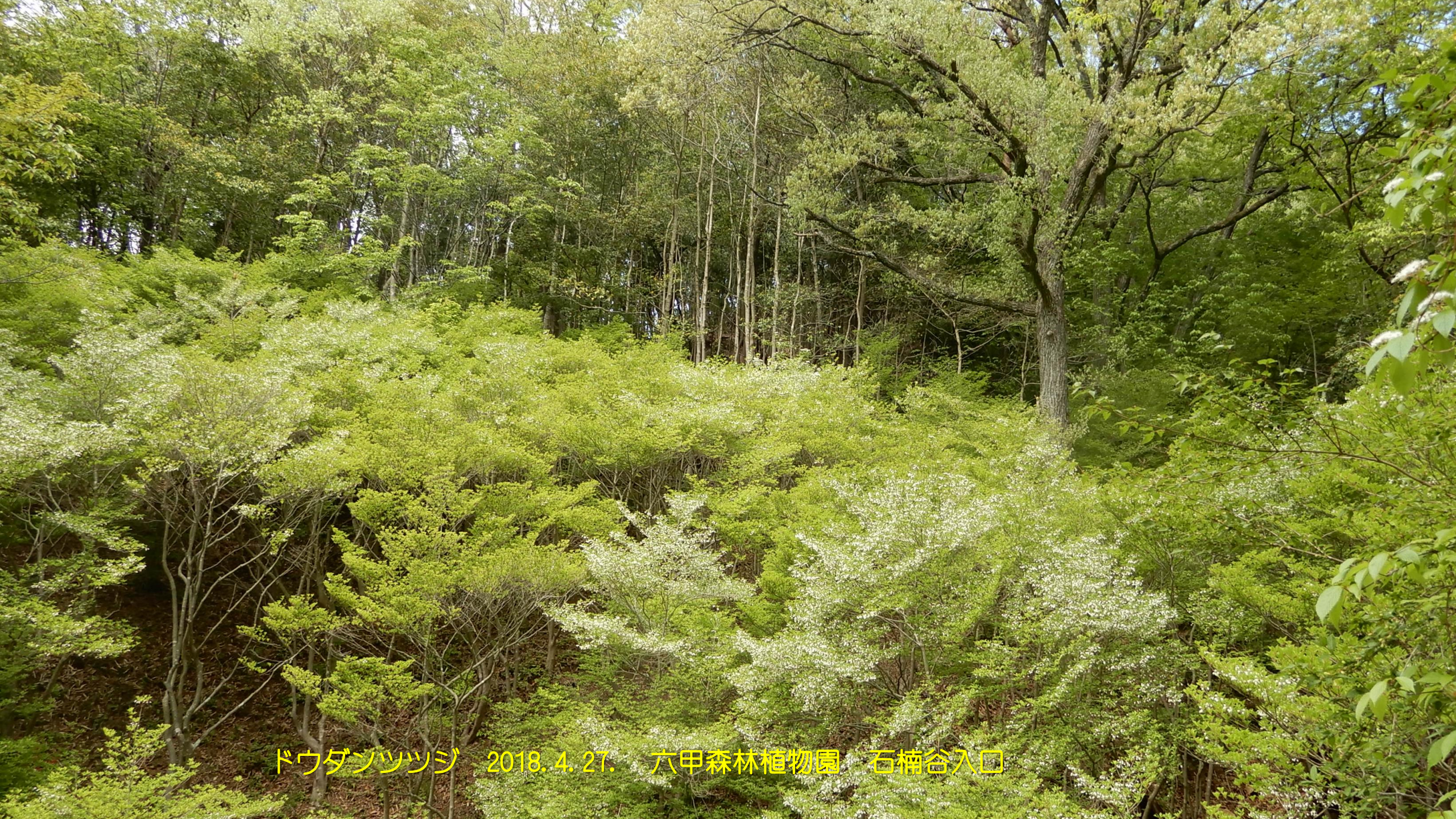
ドウダンツツジ 2018. 4. 27. 六甲森林植物園 石楠谷入口