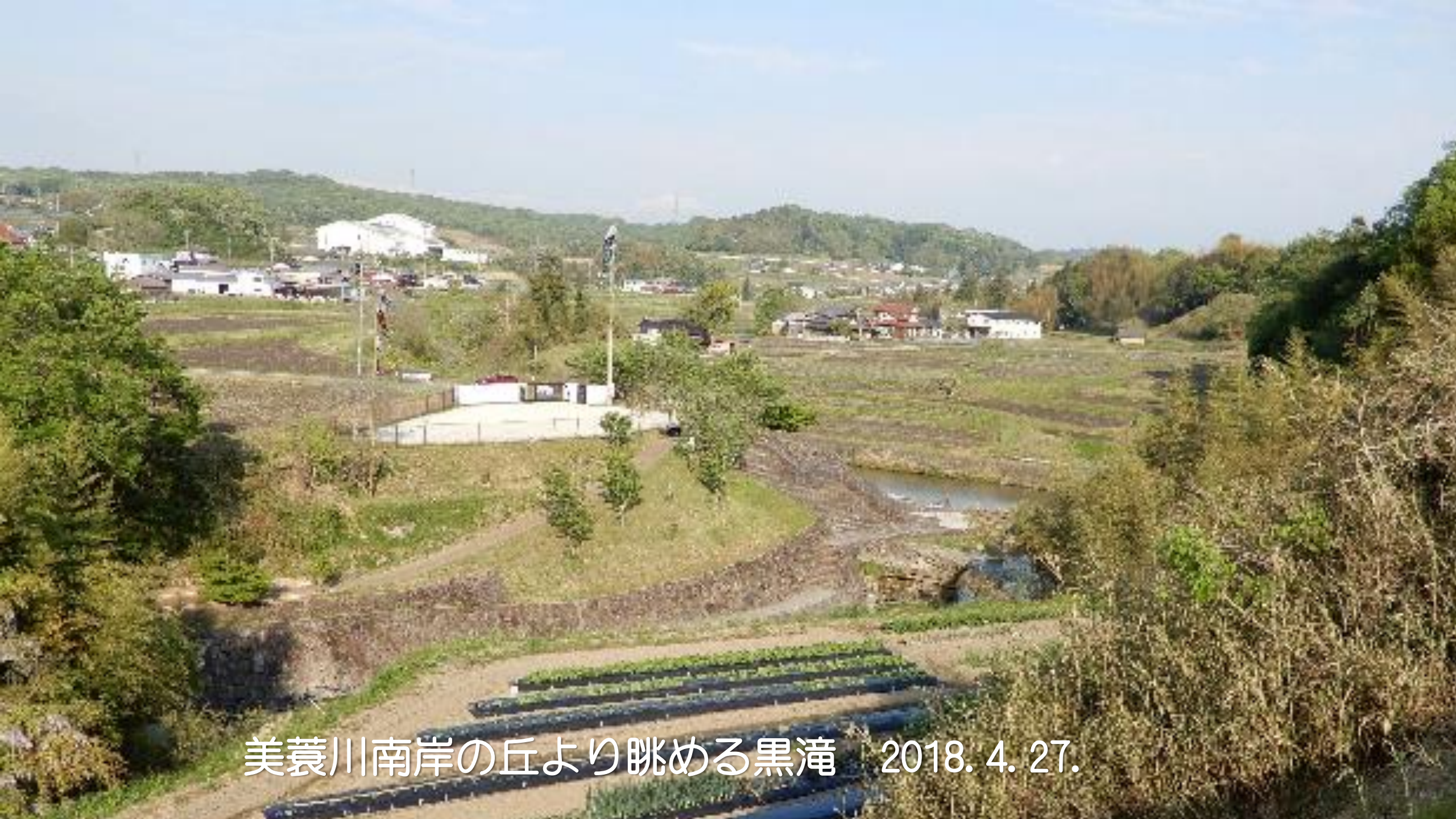
美蓑川南岸の丘より眺める黒滝 2018. 4. 27.