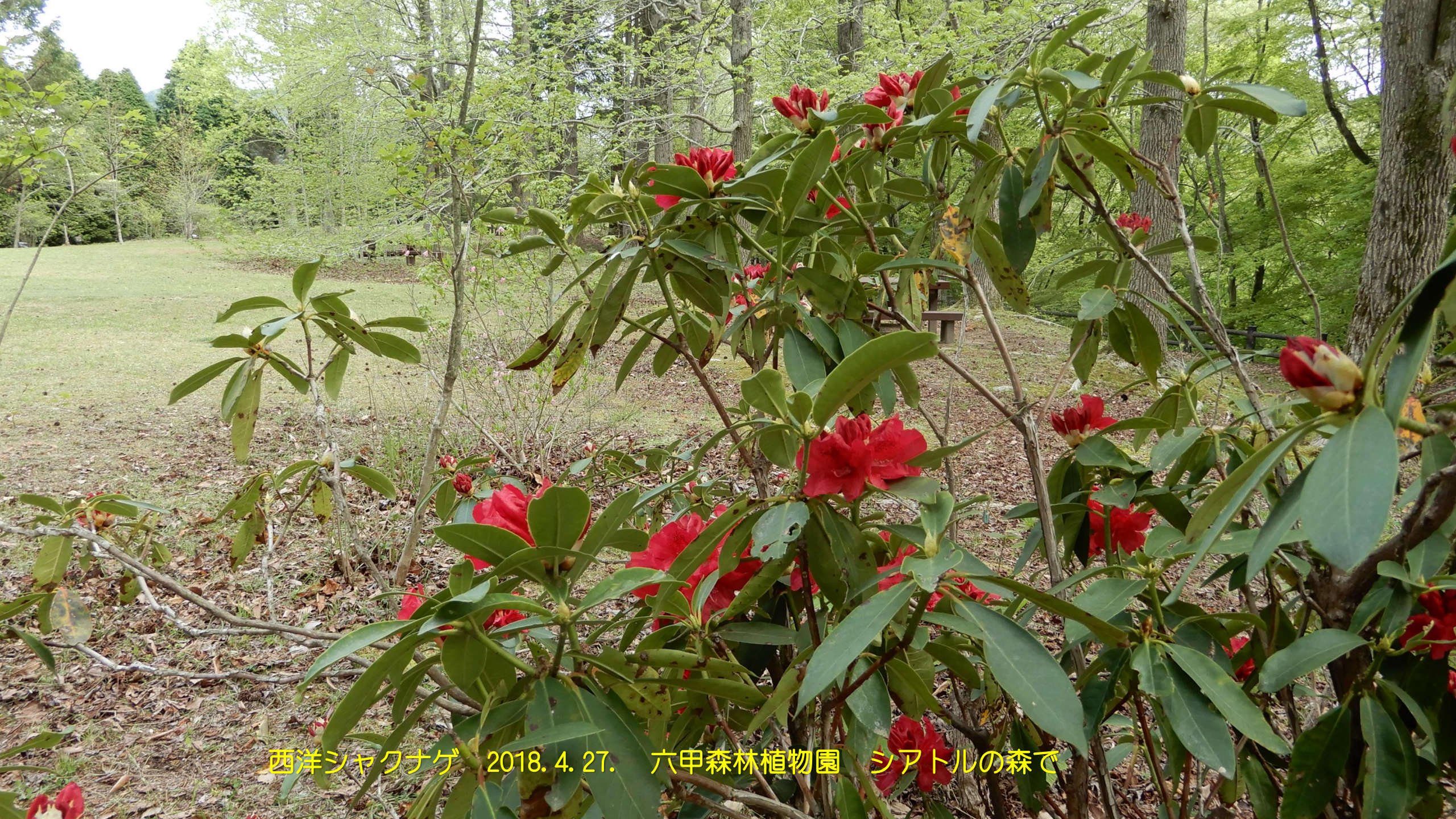
西洋シャクナゲ 2018. 4. 27. 六甲森林植物園 シアトルの森で