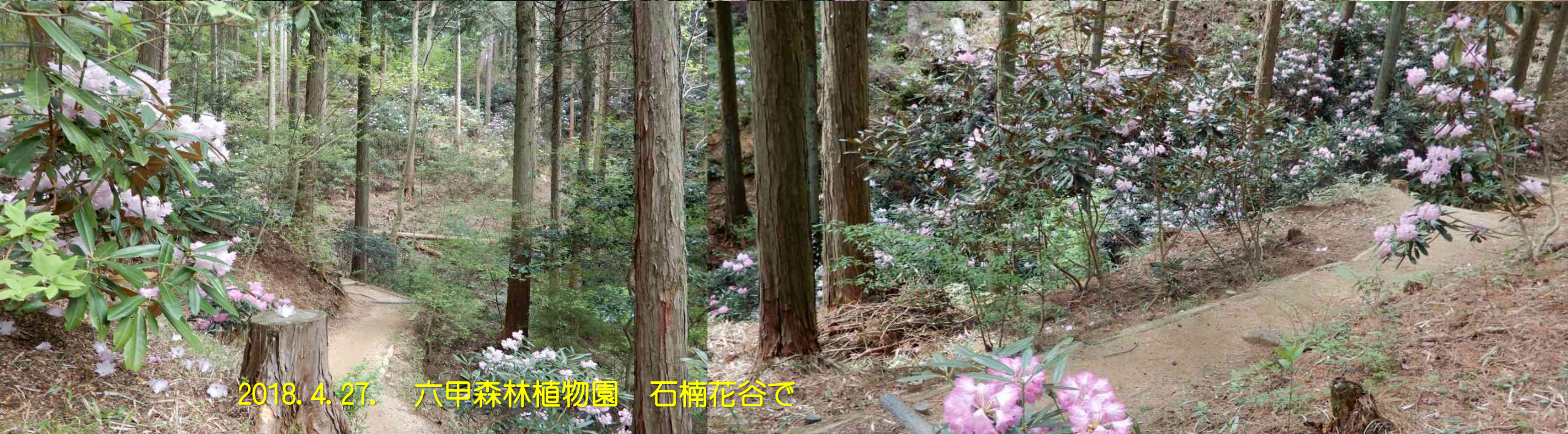
2018. 4. 27. 六甲森林植物園 石楠花谷で