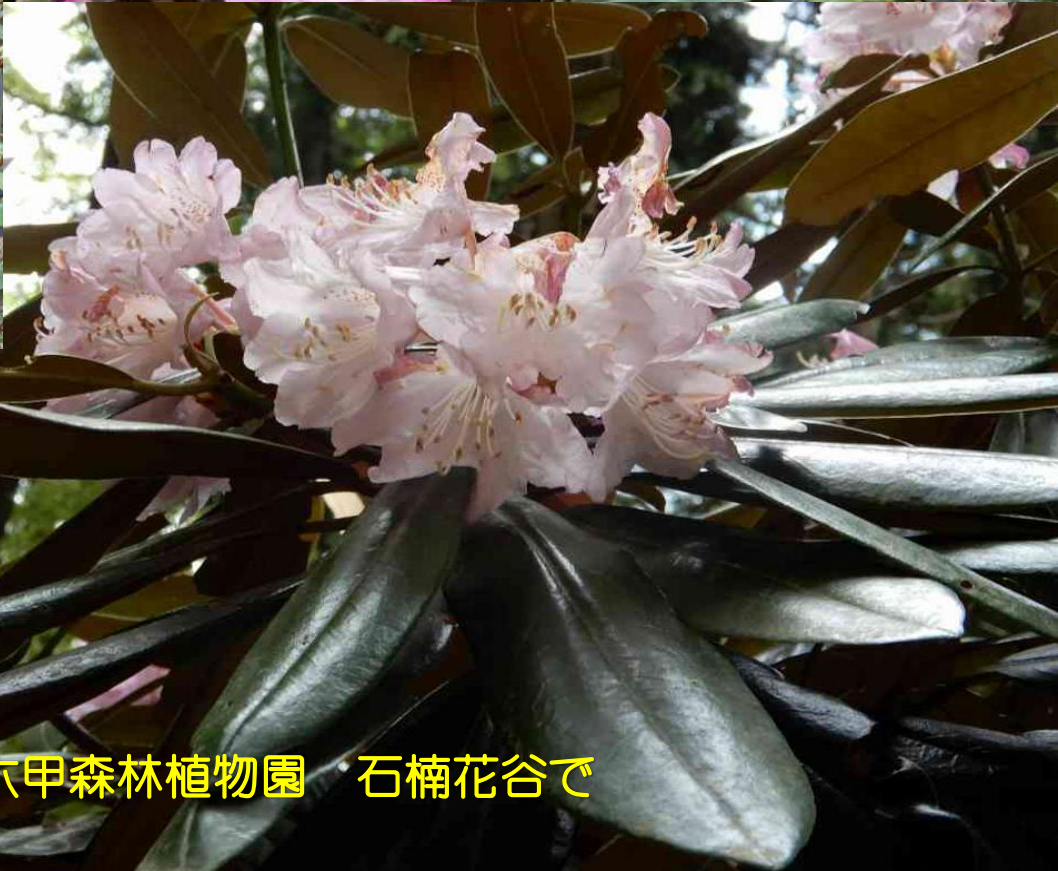
六甲森林植物園 石楠花谷で