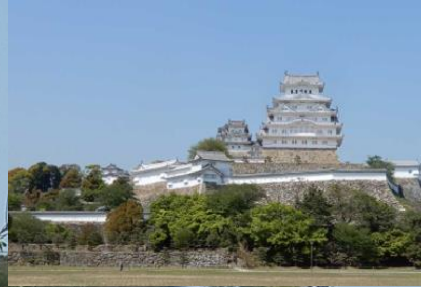
姫路城の南側正面に戻ると こんな光景も…… 2018.4.20.