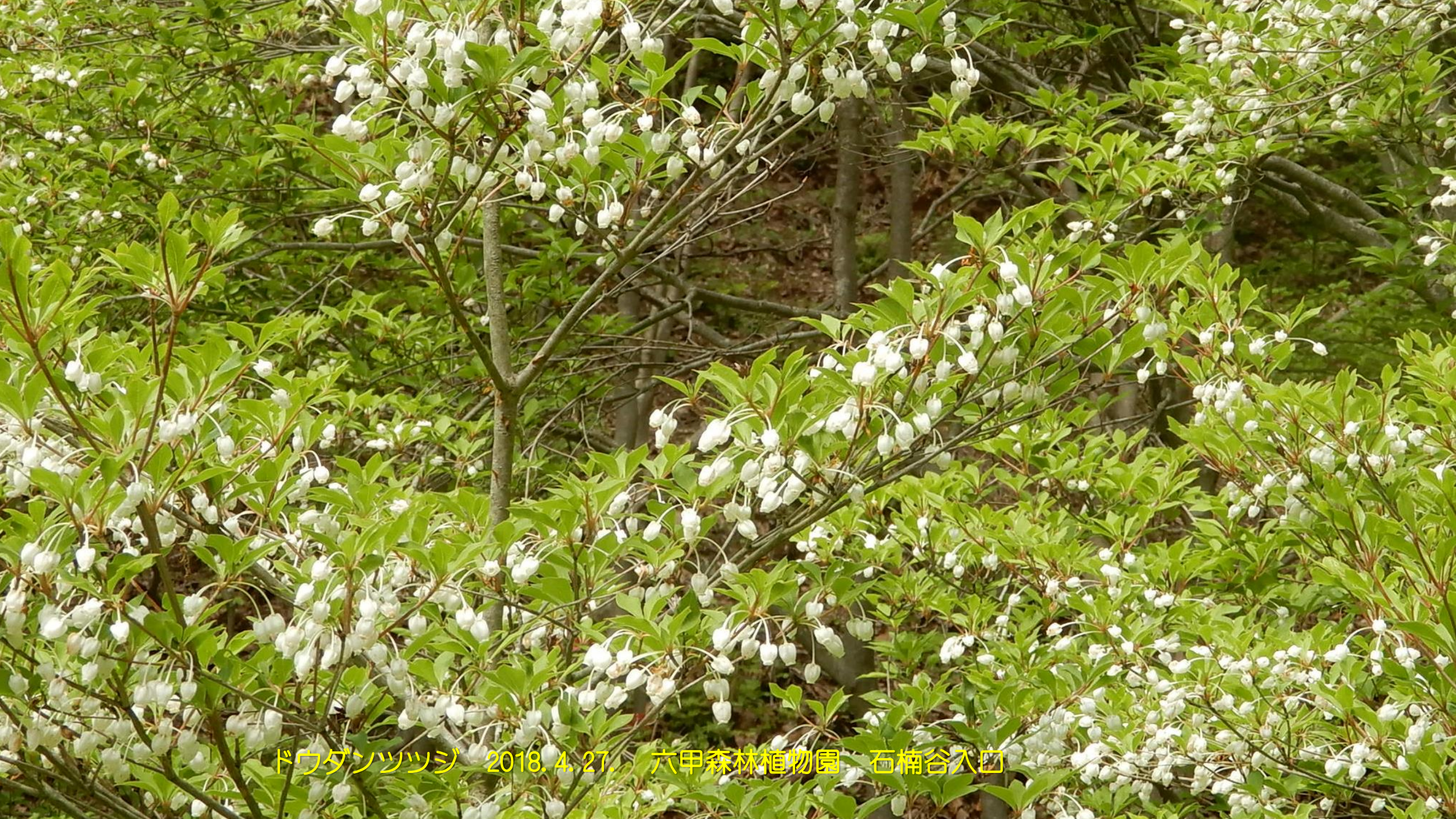
ドウダンツツジ 2018. 4. 27. 六甲森林植物園 石楠谷入口