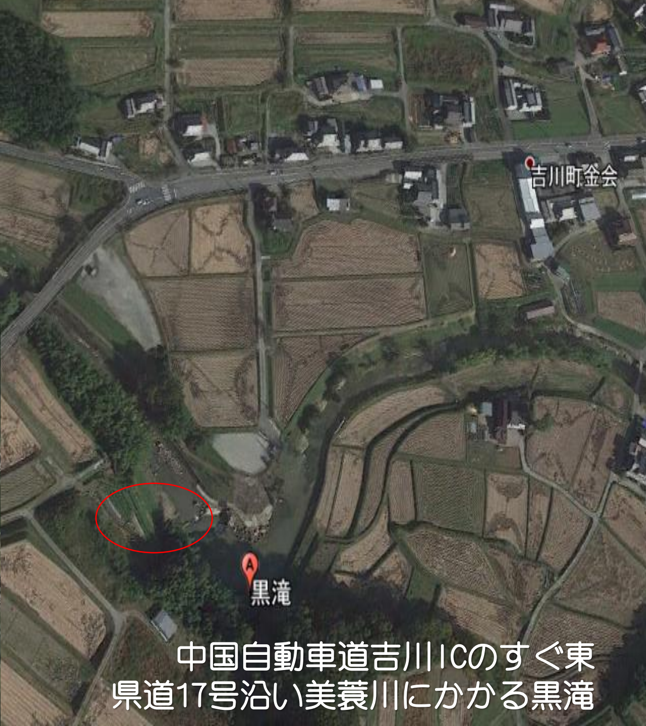
中国自動車道吉川ICのすぐ東 県道17号沿い美蓑川にかかる黒滝