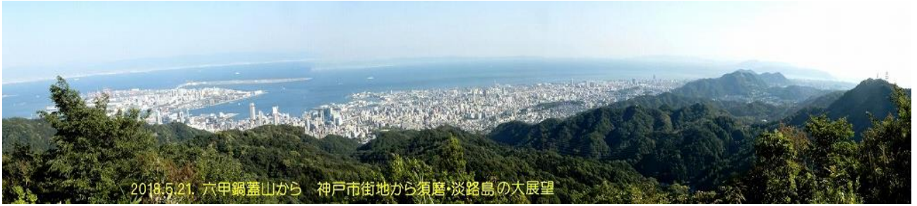
2018.5.21. 六甲鍋蓋山から 神戸市街地から須磨・淡路島の大展望

June Bright Happy Rainy Days Now !! 今を元気に