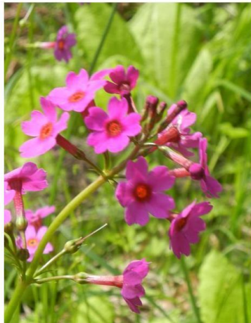
梅雨の前 初夏の湿原で密かに咲くクリンソウ 《九輪草》