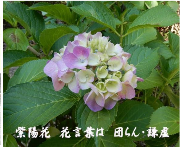
紫陽花 花言葉は 団らん・謙虚

6月 June Bright Happy Rainy Days Now !! 今を元気に