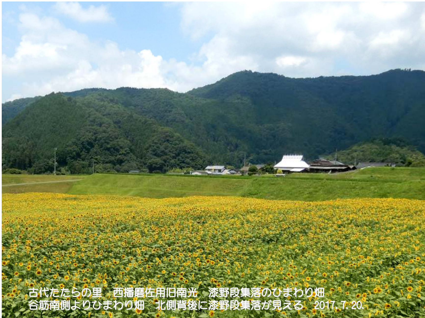
古代たたら の 里 西播磨 佐用 旧南光 漆野段集落 の ひまわり畑 谷筋南側よりひまわり畑 北側背後に漆野段集落が見える 2017. 7. 20.