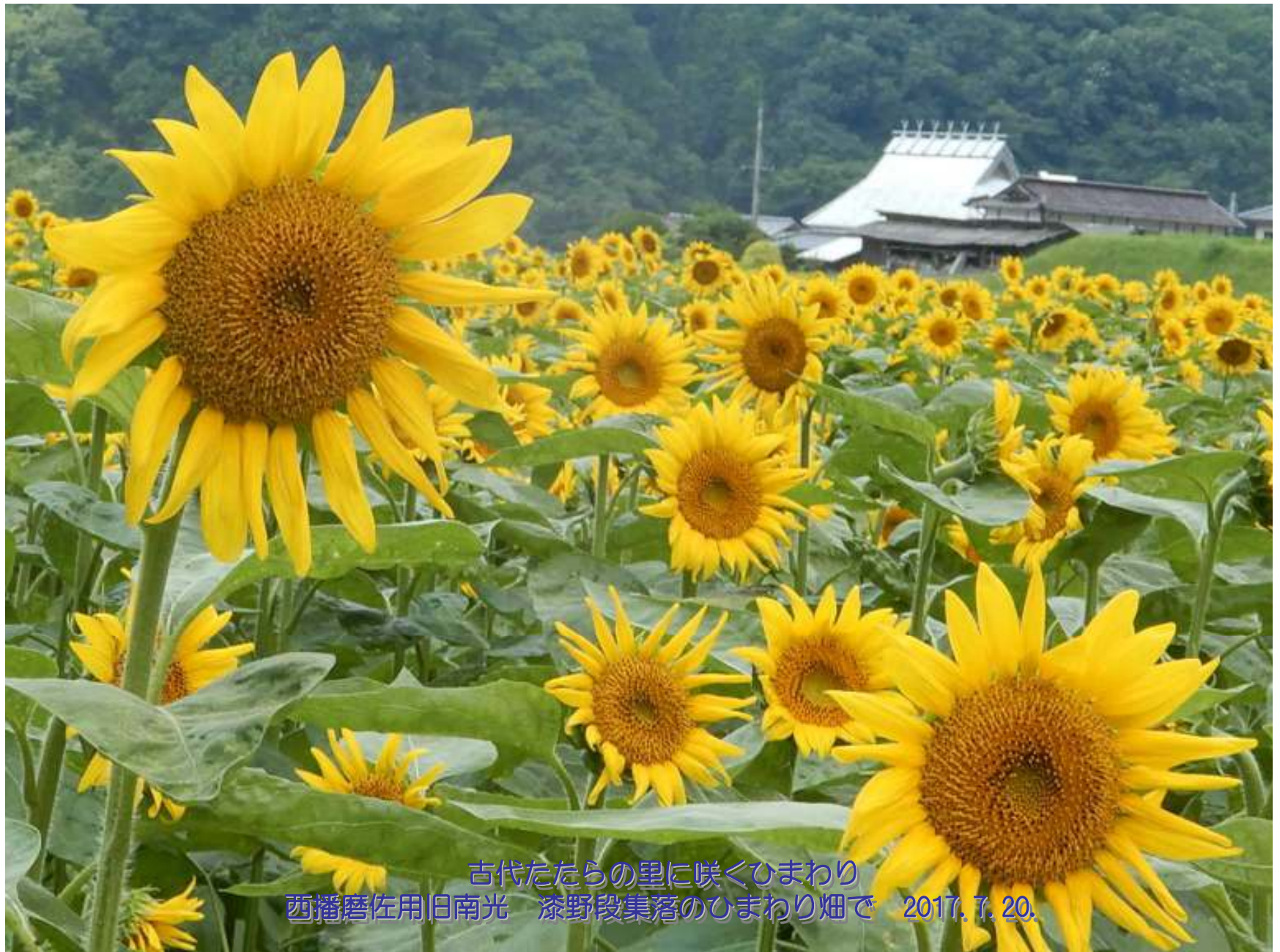
吉代たたら の 里に咲くひまわり 西播磨 の 佐用旧南光 漆野段集落のひまわり畑で 2017. 7. 20.