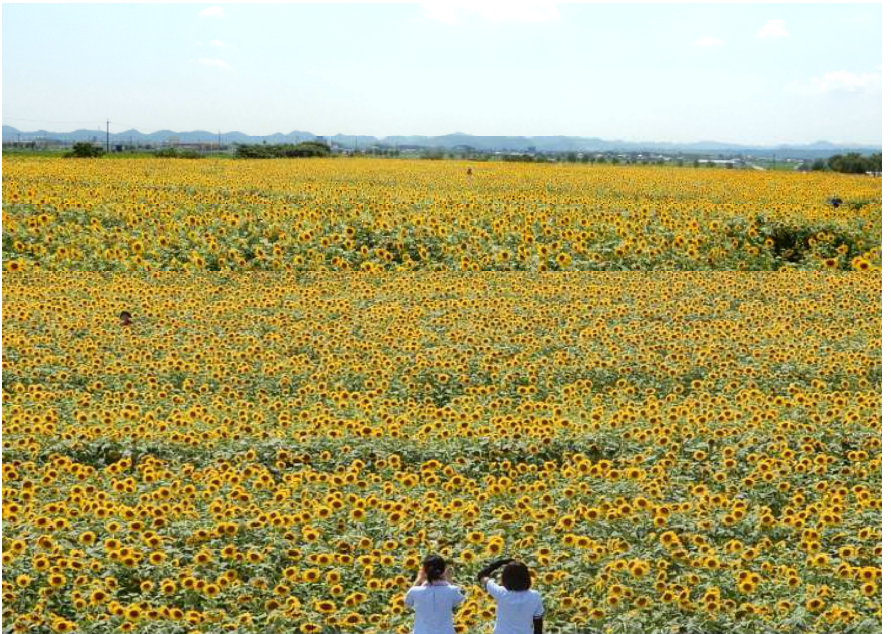
2017.7.19. 小野市浄谷 ひまわりの丘で