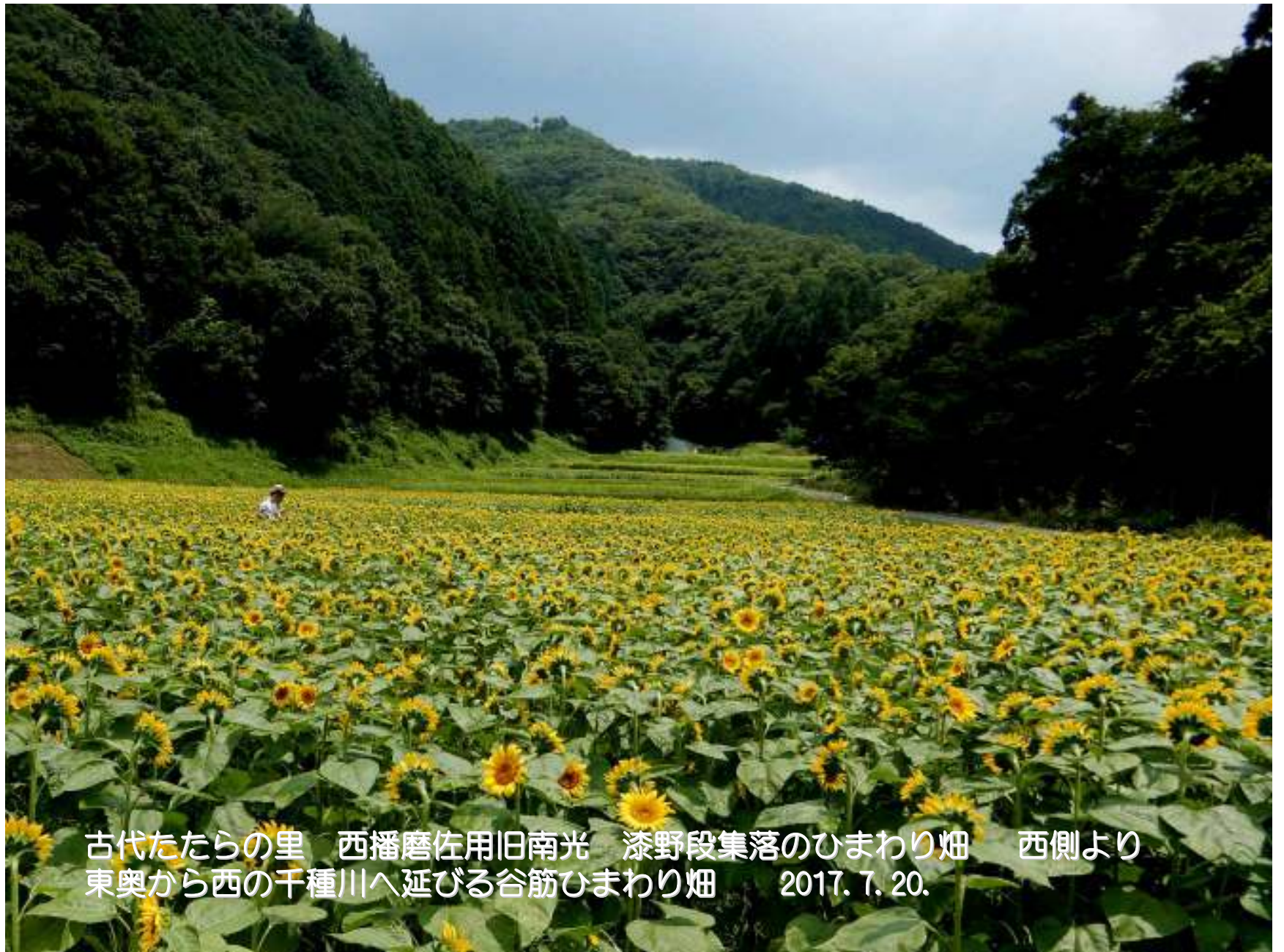
古代たたら の 里 西播磨 佐用 旧南光 漆野段集落のひまわり畑 西側より 東奥から西の千種川へ延びる谷筋ひまわり畑 2017. 7. 20.