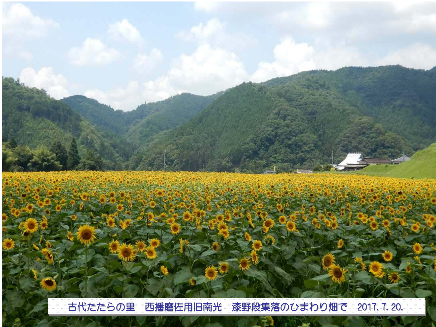
古代たたら の 里 西播磨佐用旧南光 漆野段集落のひまわり畑で 2017. 7. 20.