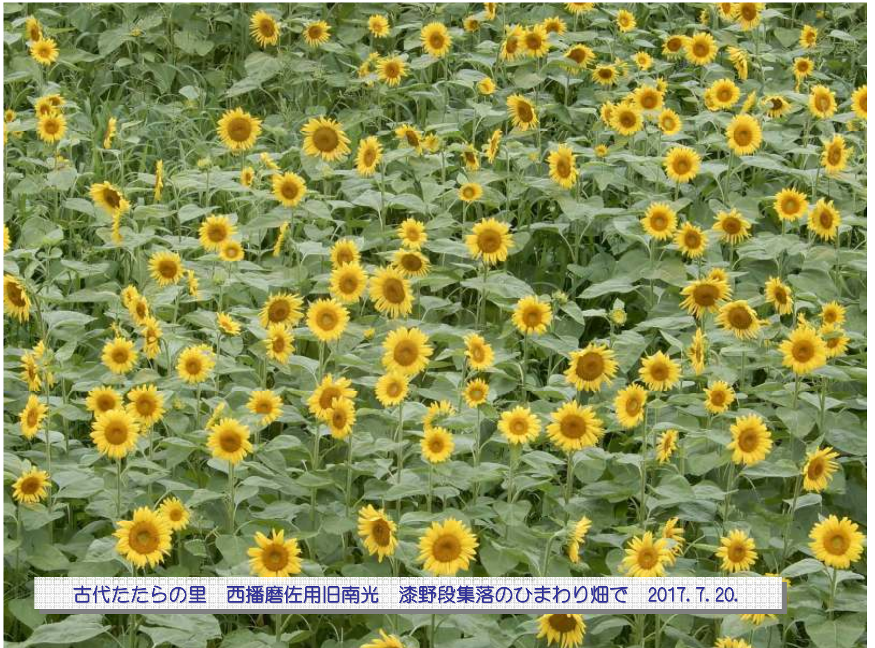
古代たたらの里 西播磨佐用旧南光 漆野段集落のひまわり畑で 2017. 7. 20.