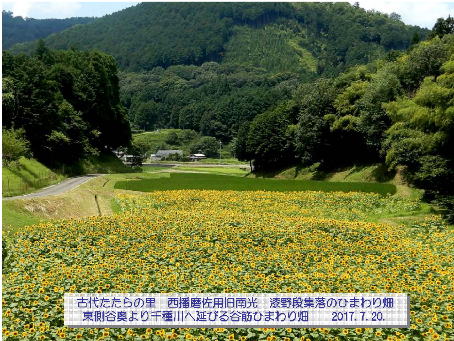
古代たたら の 里 西播磨 佐用 旧南光 漆野段集落 の ひまわり畑 東側谷奥より千種川へ延びる谷筋ひまわり畑 2017. 7. 20.