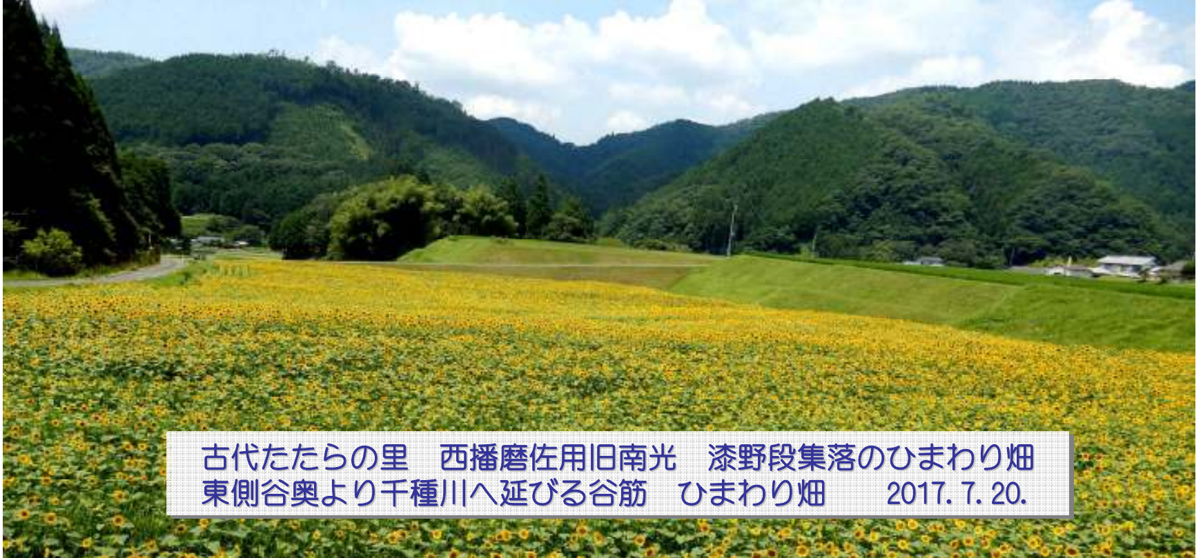
古代たたら の 里 西播磨 の 佐用旧南光 漆野段集落 の ひまわり畑 東側谷奥より千種川へ延びる谷筋 ひまわり畑 2017. 7. 20.