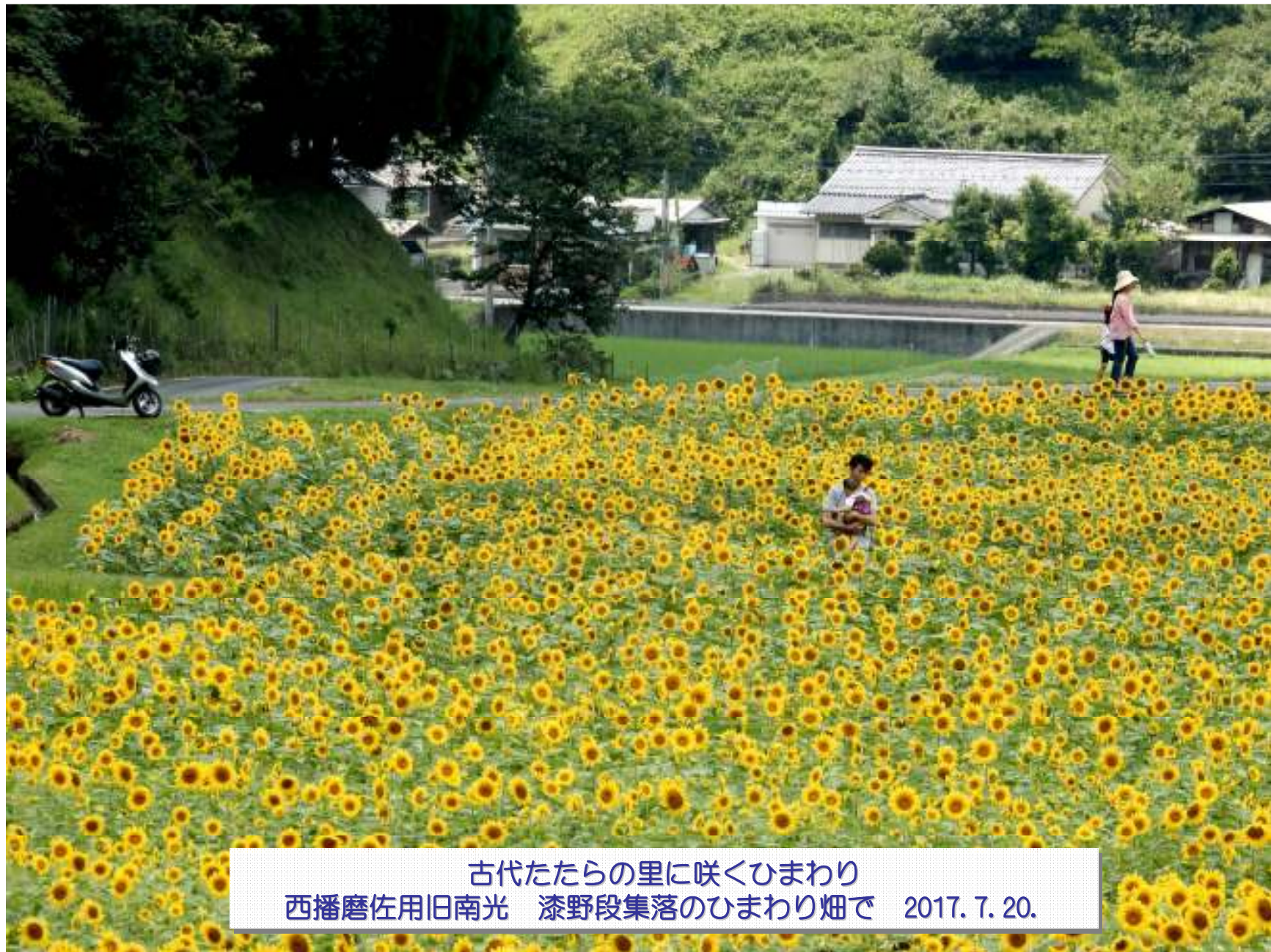
古代たたらに咲くひまわり 西播磨佐用旧南光 漆野段集落のひまわり畑で 2017. 7. 20.