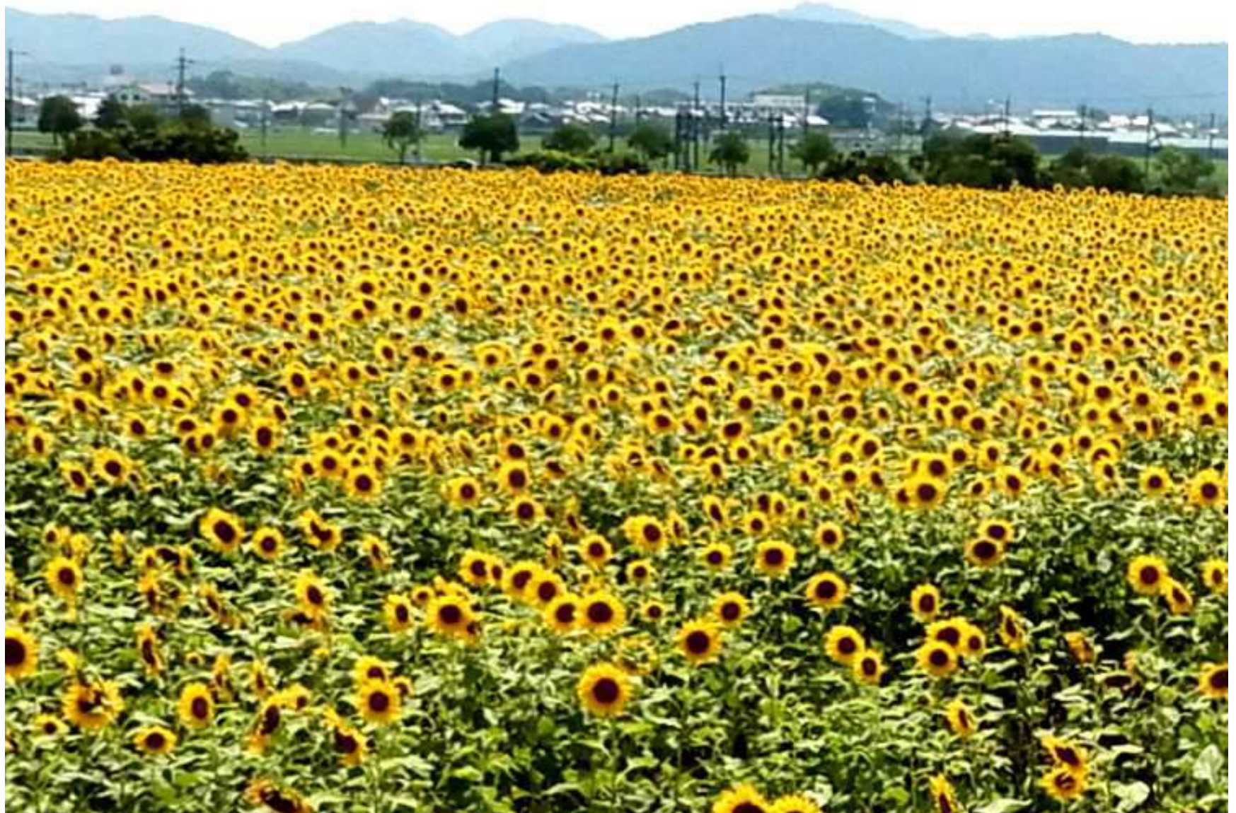
一斉に顔をこちらに 迎えてくれたひまわり 小野ひまわりの丘で 2017.7.19.