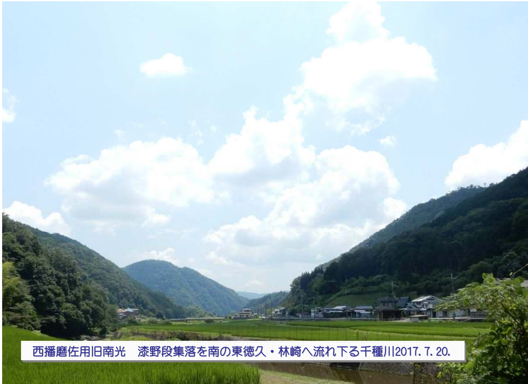
西播磨佐用旧南光 漆野段集落を南の東徳久・林崎へ流れ下る千種川2017. 7. 20.