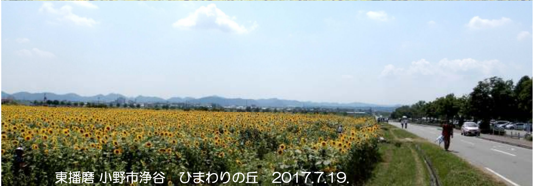
東播磨 小野市浄谷 ひまわりの丘 2017.7.19.