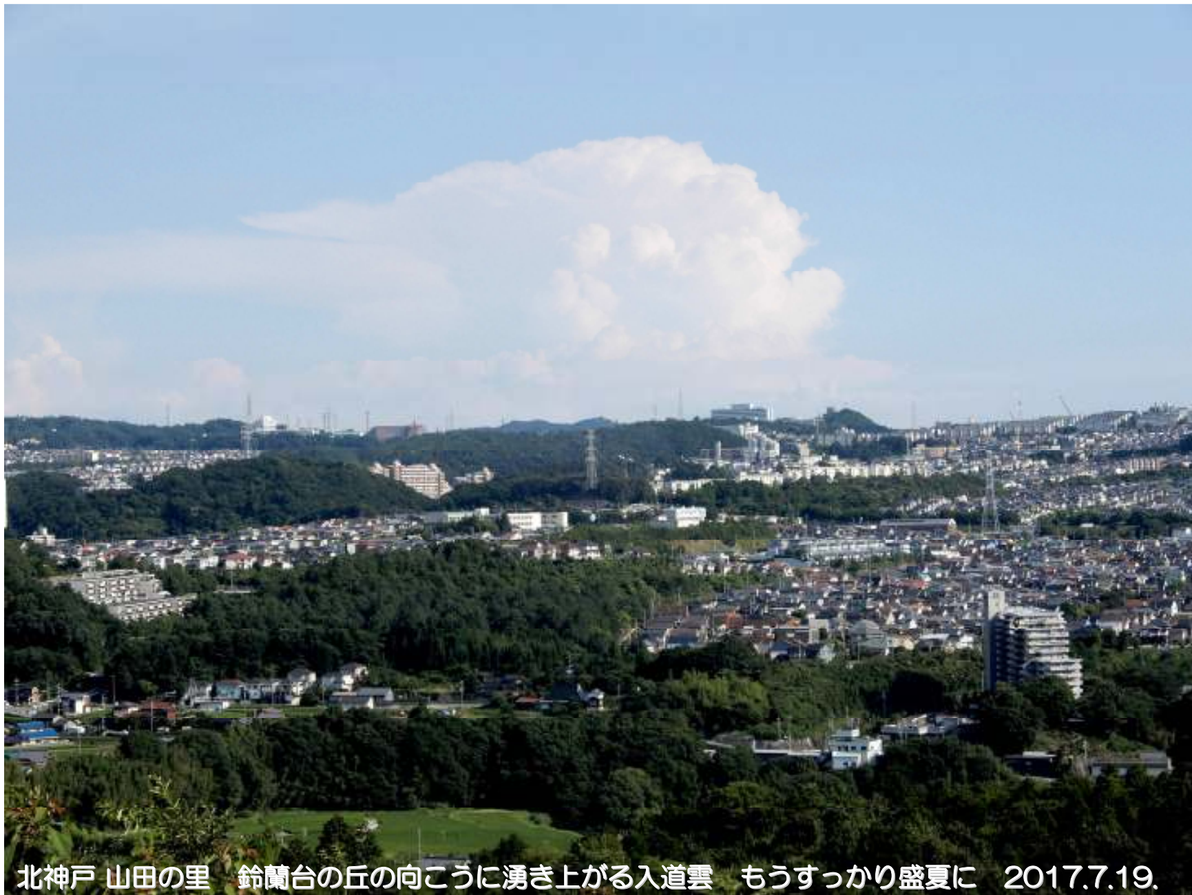
北神戸 山田の里 鈴蘭台の丘の向こうに湧き上がる入道雲 もうすっかり盛夏に 2017.7.19.