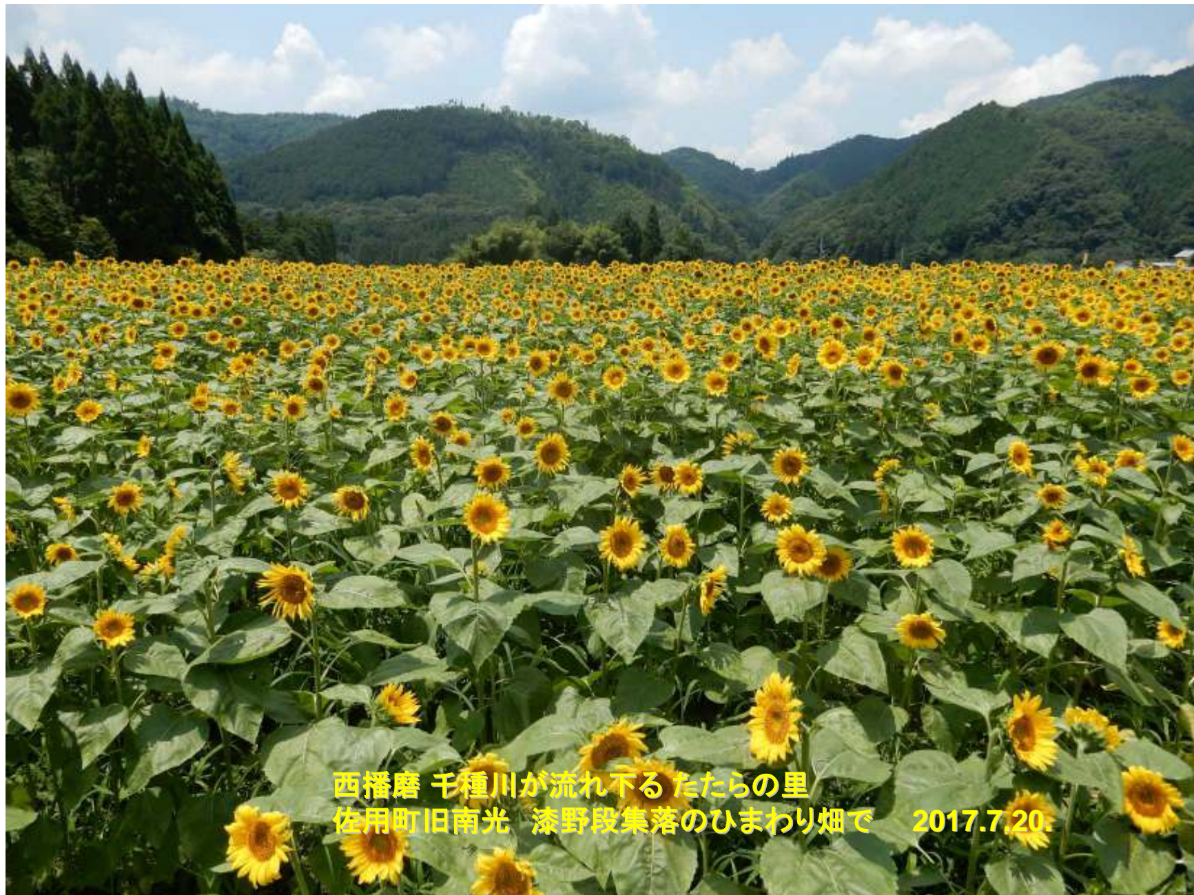
西播磨 千種川が流れ下る たたらノ里 佐用町旧南光 漆野段集落のひまわり畑で 2017.7.20.