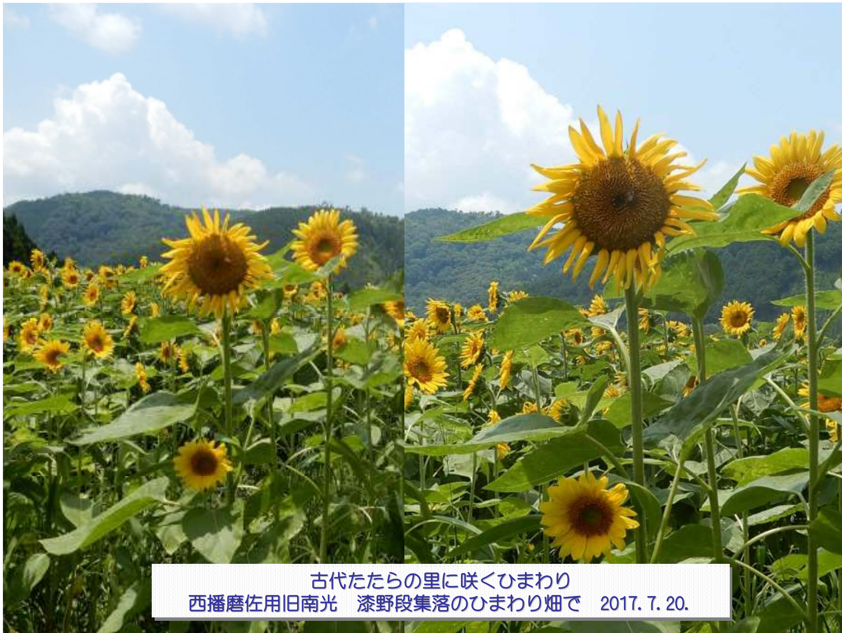
古代たたらに咲くひまわり 西播磨佐用旧南光 漆野段集落のひまわり畑で 2017. 7. 20.