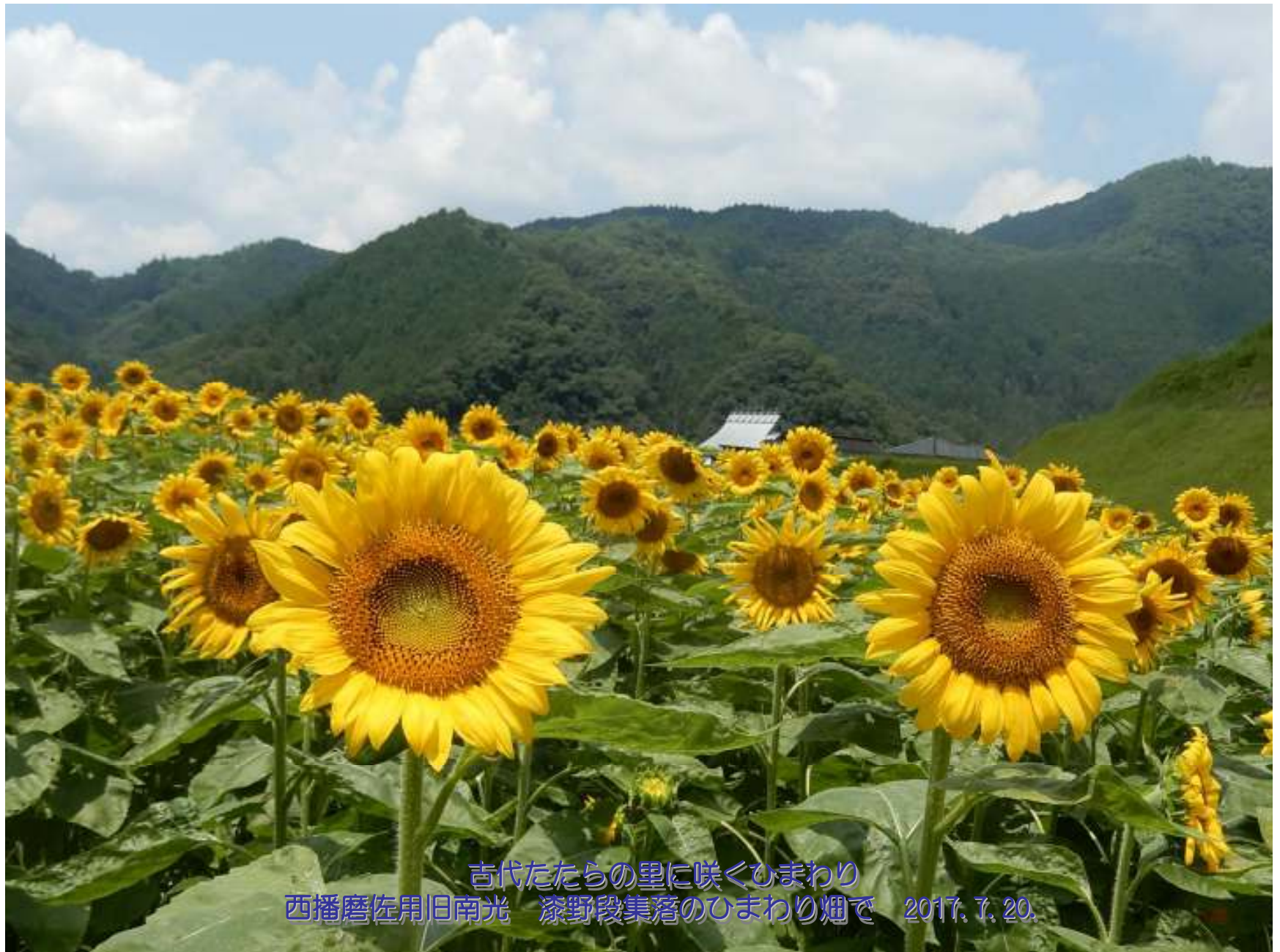
吉代たたら の 里 に 咲くひまわり 西播磨 佐用 旧南光 漆野段集落 の ひまわり畑で 2017. 7. 20.