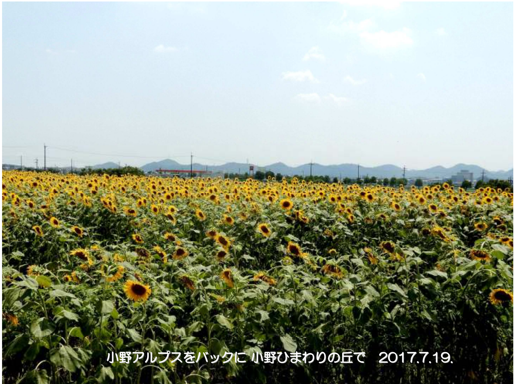
小野アルプスをバックに 小野ひまわりの丘で 2017.7.19.