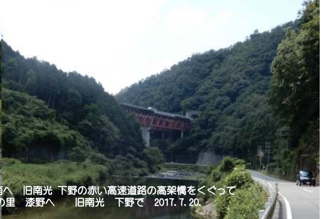
千種川に沿って南へ 旧南光 下野の赤い高速道路の高架橋をくぐって 古代たたらの里 漆野へ 旧南光 下野で 2017. 7. 20.