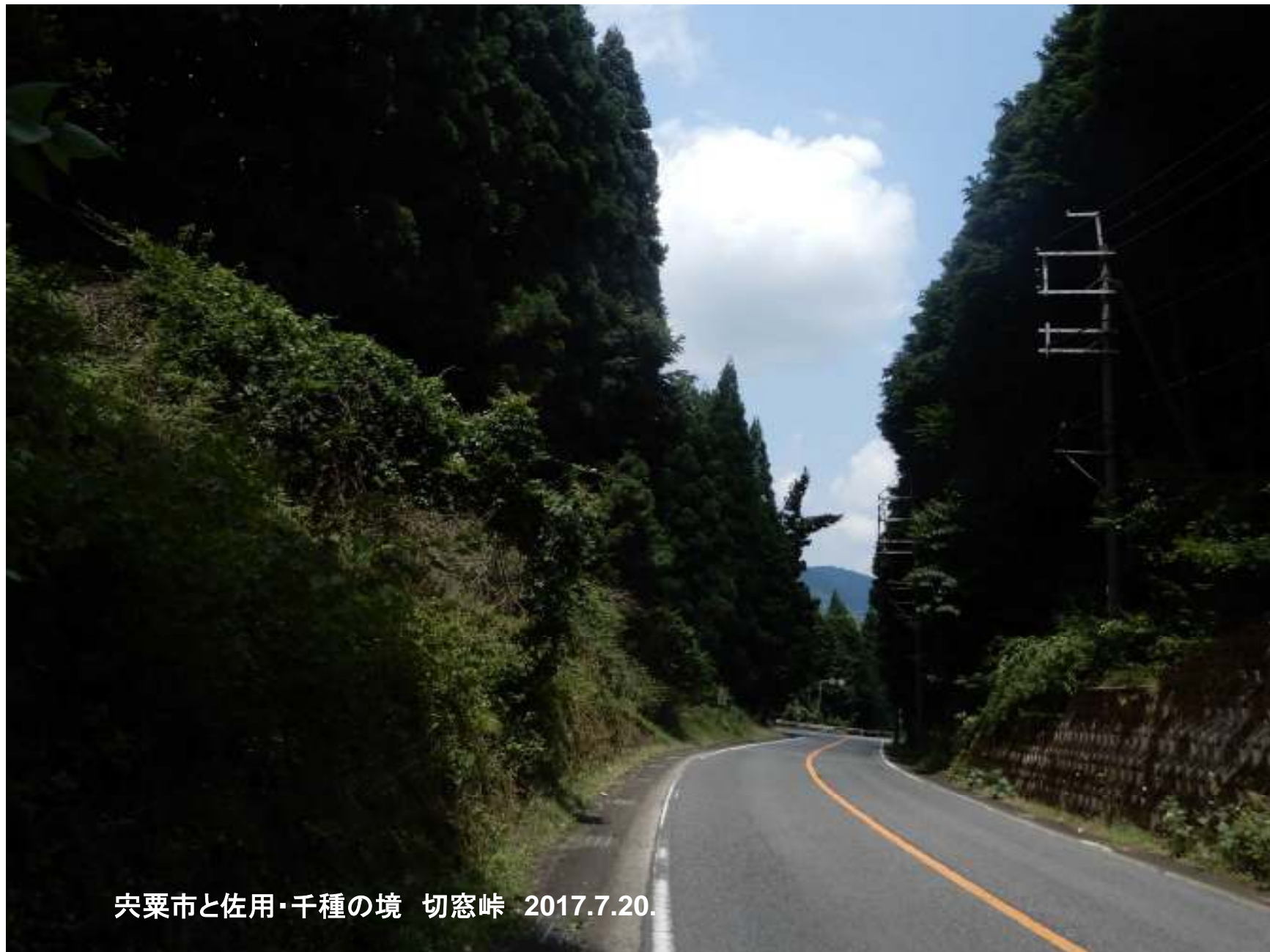
宍粟市と佐用・千種の境 切窓峠 2017.7.20.