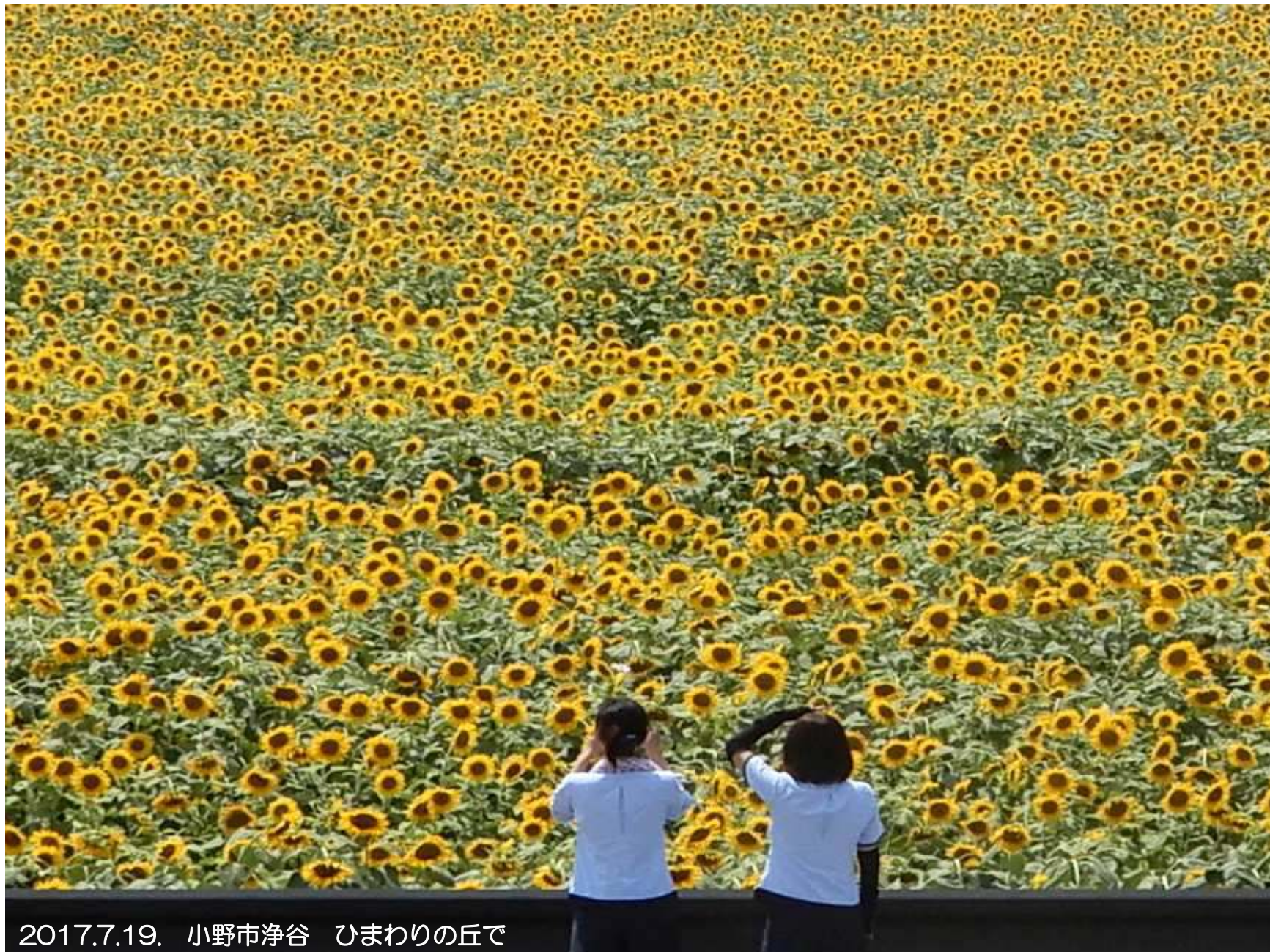
2017.7.19. 小野市浄谷 ひまわりの丘で