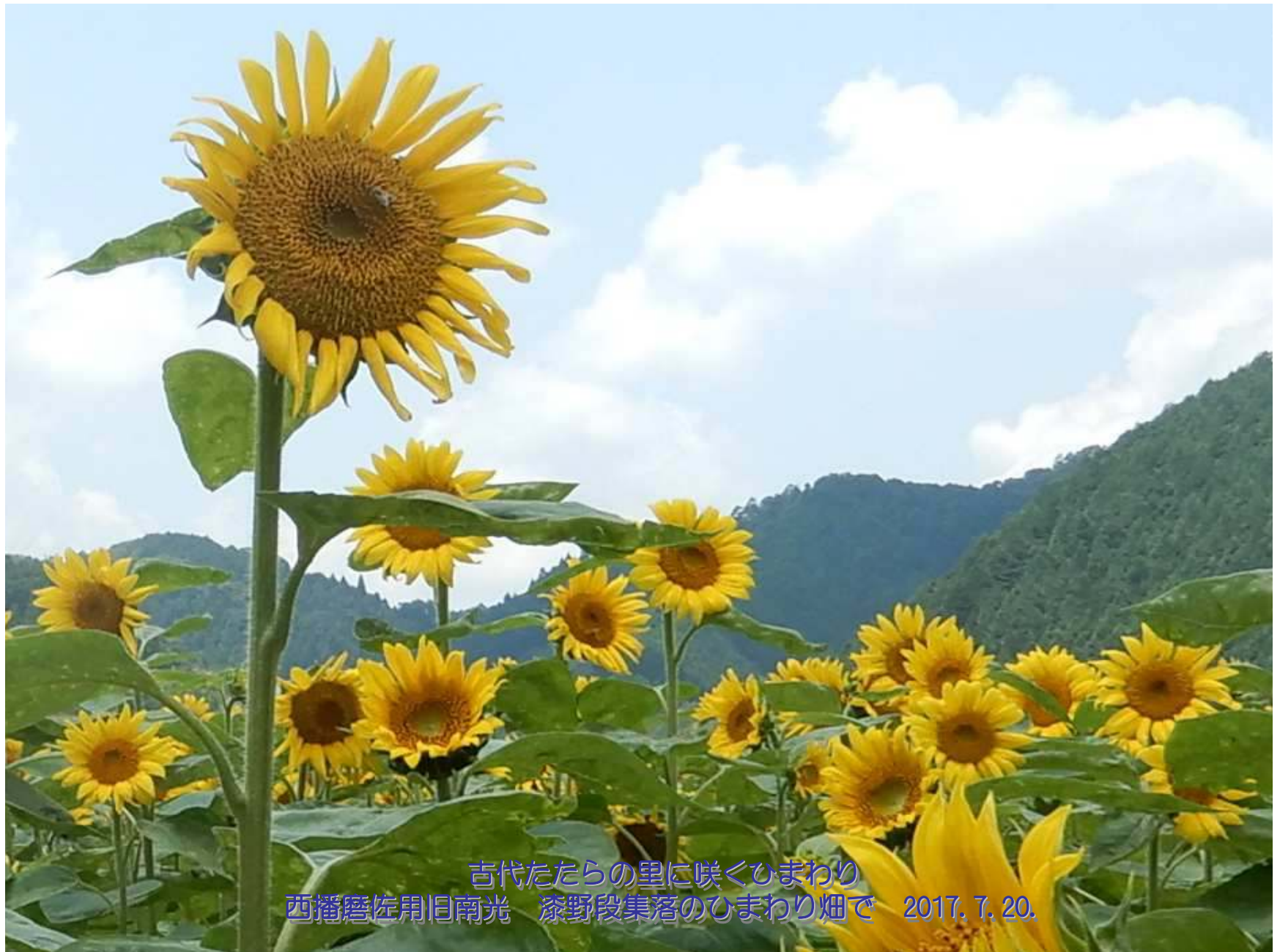
古代たたらの里に咲くひまわり 西播磨佐用旧南光 漆野段集落のひまわり畑で 2017. 7. 20.