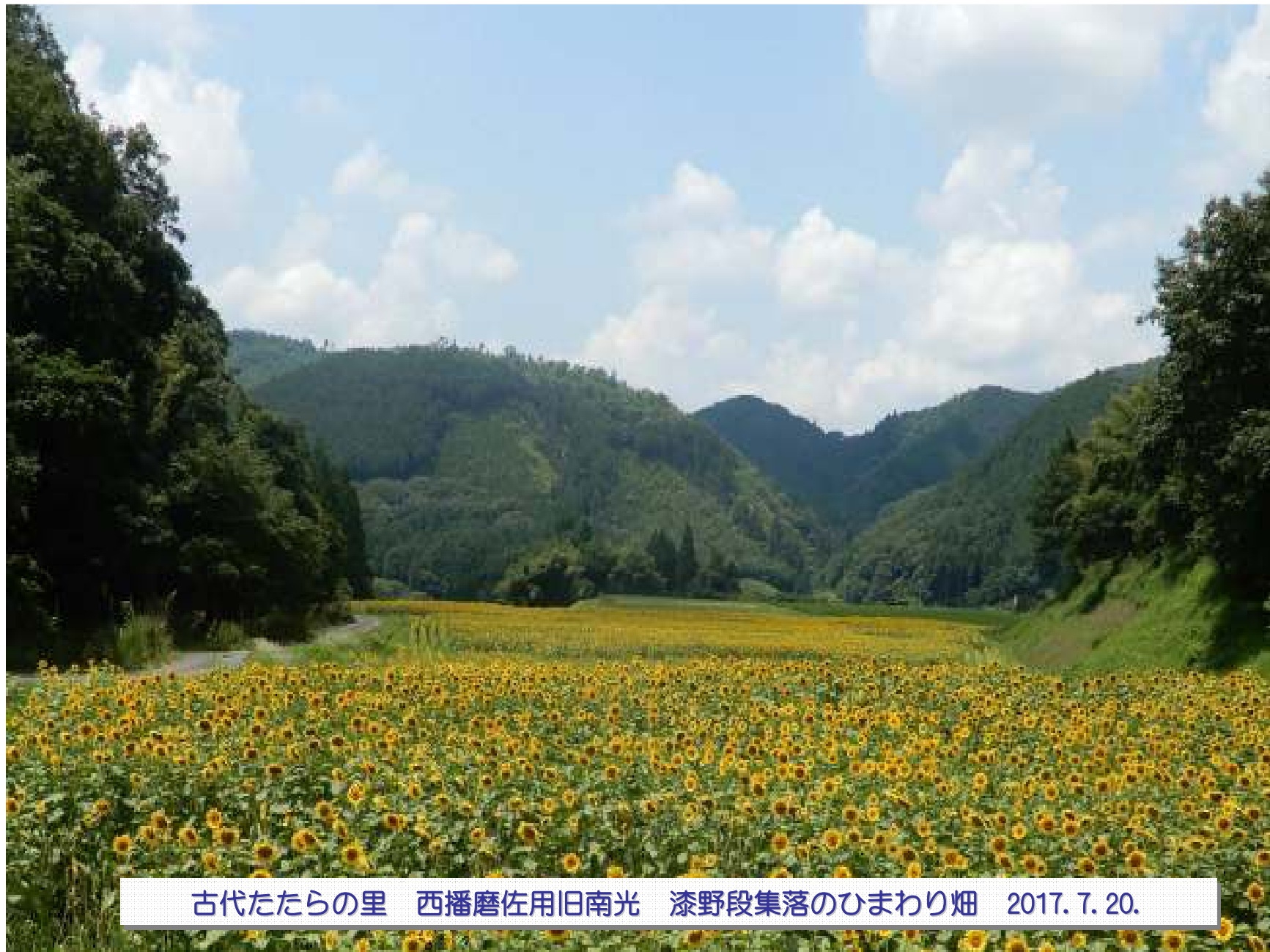
古代たたら の 里 西播磨 の 佐用旧南光 漆野段集落 の ひまわり畑 2017. 7. 20.