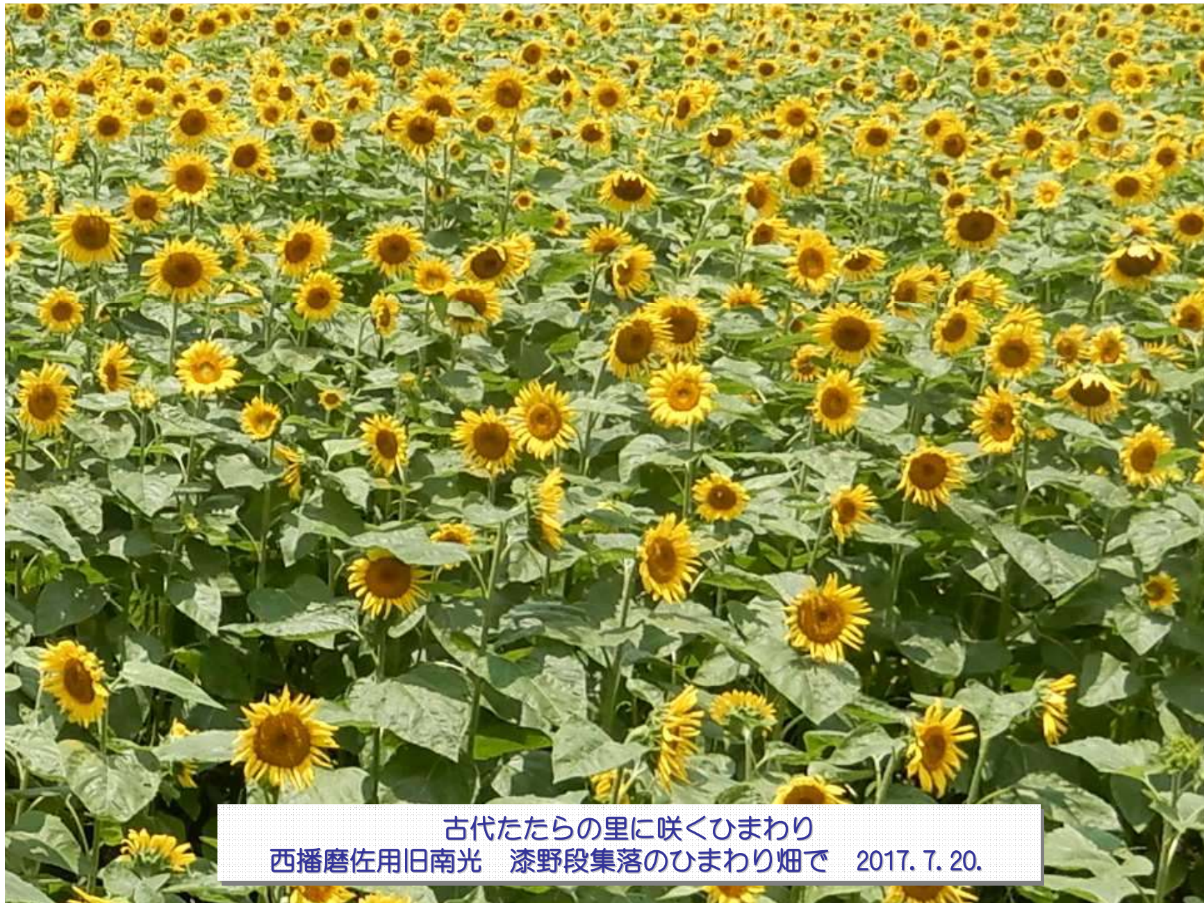
古代たたらのに咲くひまわり 西播磨佐用旧南光 漆野段集落のひまわり畑で 2017. 7. 20.