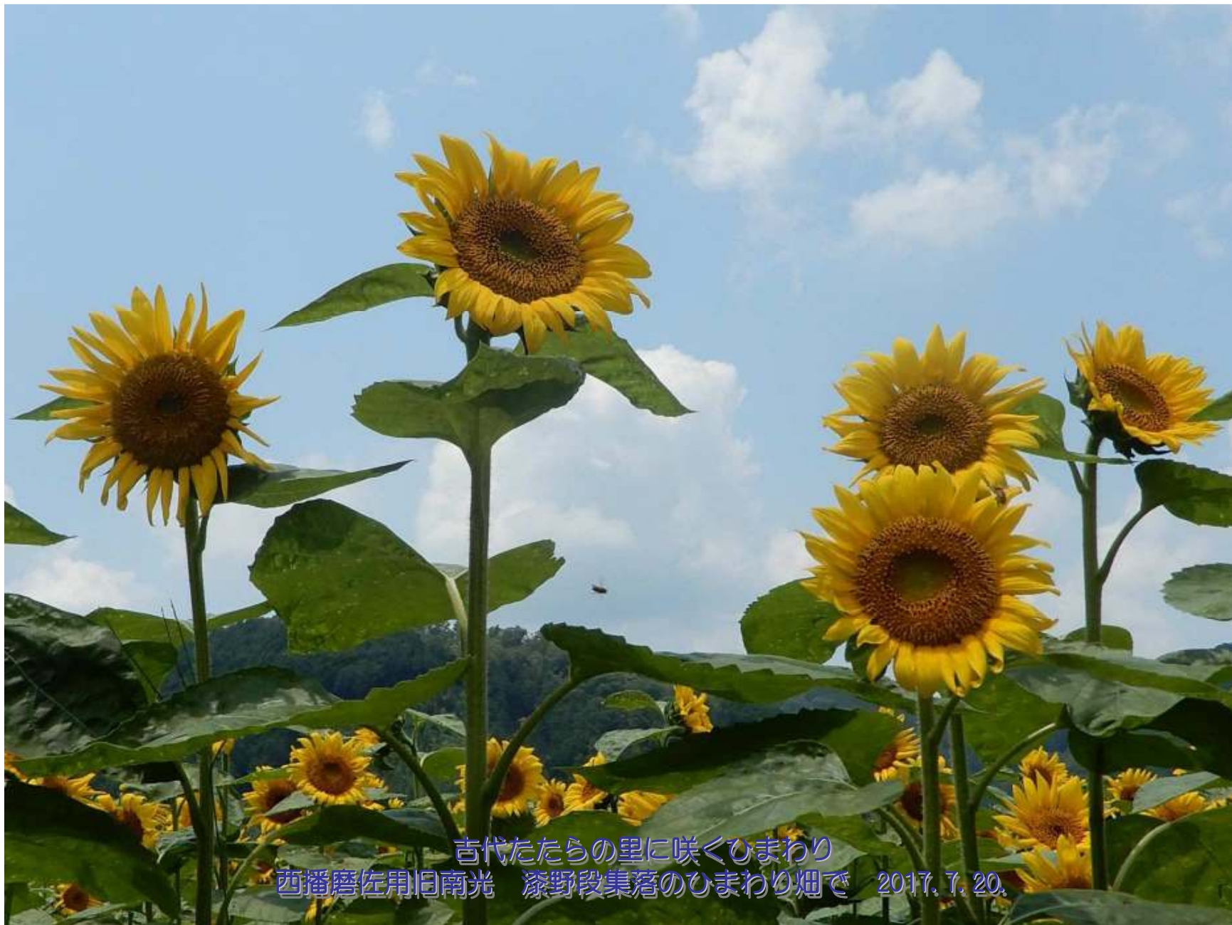
古代たたら の 里に咲くひまわり 西播磨 の 佐用旧南光 漆野段集落のひまわり畑で 2017. 7. 20.