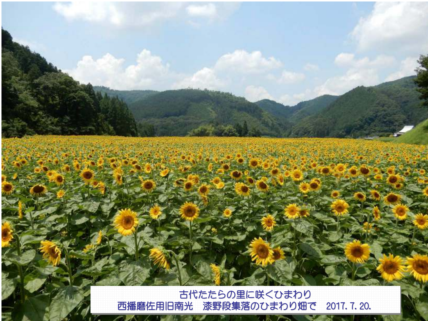
古代たたらに咲くひまわり 西播磨佐用旧南光 漆野段集落のひまわり畑で 2017. 7. 20.