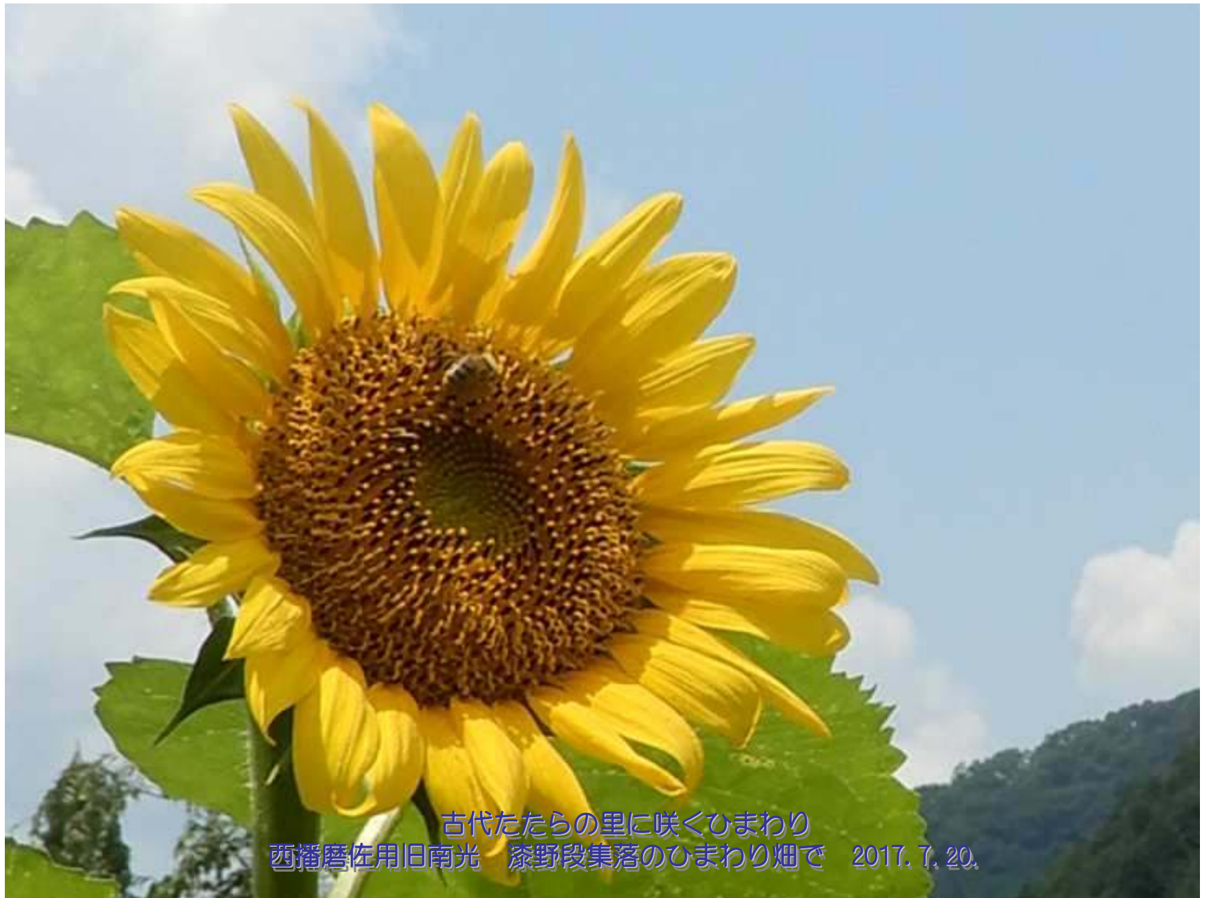
古代たたら 1 の里に咲くひまわり 西播磨 2 佐用旧南光 3 漆野段集落のひまわり畑で 2017. 7. 20.