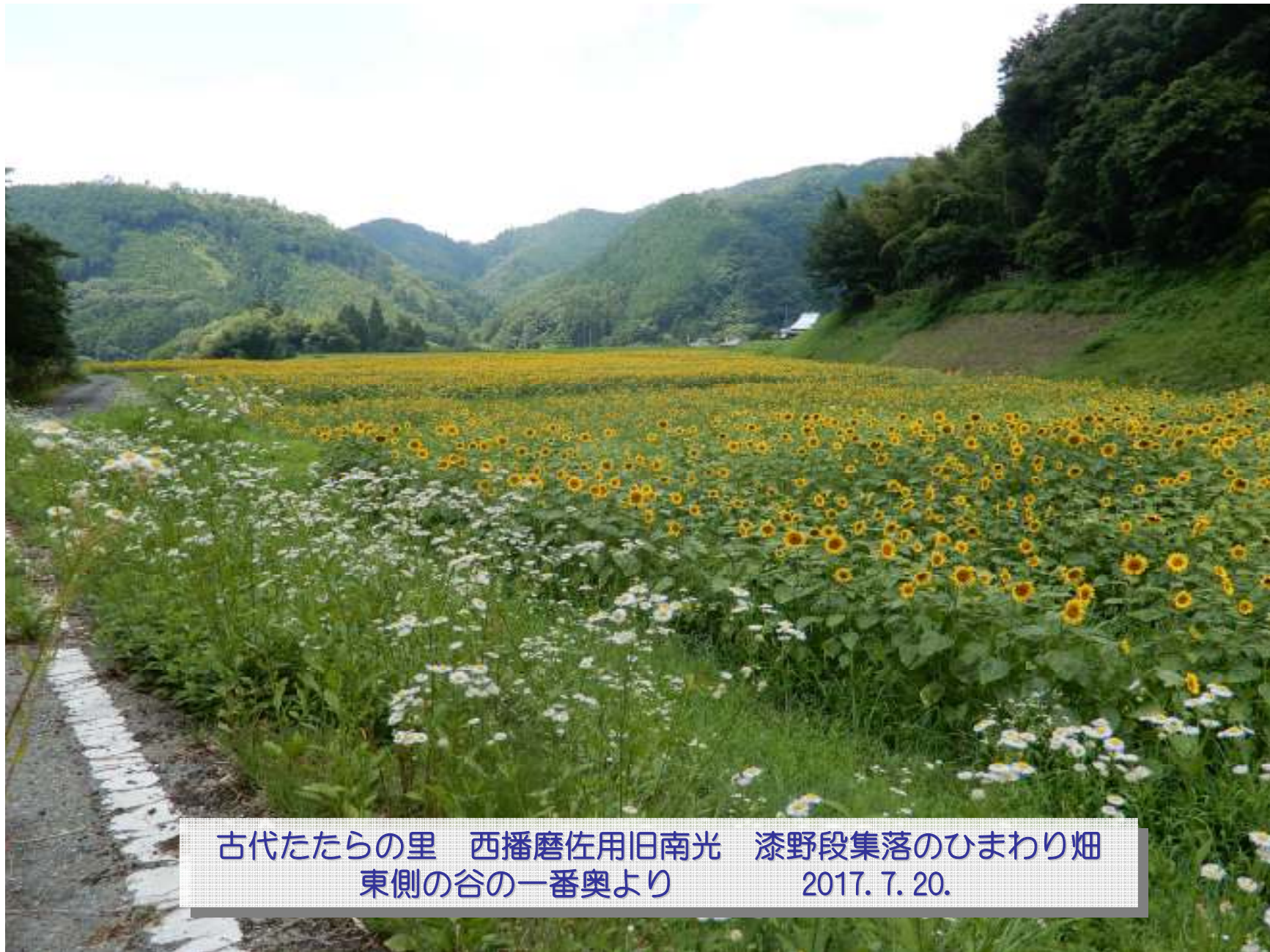
古代たたら の 里 西播磨 佐用 旧南光 漆野段集落のひまわり畑 東側の谷の一番奥より 2017. 7. 20.