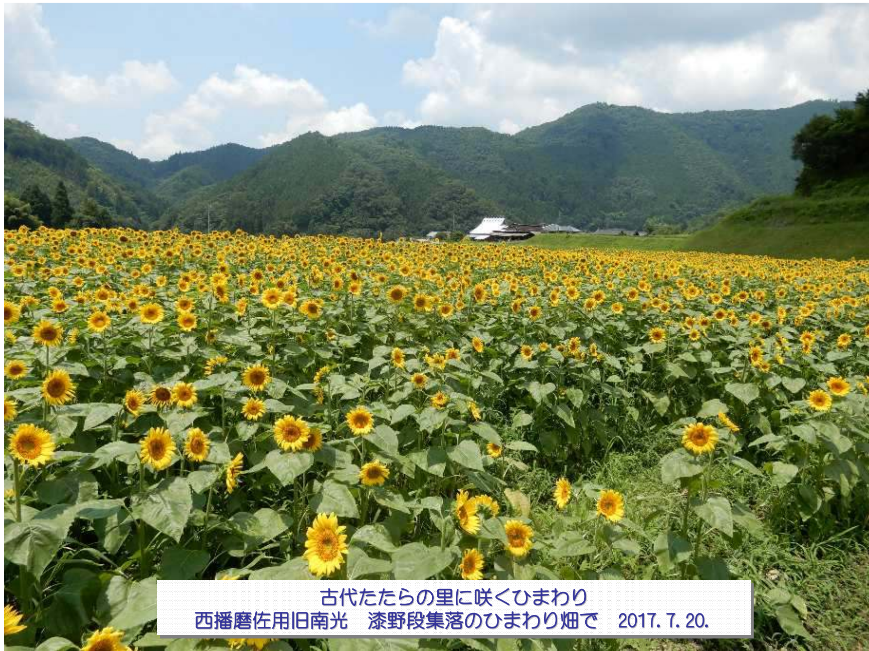
古代たたら の 里に咲くひまわり 西播磨佐用旧南光 漆野段集落のひまわり畑で 2017. 7. 20.