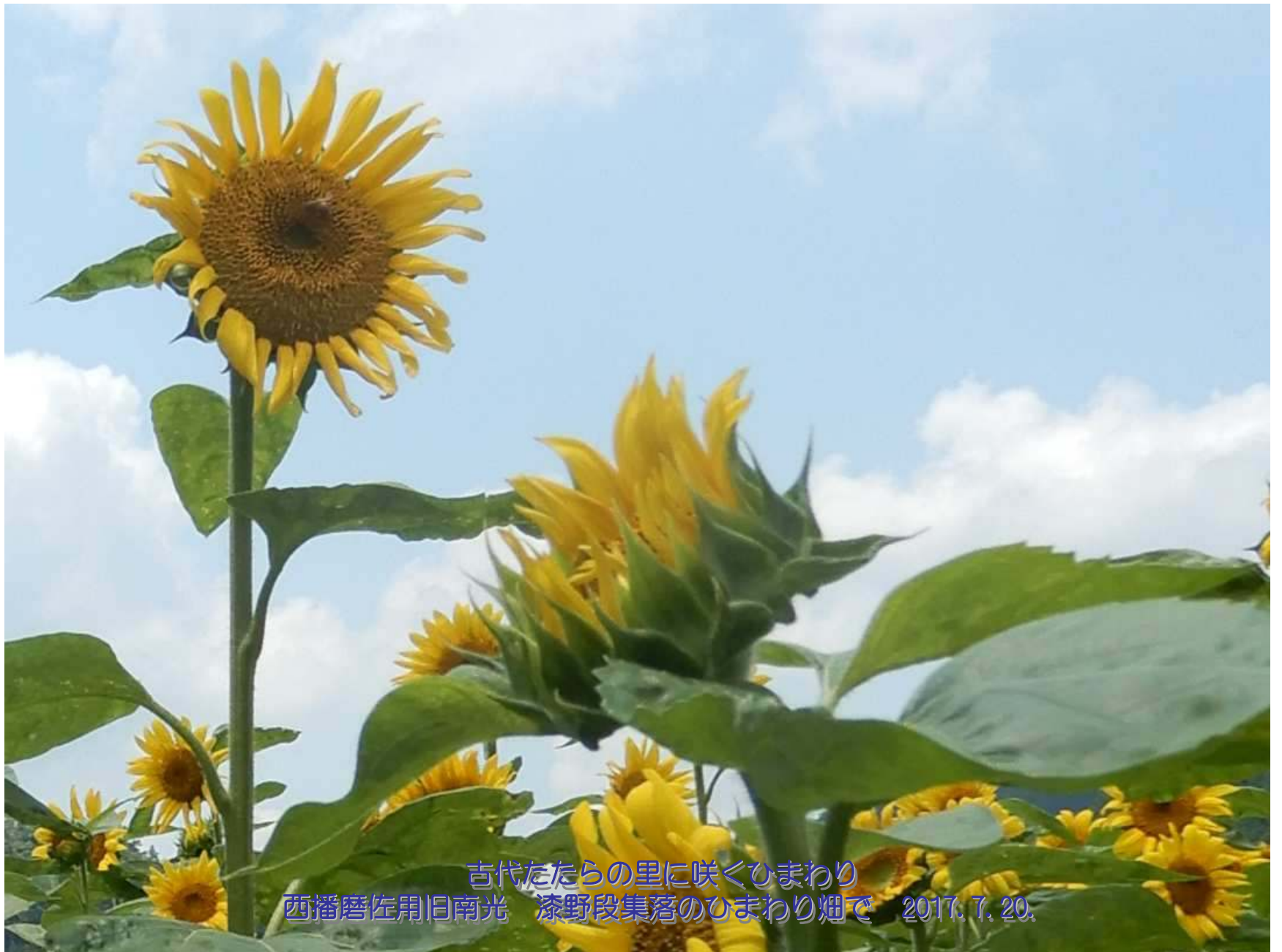
古代たたら の 里に咲くひまわり 西播磨 の 佐用旧南光 漆野段集落のひまわり畑で 2017. 7. 20.