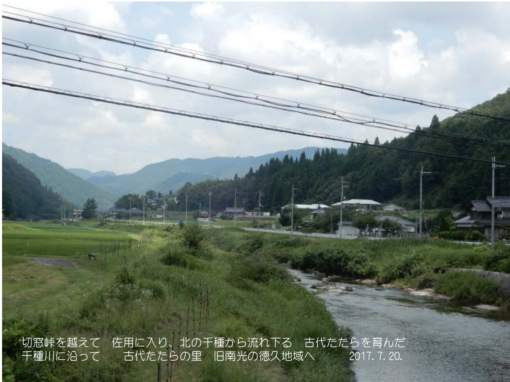
切窓峠を越えて 佐用に入り、北の千種から流れ下る 古代たたらを育んだ 千種川に沿って 古代たたらの里 旧南光の徳久地域へ 2017. 7. 20.