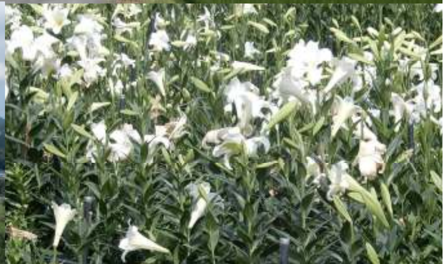
北神戸 淡河の里で 2017.7.19.