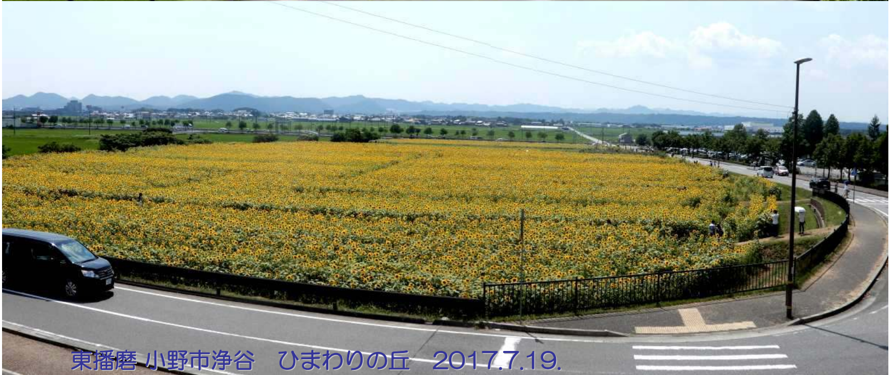
東播磨 小野市浄谷 ひまわりの丘 2017.7.19.