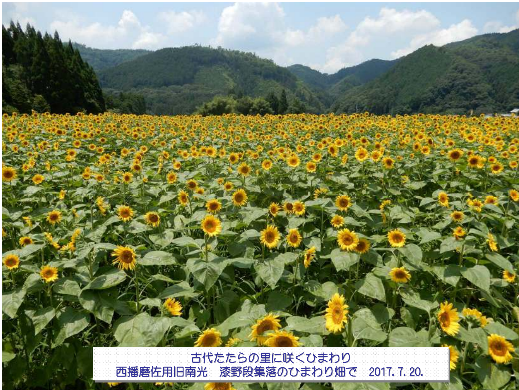
古代たたら の 里に咲くひまわり 西播磨佐用旧南光 漆野段集落のひまわり畑で 2017. 7. 20.