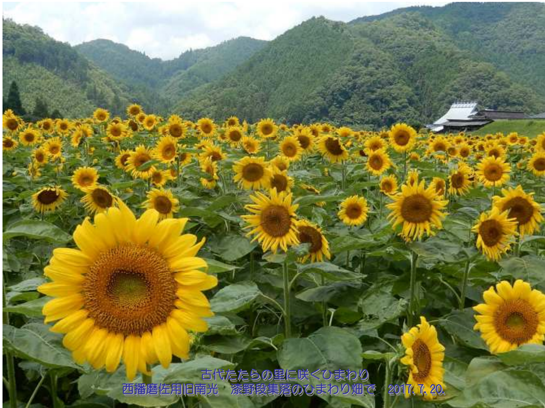
古代たたら の 里 に 咲くひまわり 西播磨 佐用 旧南光 漆野段集落 の ひまわり畑で 2017. 7. 20.