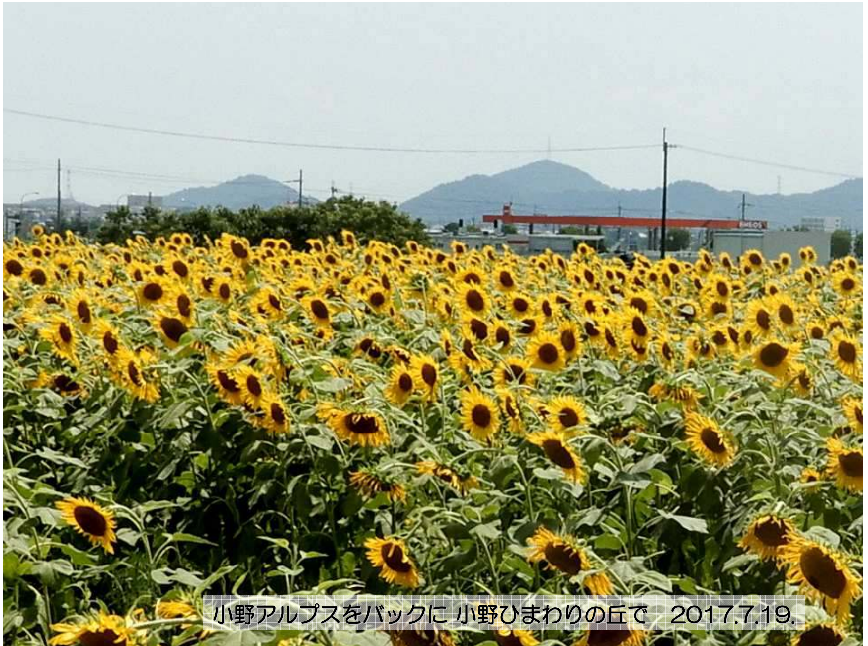
小野アルプスをバックに 小野ひまわりの丘で 2017.7.19.