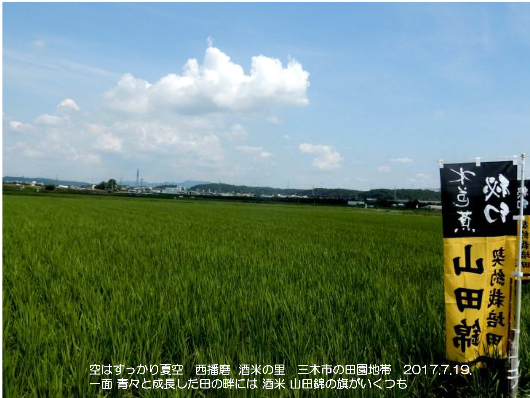
空はすっかり夏空 西播磨 酒米の里 三木市の田園地帯 2017.7.19. 一面 青々と成長した田の畔には 酒米 山田錦の旗がいくつも