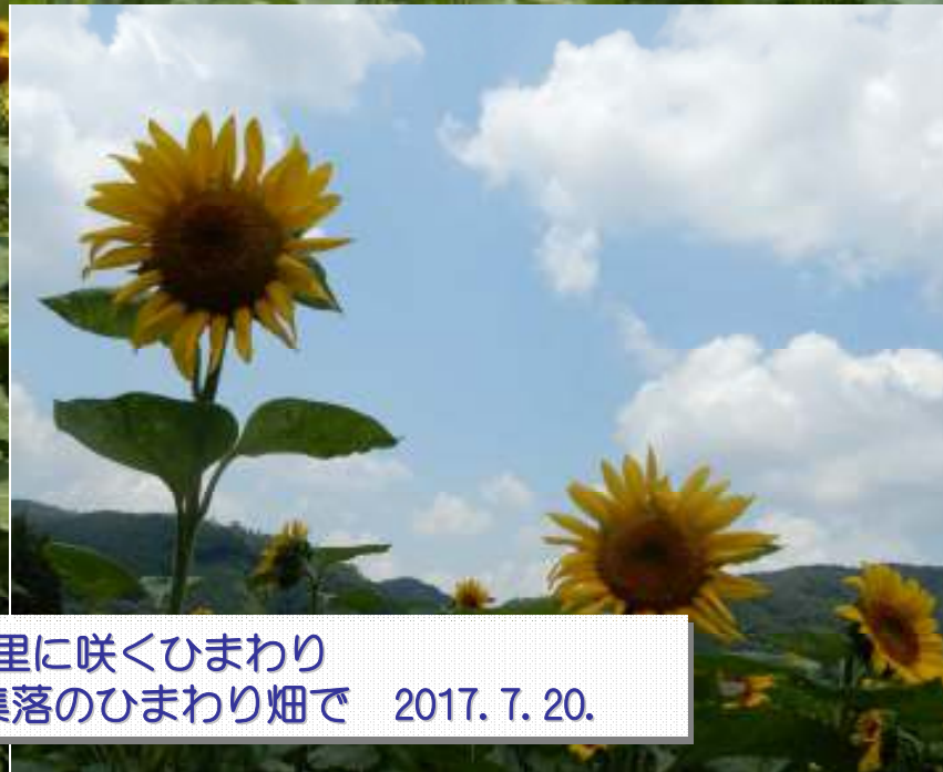
古代たたらに咲くひまわり 西播磨佐用旧南光 漆野段集落のひまわり畑で 2017. 7. 20.