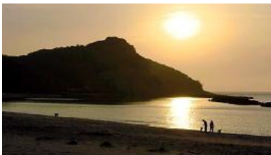
夕日に浮かんだ笠ヶ鼻東側の百済浦。海岸近くにたたら場があった時代には、砂鉄や木炭を運んだり、出来上がった鉄を各地へ送ったりする船が行き来した=大田市鳥井町鳥井

http://www.sanin-chuo.co.jp/shashin/modules/news/article.php?storyid=553097274