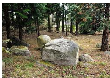
香木の森の裏山に転がる、鉄穴流して出た石=鳥根県邑南町矢上