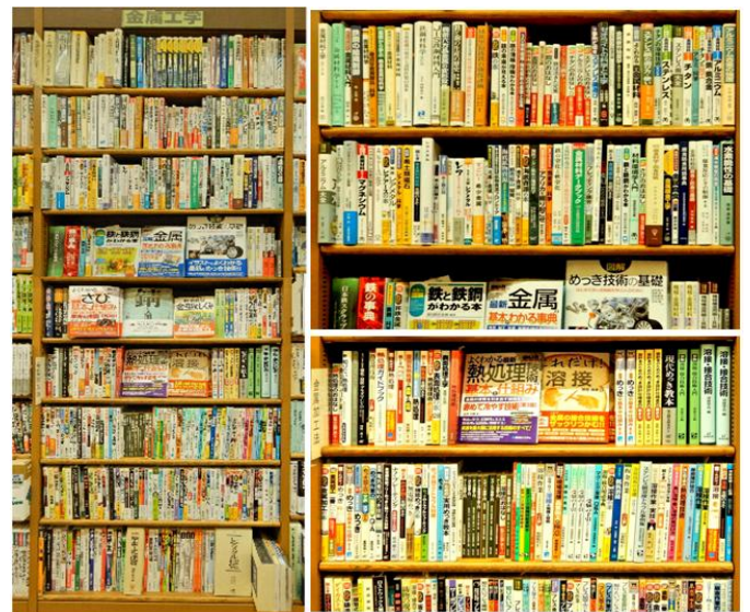
神戸三宮の本屋 理工学書「金属工学」の棚で

地方新聞社出版のふるさと本「山陰中央新報社編「鉄のまほろば -山陰 たたらの里を訪ねて-」 がこの本棚の一角にあったのも、そんな書店の視点でしょうか・・・