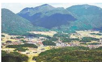
鉄穴残丘が点々とする於保知盆地。鉄穴流しによる地形改変の壮大な営みを感じさせる=鳥根県邑南町高水の町有宿泊施設「いこいの村しまね」から

http://www.sanin-chuo.co.jp/shashin/modules/news/article.php?storyid=555721274