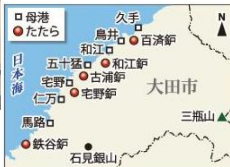
大田市内のたたらと回船業者の母港

大田市の岩見銀山遺跡が世界遺産に登録され、その繁栄ぶりが広く知られている。太田市周辺は江戸後期から明治初期にかけて、久手、鳥井、和江など、大田市内の港を拠点とする回船業者の名が数多く並び、これら、石見の回船業者は『海の総合商社』・鉄と海で栄えた姿が浮かび上がってきた