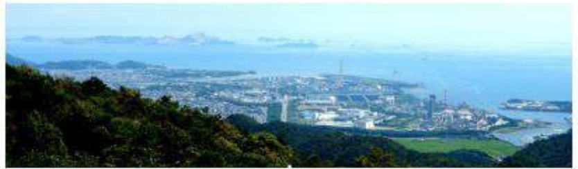
街の背後にそびえる黒鉄山とその頂上から眺めた千種川の河口に広がる赤穂の街