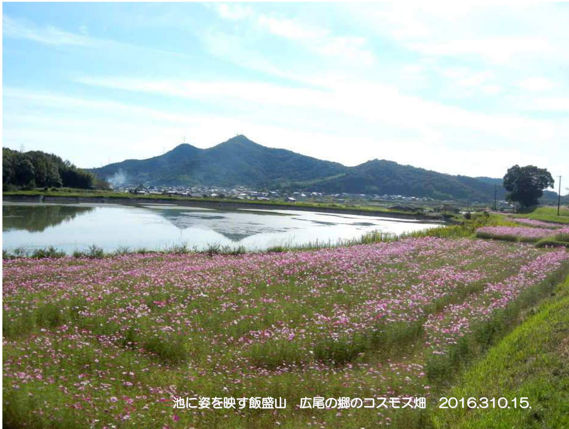
池に姿を映す飯盛山 広尾の郷のコスモス畑 2016.310.15.