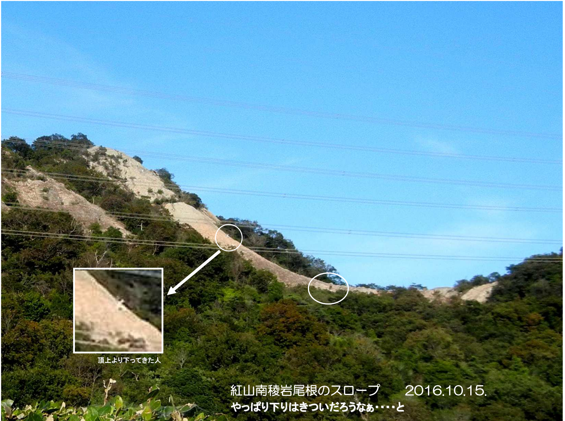
頂上より下ってきた人

紅山南稜岩尾根のスロープ 2016.10.15. やっぱり下りはきついただろうなあ……と