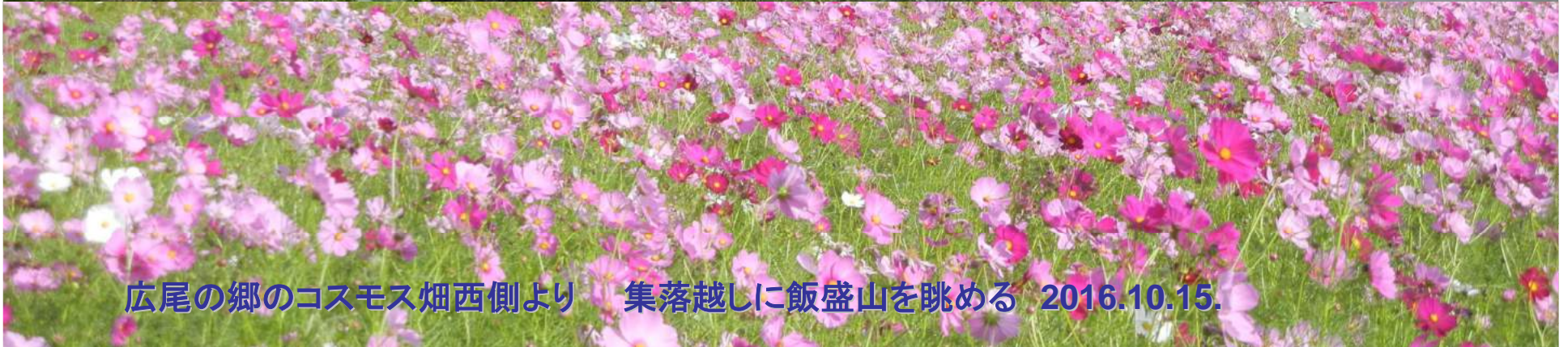
広尾の郷のコスモス畑西側より 集落越しに飯盛山を眺める 2016.10.15.