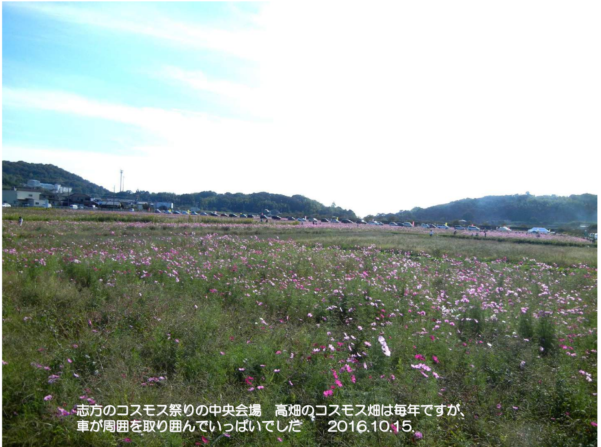
志方のコスモス祭りの中央会場 高畑のコスモス畑は毎年ですが、 車が周囲を取り囲んでいっぱいでした 2016.10.15.