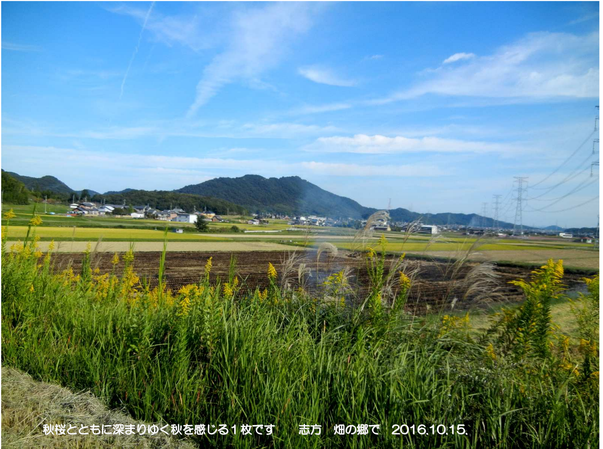
秋桜とともに深まりゆく秋を感じる1枚です 志方 畑の郷で 2016.10.15.