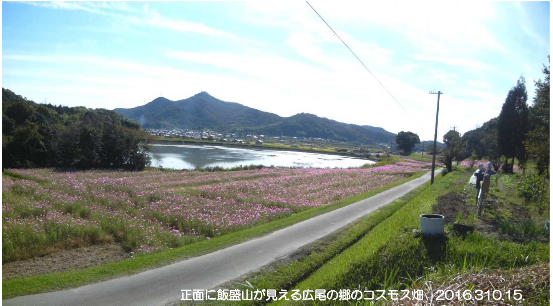
正面に飯盛山が見える広尾の郷のコスモス畑 | 2016.3.10.15.