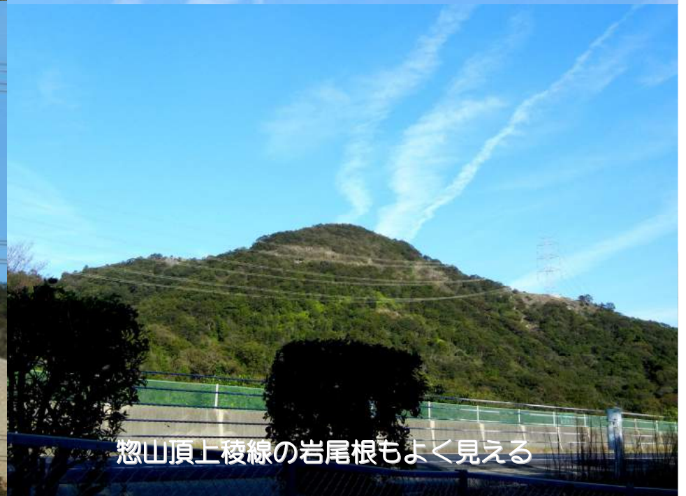
惣山頂上稜線の岩尾根もよく見える