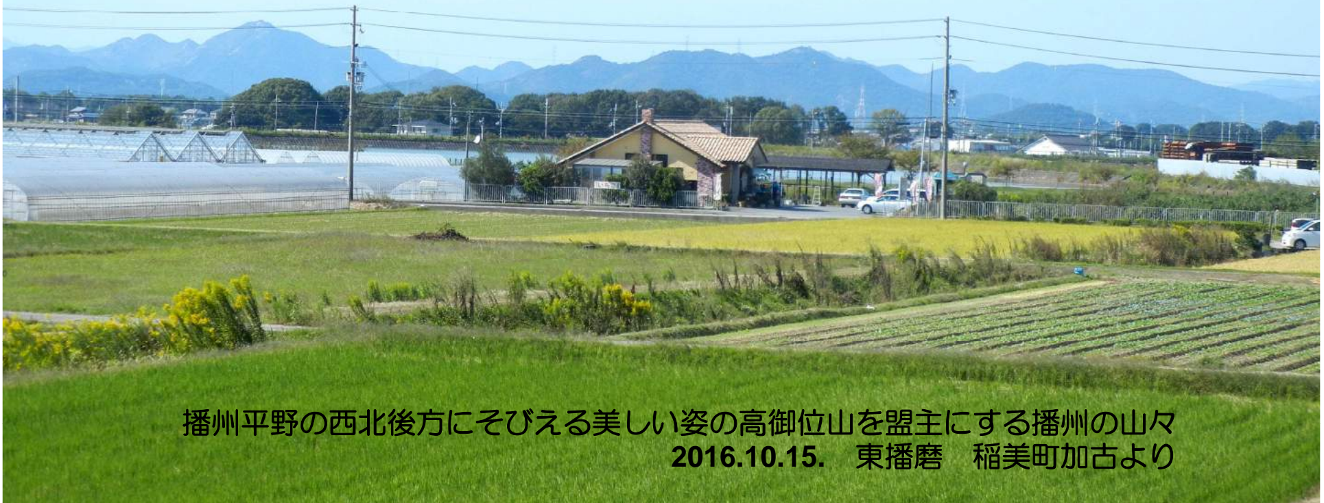
播州平野の西北後方にそびえる美しい姿の高御位山を盟主にする播州の山々 2016.10.15. 東播磨 稲美町加古より

志方の郷は加古川を渡った西岸 先月登った紅山のすぐ南側である。 西の高御位山から北の志方城山・小野連山の里山に囲まれた田園地帯。 毎年毎年違った顔を見せてくれるコスモスの秋景色 コスモスに出会うのを楽しみに。