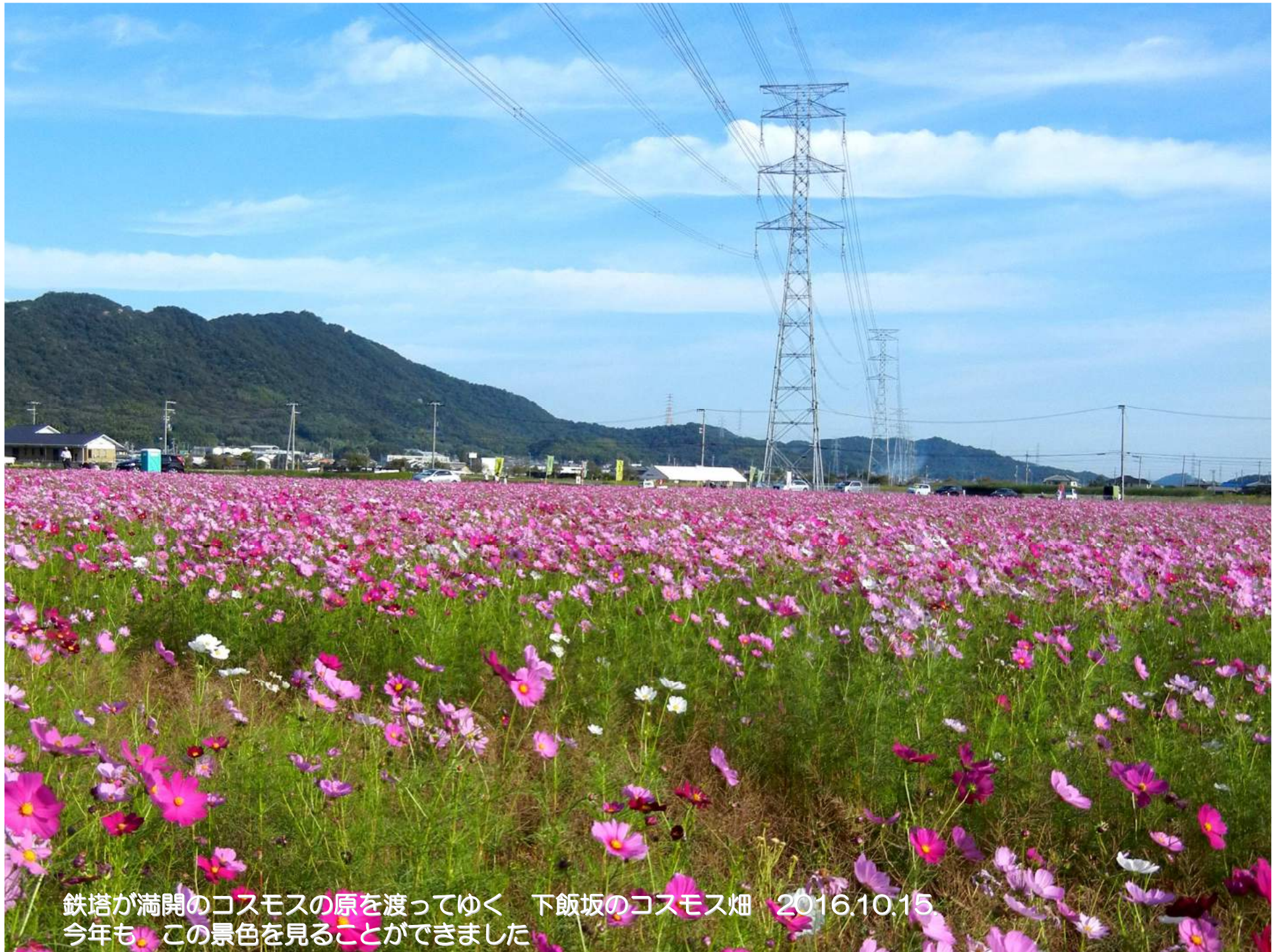
鉄塔が満開のコスモスの原を渡ってゆく 下飯坂のコスモス畑 2016.10.15 今年も この景色を見ることができました