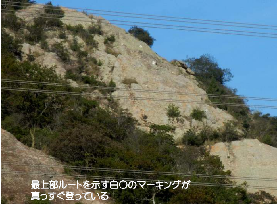
最上部ルートを示す白○のマーキングが 真っすぐ登っている