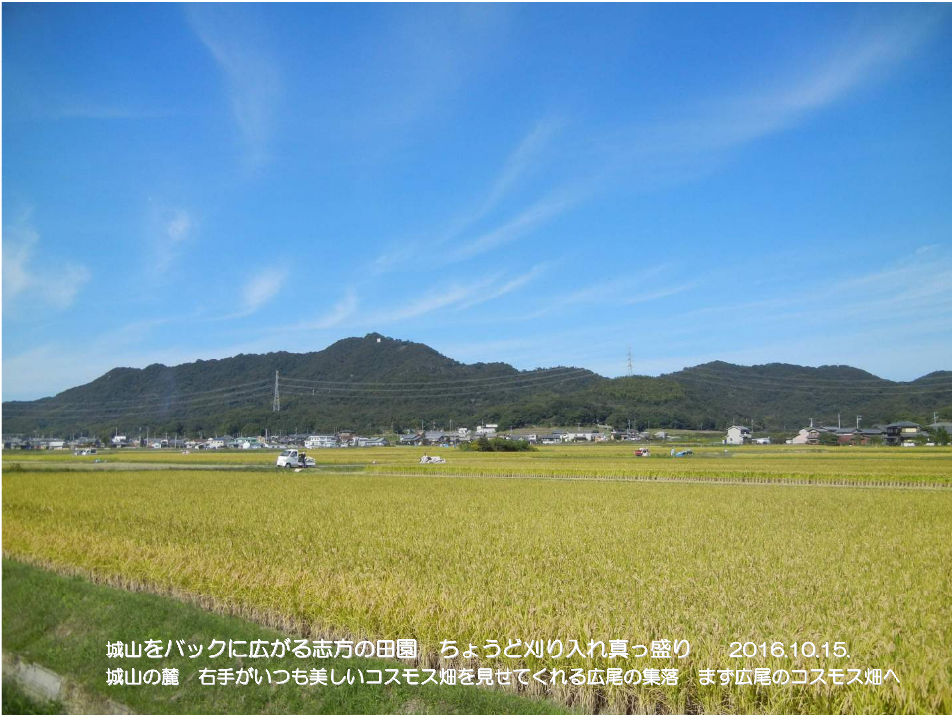
城山をバックに広がる志方の田園 ちょうど刈り入れ真っ盛り 2016.10.15. 城山の麓 右手がいつも美しいコスモス畑を見せてくれる広尾の集落 ます広尾のコスモス畑へ