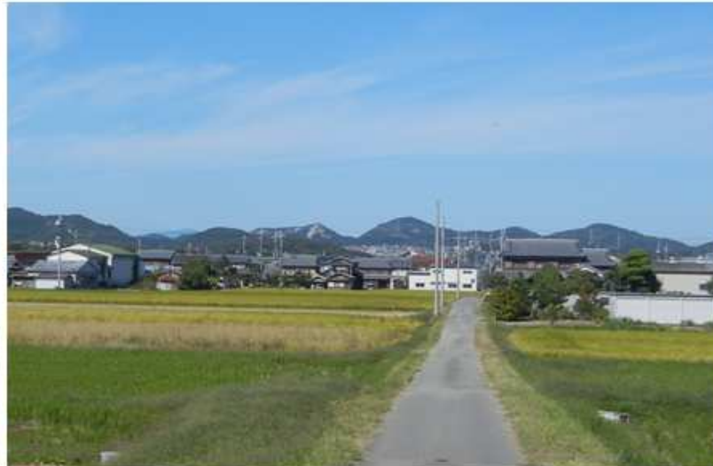
東播磨西北の高御位山