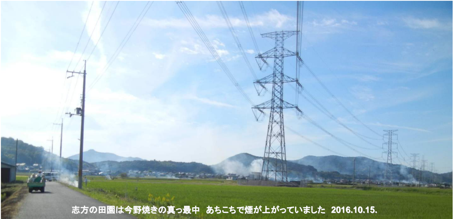
志方の田園は今野焼きの真っ最中 あちこちで煙が上がっていました 2016.10.15.