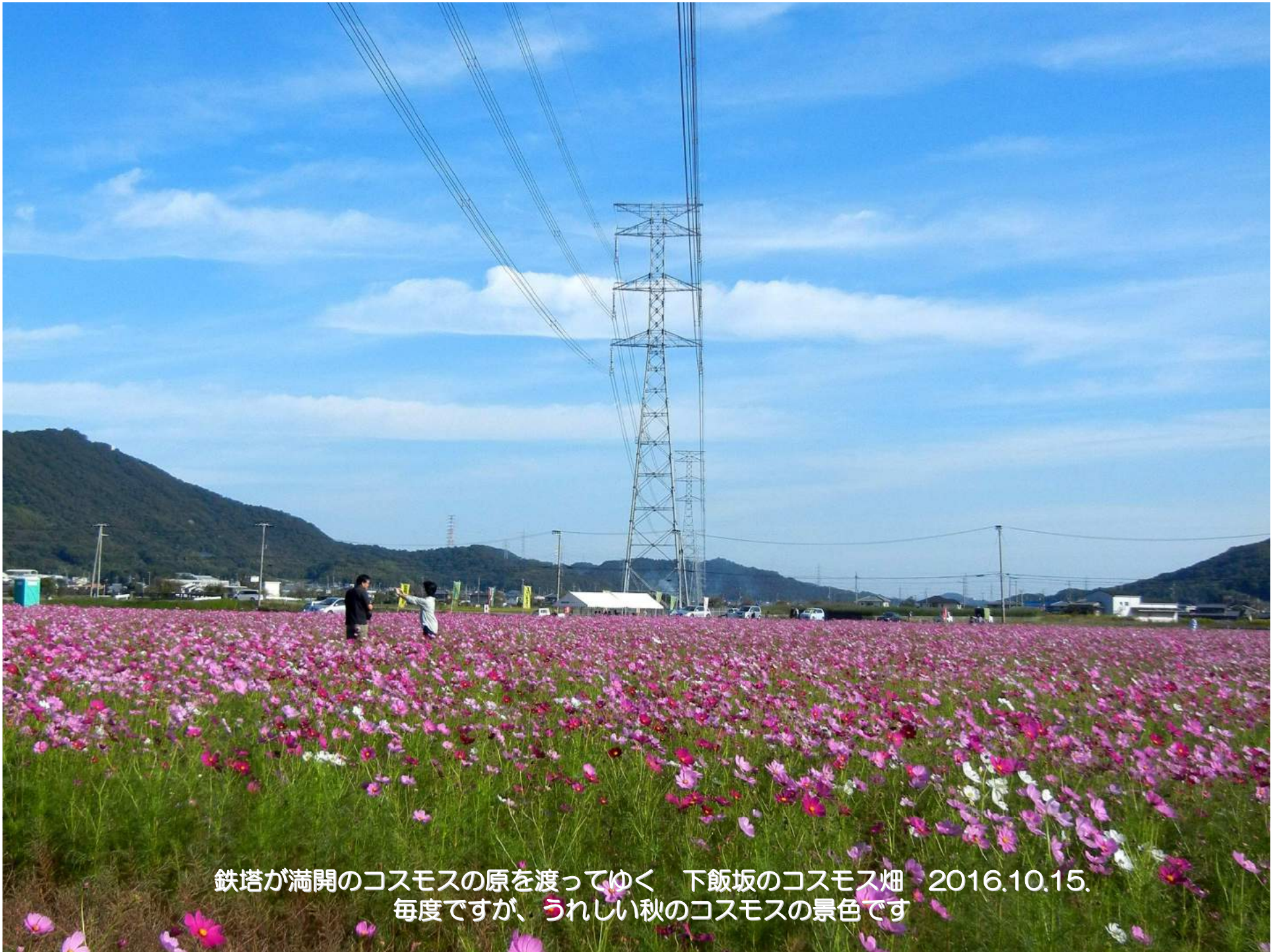
鉄塔が満開のコスモスの原を渡ってゆく 下飯坂のコスモス畑 2016.10.15. 毎度ですが、うれしい秋のコスモスの景色です