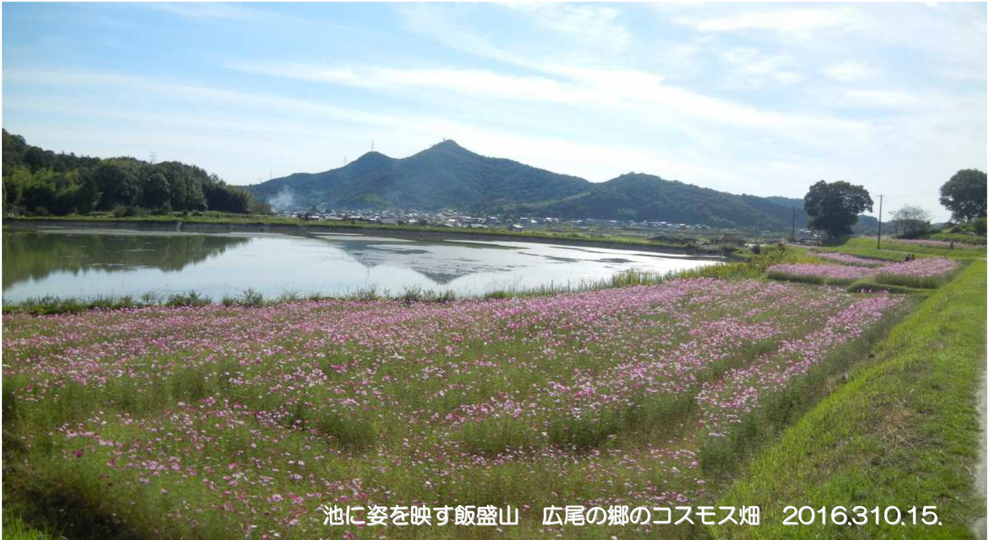
池に姿を映す飯盛山 広尾の郷のコスモス畑 2016.310.15.