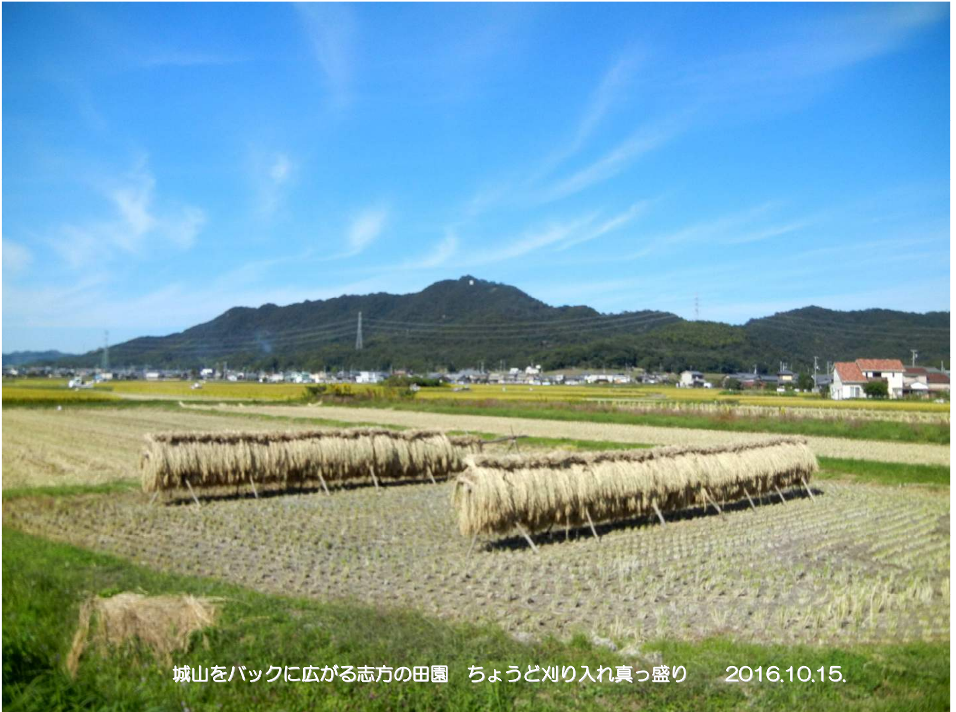
城山をバックに広がる志方の田園 ちょうど刈り入れ真っ盛り 2016.10.15.