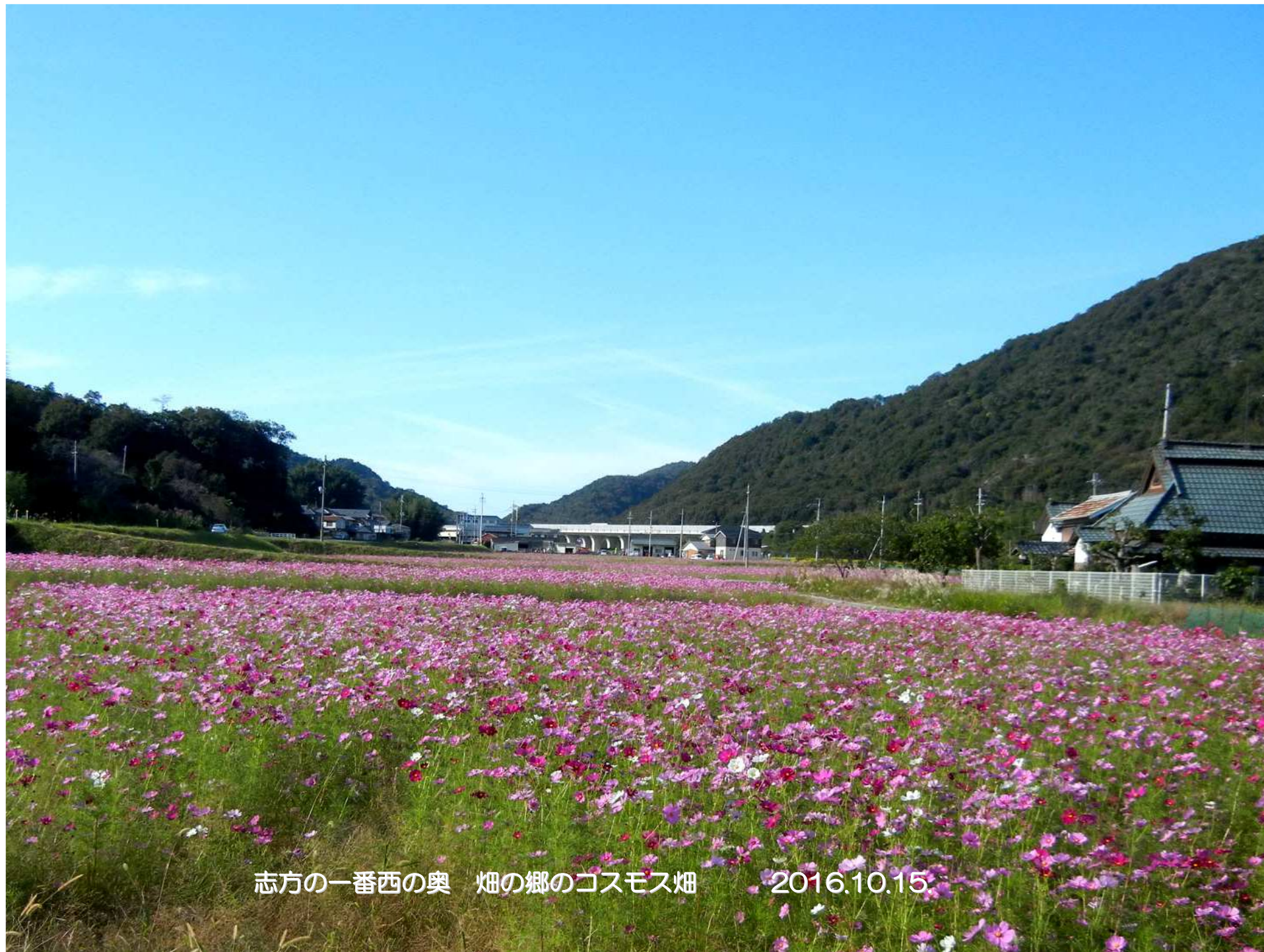
志方の一番西の奥 畑の郷のコスモス畑 2016.10.15