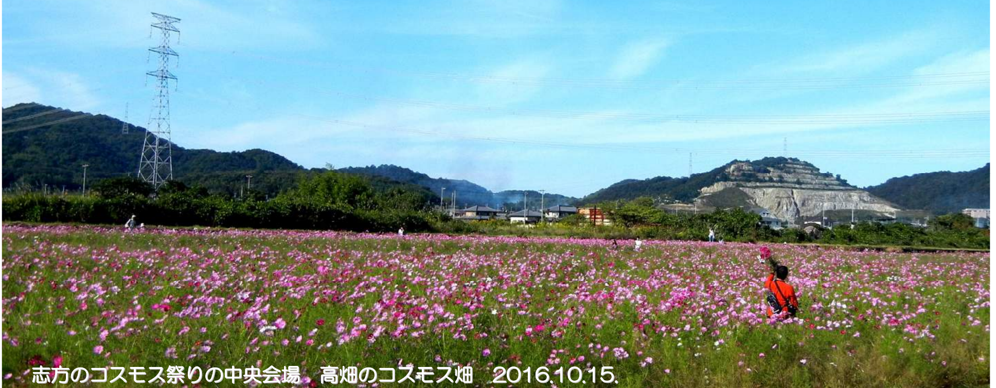
志方のコスモス祭りの中央会場 高畑のコスモス畑 2016.10.15.