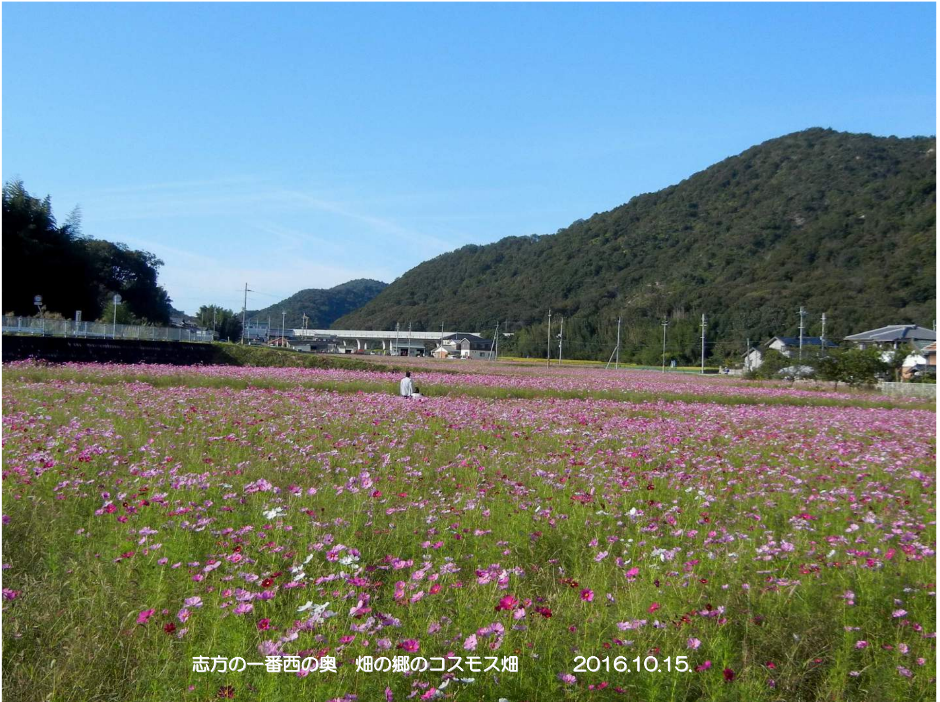
志方の一番西の奥 畑の郷のコスモス畑