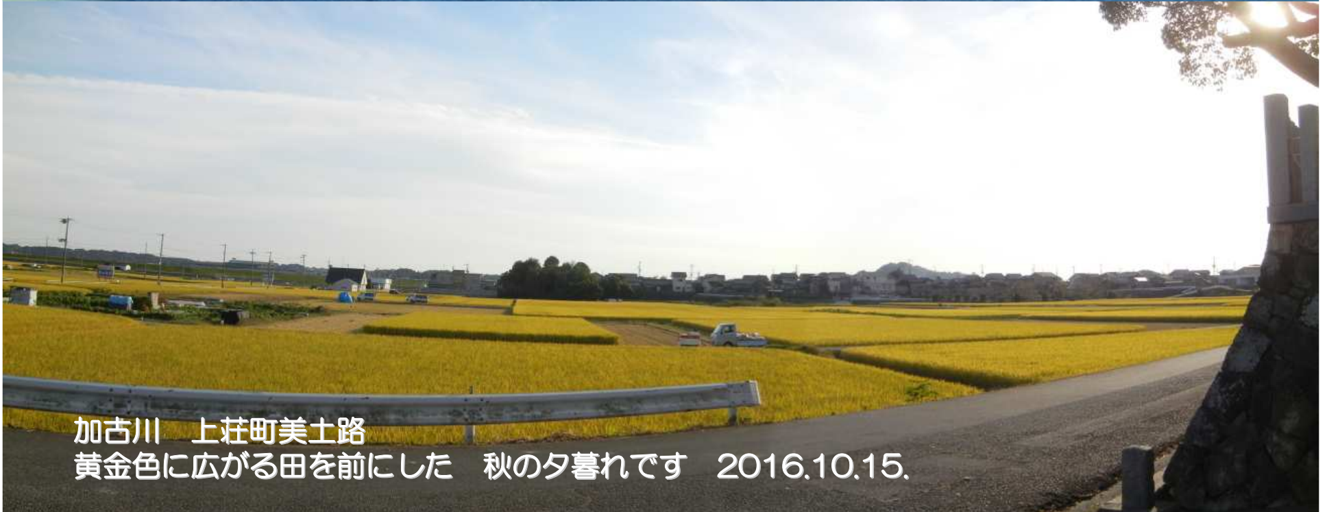
加古川 上荘町美土路 黄金色に広がる田を前にした 秋の夕暮れです 2016.10.15.