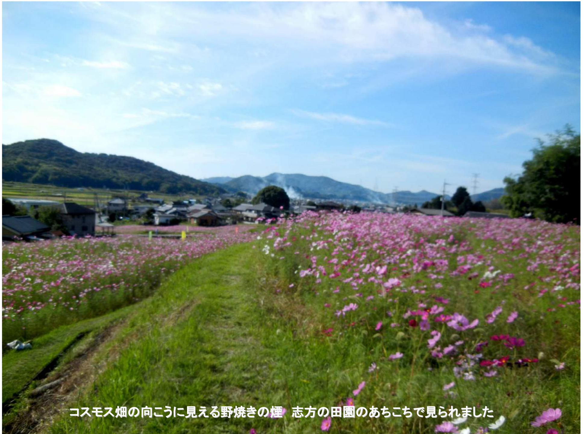
コスモス畑の向こうに見える野焼きの煙 志方の田園のあちこちで見られました