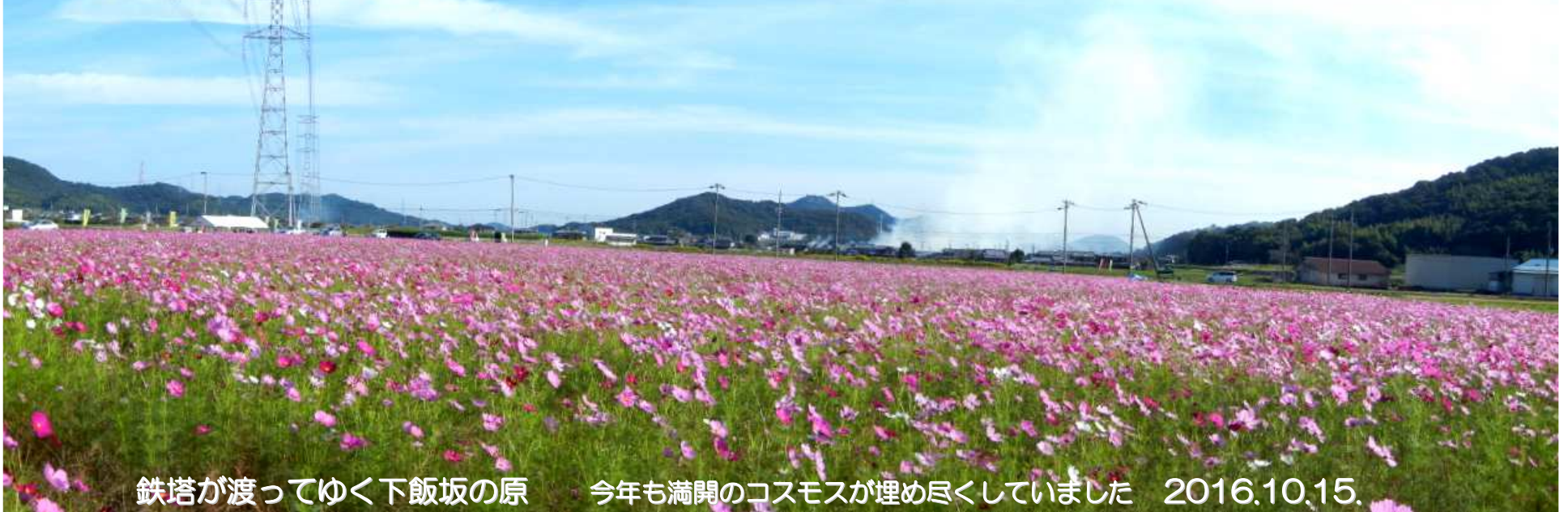
鉄塔が渡ってゆく下飯坂の原 今年も満開のコスモスが埋め尽くしていました 2016.10.15.