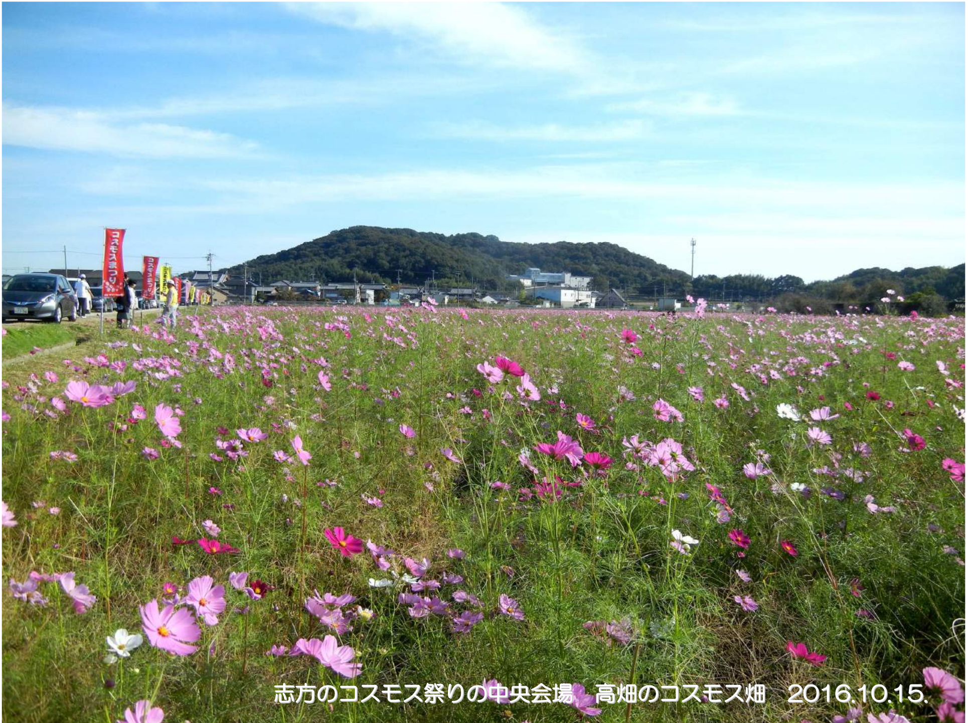
志方のコスモス祭りの中央会場 高畑のコスモス畑 2016.10.15.