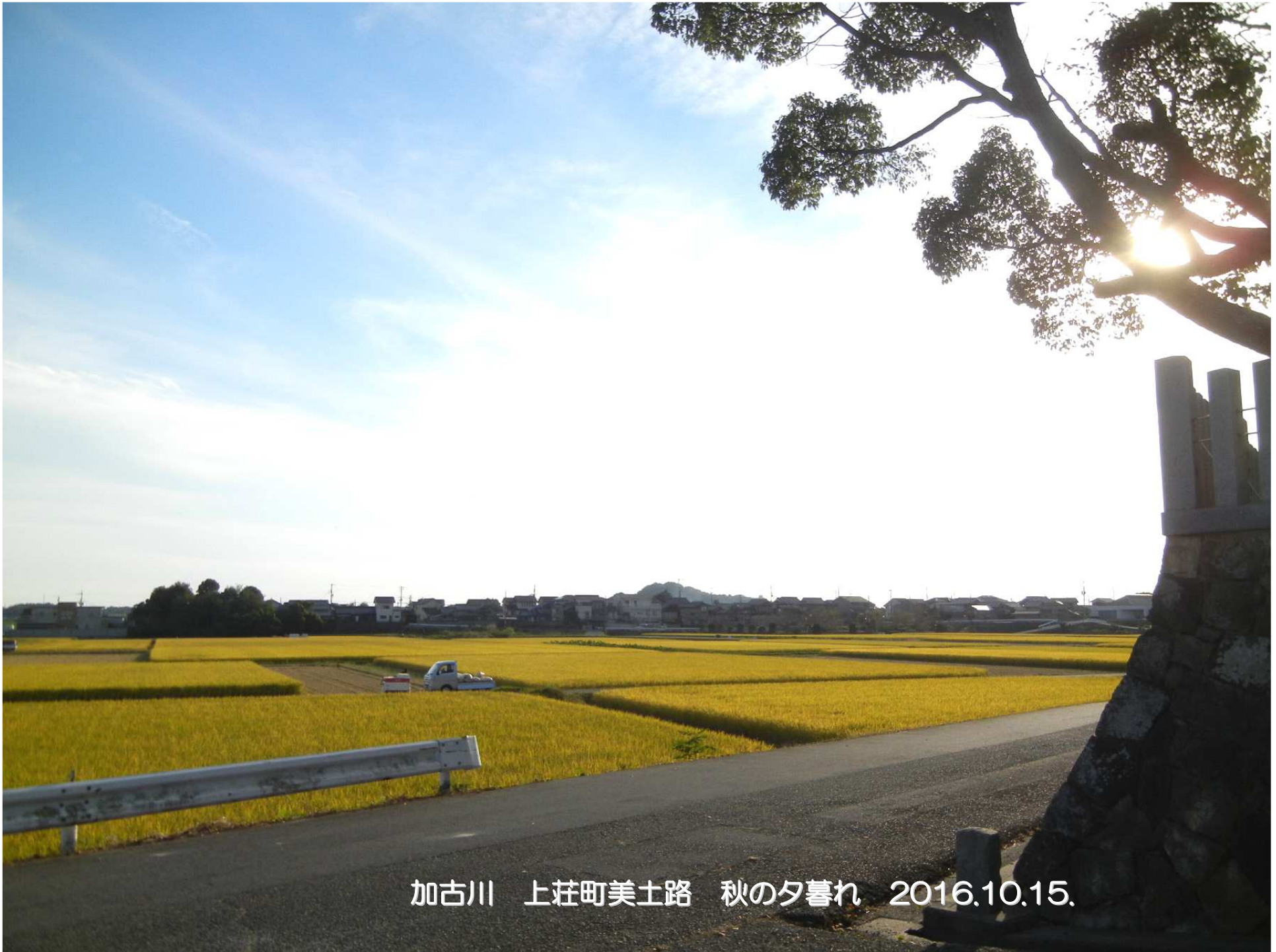
加古川 上荘町美土路 秋の夕暮れ 2016.10.15.