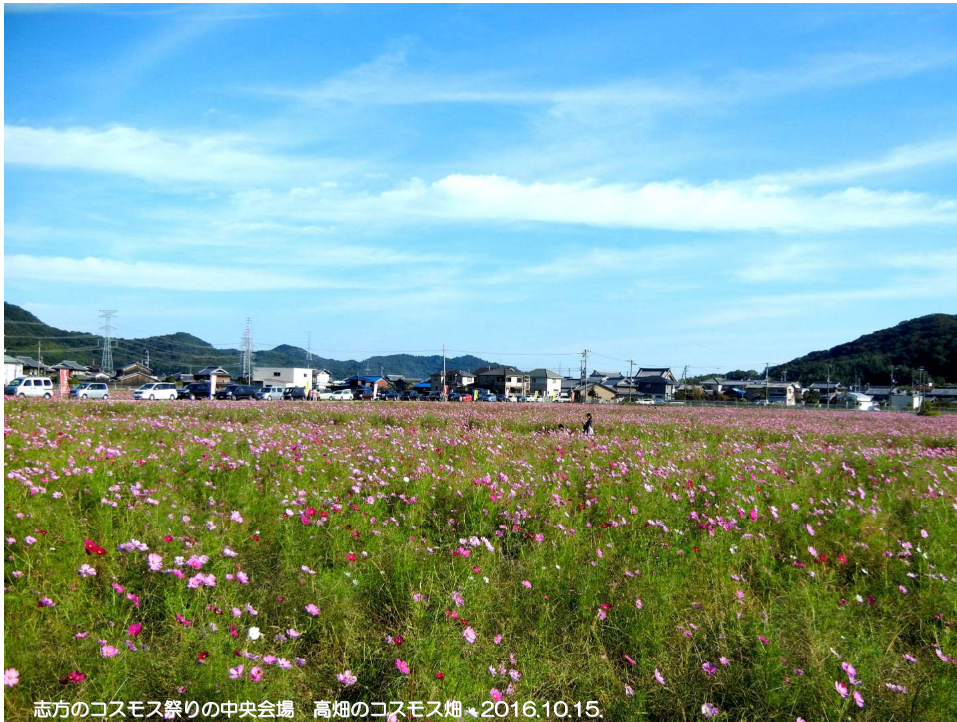
志方のコスモス祭りの中央会場 高畑のコスモス畑 2016.10.15.