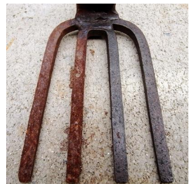
赤さびが発生している鉄鋏の右側半分だけ柿渋を塗り、何回か塗り重ね実験の結果

没食子酸が赤さびの Fe_2O_3 を還元して、黒さびの FeO と Fe_3O_4 にしたのです。柿のタンニンは縮合型のタンニンですが、加水分解で没食子酸ができますので、赤さびに塗ると没食子酸が黒さびに変え、分解されない部分が表面を覆うので、赤さびを抑える塗料になります。