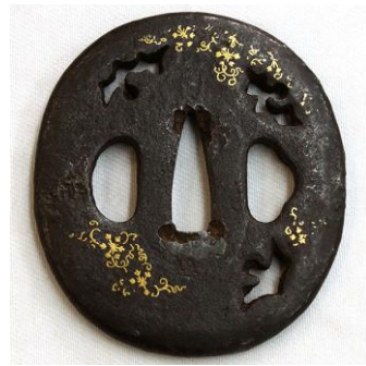
装飾品や刀のつばに施された肥後金象嵌 生地は肥後象眼伝統技法(錆び出し・錆止め)で施された「漆黒の黒」