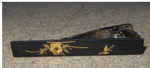
私の持っていた京象嵌のネクタイピン 錆止め後表面漆仕上げのようだ