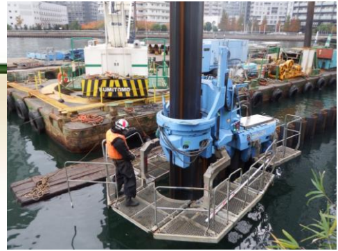
海の上でもコンパクトに杭列が作られている

また、鋼管杭の先端に刃のついたビットを取り付けた鋼管杭も鉄鋼会社と共同で開発され、それを使って、既存の硬いコンクリートや岩盤を貫入してゆく工法(ジャイロプレス)も既にできているという。