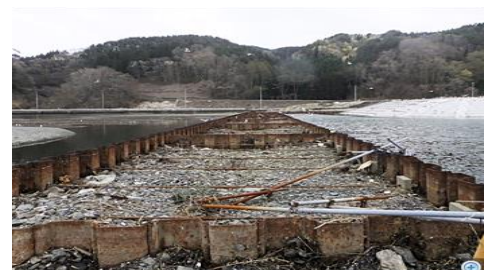
襲われた巨大津波からも守れた鋼板杭列の壁

連続して地中深くまで打ち込んだ杭(鋼管杭・矢板など)を立ち並べて壁を、コンパクトな作業空間でスピーディに、無騒音・無振動で作れる工法は場所・環境を選ばず頑強な構造物の形成にはもってこい。 構造基礎の荒っぽい杭打ちの工法からの視点変更で、夢の土木建築工法へ。そして さらに この工法でしかできぬ新しい構造物・社会インフラへ夢の用途が次々と膨らんでゆく。