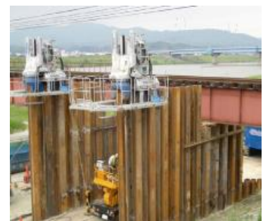
騒音無振動圧入法

「すでに地中に押し込まれて地球と一体化した杭、その杭打ち装置を載せ、杭をしっかり掴んで反力とし、次の杭を静荷重で地中に押し込む」との原理で、地中に打ち込んだ杭を複数本を掴むことで「地球と一体化」したことになり、大きな力を出すことができる。そしてその力を利用して、大きな静荷重で押し込み、を杭を地中にお振動・騒音のない無公害杭打ができる。そして、これを実現できるコンパクトな無公害型の油圧式杭圧入引抜機を開発して、現場に投入し、圧入機本体と電源のほか、杭材を圧入機本体に建て込むためのクレーンが1台あれば施工できるという無騒音・無振動の連続杭打ち圧入工法を完成して実用化し、現実の工法として大きな成果をあげている。