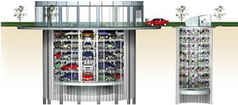
こんな広い地下空間がこの杭工法でコンパクトに作り出せる

巨大津波に襲われた巨大なコンクリート堤防が、もろくも破壊された中、この地中深く打ち込まれた鋼管杭の壁が破壊されることなく、この津波の巨大エネルギーをがっちり受け止めるなど誰も考え得なかった。考えてみれば、「強度と靱性」を兼ね備えた「鋼」が大地の奥深くまでがっちり根を生やしているのである。そういえば 奈良と大阪の県境の大和川 亀の瀬の大地すべり地帯でも 巨大な杭(鉄筋コンクリート杭)が10数年かけて何本も地中深く打ち込む作業が続いている。同様の耐震・耐津波性を有する構造が短期に連続して、環境をいわずにできるとなると夢の技術。被災地復興の大きな助けになる。