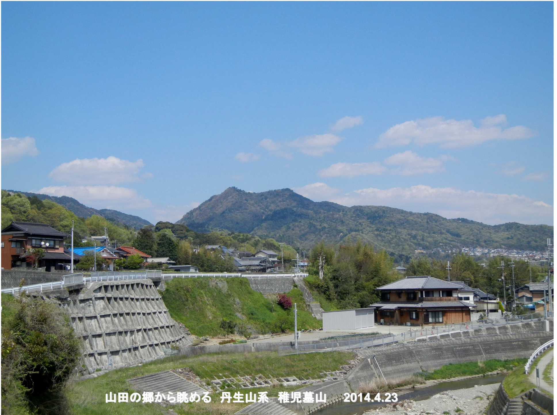
山田の郷から眺める 丹生山系 稚児墓山 2014.4.23