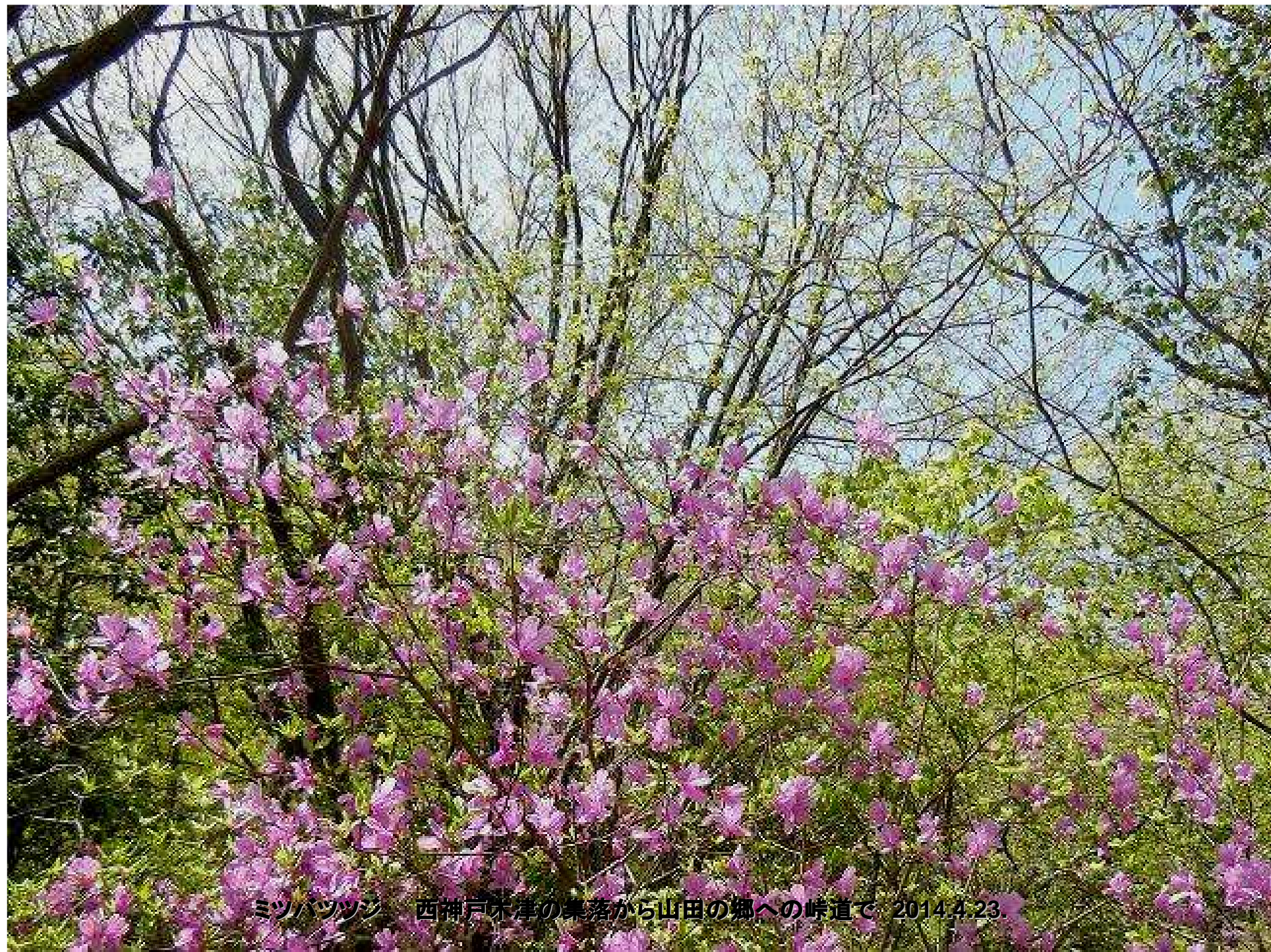
ミツハツツシ 西神戸木津の集落から山田の郷への峠道で 2014.4.23.