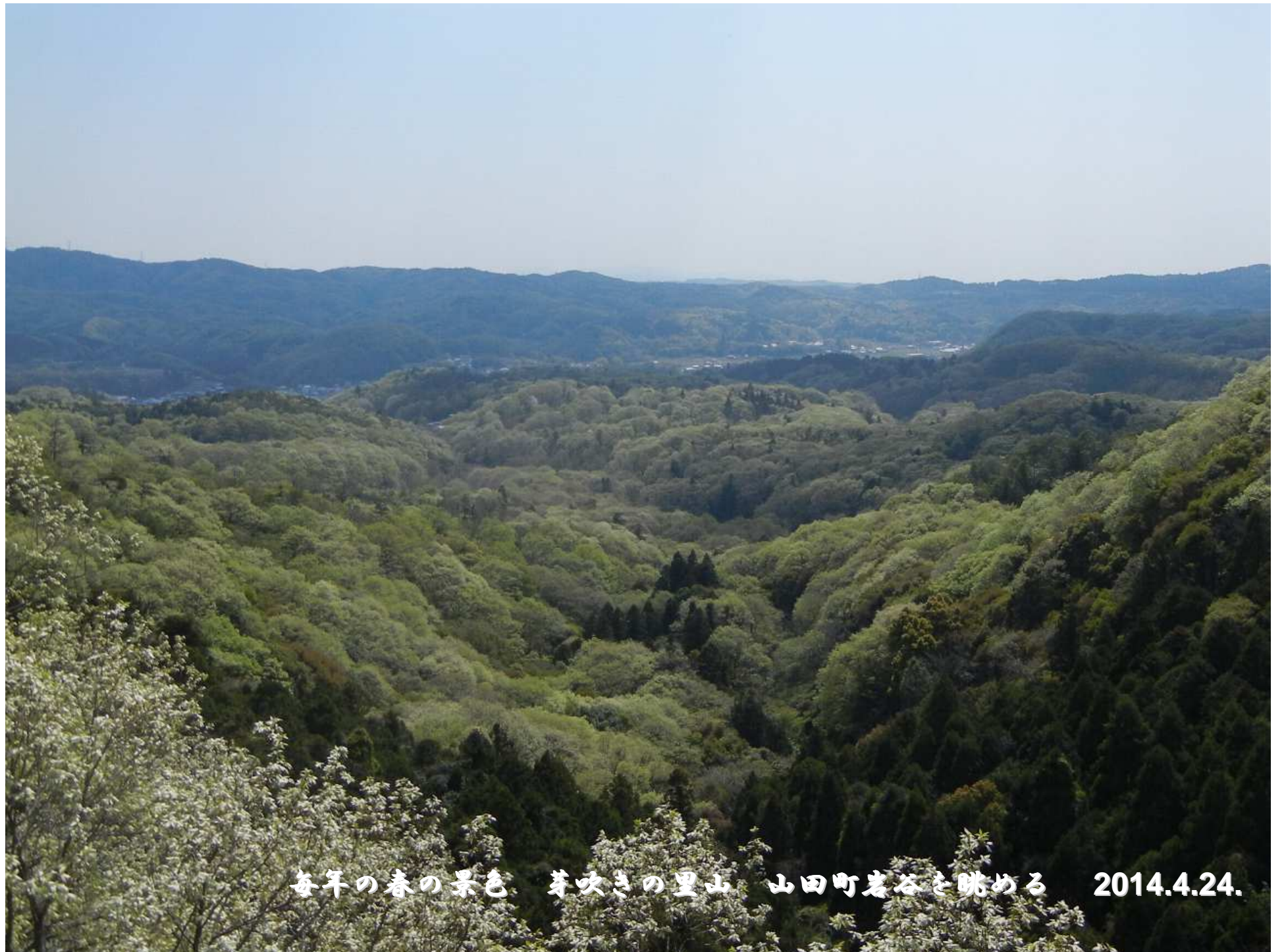
毎年の春の景色 芽吹きの里山 山田町岩谷を眺める 2014.4.24.