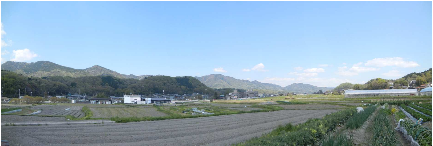
西から東へ 丹生山系の山々に囲まれた神戸の田舎 山田の郷 2014.4.23.