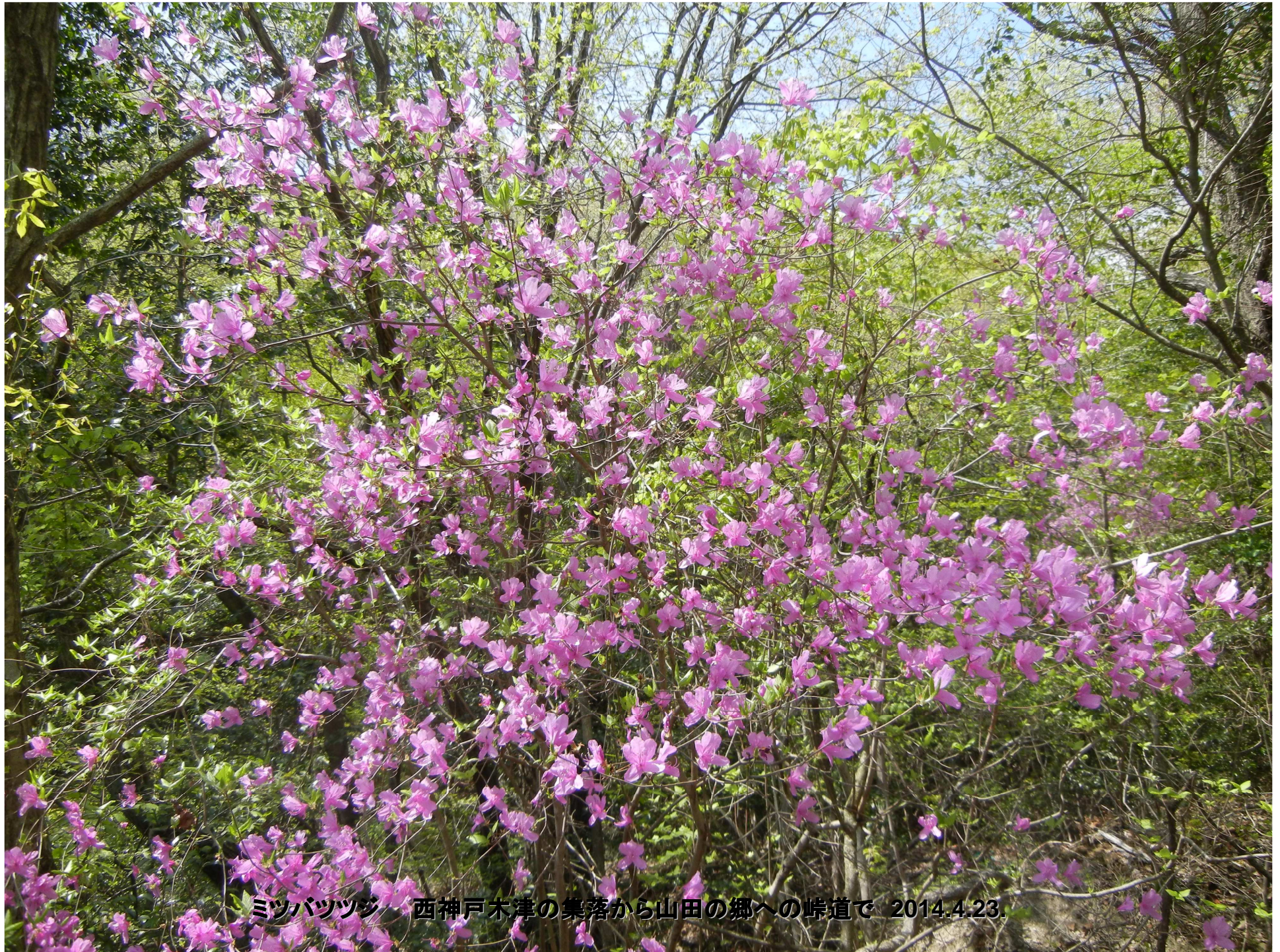
ミツバツツジ 西神戸木津の集落から山田の郷への峠道で 2014.4.23.