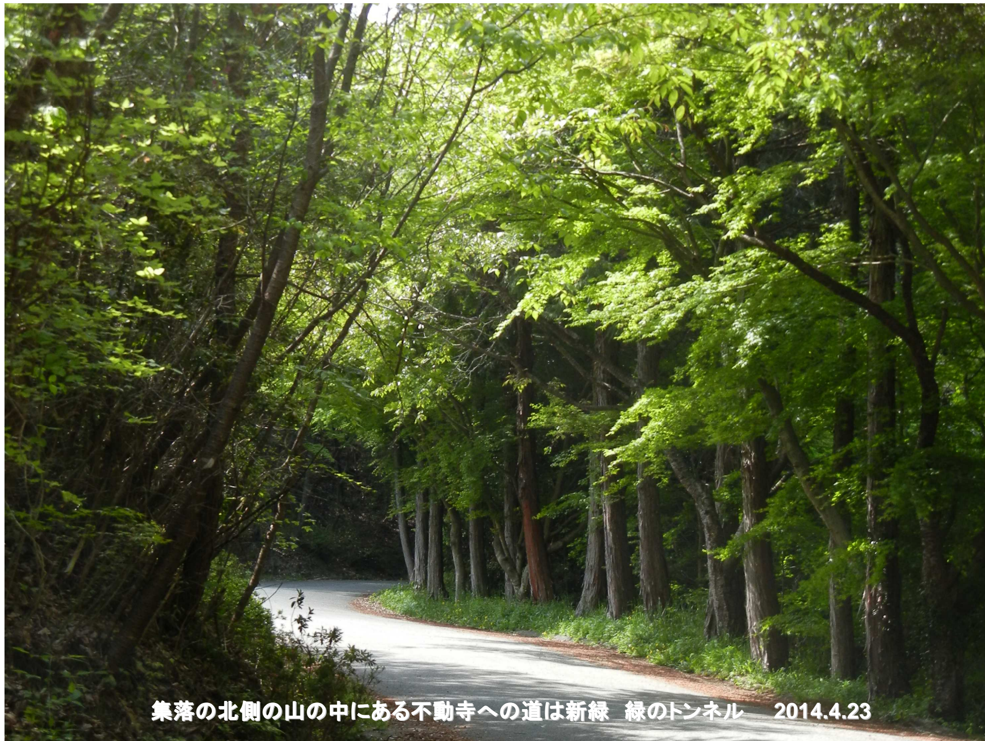
集落の北側の山の中にある不動寺への道は新緑 緑のトンネル 2014.4.23