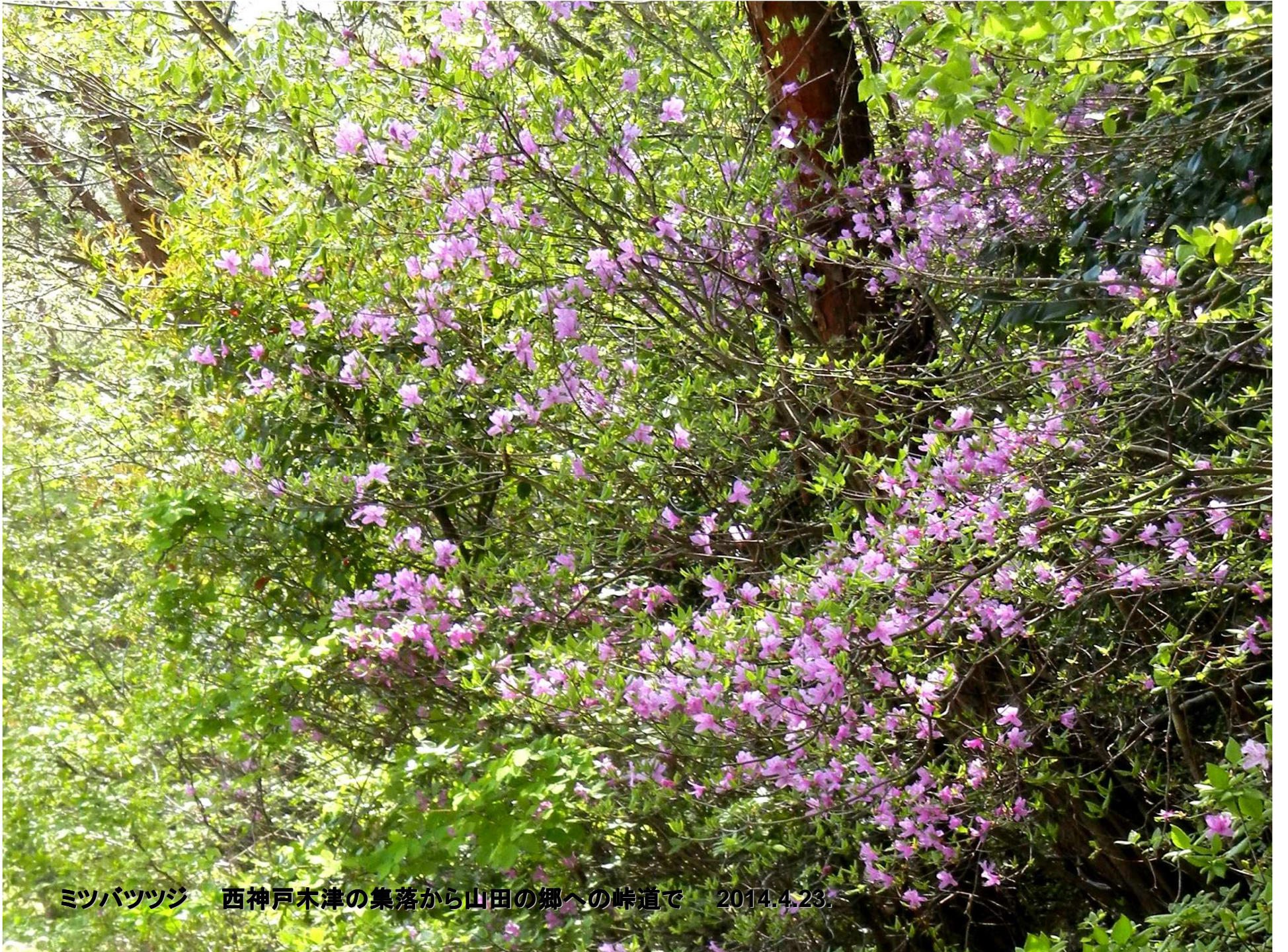
ミツバツツジ 西神戸木津の集落から山田の郷への峠道で 2014.4.23.