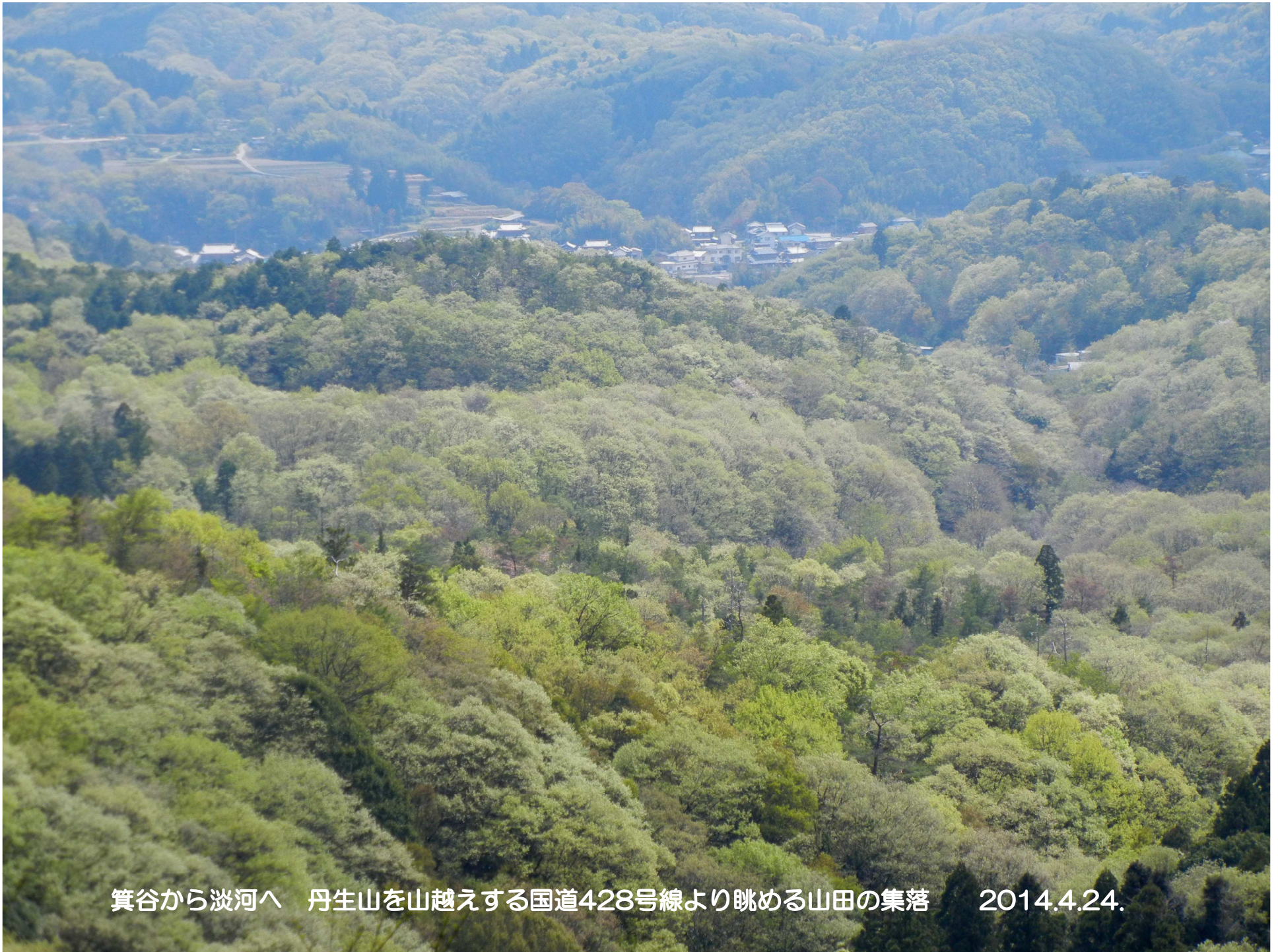
箕谷から淡河へ 丹生山を山越えする国道428号線より眺める山田の集落 2014.4.24.