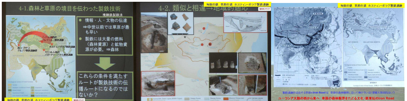
森林と草原の境目を伝った製鉄技術 Iron Road