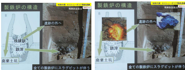
地下製鉄炉の構造