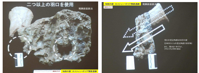
ホスティング・ボラグ遺跡の土製羽口

ウランバートルに近い草原で発見された紀元前1世紀から紀元1世紀の製鉄炉跡で、居住跡などはともなっておらず、また、鍛冶関係の跡もなし。ピットを伴う小型製鉄炉で、羽口も見つかっている。