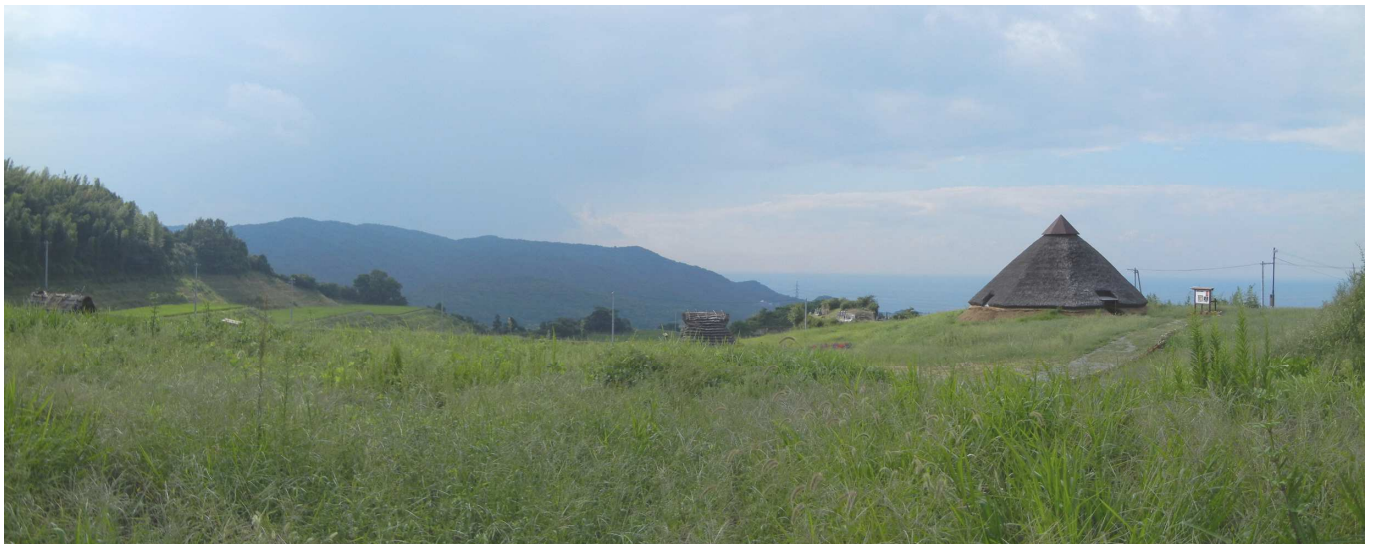
卑弥呼の時代の前夜の1・2世紀 国生みの淡路島で出土した大鍛冶工房村 五斗長垣内遺跡 の 今 2012.9.23.