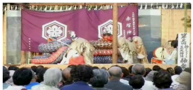
大蛇に奪われた稲田姫を救出すスサノオ