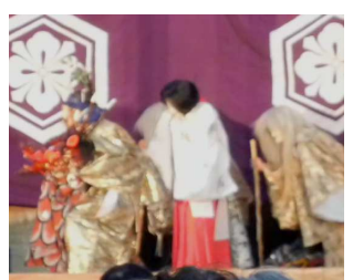
最後の首を取り、大蛇の尾より剣（草薙の剣）を取り出し、神に奉納。 稲田姫を妻にして神楽は終わった