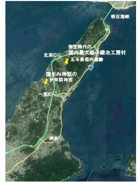
国生み神話の淡路島 伊弉諾神宮 2012. 9. 23.