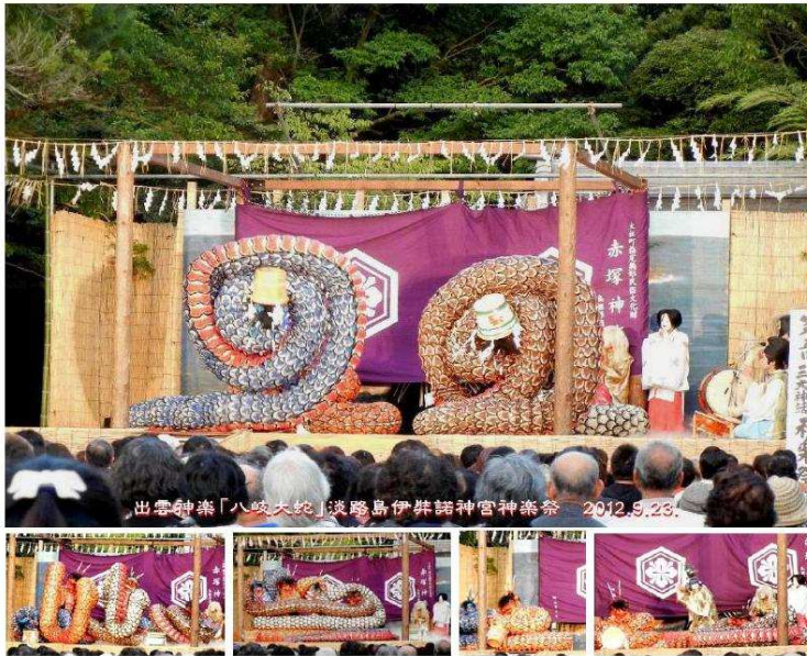
酒を飲み酔いつぶれてゆく八岐の大蛇