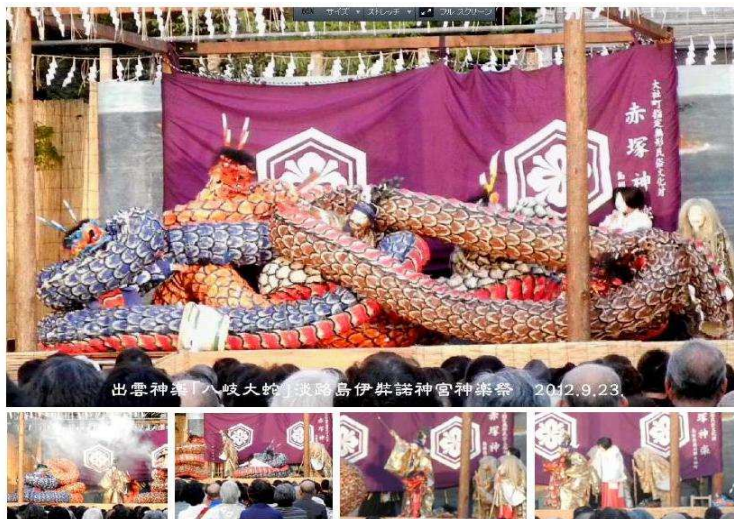
八岐の大蛇に挑むスサノオ 格闘の末 退治する

出雲国の肥河（ひのかわ）の上流にある鳥上（鳥髪山）に下ったスサノオは、乙女を困だ足名椎（あしなつち）と手名椎（てなつち）の老夫婦が泣いている場面に遭遇して事情を聞く。