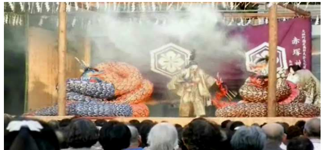
煙を吐き、火を噴いて抵抗する大蛇 格闘の中で、首をひとつひとつ跳ねてゆくスサノオ