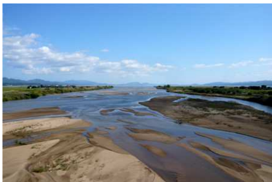
奥出雲を流れ下る斐伊川 砂鉄が河原に