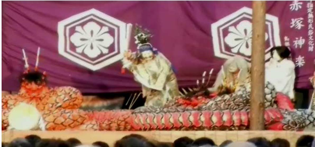
お酒に酔って 眠りこけた八岐の大蛇 スサノオのオロチ退治が始まった