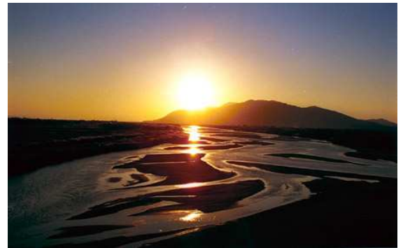
八岐大蛇の象徴 斐伊川