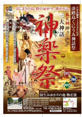
淡路島 伊弉諾神宮 神楽祭 2012. 9. 23.