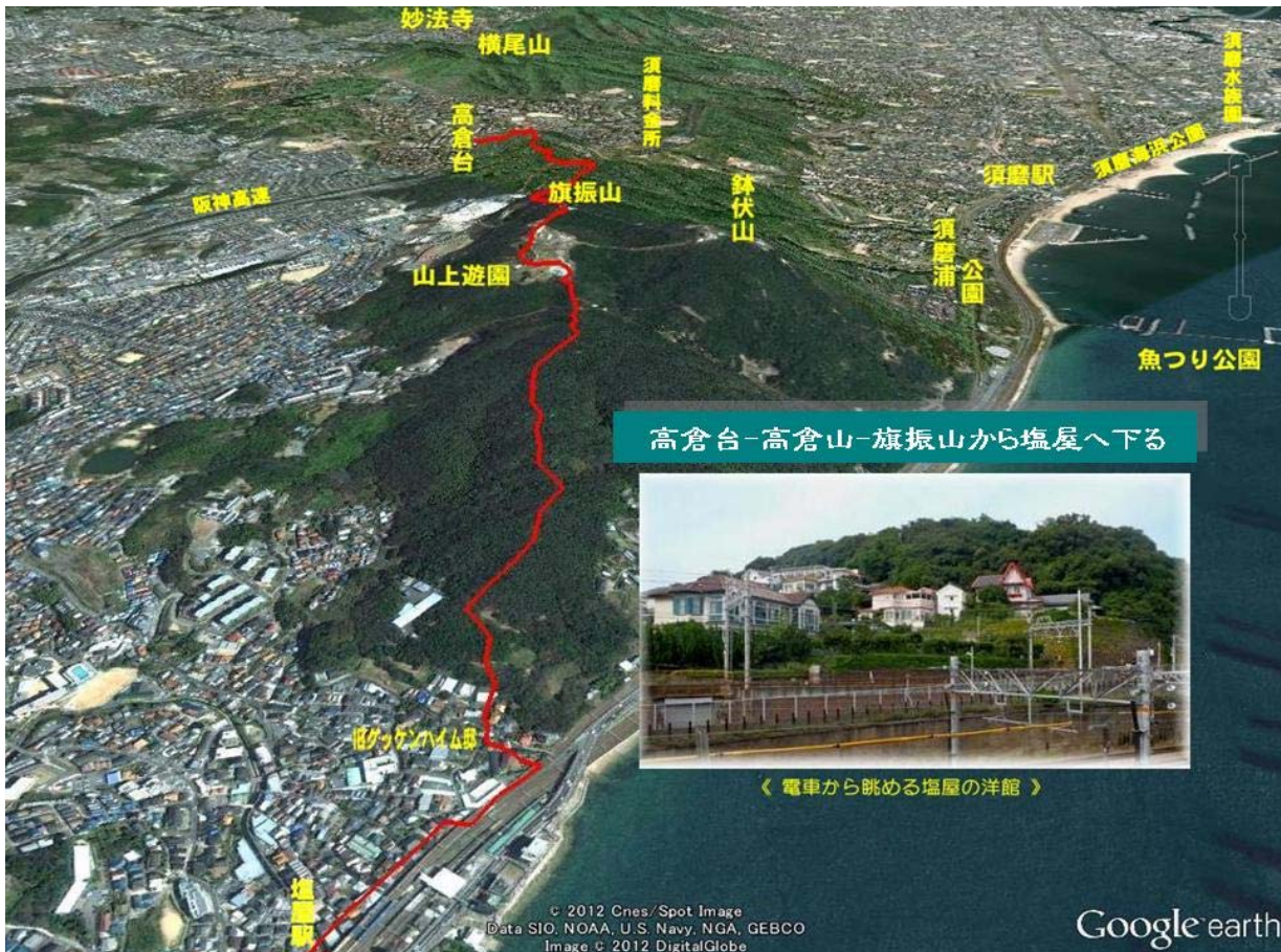
高倉台-高倉山-旗振山から塩屋へ下る